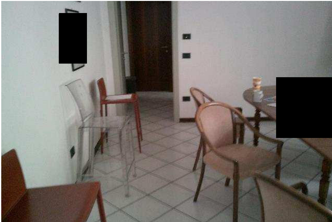
VISTA ABITAZIONE SUB. 36