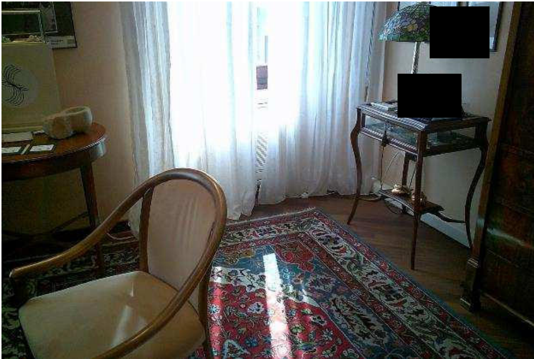
NEGOZIO PIANO PRIMO SUB. 501