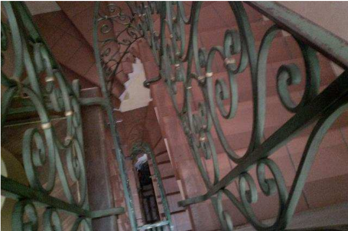
VISTA SCALA INTERNA