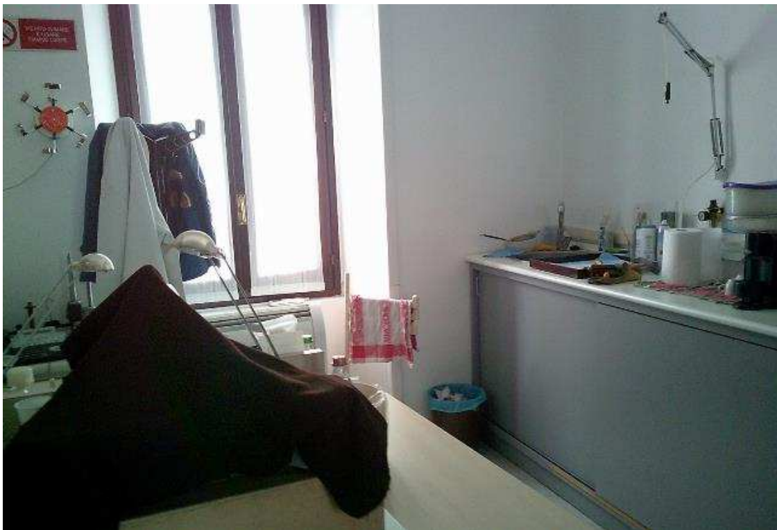
VISTA UFFICIO SUB. 52