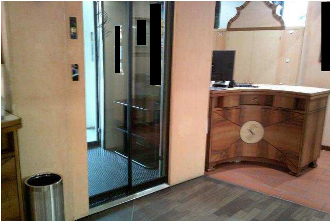
INGRESSO NEGOZIO PT SUB.49