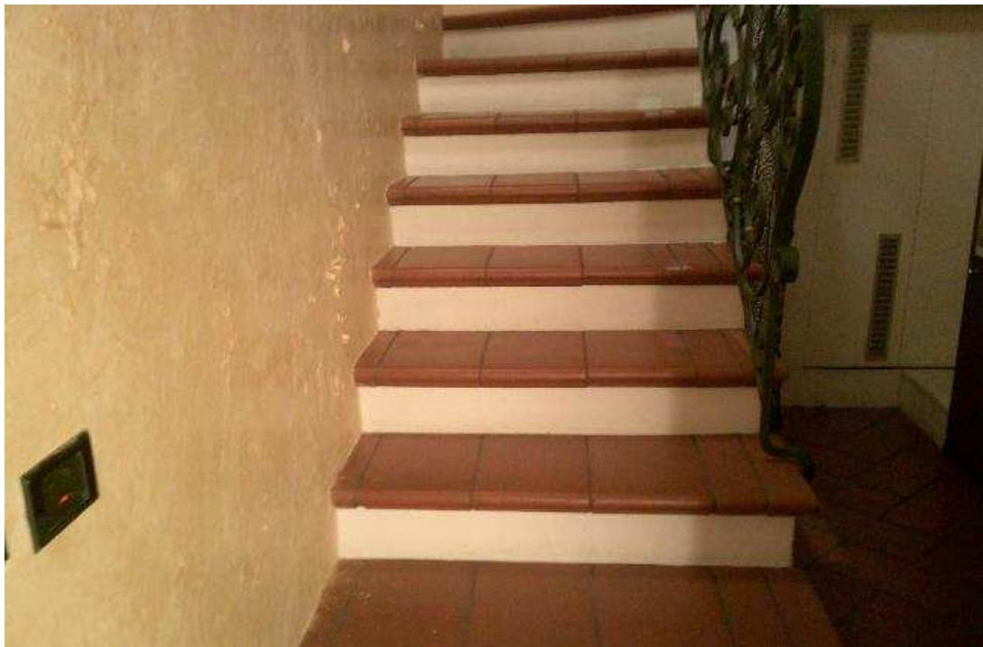
SCALA DI ACCESSO DALLA CANTINA AL NEGOZIO PIANO TERRA