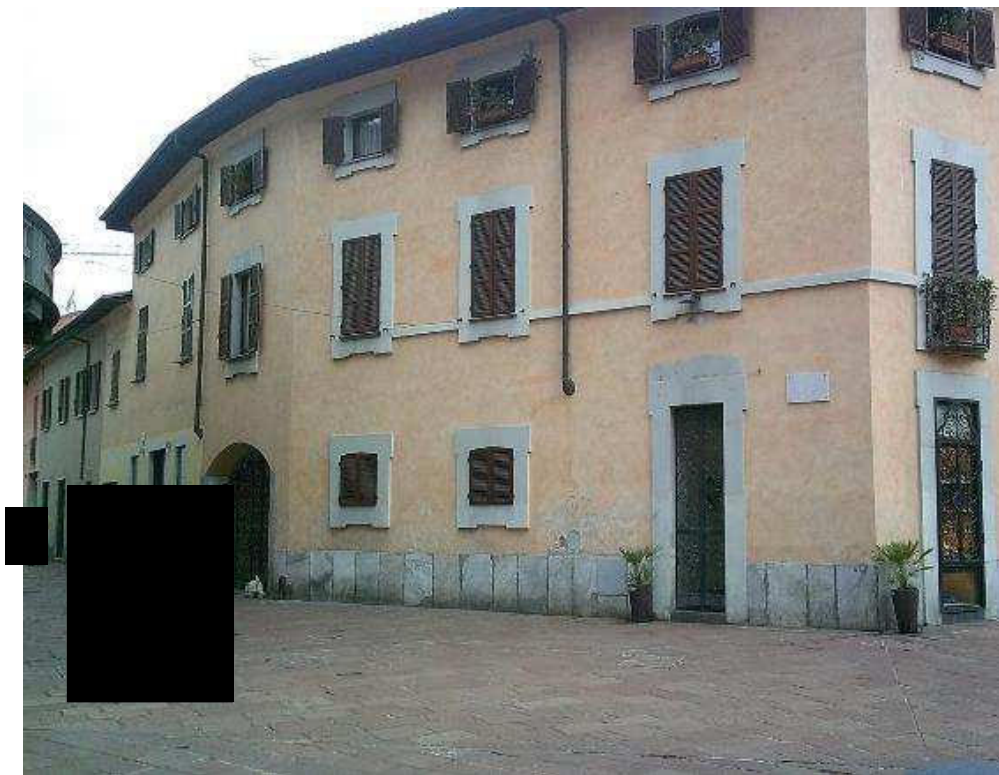
VISTA DA VIA CAVOUR