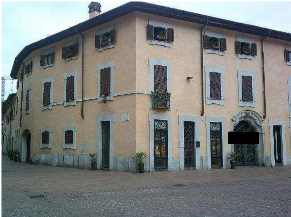
VISTA DA PIAZZA SAN GIOVANNI ANG. VIA CAVOUR