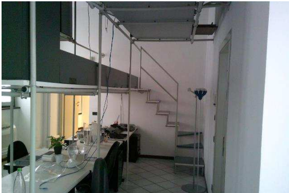
VISTA ABITAZIONE SUB. 36