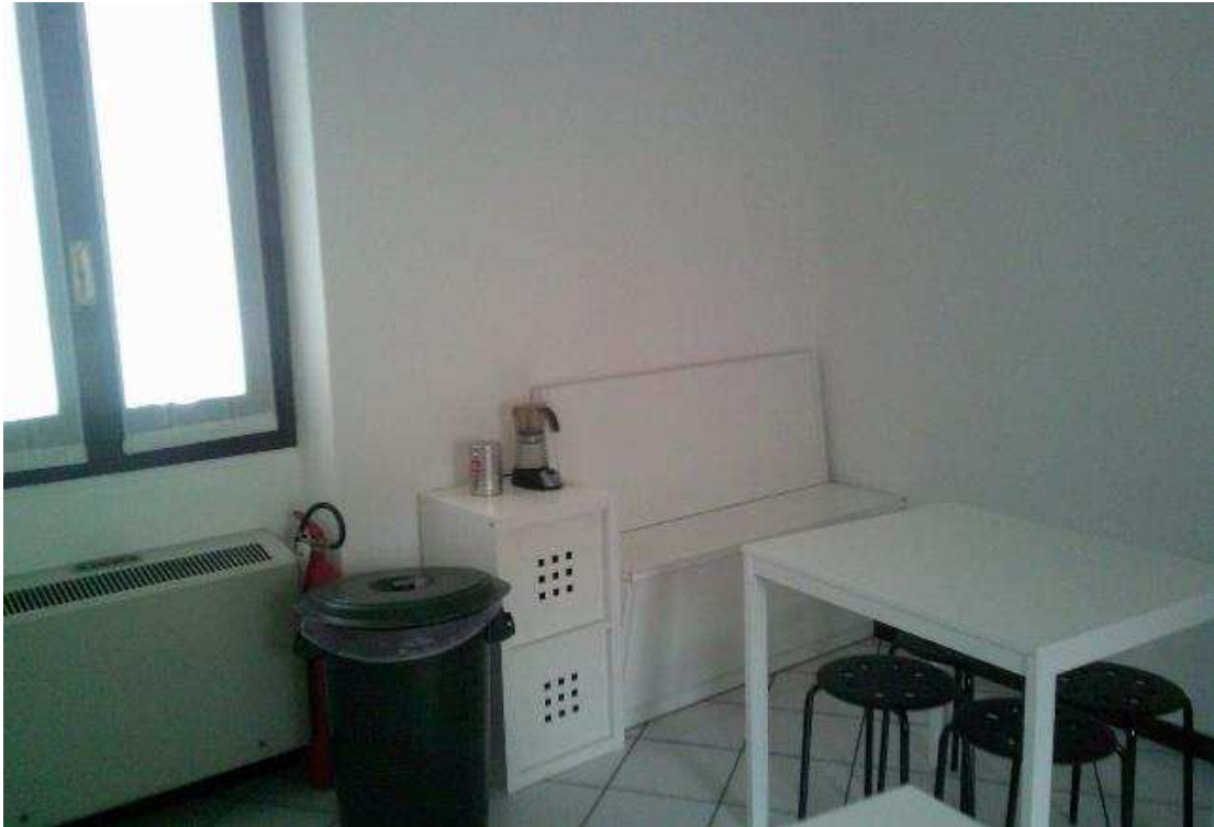
VISTA ABITAZIONE SUB. 36