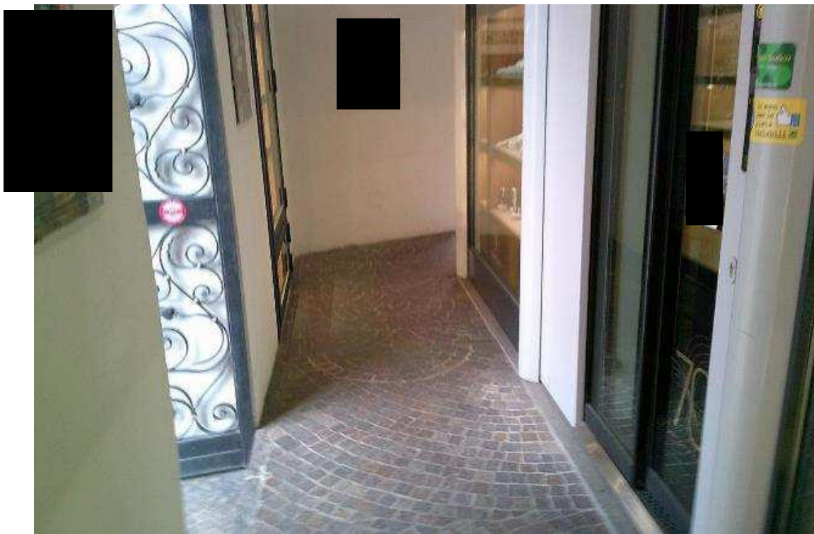
VISTA PORTICO NEGOZIO PT SUB. 49