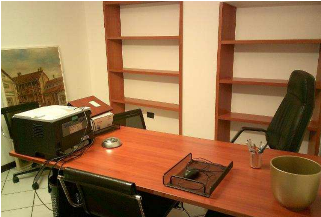
ABITAZIONE SUB. 36