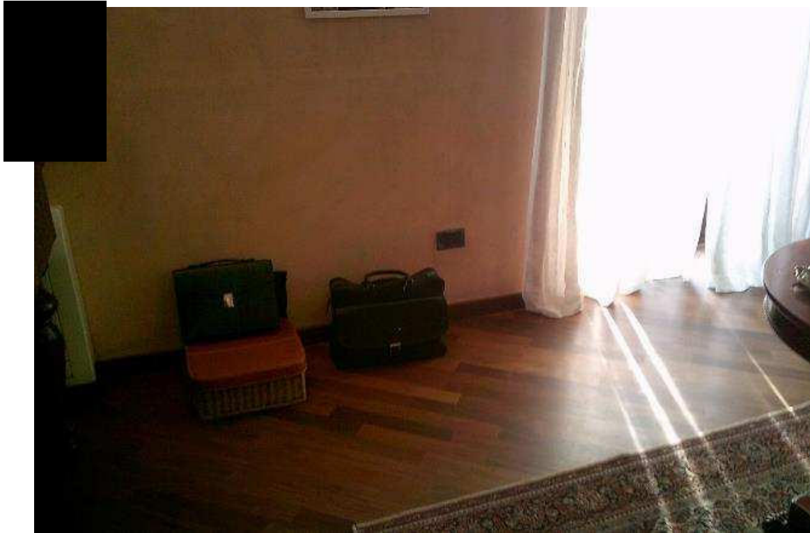
UFFICIO PIANO PRIMO SUB. 502