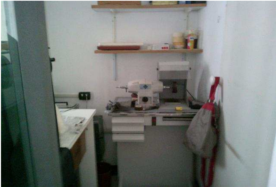
VISTA UFFICIO SUB, 52