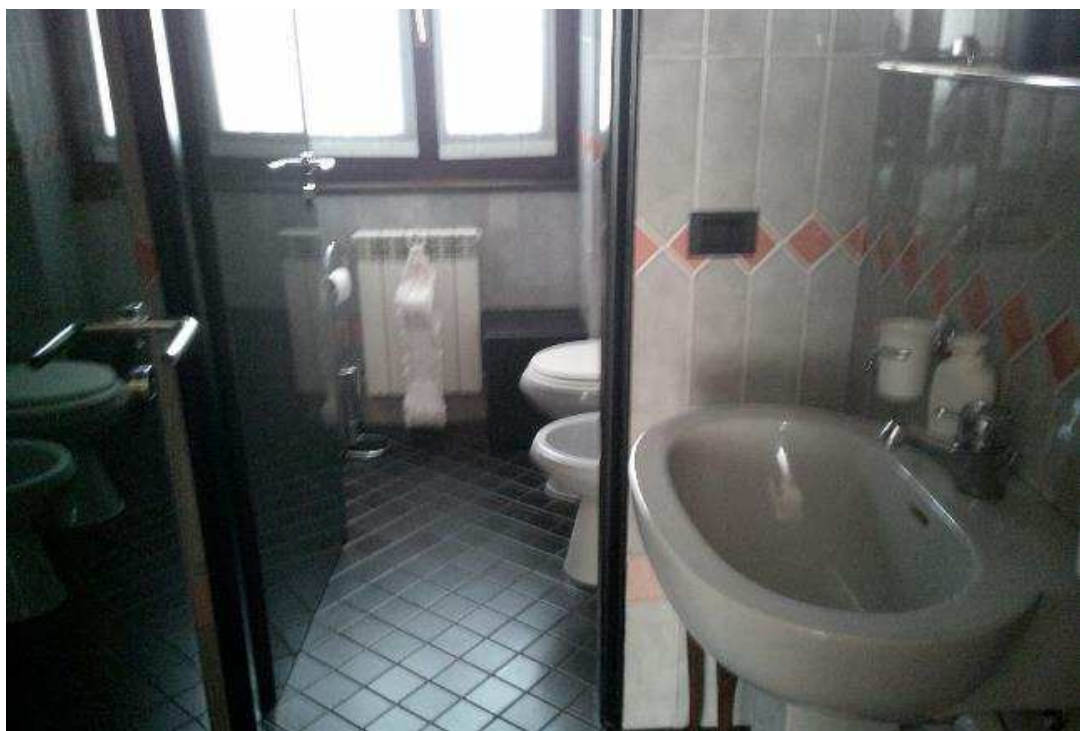
BAGNO UFFICIO SUB. 502