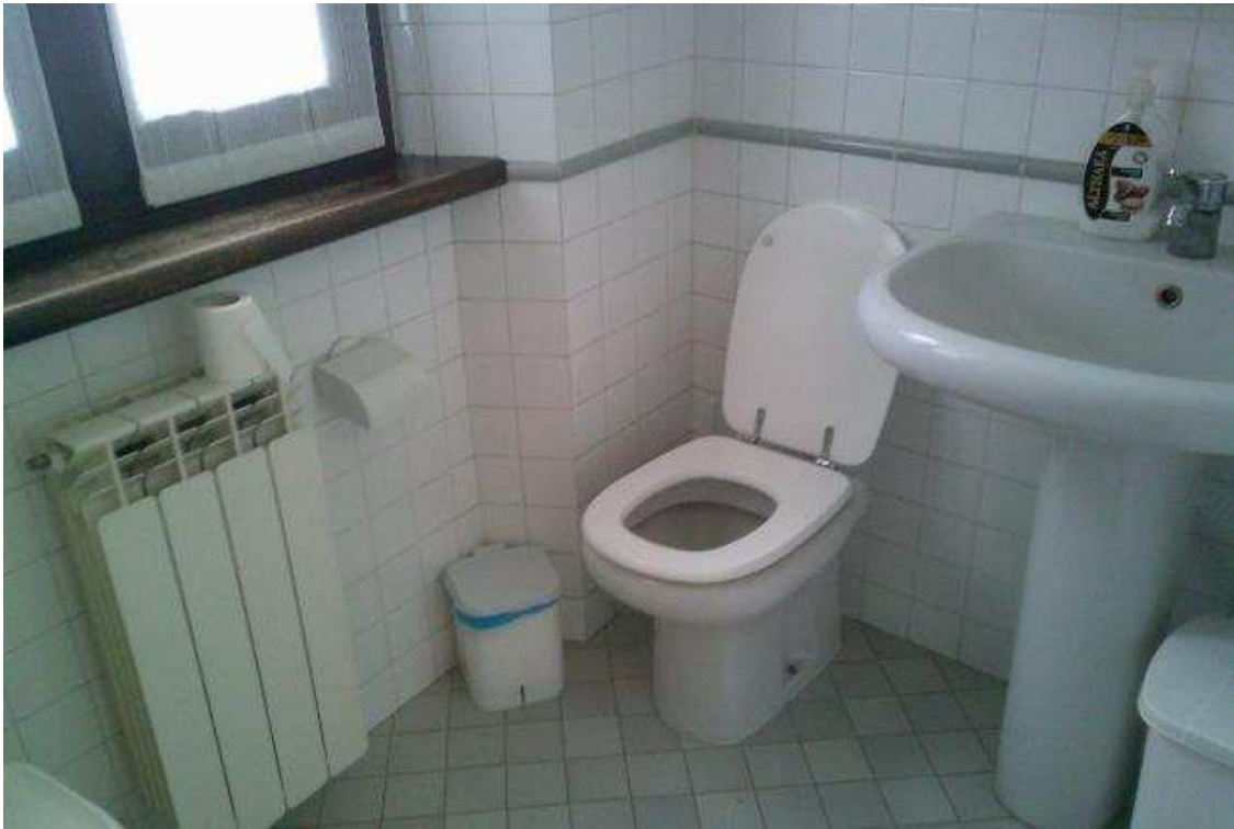
VISTA BAGNO ABITAZIONE SUB. 36