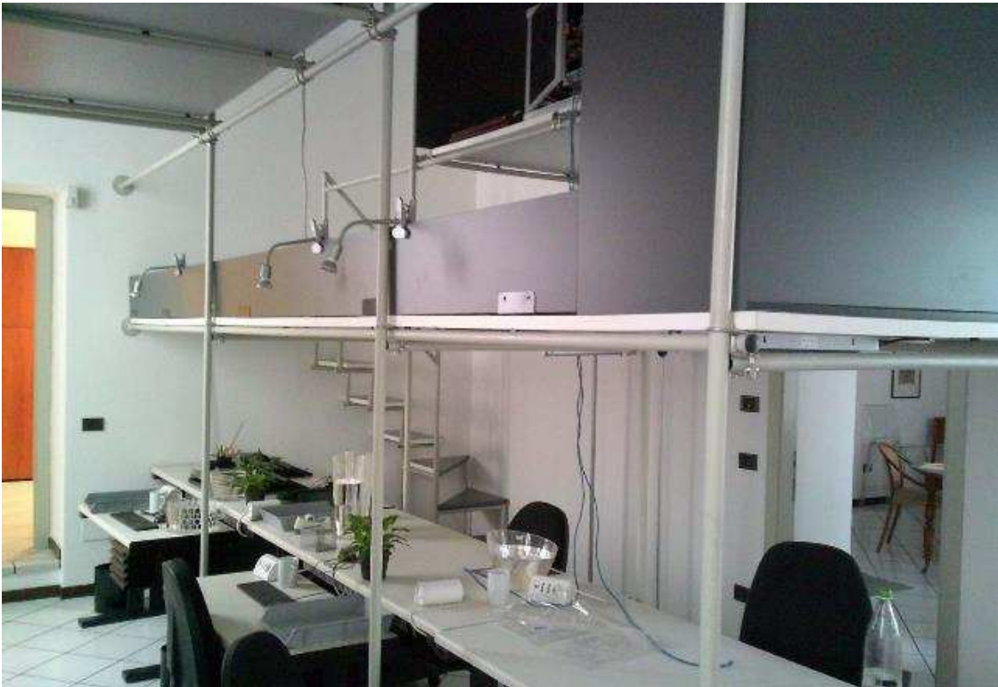
VISTA ABITAZIONE SUB. 36