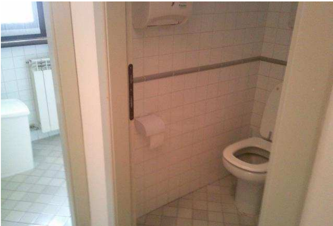
VISTA BAGNO SUB. 36