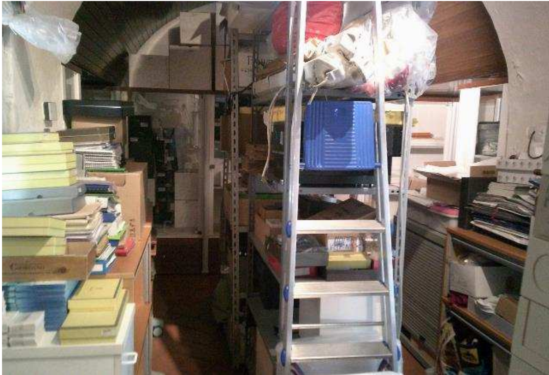
VISTA NEGOZIO INTERRATO SUB. 503