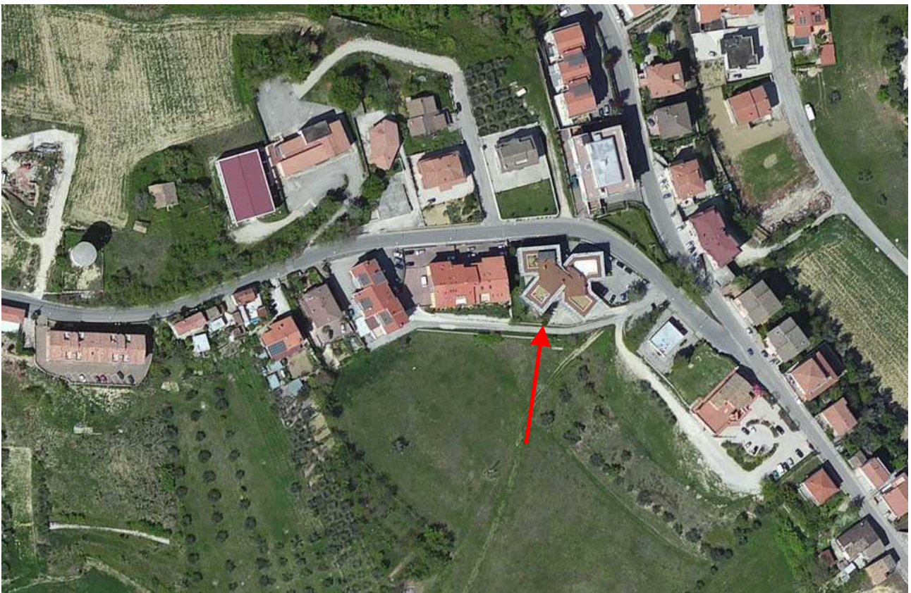
Foto n° 2: Vista aerea ed individuazione della zona su cui insiste la particella di terreno urbano oggetto di stima