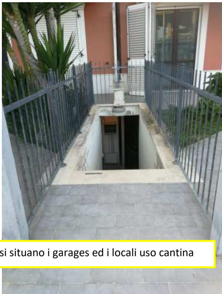
Accesso pedonale comune, al Piano S1 ove si situano i garages ed i locali uso cantina