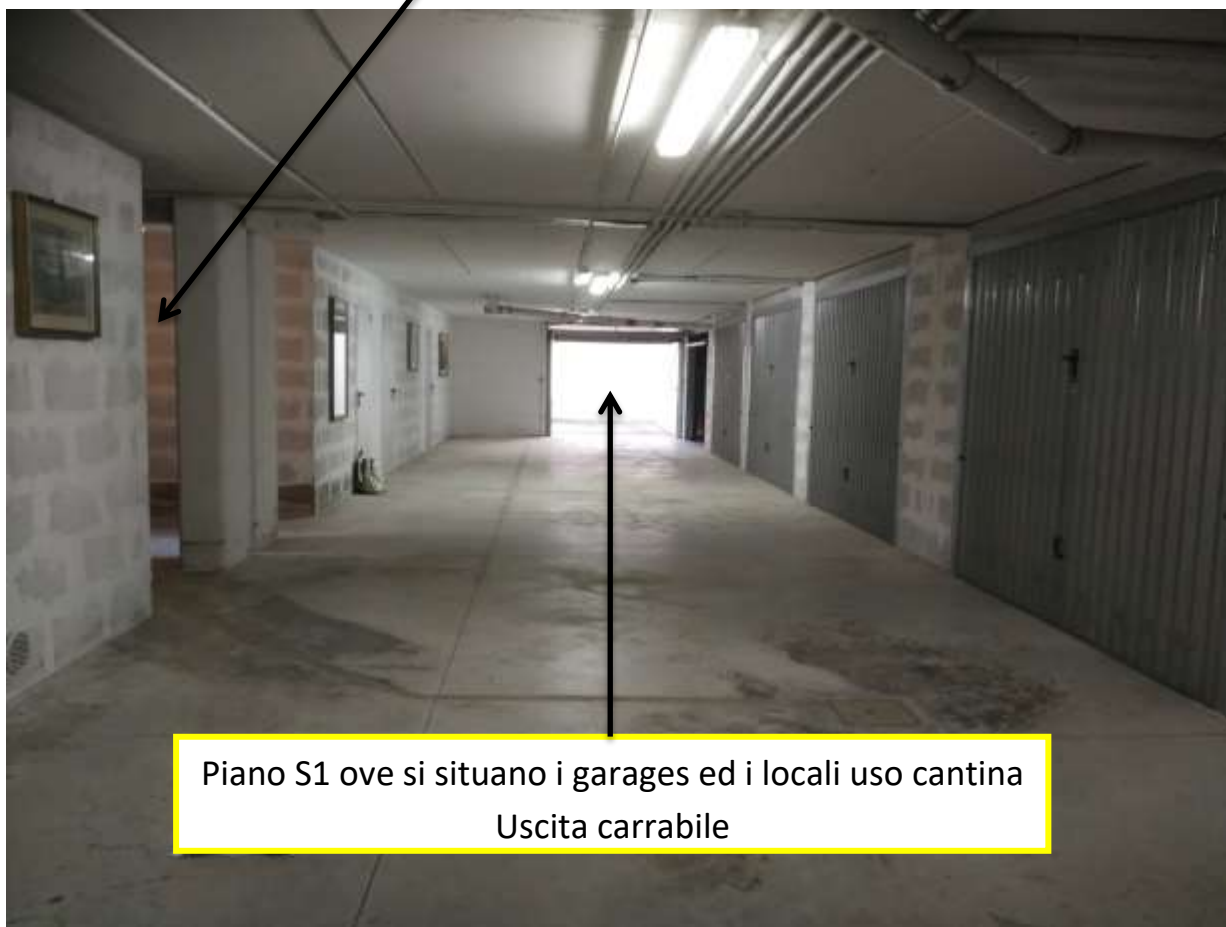
Piano S1 ove si situano i garages ed i locali uso cantina Uscita carrabile