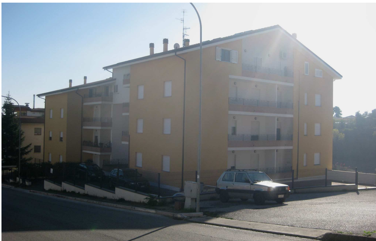
Foto n° 4: Vista dei fronti nord ed ovest del fabbricato su cui insistono gli immobili oggetto di stima