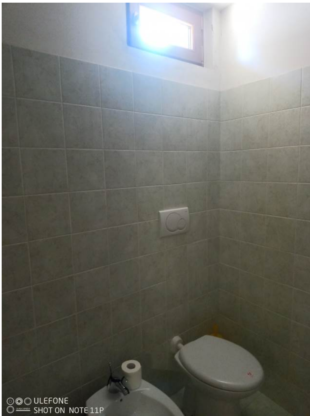
Foto 16 – Bagno PSI (realizzato in difformità al posto del terrapieno)