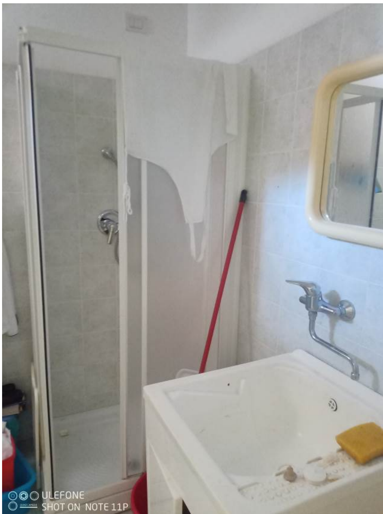
Foto 15 – Bagno PS1 (realizzato in difformità al posto del terrapieno)