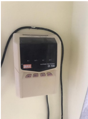
n.1 orologio timbra cartellino