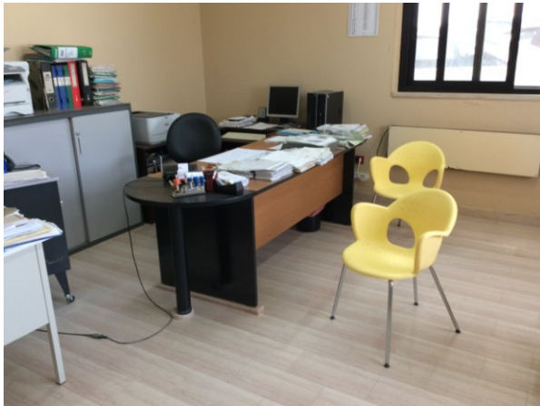
n.2 poltroncini acciaio e plastica gialle; n.1 scrivania ad "L" ; n.1 poltrona in simil pelle ;