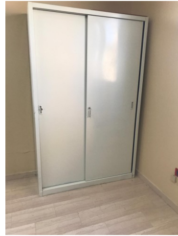
n.2 armadi lamiera di acciaio pressopiegata, con due ante scorrevoli