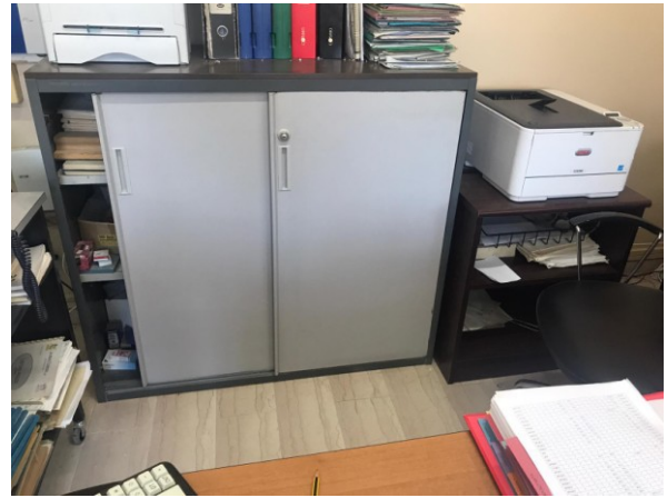
n.1 mobile a due ante scorrevoli;