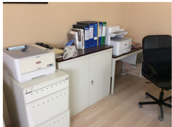
n. 1 schedario in acciaio; n. 1 mobile basso; n.1tavolino;