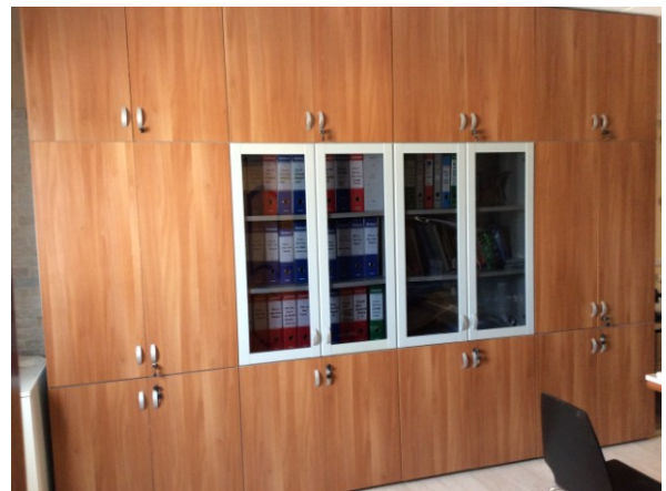
Mobile/armadio con 24 ante