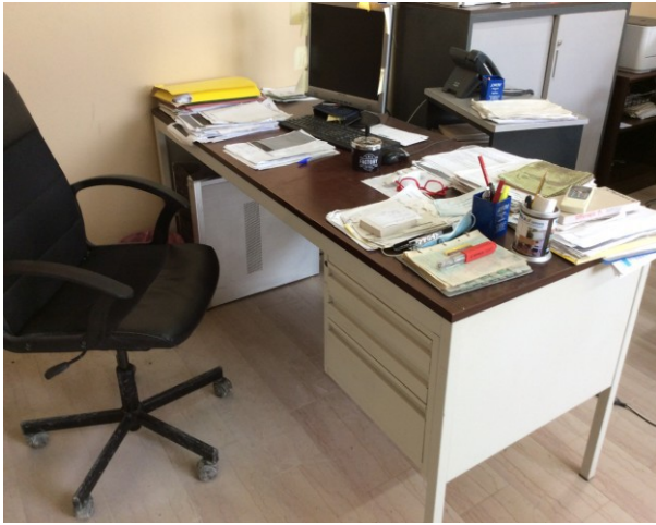
n.1 tavolo rettangolare in metallo con ripiano in legno