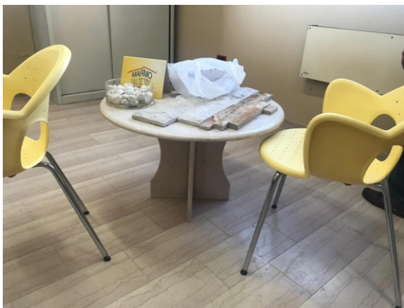
n.1 tavolino tondo in marmo