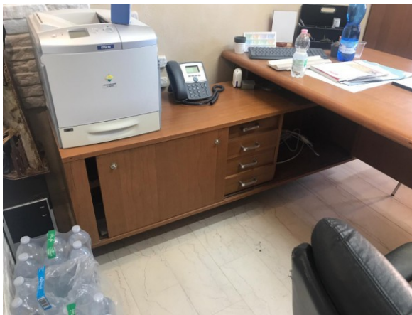
Mobile sottoincasso elemento della scrivania direzionale