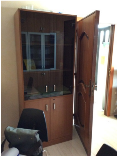
n.1 libreria a quattro ante, di cui due in vetro