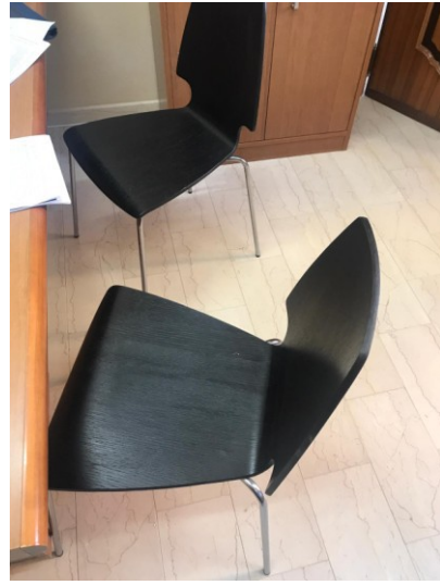
n.2 sedie in legno e acciaio e poltrona;