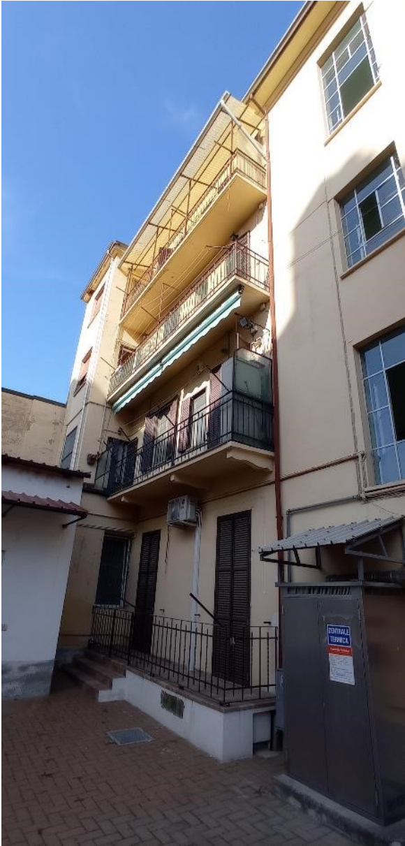
3. Prospetto interno cortile