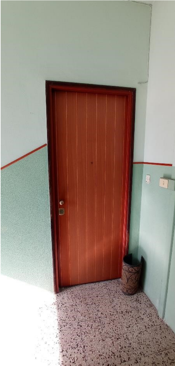
9. Ingresso abitazione