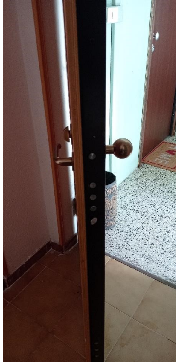
10. Dettaglio portoncino di ingresso