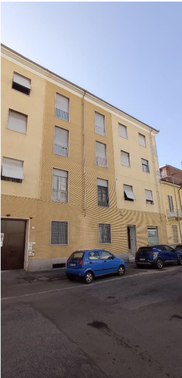
2. Prospetto su Via Manzoni