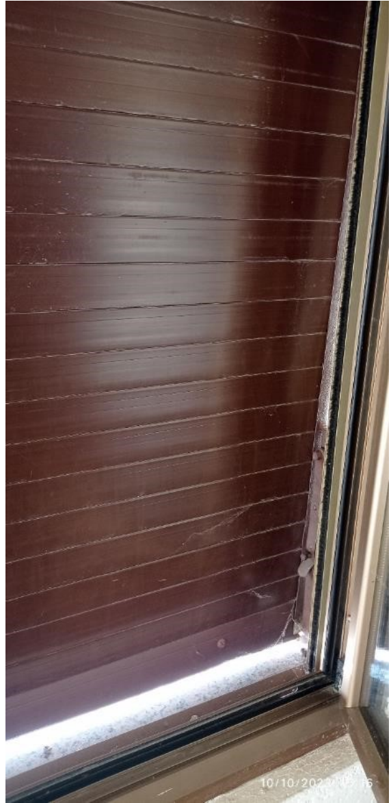
25. Dettaglio tapparelle