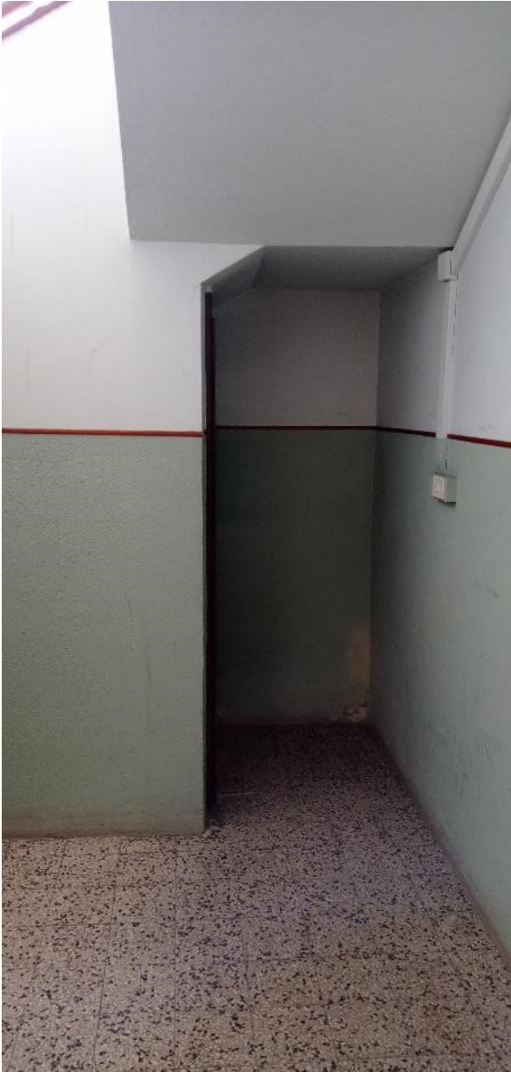
7. Accesso al piano cantine