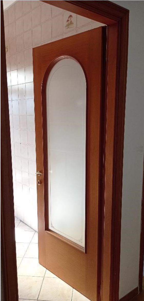
13. Porte interne