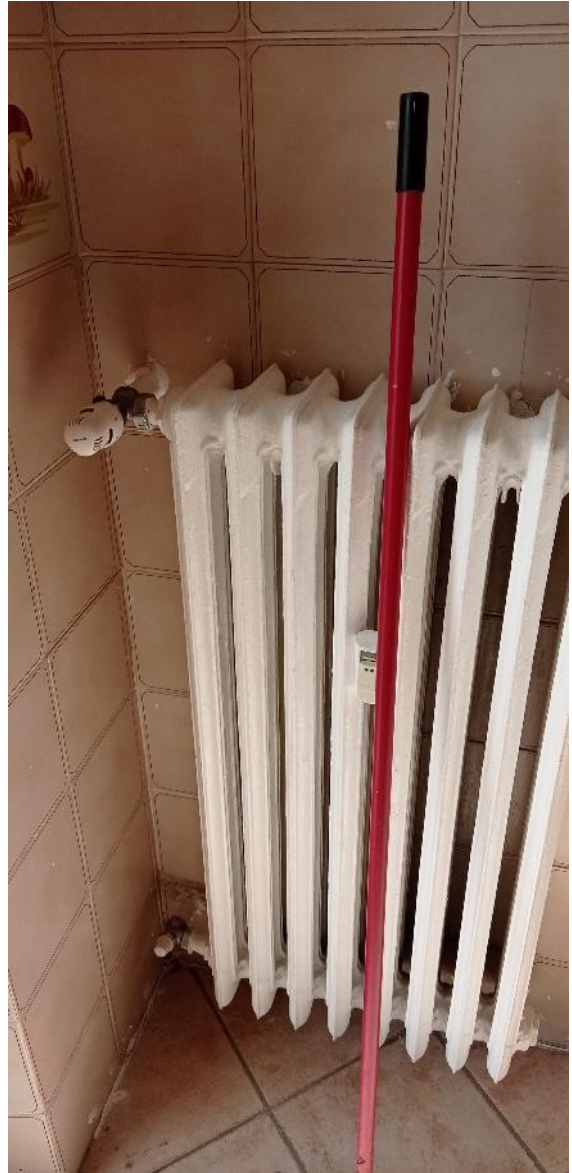
17. Dettaglio radiatore