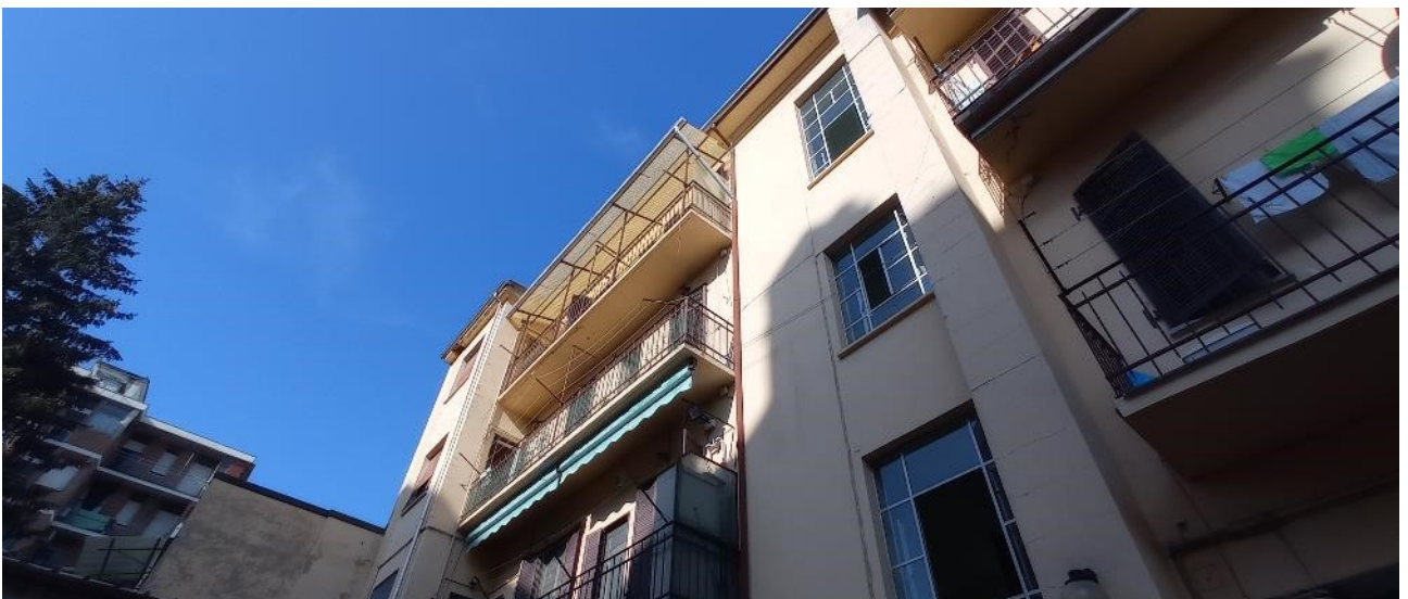
4. Prospetto interno cortile