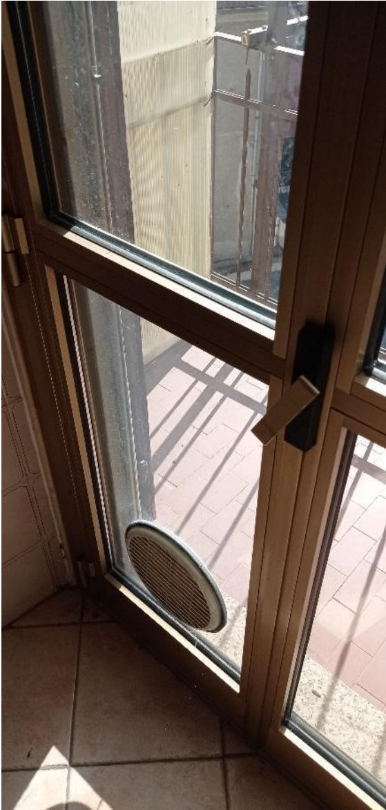
16. Dettaglio serramento cucina