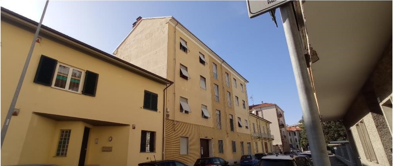
1. Prospetto su Via Manzoni