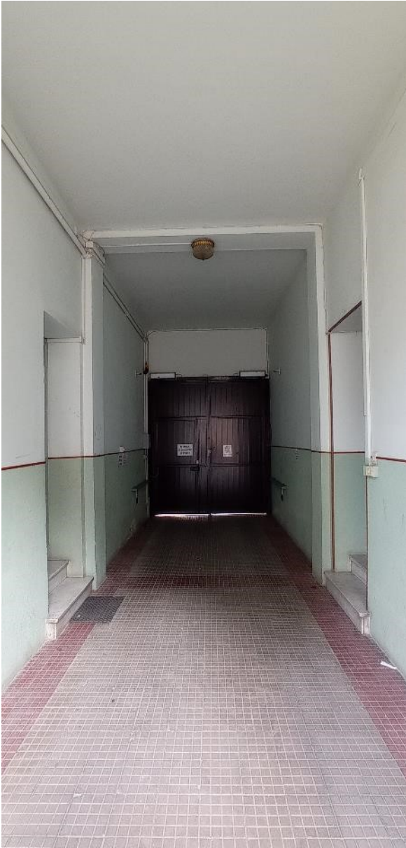
5. Androne accesso principale al fabbricato