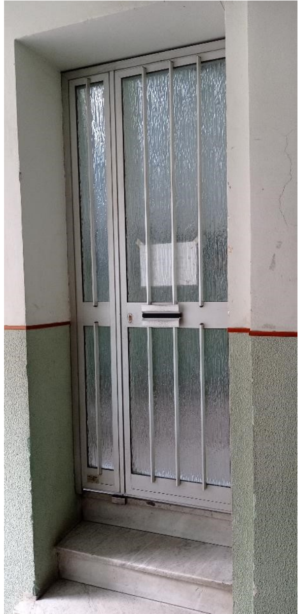
6. Portoncino di ingresso al vano scala