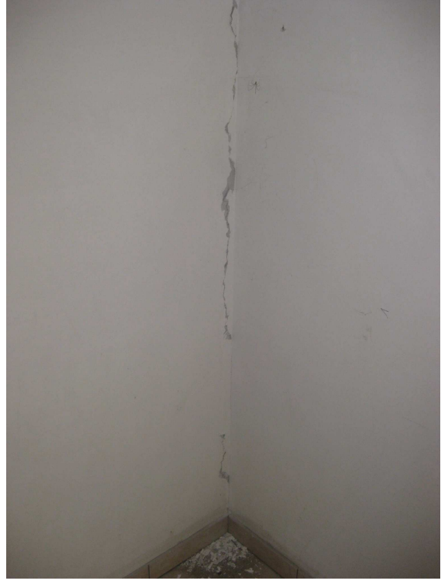
Foto n° 13 e n° 14: Vista di una camera e di una lesione presente all'interno di tale unità immobiliare