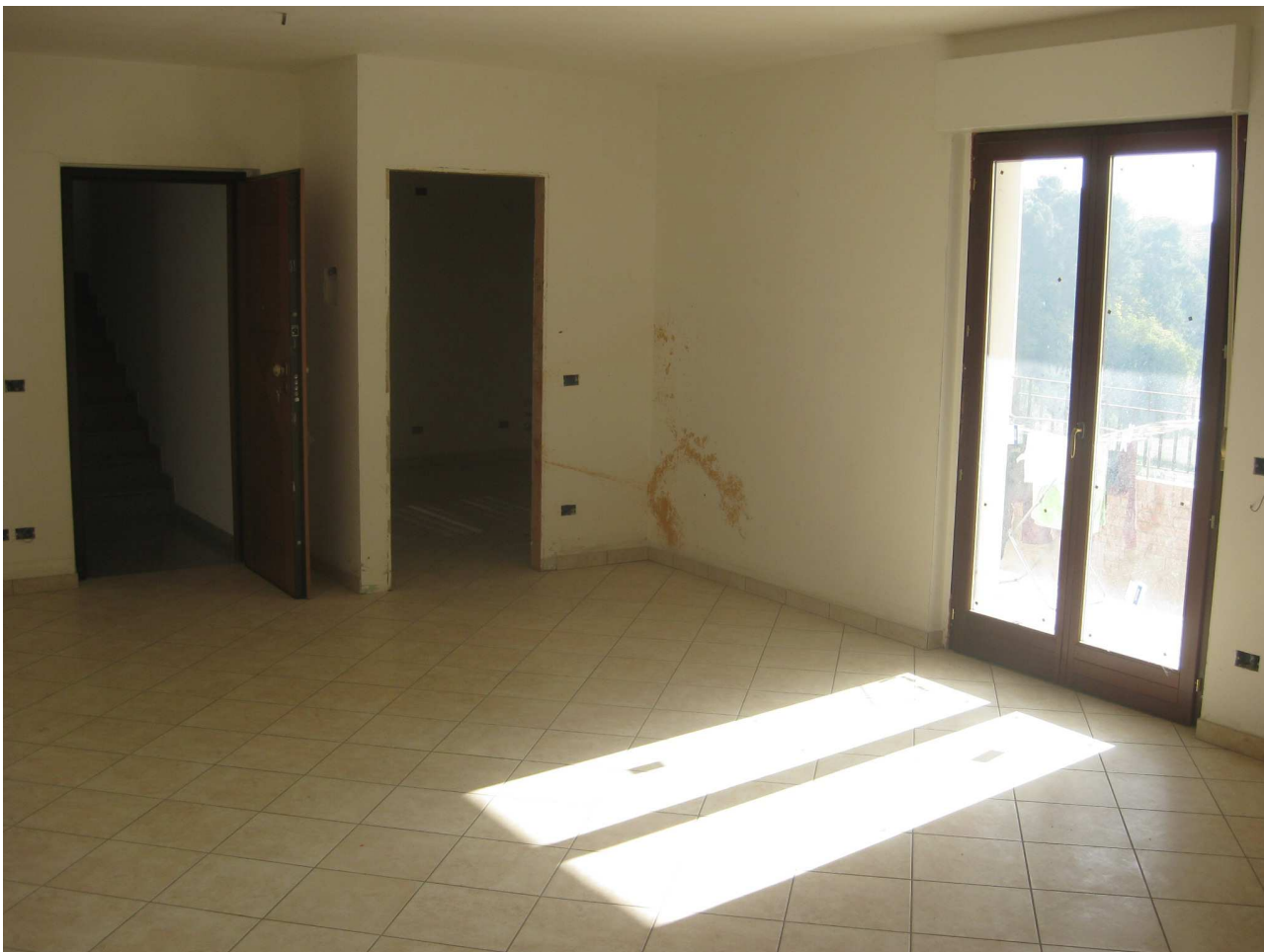
Foto n° 8 : Vista interna del locale destinato a soggiorno – pranzo