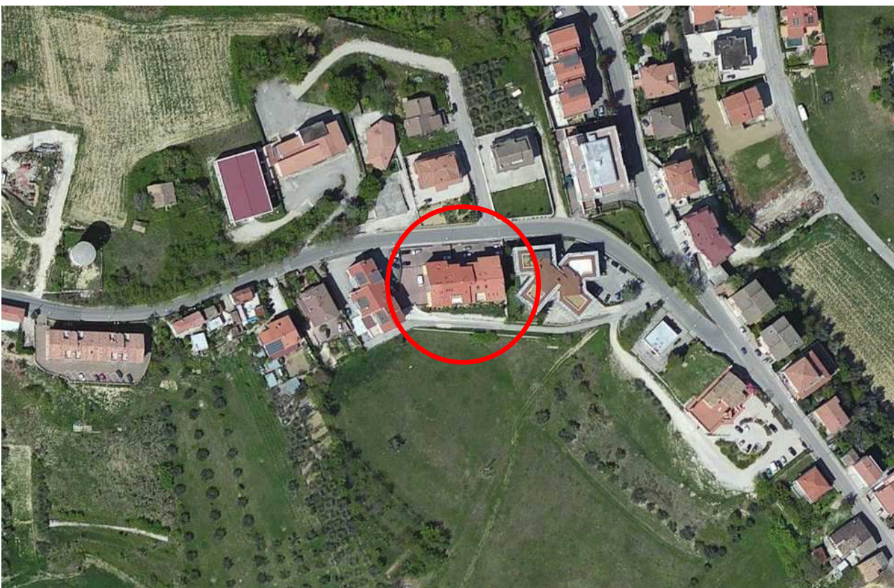
Foto n° 2: Vista aerea ed individuazione del fabbricato su cui insistono le unità immobiliari oggetto di stima