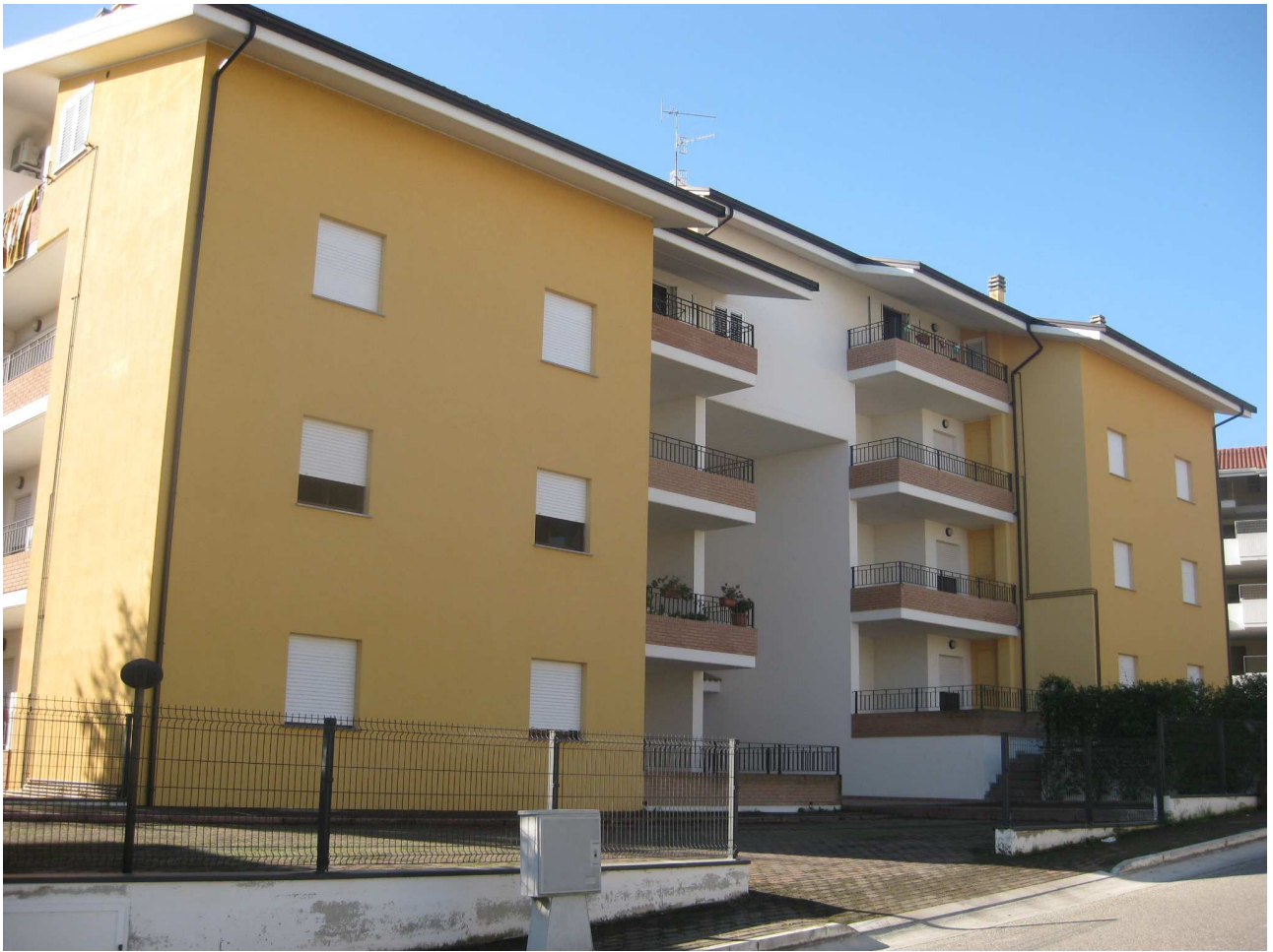
Foto n° 3: Vista del fronte nord del fabbricato su cui insistono gli immobili oggetto di stima