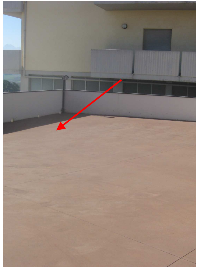
Foto n° 15 e n° 16: Vista di un balcone e dello spazio esterno dove è individuato il posto auto scoperto