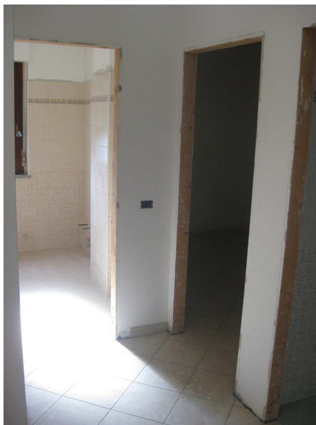
Foto n° 6 e n° 7: Viste interne del portone di accesso e del disimpegno notte dell'appartamento individuato con il subalterno 9