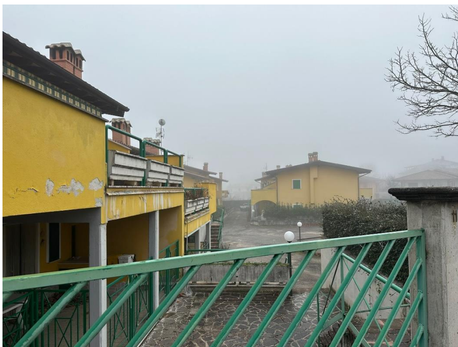
Foto n.2 – Vista dell'immobile da Via Stazione – accesso pedonale