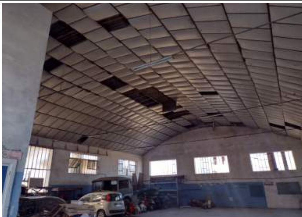
Interno ufficio part contro-soffitto in fibra probabilmente amianto