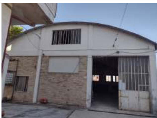
Prospetto est fabbricato rimessa mezzi