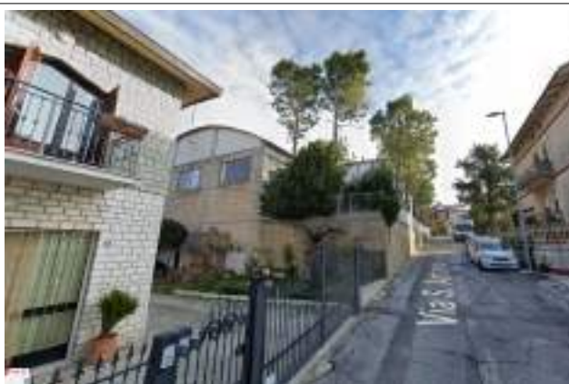
Viabilità pubblica prospetto ovest