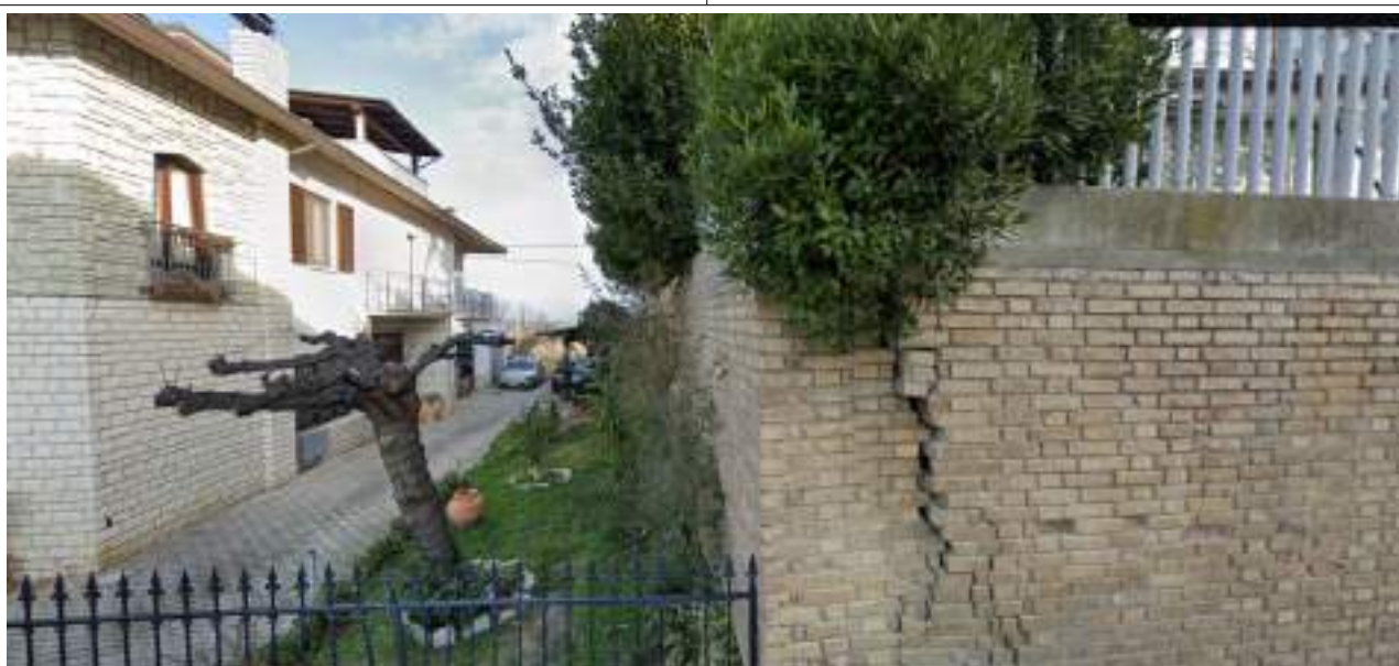
Part. Confine ovest angolo lesionato con viabilità pubblica