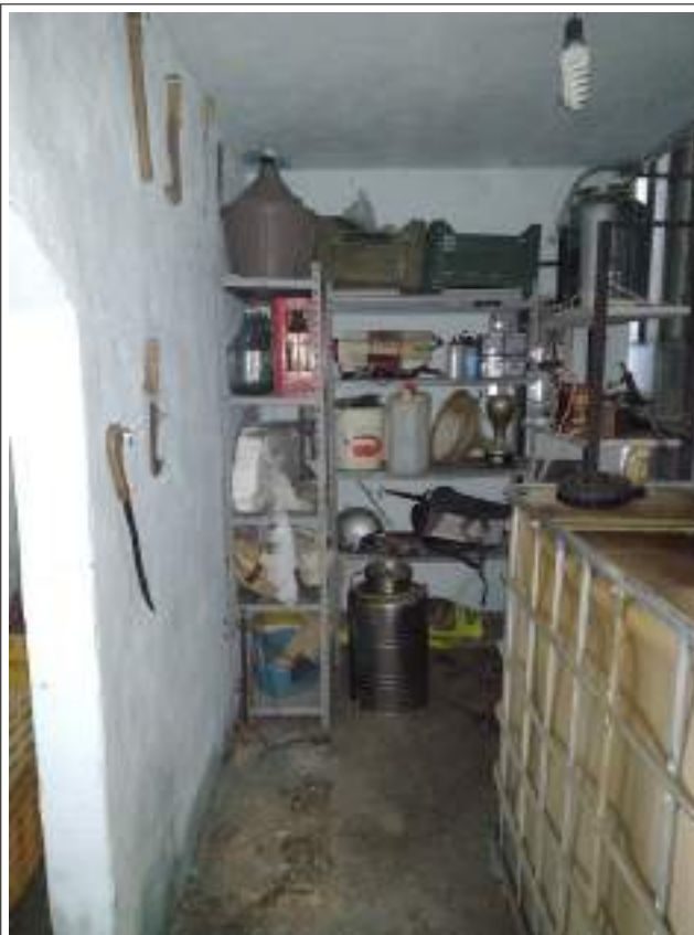
Interno piano terra locali tecnici