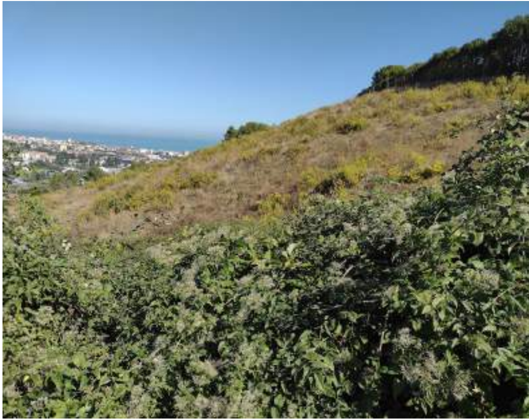
Vista panoramica verso litorale