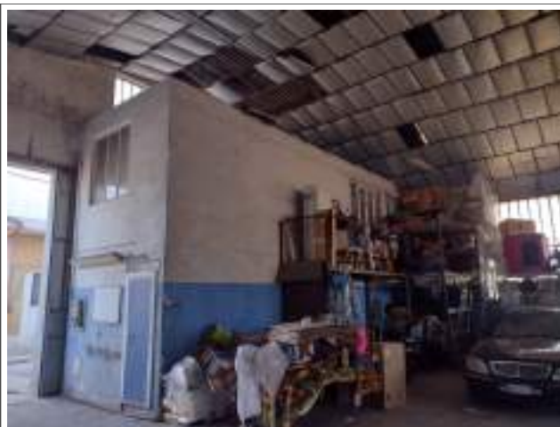
Interno part. Volume doppio livello