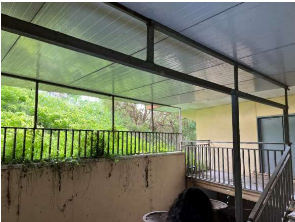
Dettaglio della Tettoia esistente priva di titolo e non sanabile