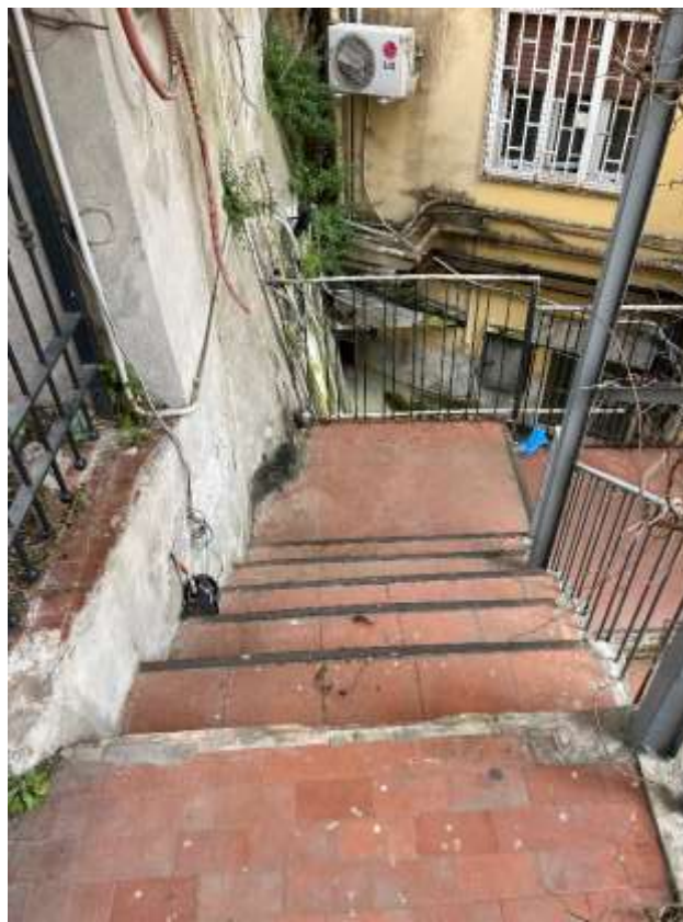
Vista da via M. Ruta dell'area pertinenziale ingresso principale