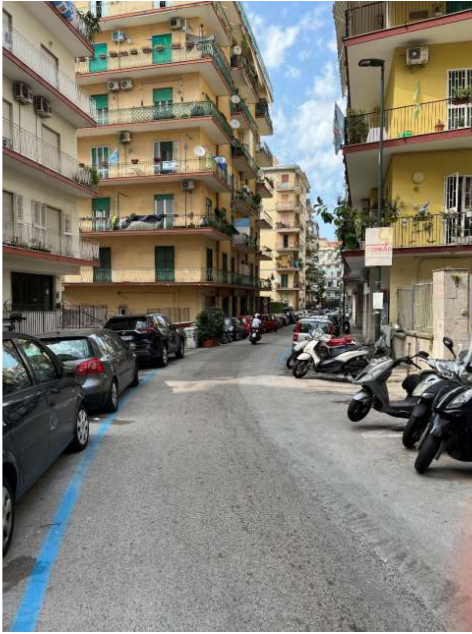
Via M. Ruta direttrice senso unico da via Luigi Caldieri