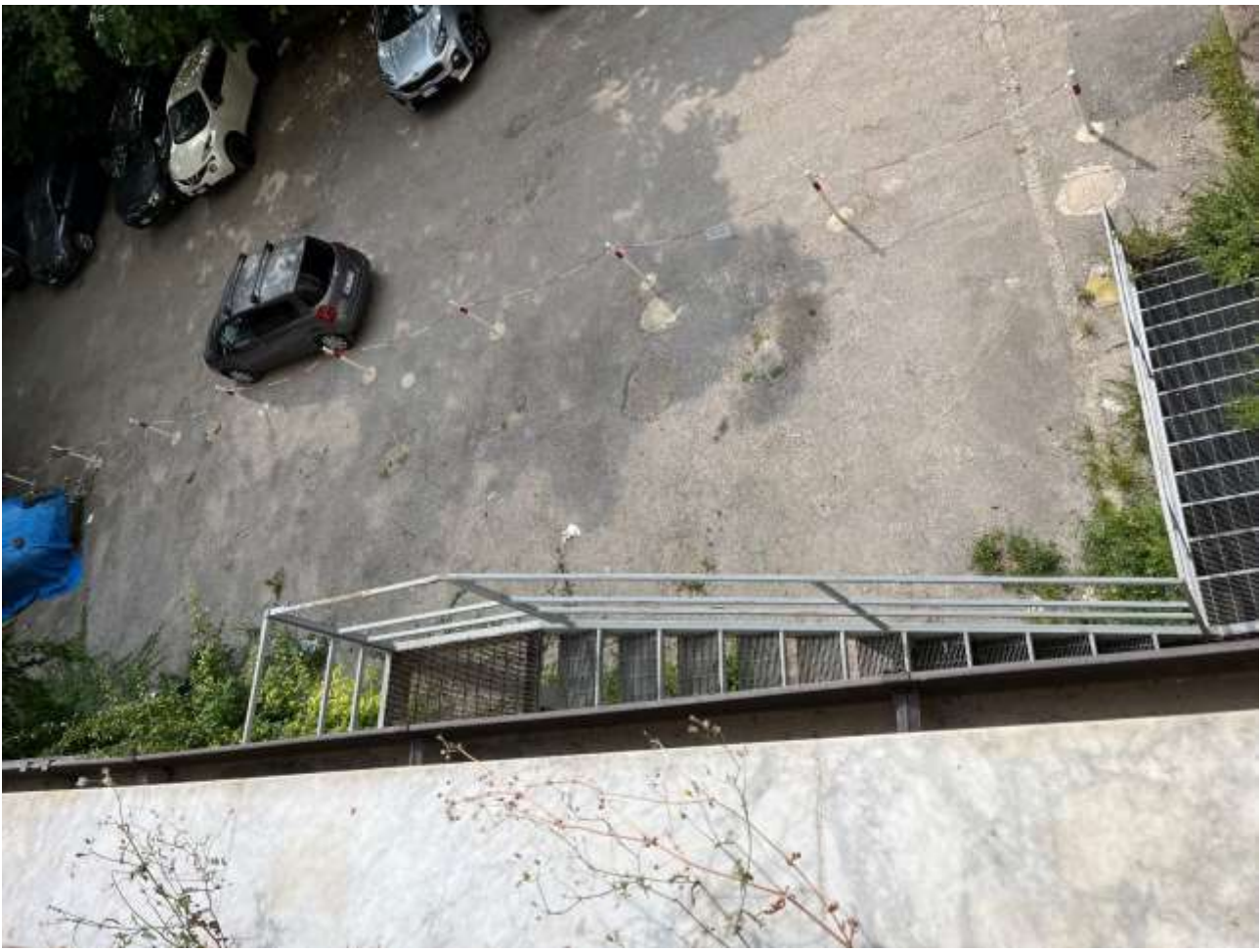
Vista dall'area a valle – Cavone Case Puntellate