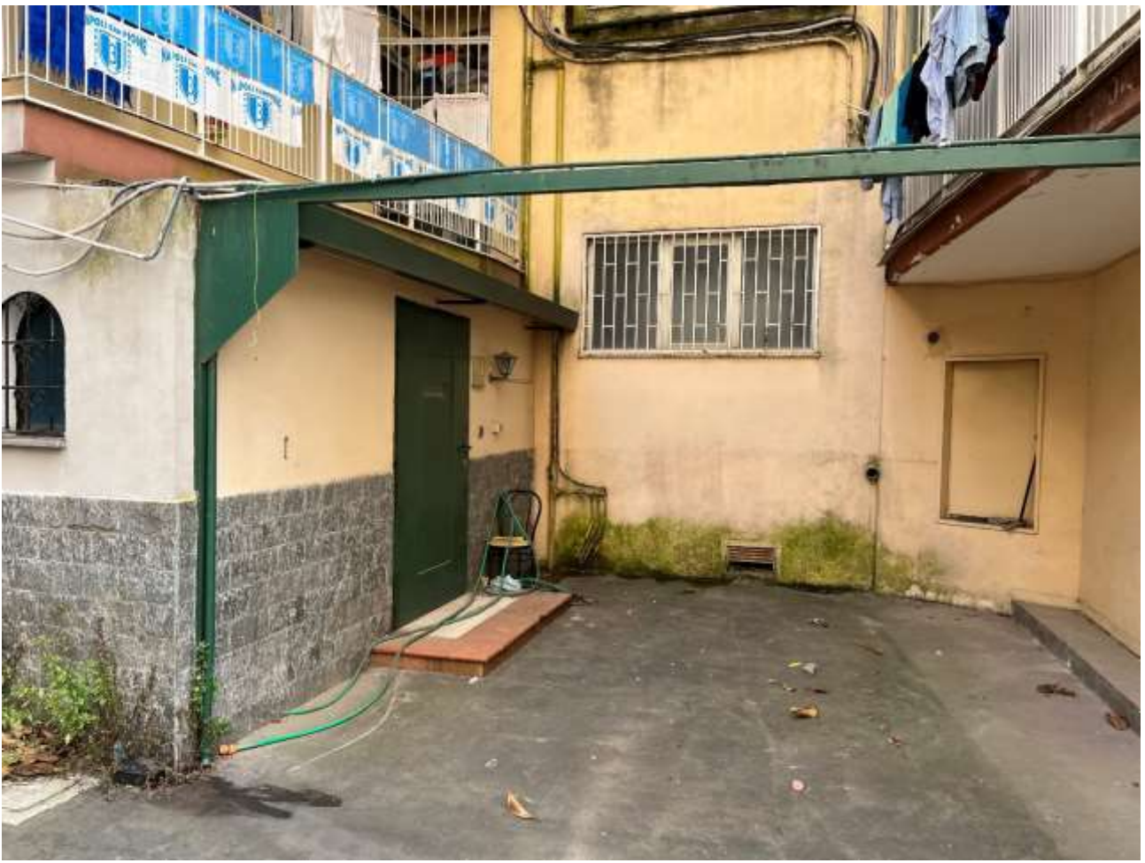
Dettaglio dell'ingresso di accesso – difformità rispetto al titolo edilizio