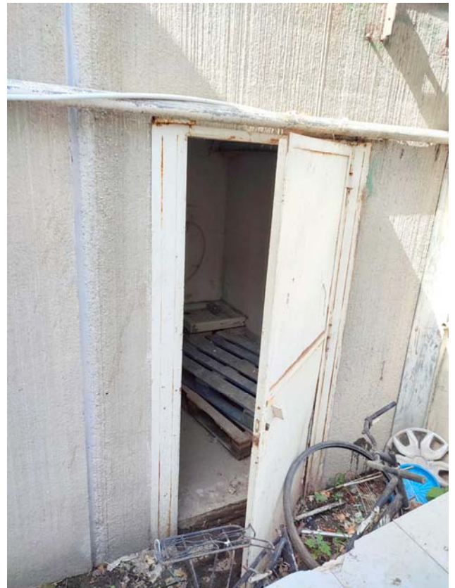
Foto 36. Ingresso al locale sub.6