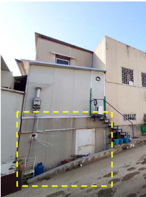
Foto 35. Immobile visto dallo spazio esterno sub.2