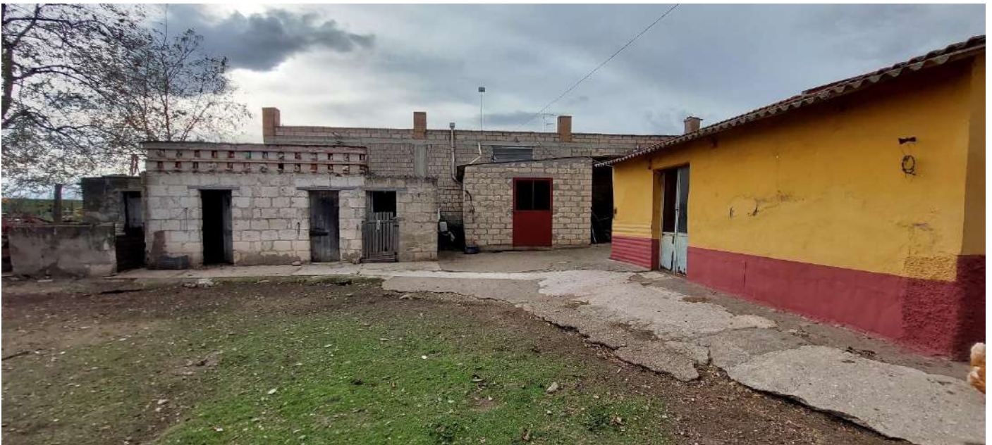
Cantina e pollai