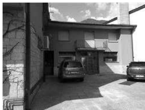
Cortile interno - accesso al laboratorio