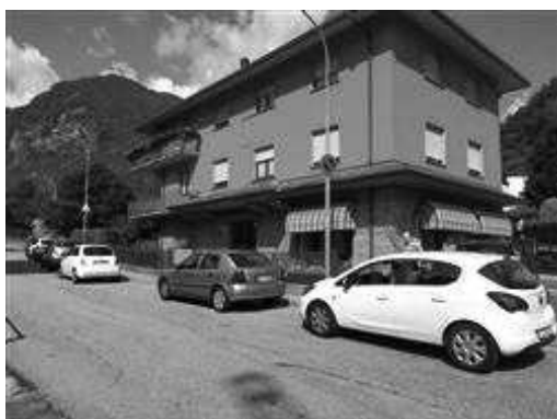
Vista generale del fabbricato su via Cerletti

I beni sono ubicati in zona semicentrale in un'area mista residenziale/commerciale, le zone limitrofe si trovano in un'area mista residenziale/commerciale. Il traffico nella zona è sostenuto, i parcheggi sono sufficienti. Sono inoltre presenti i servizi di urbanizzazione primaria e secondaria.