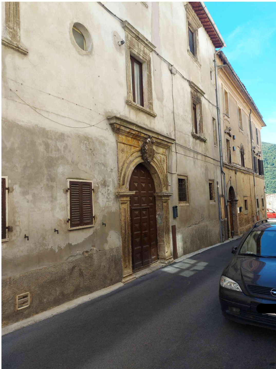
FOTO n. 1 - Appartamento di primo piano sito nel centro storico di Cittaducale, composto da due unità immobiliari graffate e collegate tramite pianerottolo comune ad altri subalterni, individuato al N.C.E.U. del suddetto comune al fg. 24 part 534 sub 10 e 736 sub 1 categoria A/3 classe 2 5,50 vani, rendita € 326,66.