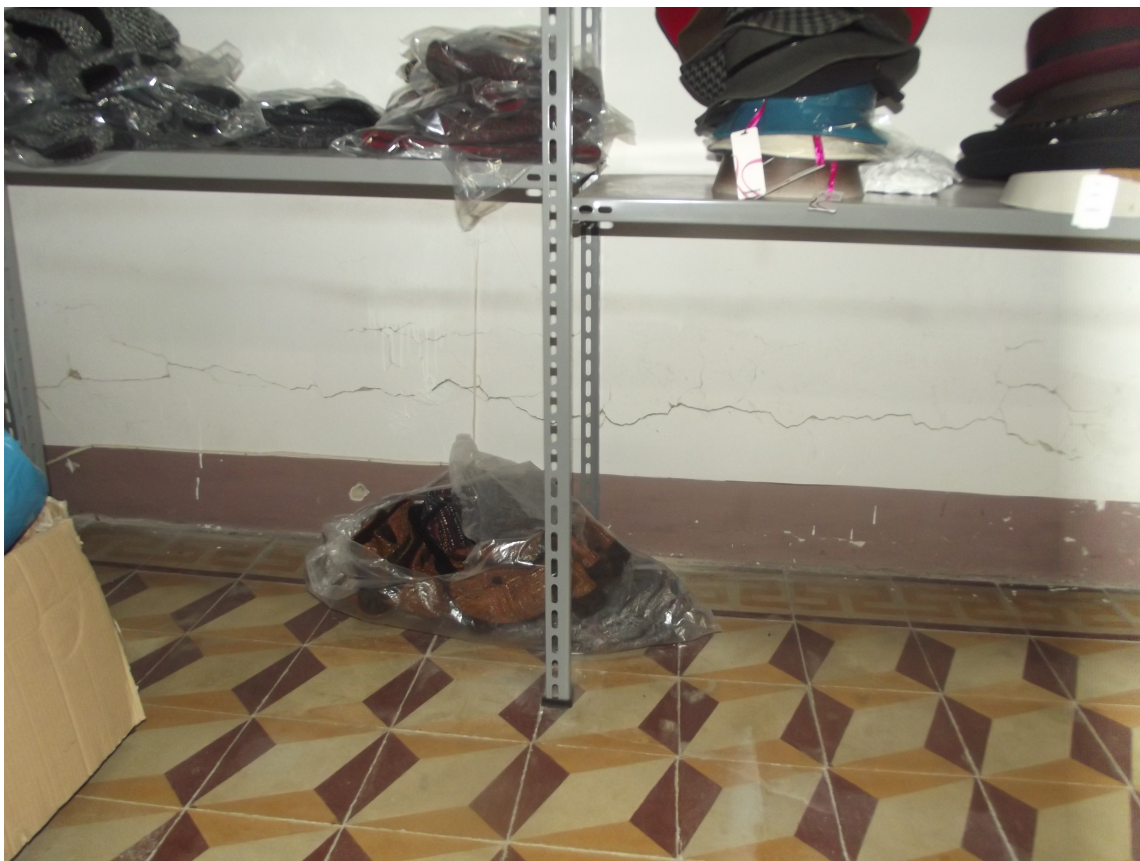
FOTO N°9: Edificio A vista Interna Piano Primo con lesioni (21.10.2016);