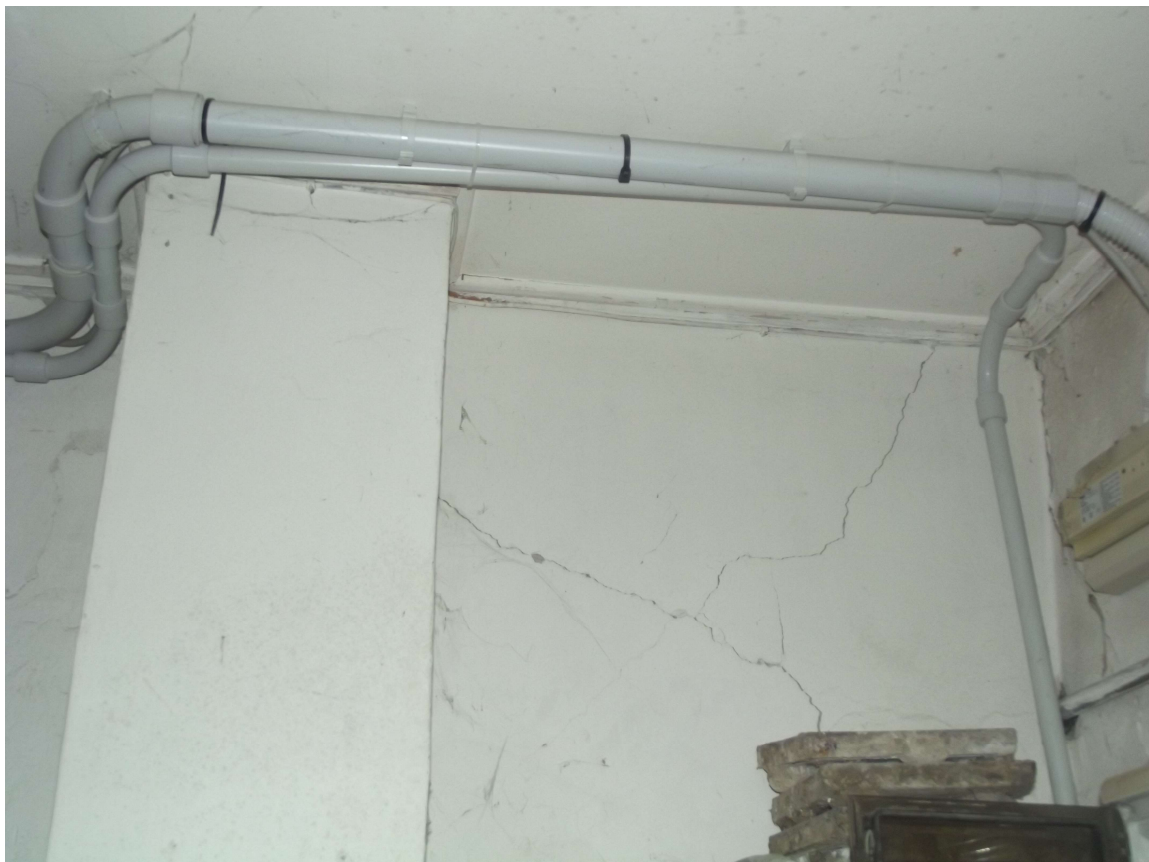
FOTO N°8: Edificio A vista Interna Piano Terra con lesioni (21.10.2016);