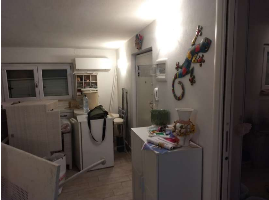
FOTO N.4 – Vista interna del locale soggiorno-posto cottura, verso il portoncino di ingresso alla abitazione e la finestra fronte Nord/Est..