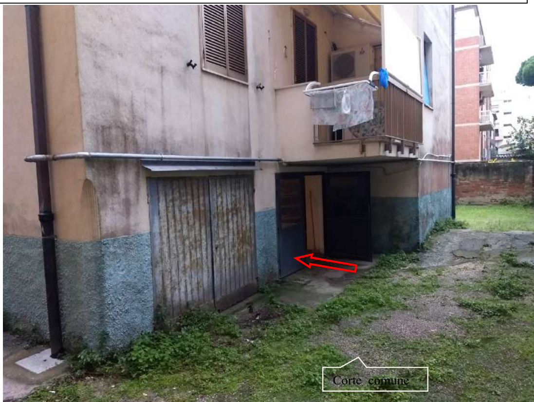
FOTO N.25 – Vista della corte condominiale, parte retrostante e dell'ingresso al locale autorimessa dalla corte comune antistante.