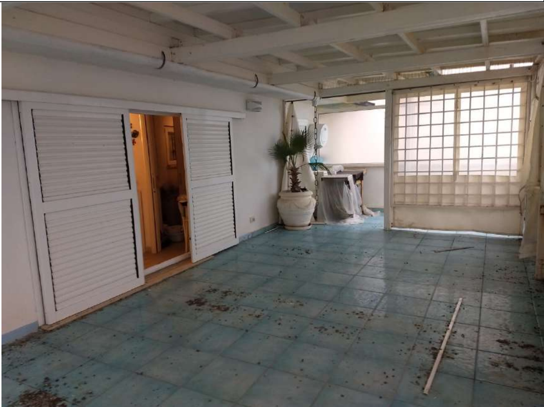
FOTO N.20 – Vista di parte del terrazzo esterno; verso il locale soggiorno e il lato a Sud/Est