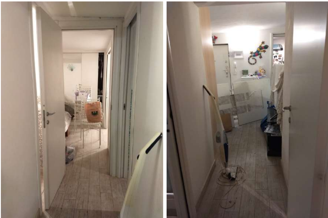
FOTO N.12/13 – Vista del disimpegno verso la camera singola e verso il soggiorno.