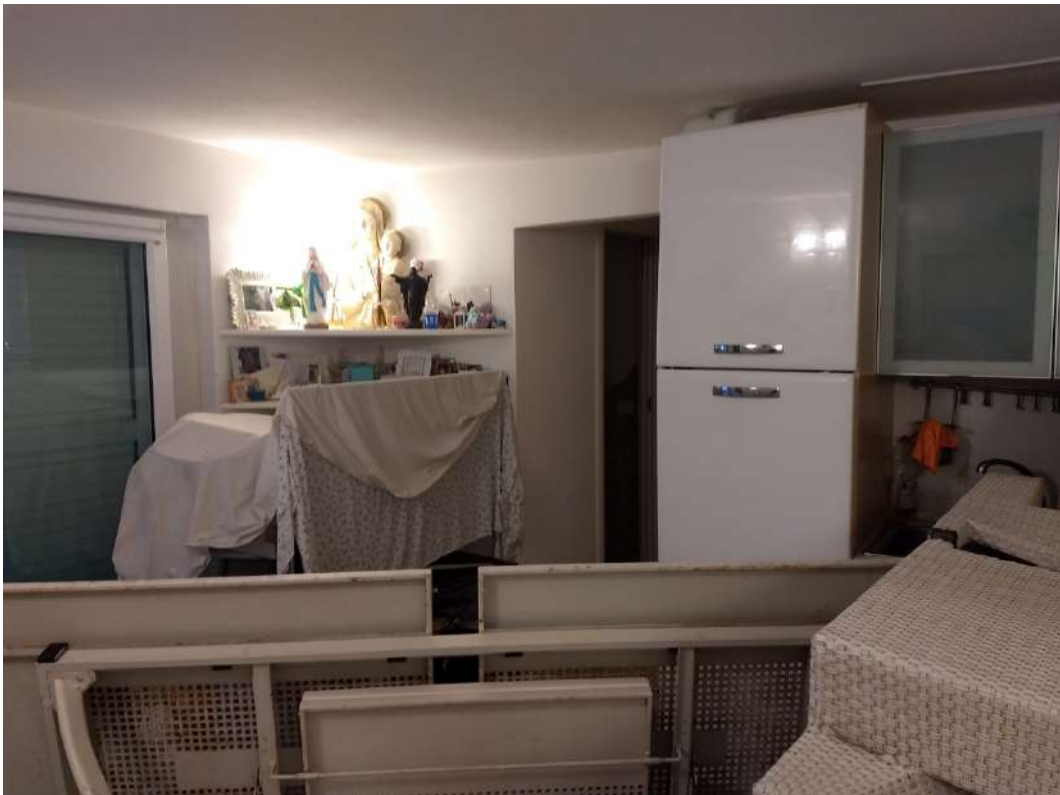
FOTO N.7 – Vista interna del locale soggiorno verso la porta-finestra e l'ingresso al disimpegno.