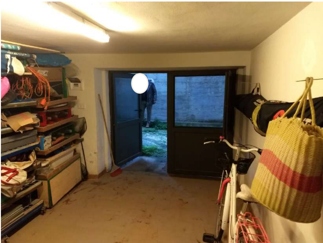
FOTO N.27 – Vista interna del locale autorimessa, verso la porta di ingresso e la corte.