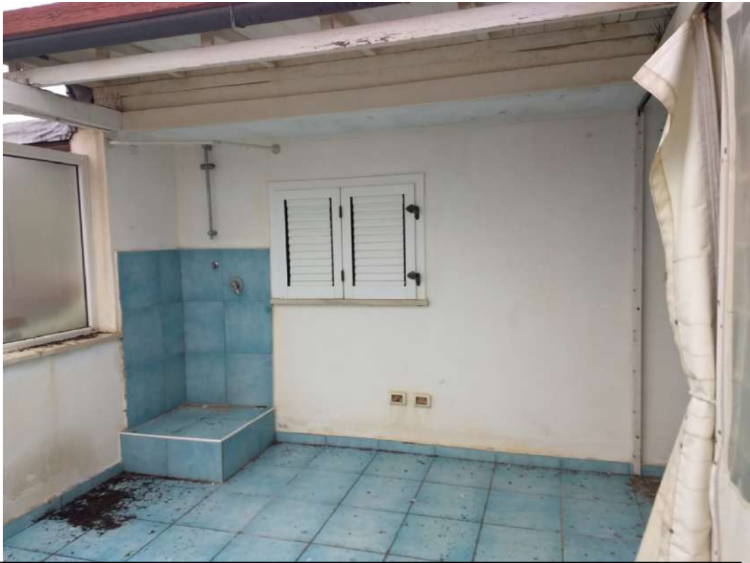
FOTO N.21 – Vista di parte del terrazzo esterno; verso la camera singola (cabina armadio), a Ovest/Sud/Ovest.