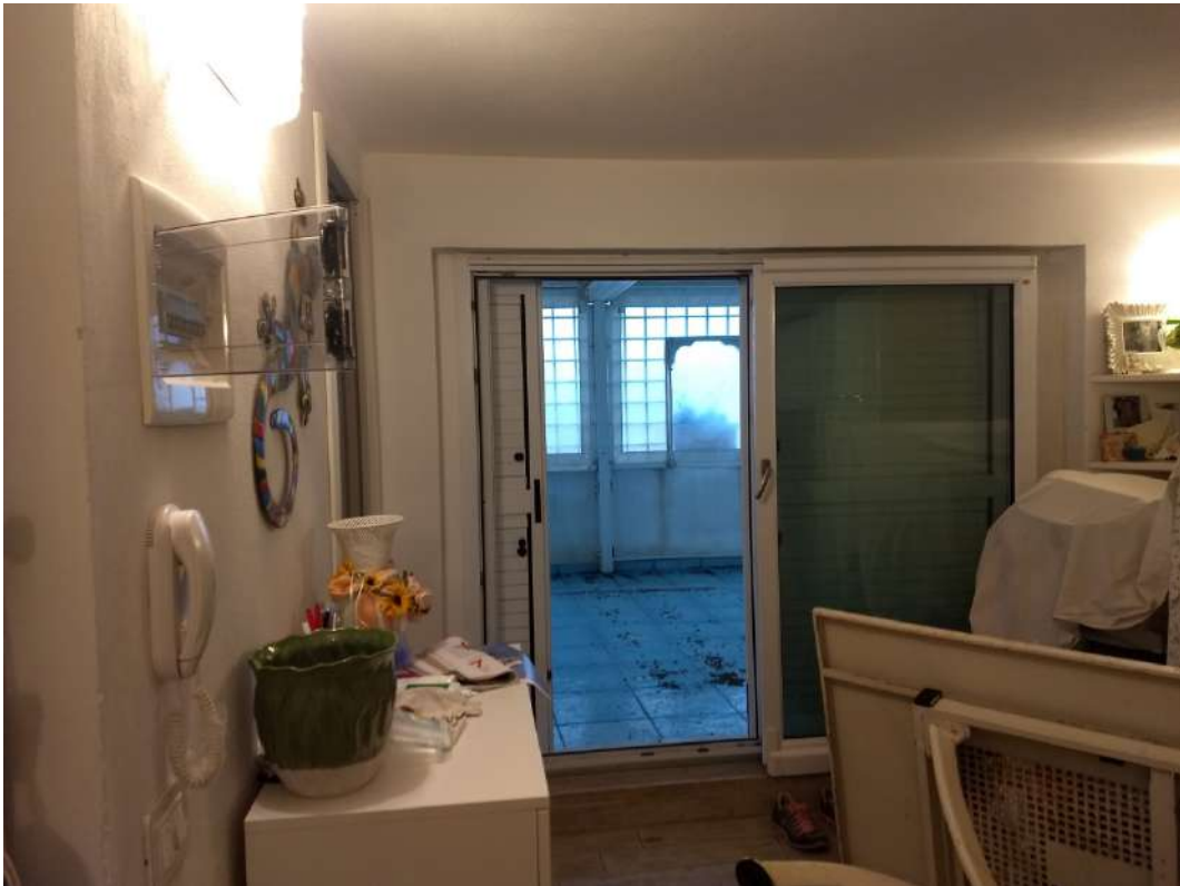
FOTO N.6 – Vista interna del locale soggiorno verso la porta-finestra che immette nel terrazzo antistante esclusivo, fronte Sud/Ovest.- Via XXIV Maggio.