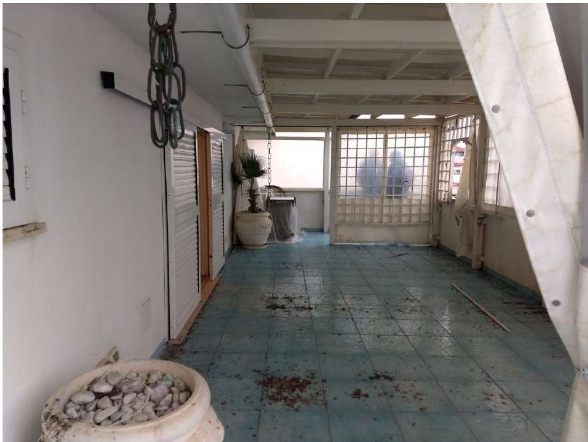
FOTO N.18 – Vista di parte del terrazzo esterno, direzione Sud/Est. e della tettoia di copertura.