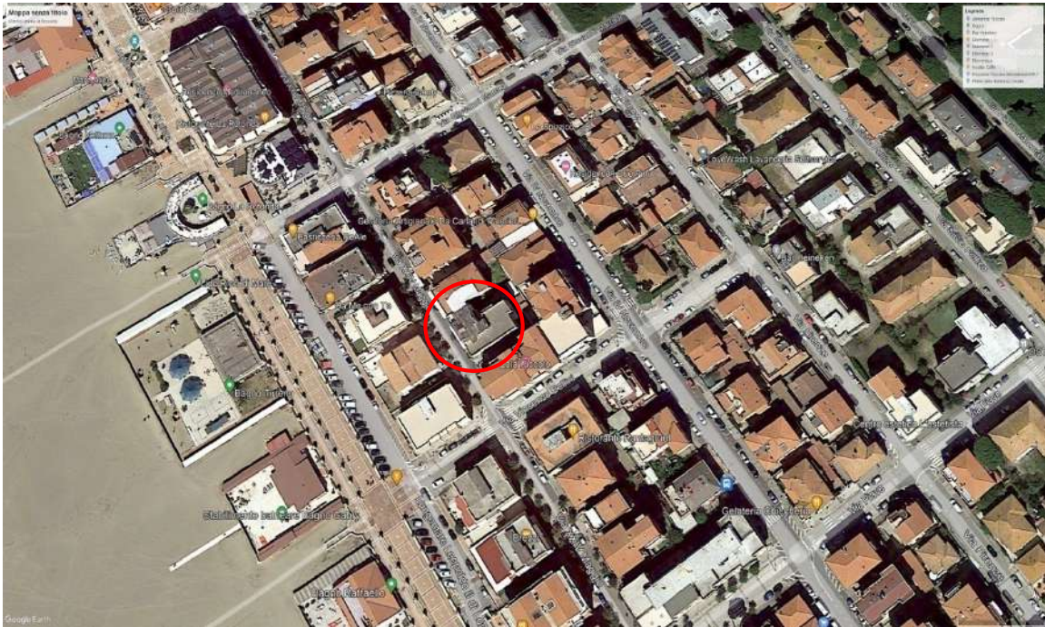
FOTAERA DELLA LOCALITA. IN ROSSO L'UBICAZIONE DEL FABBRICATO