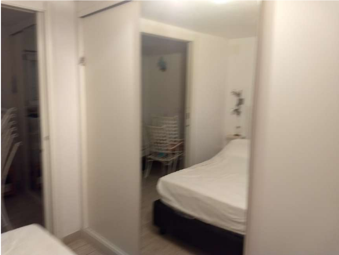
FOTO N.10 – Vista della camera singola dalla antistante cabina-armadio.