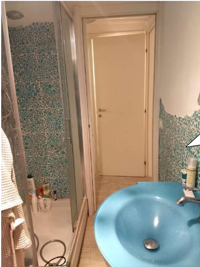
FOTO N.14 – Vista del bagno verso la porta di ingresso e il disimpegno.