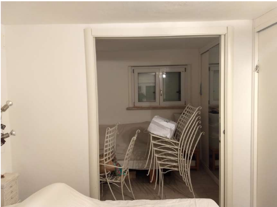
FOTO N.11 – Vista dalla camera singola della cabina-armadio, posta all'ingresso.