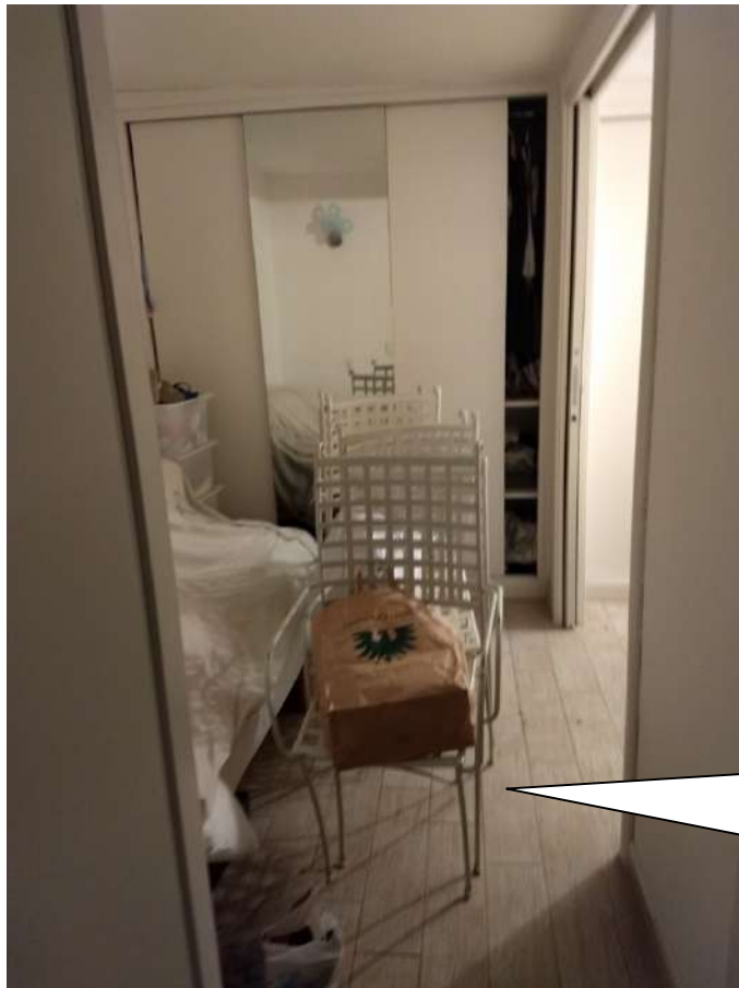
FOTO N.9 – Vista dalla porta di ingresso della camera singola con antistante la cabina-armadio