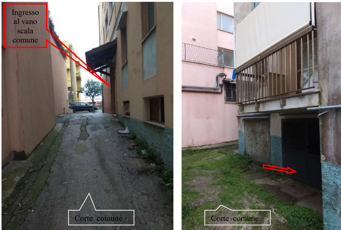
FOTO N.23/24 – Vista della corte condominiale laterale con ingresso dalla Via XXIV Maggio e retrostante con l'ingresso al locale autorimessa dalla corte comune antistante.