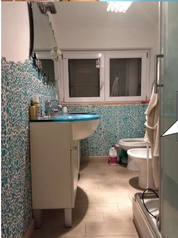
FOTO N.15 – Vista interna del bagno dalla porta di ingresso e disimpegno.