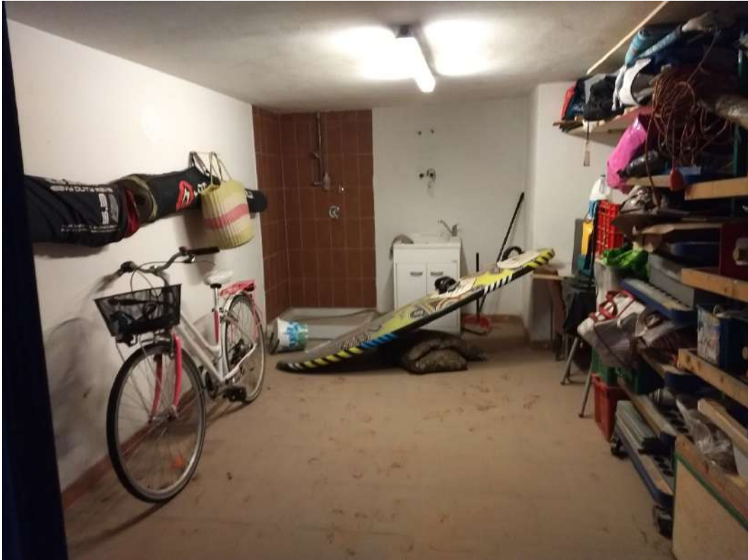
FOTO N.26 – Vista interna del locale autorimessa, dalla porta di ingresso.