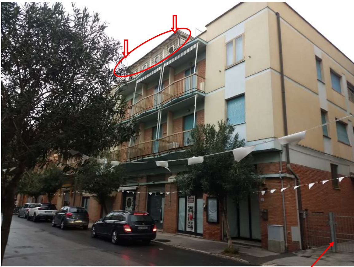
FOTO N.1 – VISTA DALLA VIA XXIV MAGGIO DEL FABBRICATO CUI FA PARTE IL COMPENDIO IMMOBILIARE. Nell' ellisse rosso l'ubicazione della "Abitazione".