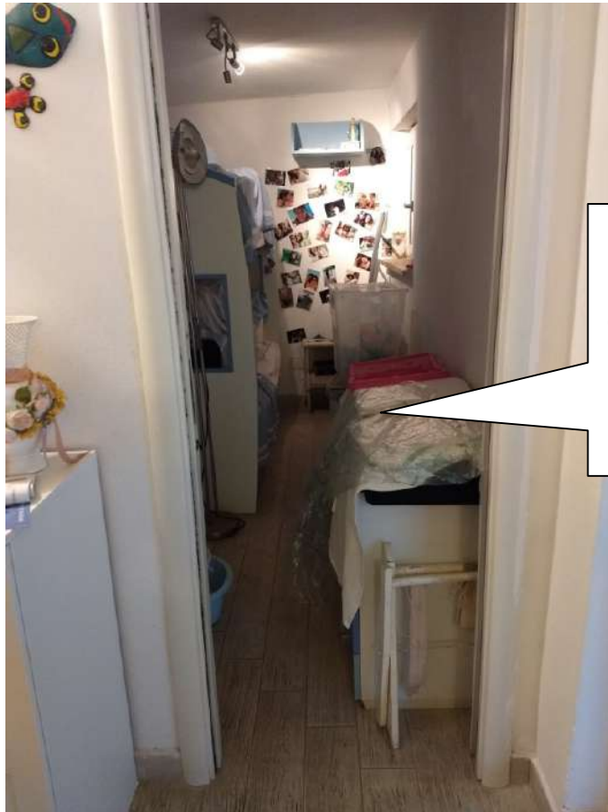
FOTO N.8 – Vista interna dalla cameretta con ingresso dal soggiorno e a confine con il vano della scala condominiale.