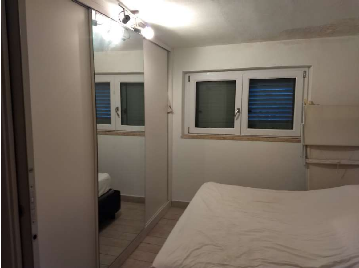
FOTO N.12 – Vista dalla camera singola dalla cabina-armadio, posta all'ingresso.