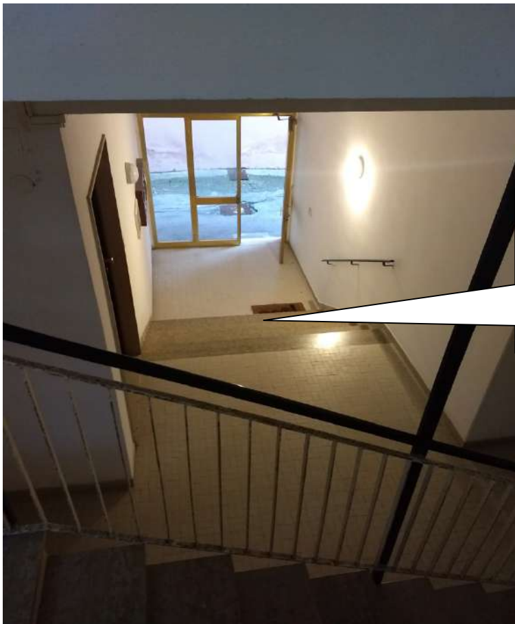
FOTO N.2 – Vista della scala interna condominiale e dell'ingresso principale al piano terreno