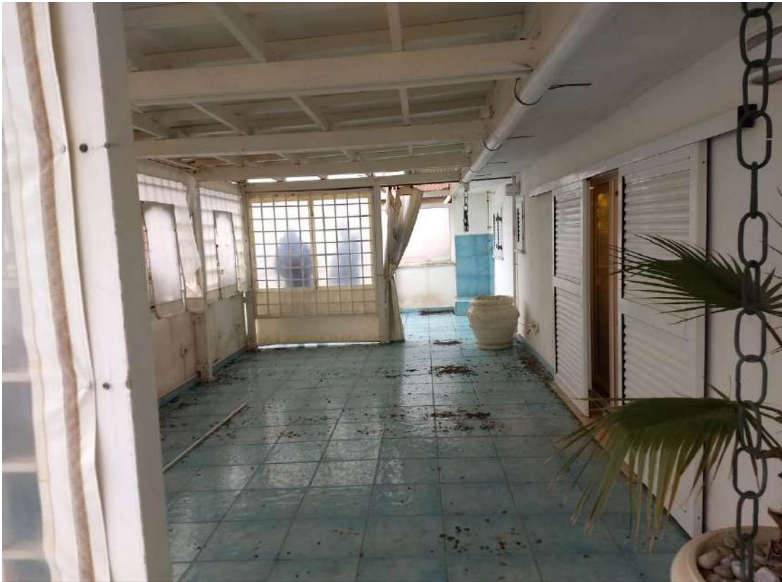
FOTO N.19 – Vista di parte del terrazzo esterno, direzione Nord/Ovest., e della tettoia di copertura.