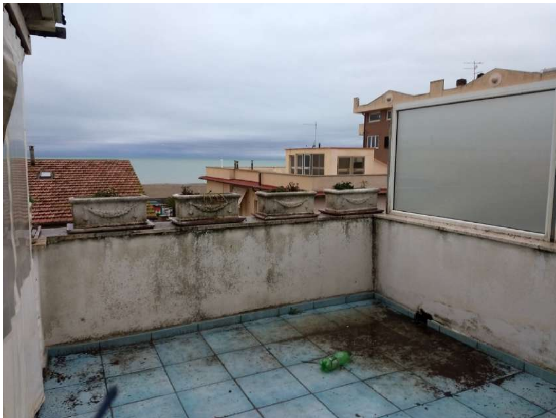
FOTO N.22 – Vista di parte del terrazzo esterno; direzione mare a Ovest/Sud/Ovest .