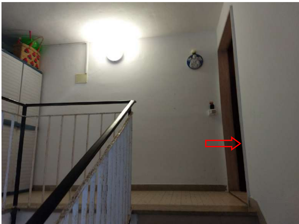
FOTO N.3 – Vista del pianerottolo della scala condominiale al piano terzo e dell'ingresso alla abitazione porta a destra.