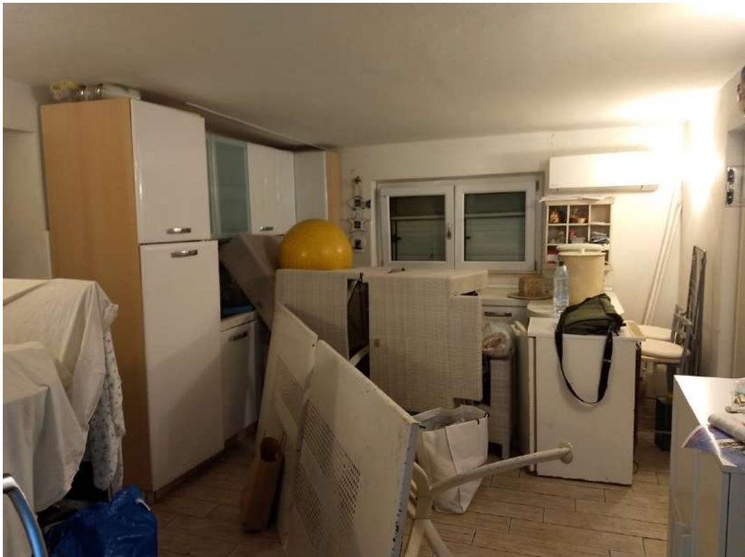
FOTO N.5 – Vista interna del locale soggiorno/verso il posto cottura e la finestra fronte Nord/Est.