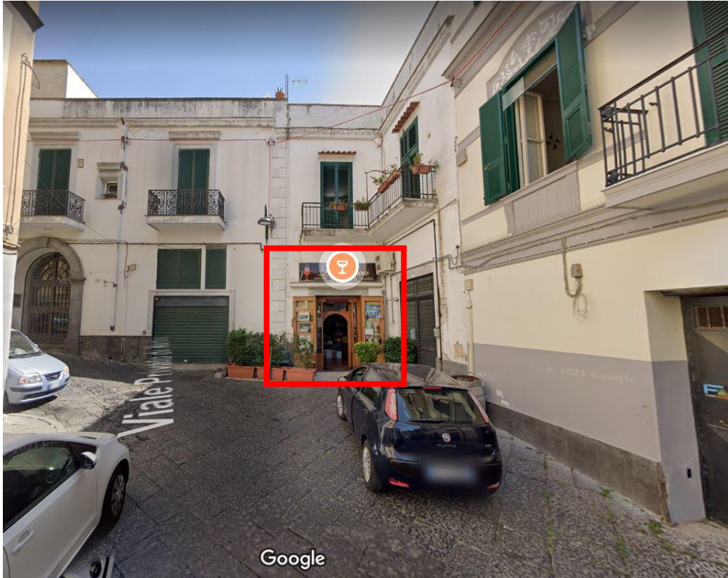
prospetto su strada privata - indicazione accesso cespite pignorato civ.22