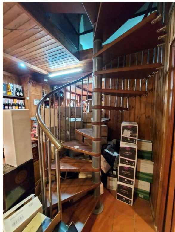
Scala che conduce al soppalco