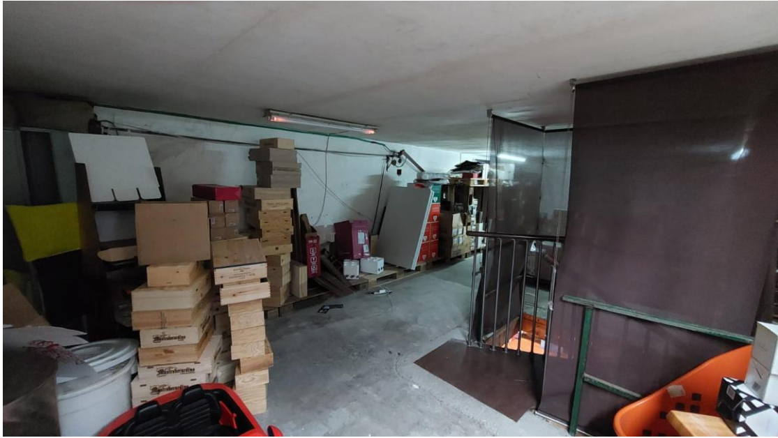
soppalco - Locale L2