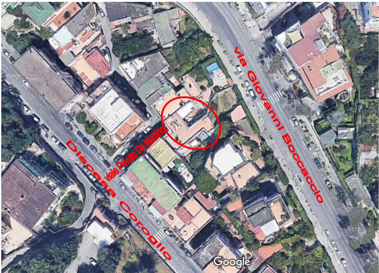
inquadramento territoriale - viale Privato De Martino fabbricato civico n. 22