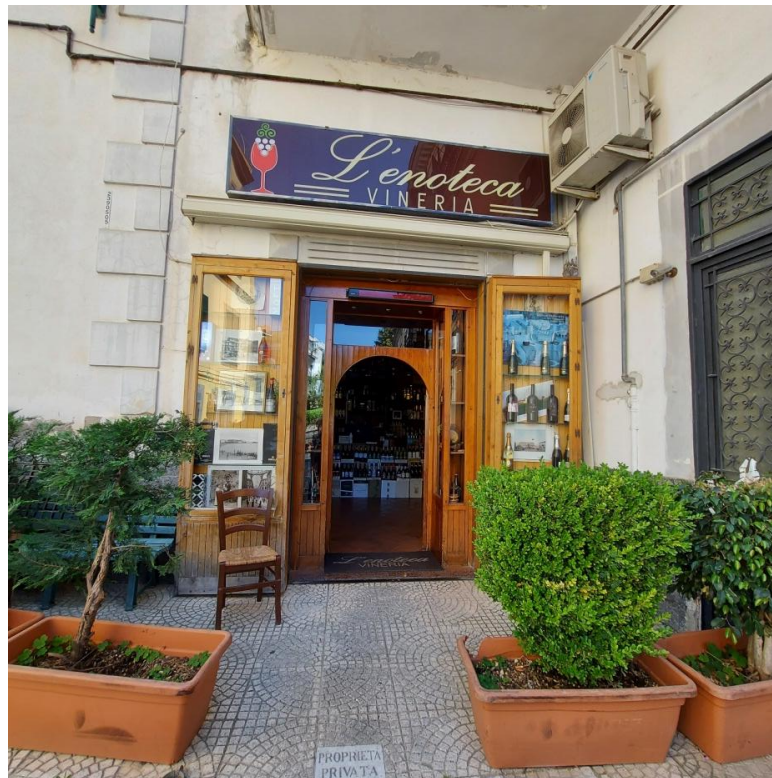
accesso cespite pignorato civ.22