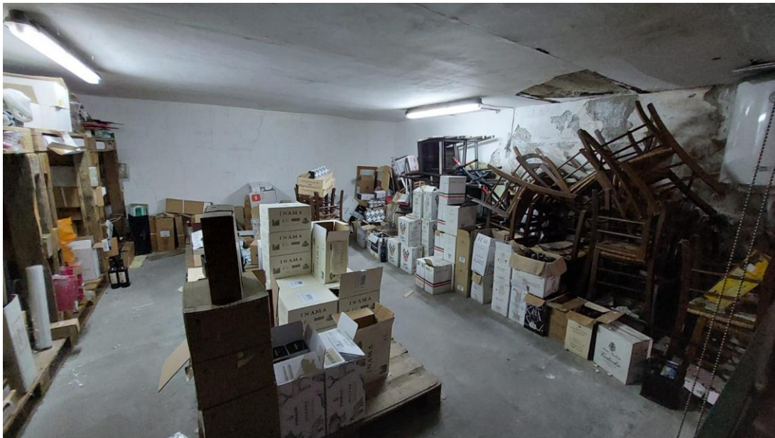
soppalco - Locale L2