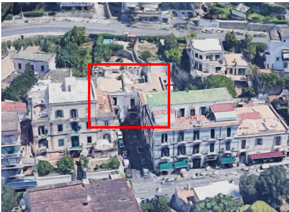
inquadramento territoriale - vista prospettica - individuazione fabbricato