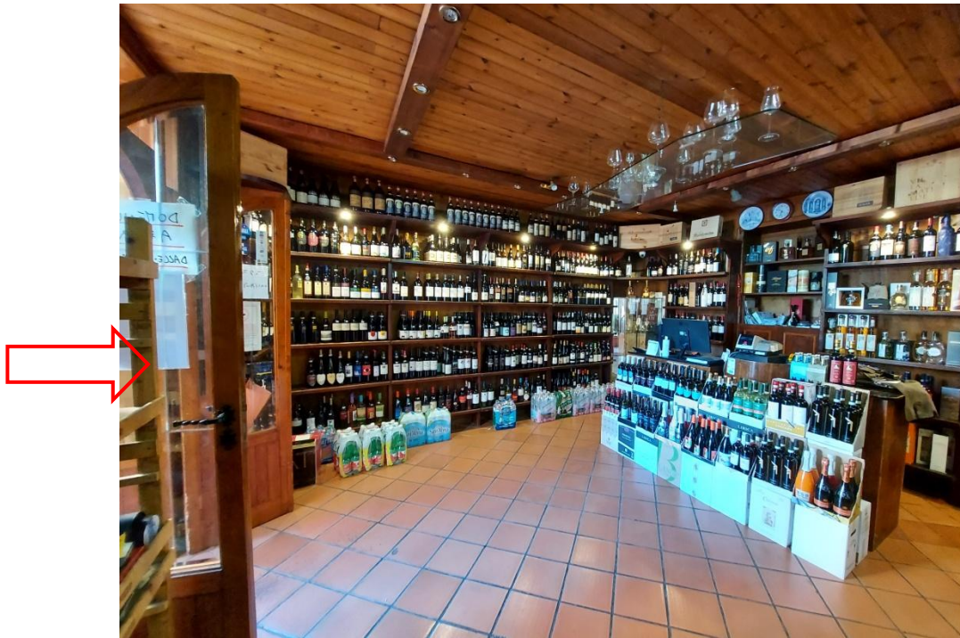
Locale L1 - indicazione accesso