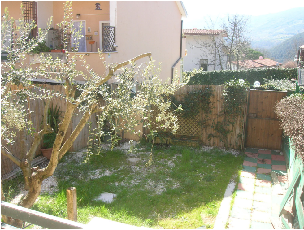
Vedute esterne del fabbricato – giardino pertinenziale