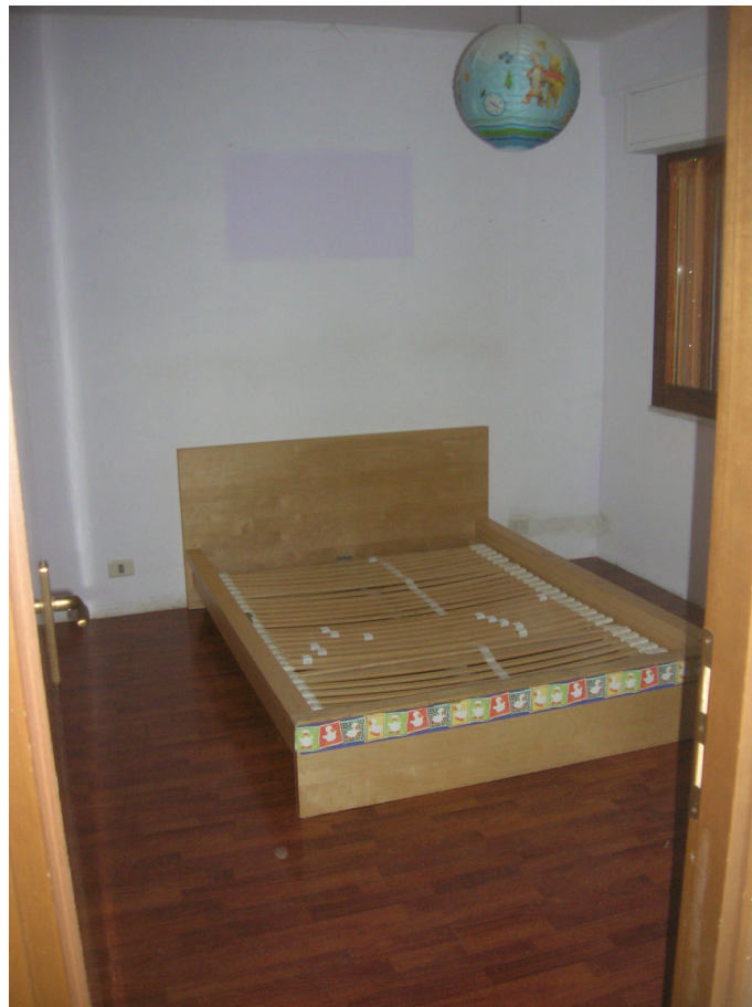
Vedute interne: piano terra