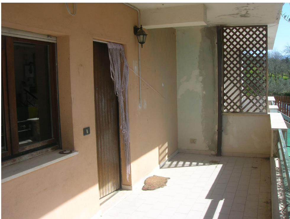
Vedute esterne del fabbricato – zona di accesso all'alloggio