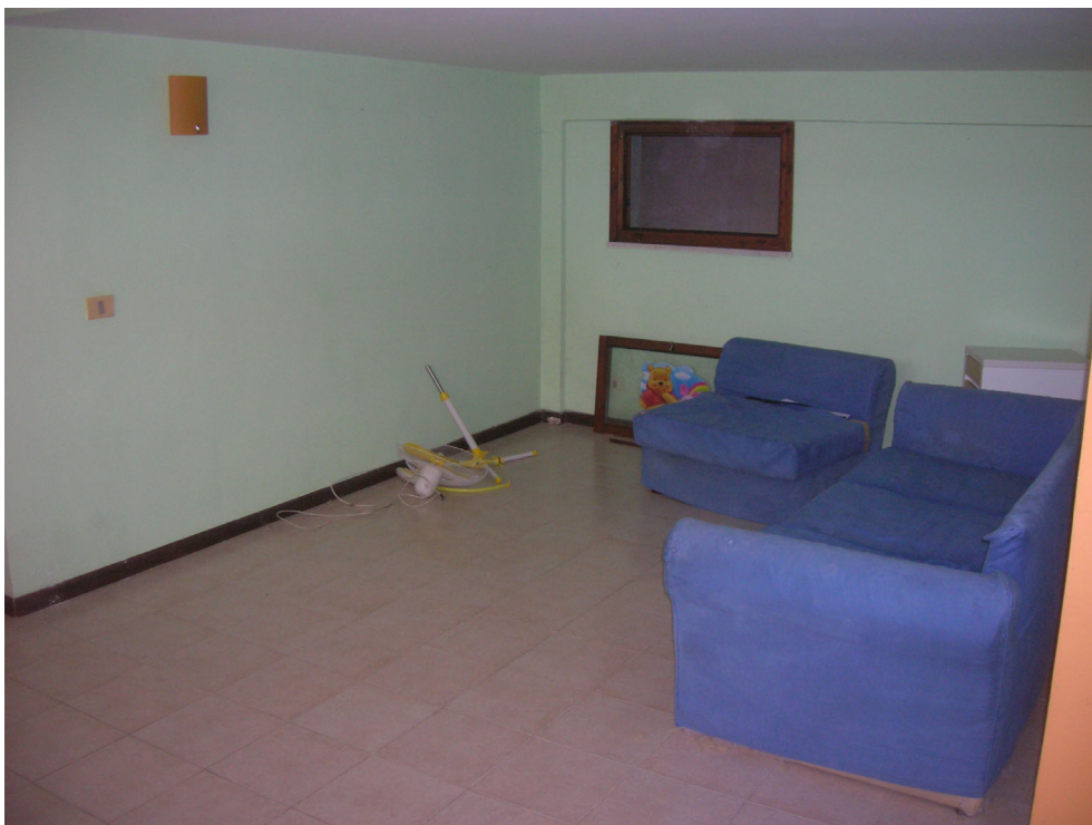
Vedute interne: piano sottostrada