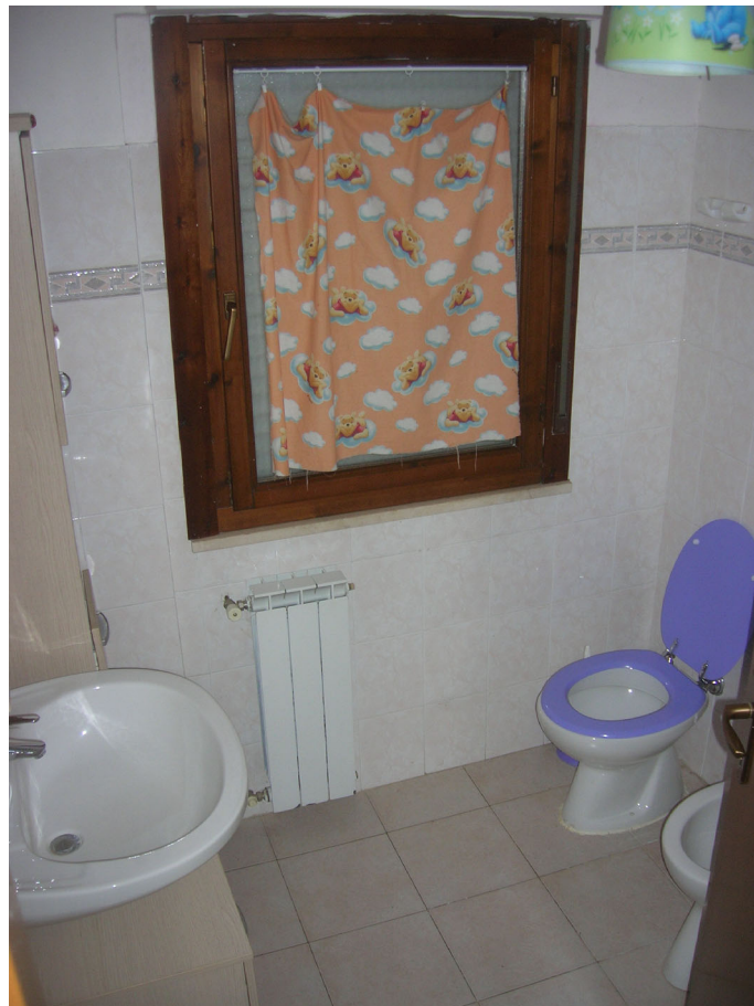
Vedute interne: piano terra