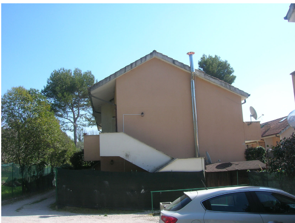
Vedute esterne del fabbricato