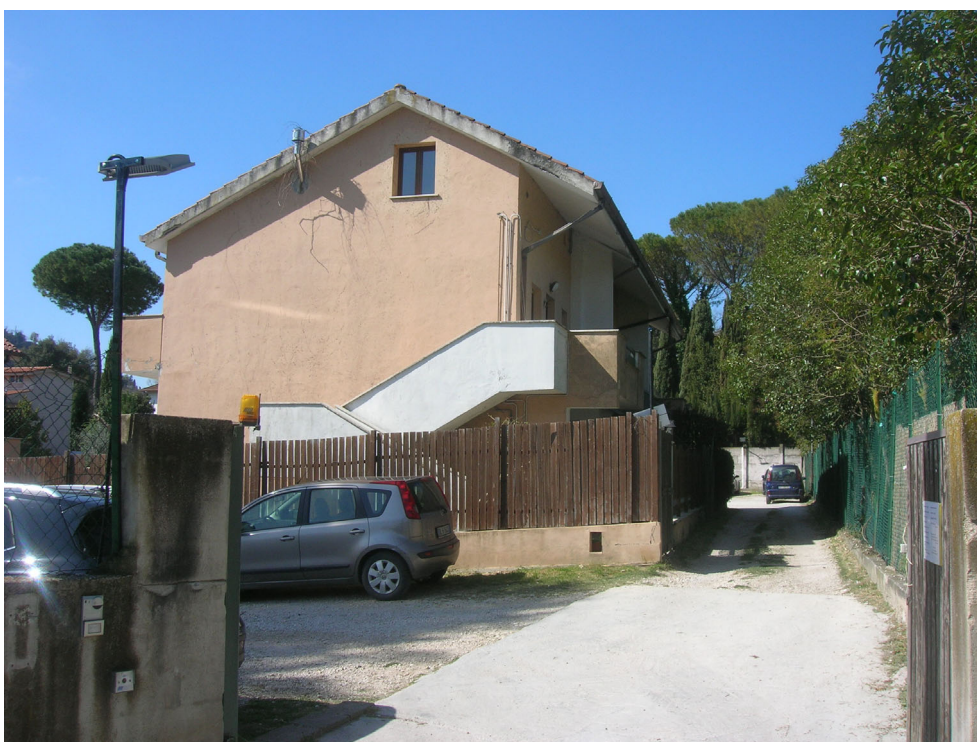
Vedute esterne del fabbricato e del contesto in cui è inserito