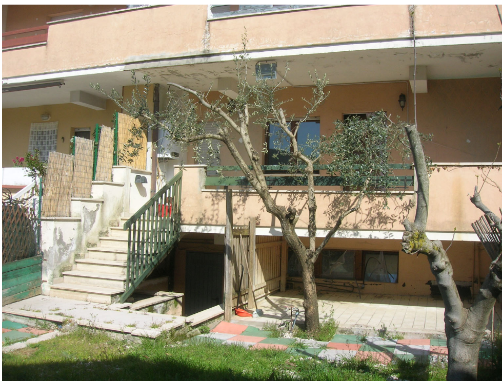
Vedute esterne del fabbricato