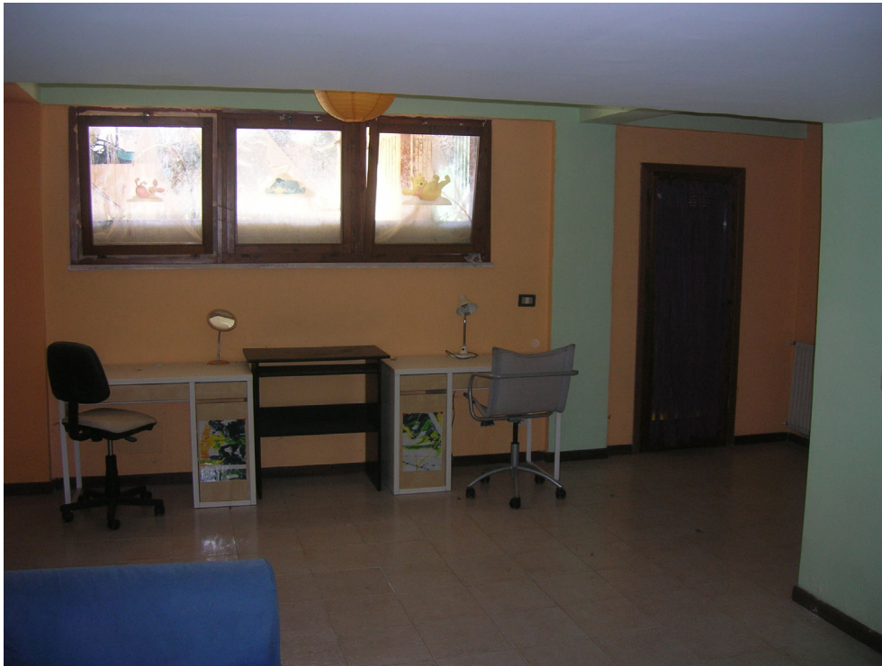
Vedute interne: piano sottostrada