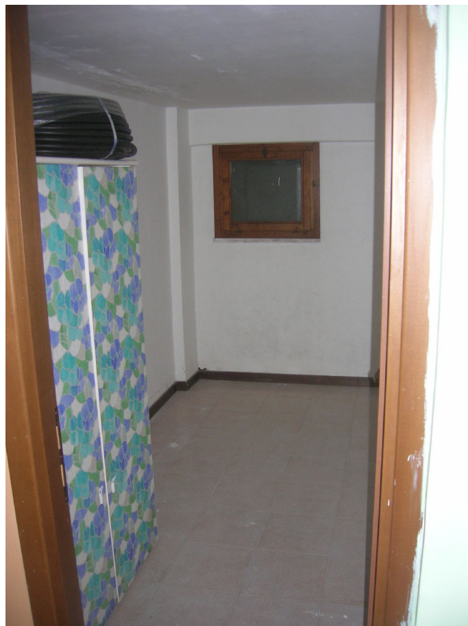
Vedute interne: piano sottostrada