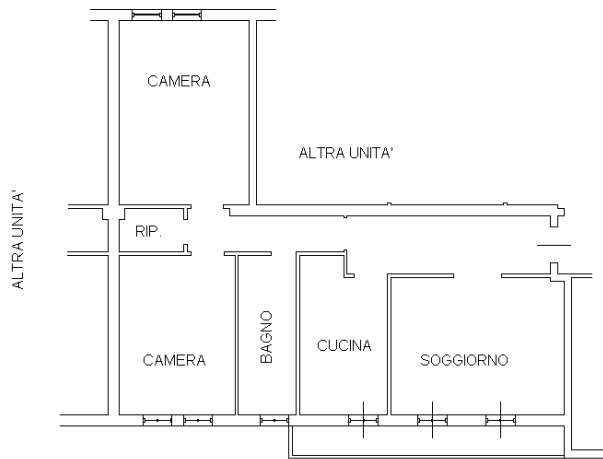
PIANO PRIMO H:280