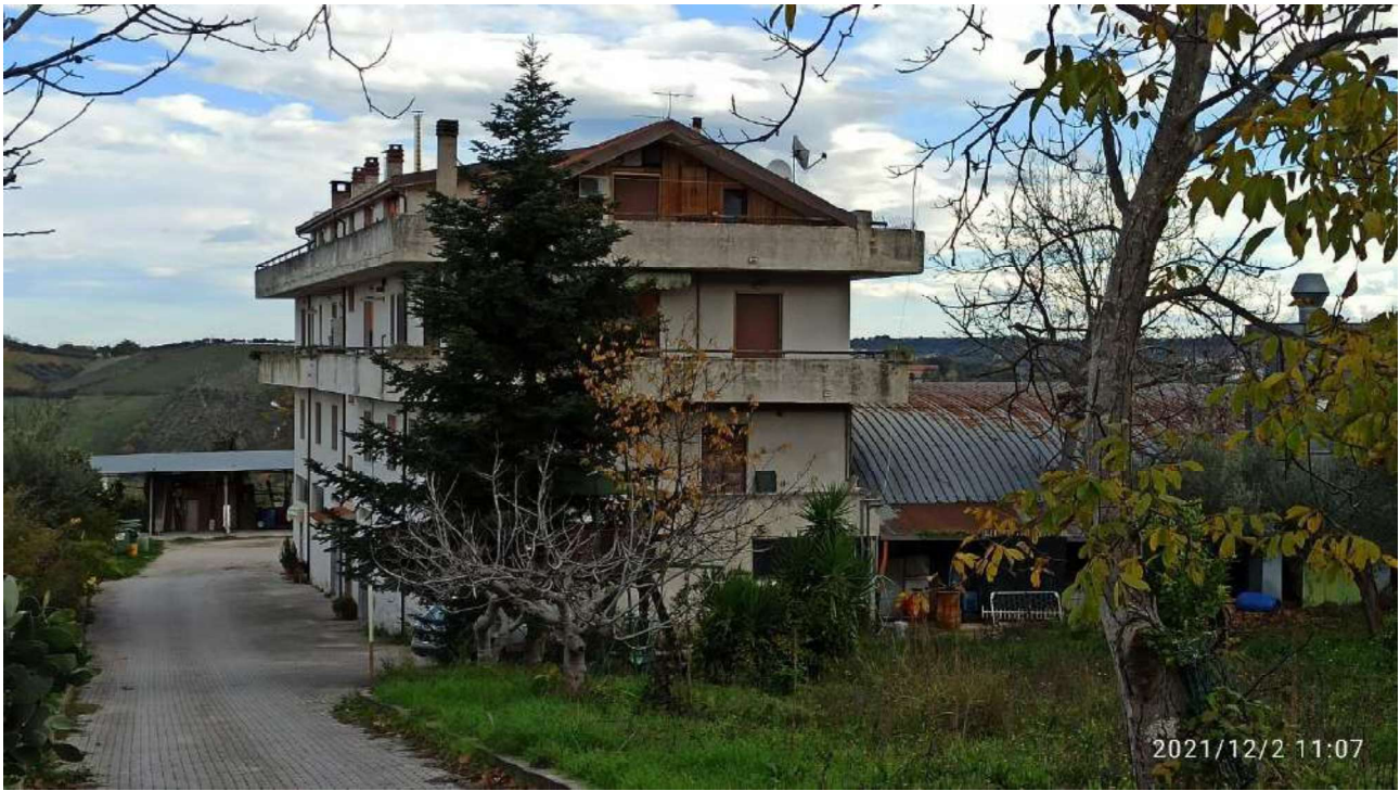
Foto n. 1 e 2 – Palazzina uffici e abitazioni – copertura opificio