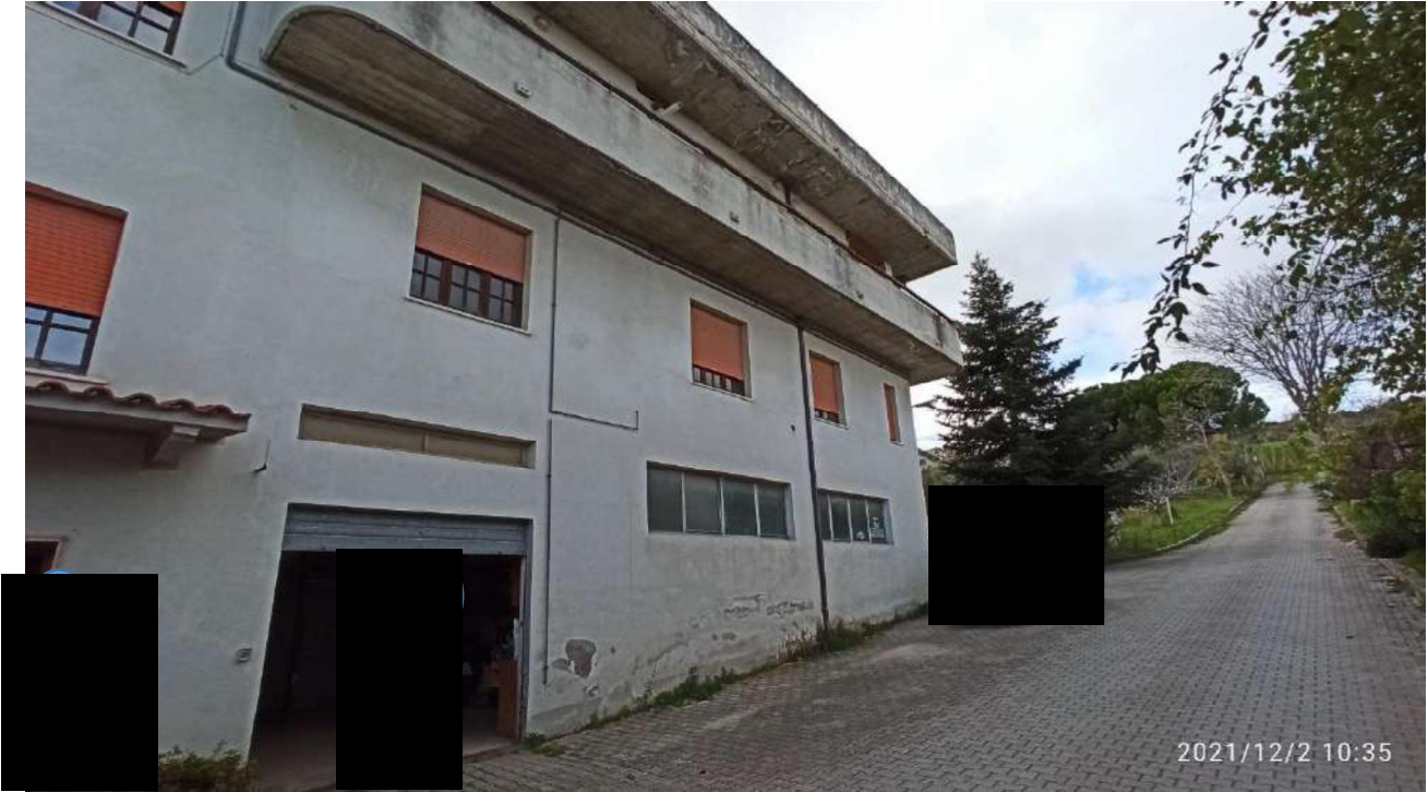
Foto n. 13 – locale deposito piano terra e finestre degli uffici al piano primo