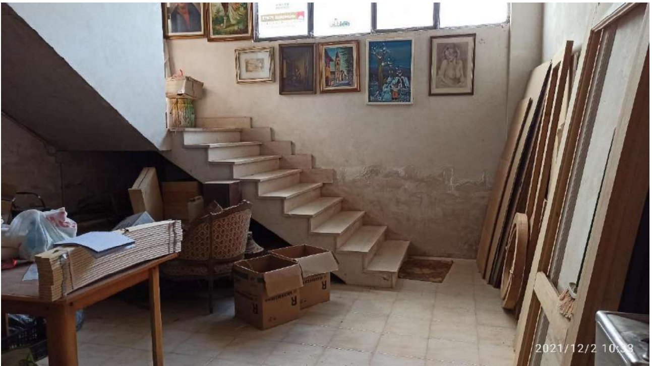
Foto n. 6 – scalinata interna di collegamento tra gli uffici e l'opificio