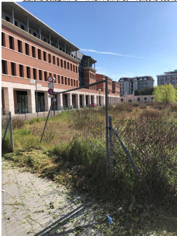
Foto 7- confine lato ovest

Galleria Cotogni n° 3 – 47121 Forlì (FC) – Tel.0543-033402 fax 0543-031250 Mail: stpadovano@libero.it