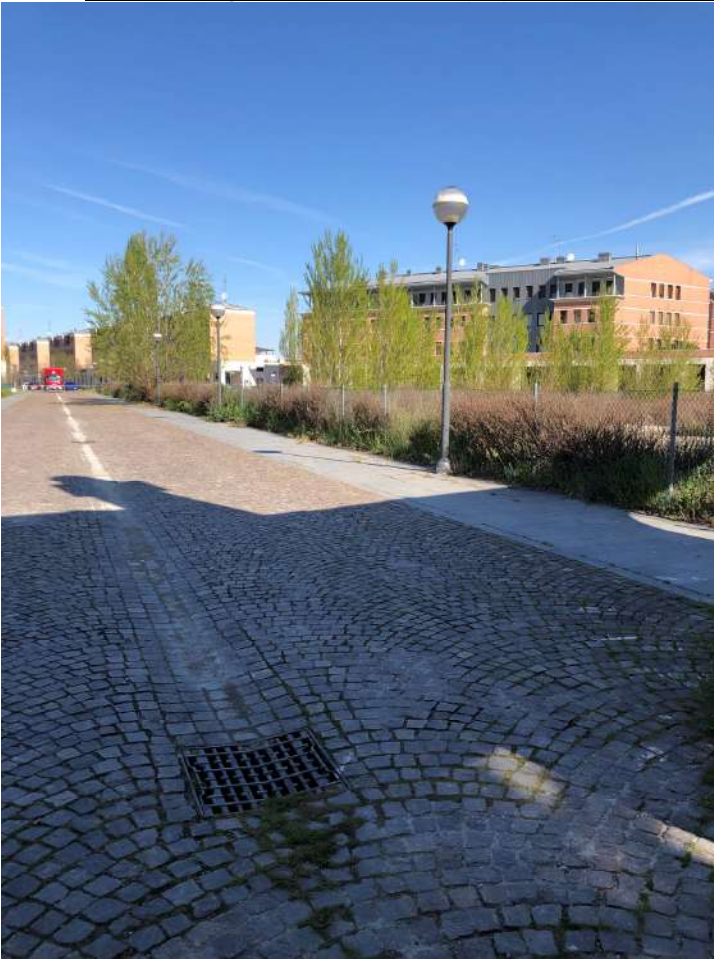
Foto 5- confine lato sud

Galleria Cotogni n° 3 – 47121 Forlì (FC) – Tel.0543-033402 fax 0543-031250 Mail: stpadovano@libero.it