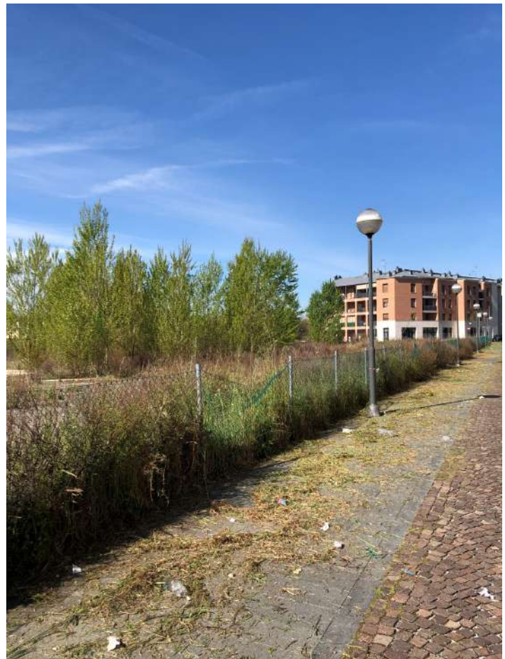
Foto 6- confine lato nord