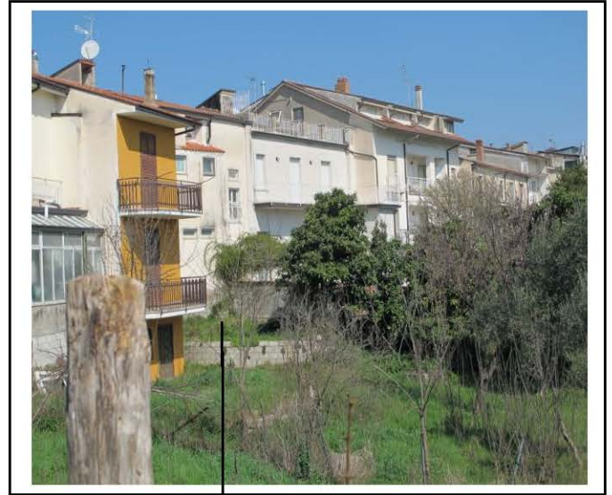
LOTTO 3 - Part.IIa 469