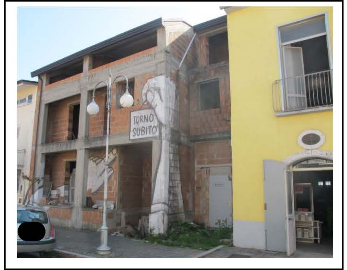
PROSPETTO PRINCIPALE – via ROMA