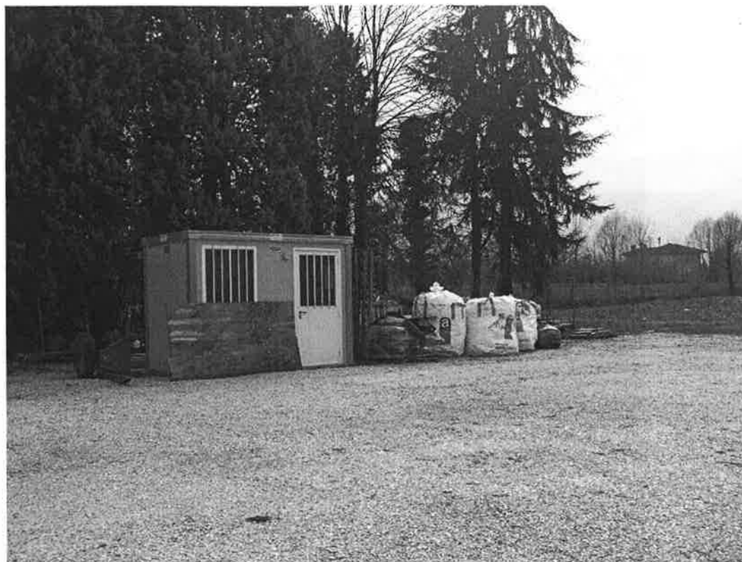
33. L'area accanto all'ingresso ai terreni (ufficio da cantiere).