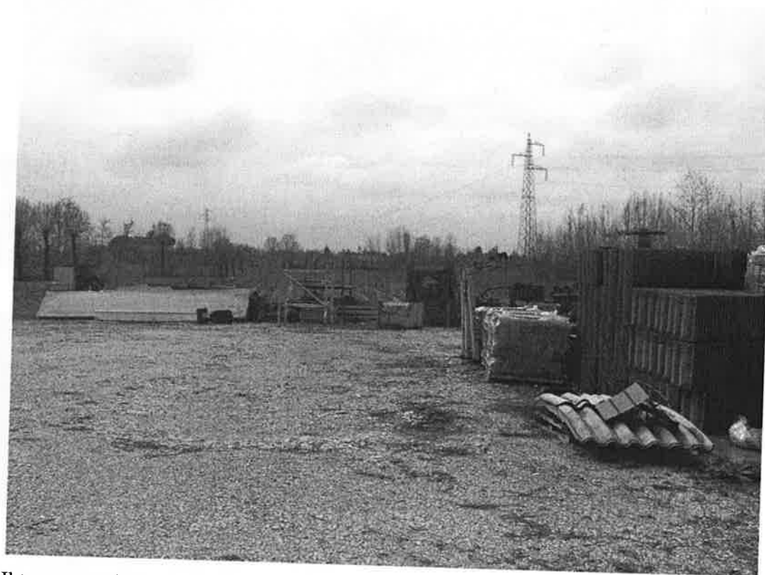
32. Il terreno agricolo da nord - sullo sfondo l'elettrodotto che lambisce il confine del lotto.