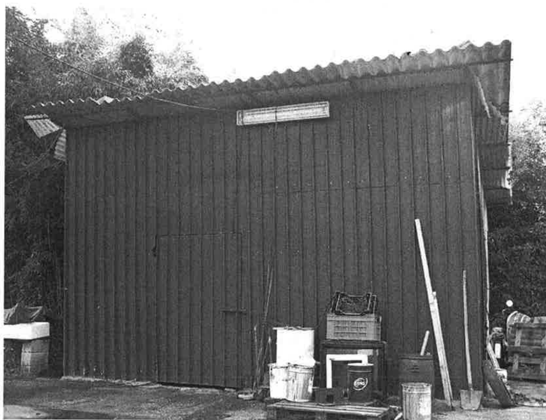
36. Ricovero abusivo.