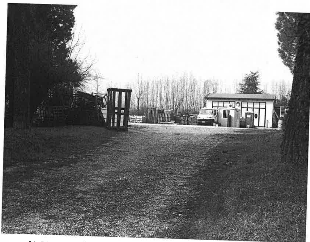
31. L'accesso ai mappali 528 e 526 e l'annesso rustico sullo sfondo