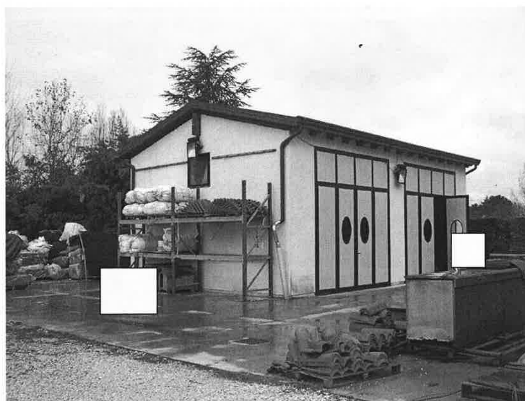
34. Annesso rustico.