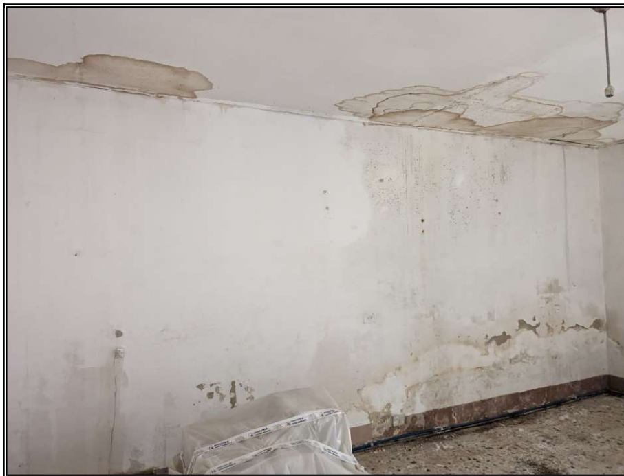
Foto n° 8 – Particolare infiltrazione d'acqua nel controsoffitto e umidità nella parete