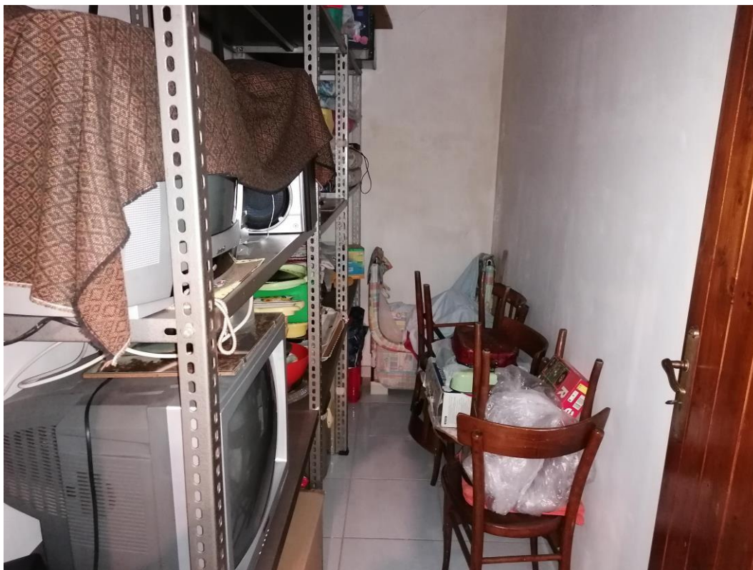
Foto n° 25 – Unità immobiliare al piano S1-S2-S3 del fabbricato sito in Niscemi c.da Spasimo/Pirillo. In Catasto al foglio 55 part.IIa 1371 sub 6; Ripostiglio al piano S3.