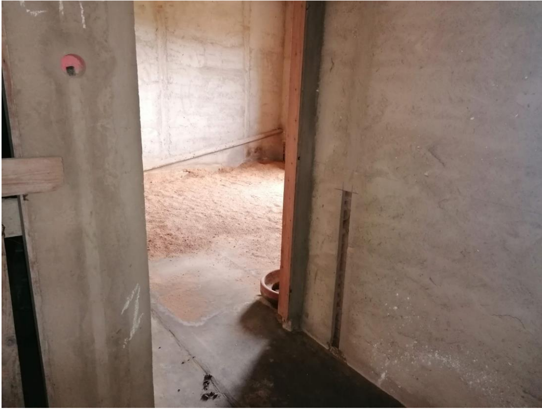
Foto n° 35 – Unità immobiliare al piano secondo del fabbricato sito in Niscemi c.da Spasimo/Pirillo. In Catasto al foglio 55 part.IIa 1371 sub 7; Veduta interna.