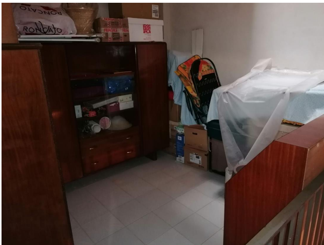
Foto n° 20 – Unità immobiliare al piano S1-S2-S3 del fabbricato sito in Niscemi c.da Spasimo/Pirillo. In Catasto al foglio 55 part.IIa 1371 sub 6; Ripostiglio al piano S2.