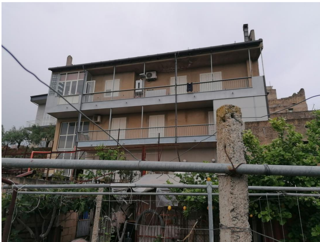
Foto n° 29 – Unità immobiliare al piano S1-S2-S3 del fabbricato sito in Niscemi c.da Spasimo/Pirillo. In Catasto al foglio 55 part.IIa 1371 sub 6; Prospetto Ovest del fabbricato.