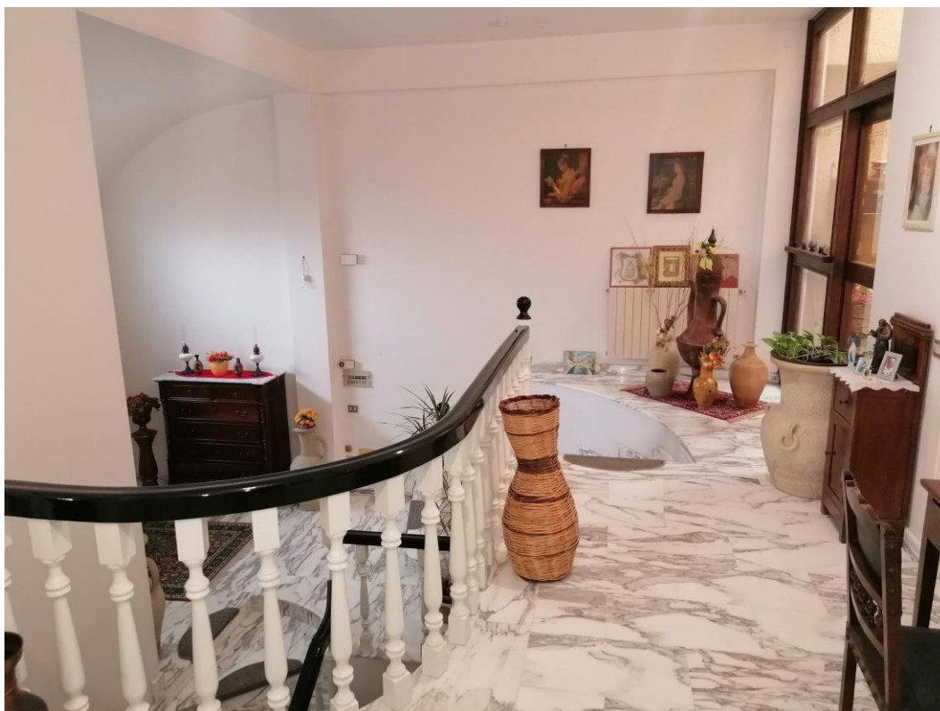
Foto n° 11 - Unità immobiliare al piano S1-S2-S3 del fabbricato sito in Niscemi c.da Spasimo/Pirillo. In Catasto al foglio 55 part.Ila 1371 sub 6; disimpegno al piano S1 con presenza di scale per i collegamenti verticali dei vari piani dell'unità.