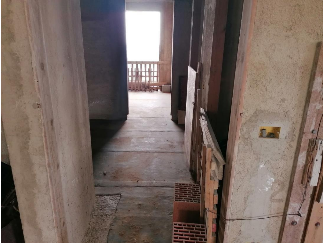
Foto n° 32 – Unità immobiliare al piano secondo del fabbricato sito in Niscemi c.da Spasimo/Pirillo. In Catasto al foglio 55 part.IIa 1371 sub 7; Veduta interna.