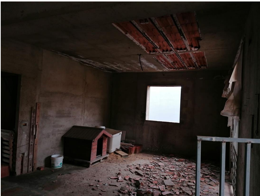
Foto n° 34 – Unità immobiliare al piano secondo del fabbricato sito in Niscemi c.da Spasimo/Pirillo. In Catasto al foglio 55 part.IIa 1371 sub 7; Veduta interna.