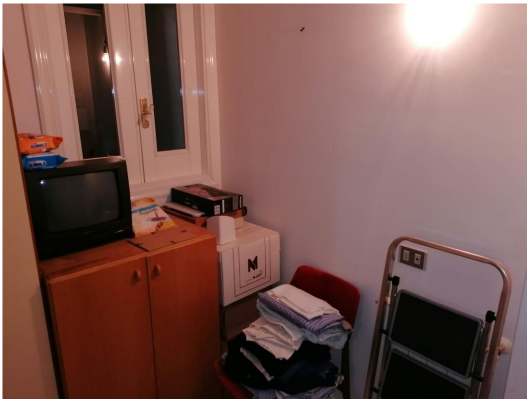
Foto n° 19 – Unità immobiliare al piano S1-S2-S3 del fabbricato sito in Niscemi c.da Spasimo/Pirillo. In Catasto al foglio 55 part.IIa 1371 sub 6; Ripostiglio al piano S2.