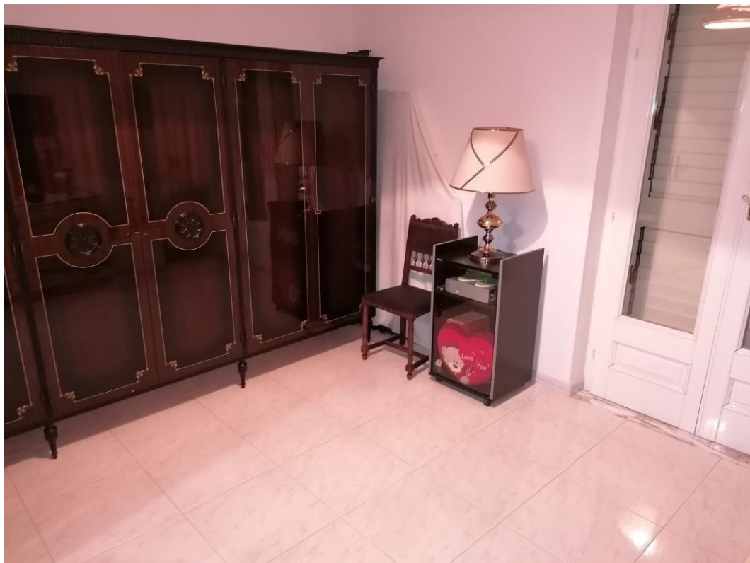
Foto n° 16 – Unità immobiliare al piano S1-S2-S3 del fabbricato sito in Niscemi c.da Spasimo/Pirillo. In Catasto al foglio 55 part.IIa 1371 sub 6; Vano al piano S2.