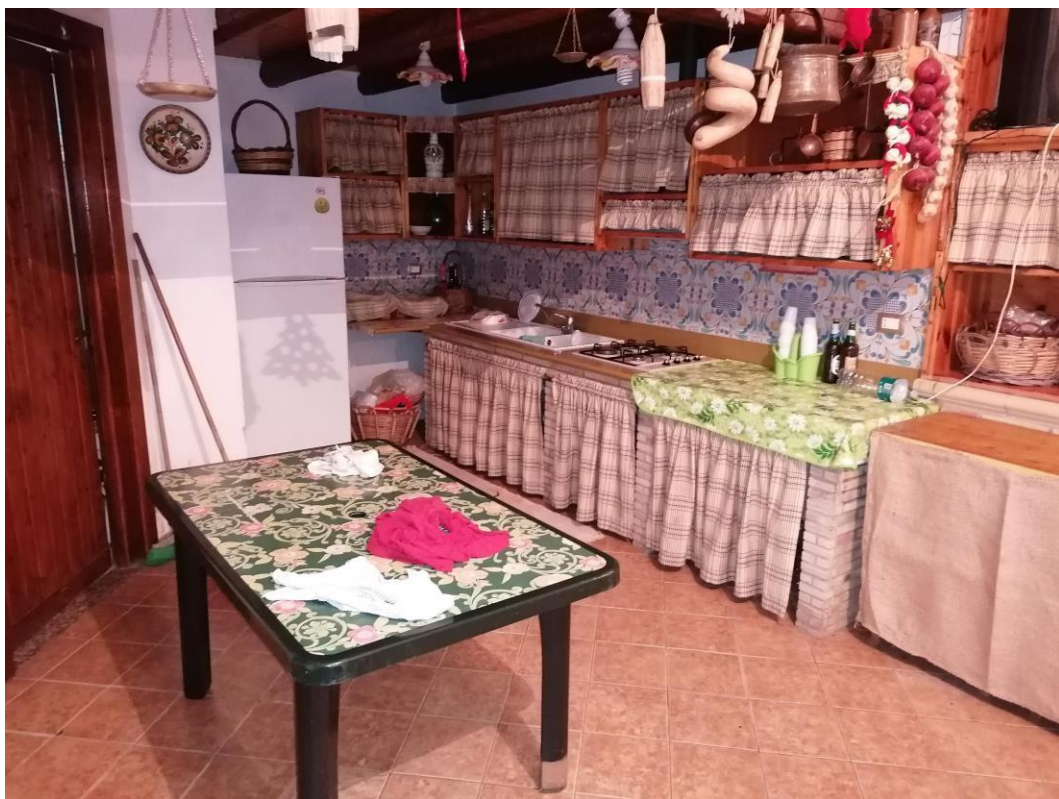
Foto n° 24 – Unità immobiliare al piano S1-S2-S3 del fabbricato sito in Niscemi c.da Spasimo/Pirillo. In Catasto al foglio 55 part.IIa 1371 sub 6; Angolo cottura presente nel soggiorno al piano S3.