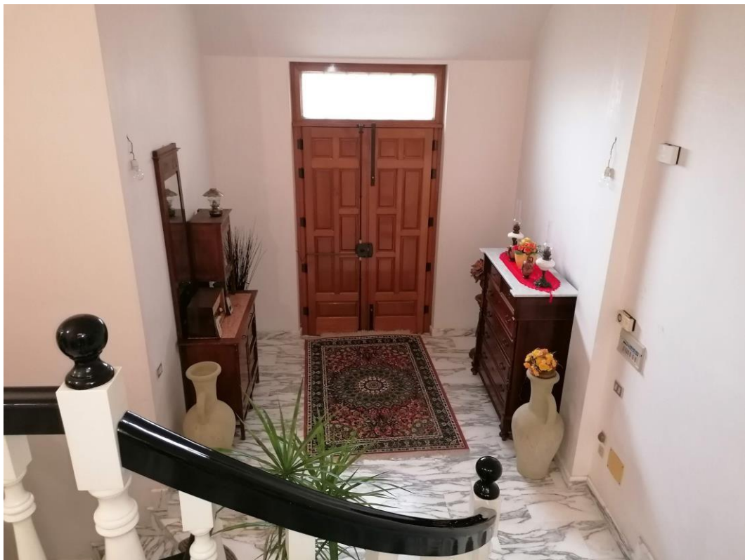
Foto n° 10 – Unità immobiliare al piano S1-S2-S3 del fabbricato sito in Niscemi c.da Spasimo/Pirillo. In Catasto al foglio 55 part.IIa 1371 sub 6; Androne di accesso al piano S1.