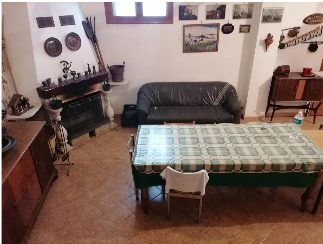
Foto n° 23 – Unità immobiliare al piano S1-S2-S3 del fabbricato sito in Niscemi c.da Spasimo/Pirillo. In Catasto al foglio 55 part.IIa 1371 sub 6; Soggiorno al piano S3.