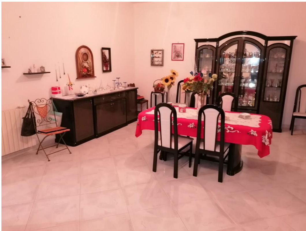
Foto n° 8 – Unità immobiliare al piano S1-S2-S3 del fabbricato sito in Niscemi c.da Spasimo/Pirillo. In Catasto al foglio 55 part.IIa 1371 sub 6; Salotto al piano S1.