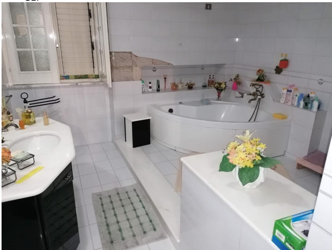
Foto n° 14 – Unità immobiliare al piano S1-S2-S3 del fabbricato sito in Niscemi c.da Spasimo/Pirillo. In Catasto al foglio 55 part.Ila 1371 sub 6; Servizio igienico al piano S2.