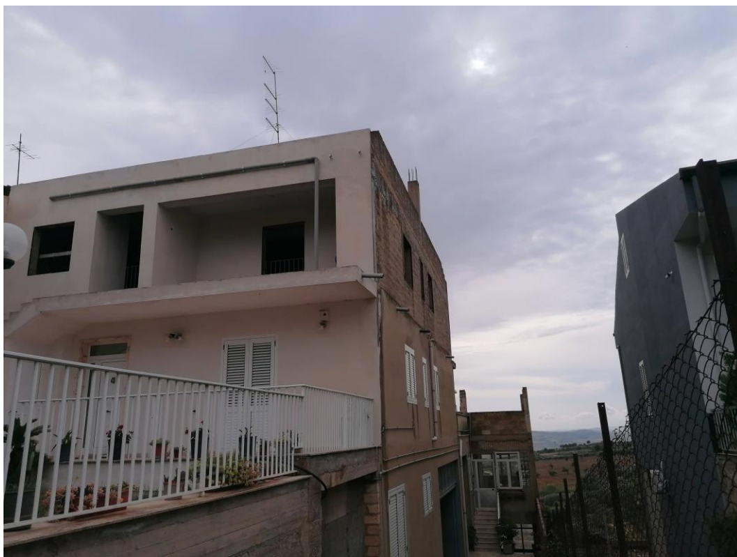
Foto n° 33 – Unità immobiliare al piano secondo del fabbricato sito in Niscemi c.da Spasimo/Pirillo. In Catasto al foglio 55 part.IIa 1371 sub 7; Prospetto est.