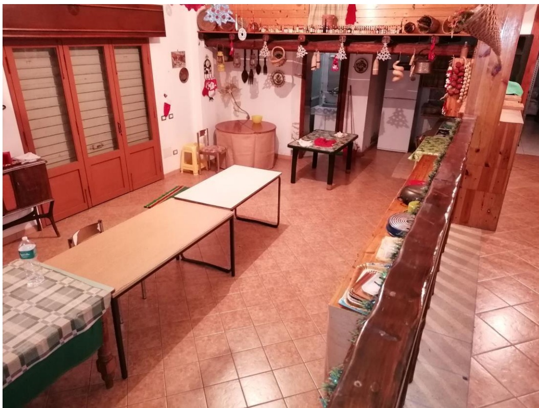
Foto n° 22 - Unità immobiliare al piano S1-S2-S3 del fabbricato sito in Niscemi c.da Spasimo/Pirillo. In Catasto al foglio 55 part.IIa 1371 sub 6; Soggiorno al piano S3.