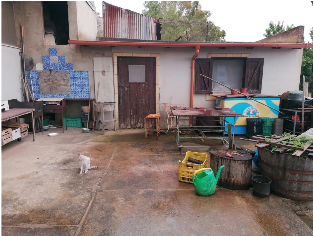
Foto n° 27 – Unità immobiliare al piano S1-S2-S3 del fabbricato sito in Niscemi c.da Spasimo/Pirillo. In Catasto al foglio 55 part.IIa 1371 sub 6; Locale Forno al piano S3.