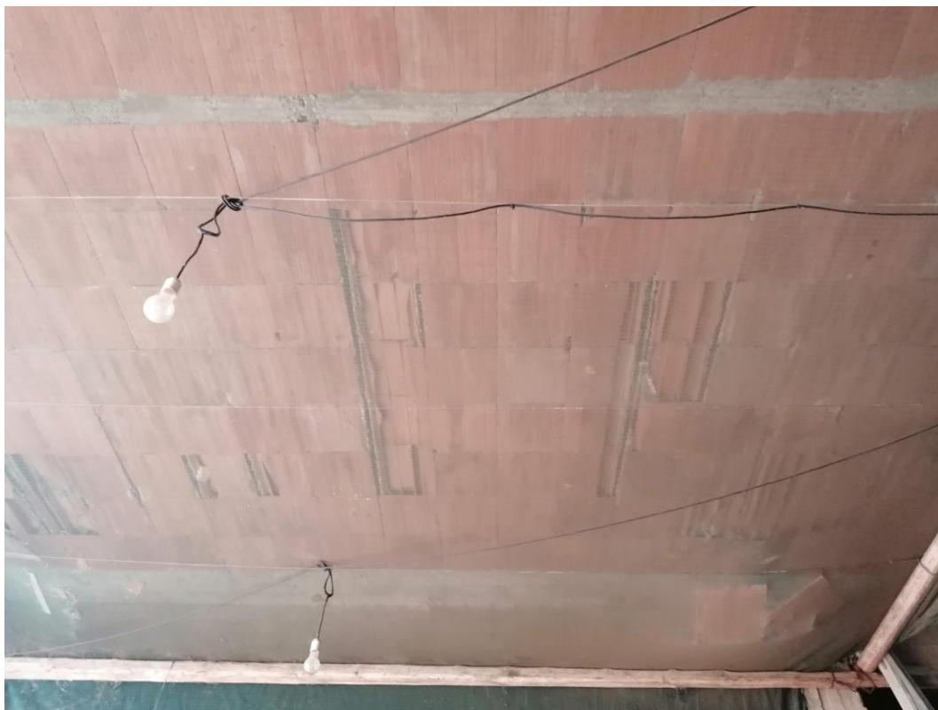
Foto n° 31 – Unità immobiliare al piano S1 del fabbricato sito in Niscemi c.da Spasimo/Pirillo. In Catasto al foglio 55 part.IIa 1371 sub 5; Vano Garage sfondellamento delle pignatte solaio di copertura.