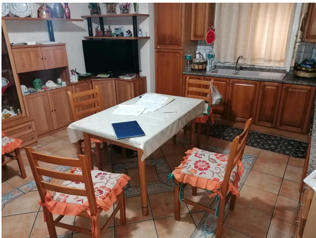
Foto n° 4 – Unità immobiliare al piano S1-S2-S3 del fabbricato sito in Niscemi c.da Spasimo/Pirillo. In Catasto al foglio 55 part.IIa 1371 sub 6; Cucina-soggiorno al piano S1.