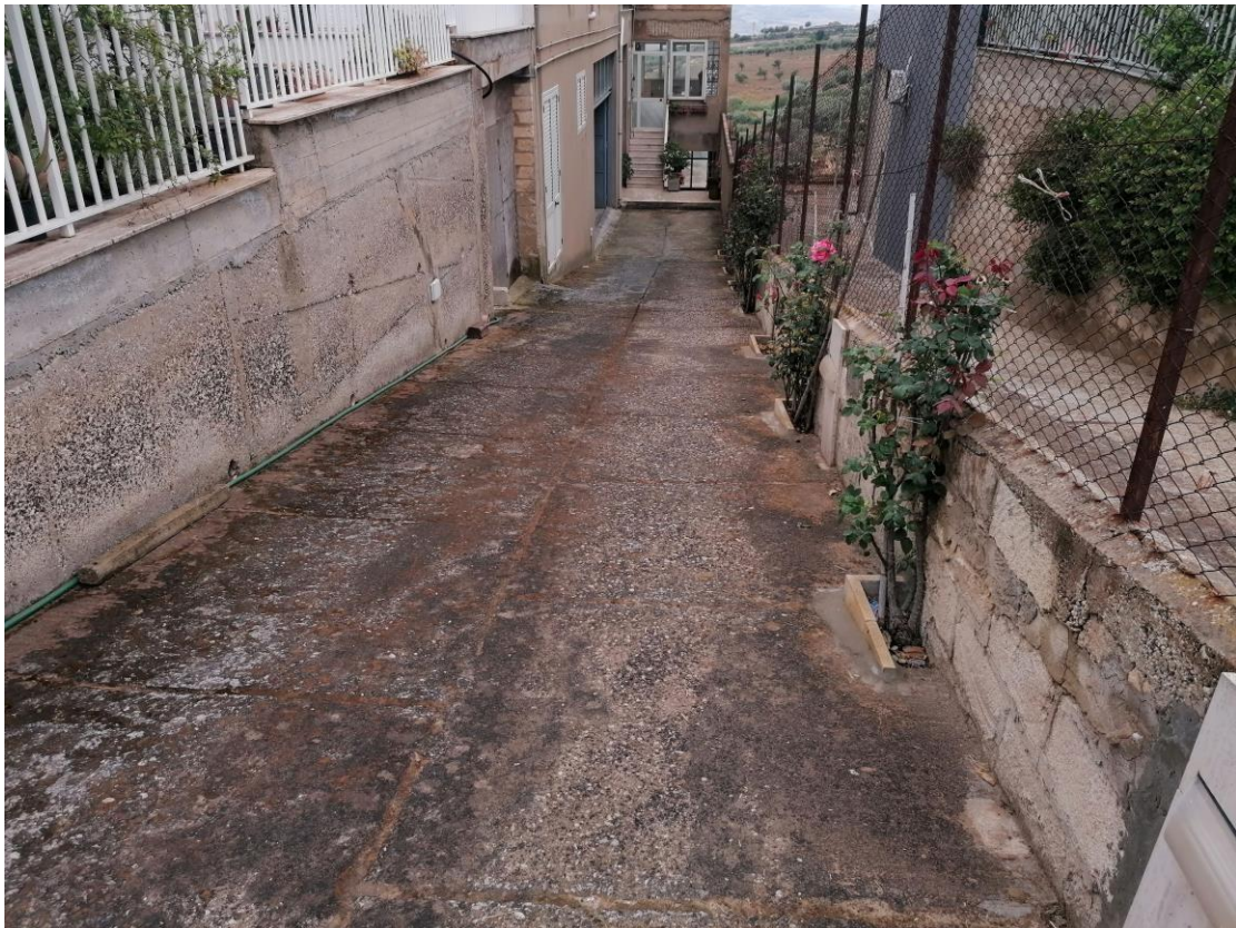
Foto n° 2 - Unità immobiliare al piano S1-S2-S3 del fabbricato sito in Niscemi c.da Spasimo/Pirillo. In Catasto al foglio 55 part.IIa 1371 sub 6; Corte interna di accesso al bene lato est.