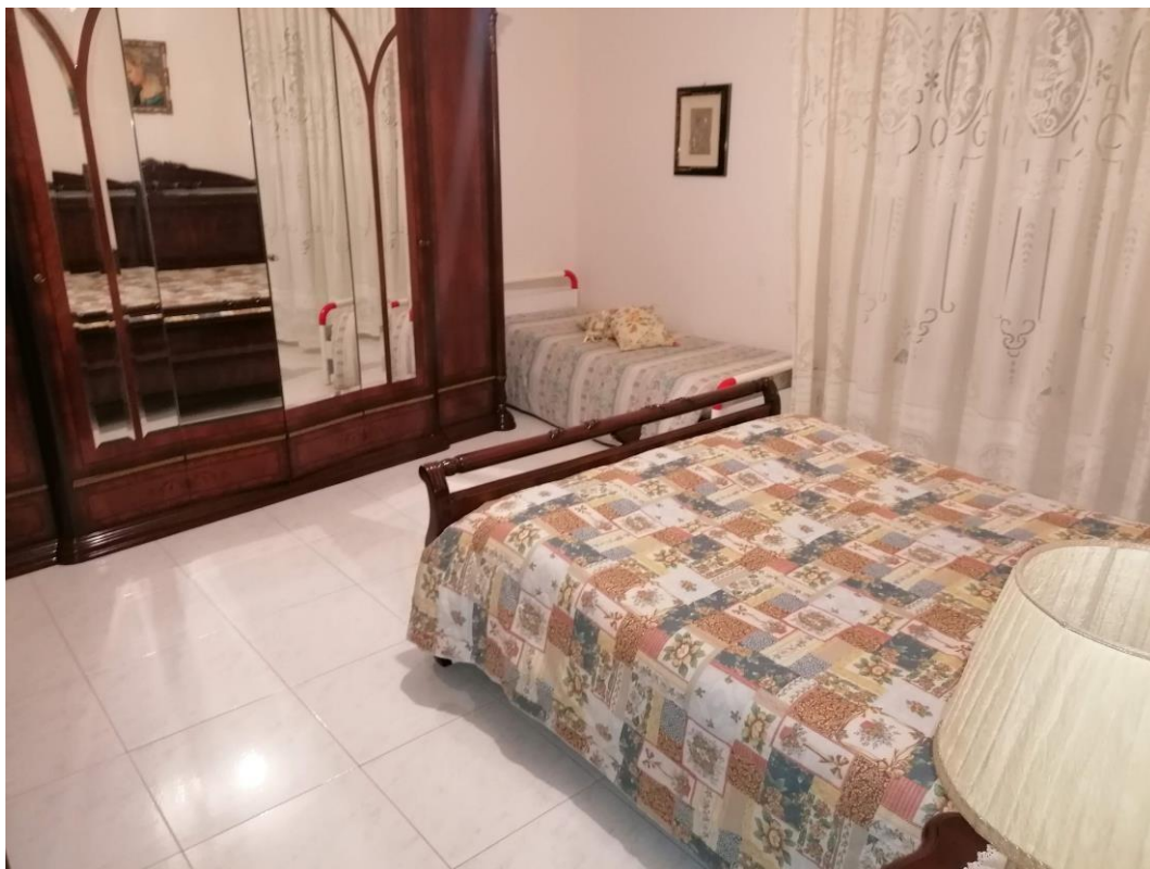
Foto n° 17 – Unità immobiliare al piano S1-S2-S3 del fabbricato sito in Niscemi c.da Spasimo/Pirillo. In Catasto al foglio 55 part.IIa 1371 sub 6; Camera da letto al piano S2.