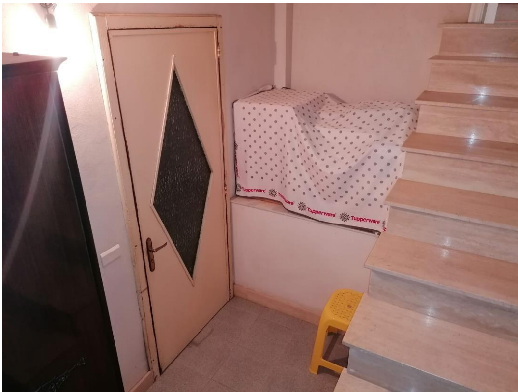
Foto n° 21 - Unità immobiliare al piano S1-S2-S3 del fabbricato sito in Niscemi c.da Spasimo/Pirillo. In Catasto al foglio 55 part.IIa 1371 sub 6; Disimpegno al piano S3.