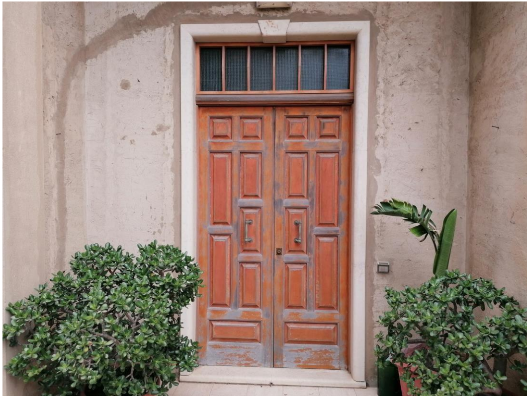
Foto n° 1 - Unità immobiliare al piano S1-S2-S3 del fabbricato sito in Niscemi c.da Spasimo/Pirillo. In Catasto al foglio 55 part.IIa 1371 sub 6; Porta di accesso al bene collocata nella corte interna.