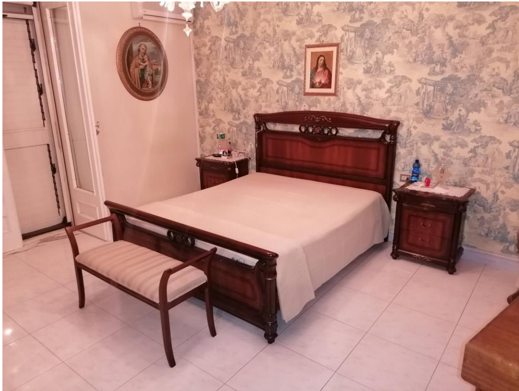
Foto n° 15 – Unità immobiliare al piano S1-S2-S3 del fabbricato sito in Niscemi c.da Spasimo/Pirillo. In Catasto al foglio 55 part.IIa 1371 sub 6; Camera da letto al piano S2.