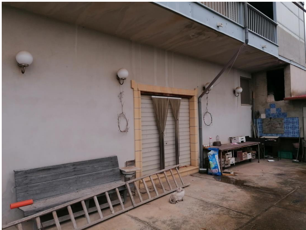
Foto n° 28 – Unità immobiliare al piano S1-S2-S3 del fabbricato sito in Niscemi c.da Spasimo/Pirillo. In Catasto al foglio 55 part.IIa 1371 sub 6; Varco di accesso al sub 8 al piano S3.