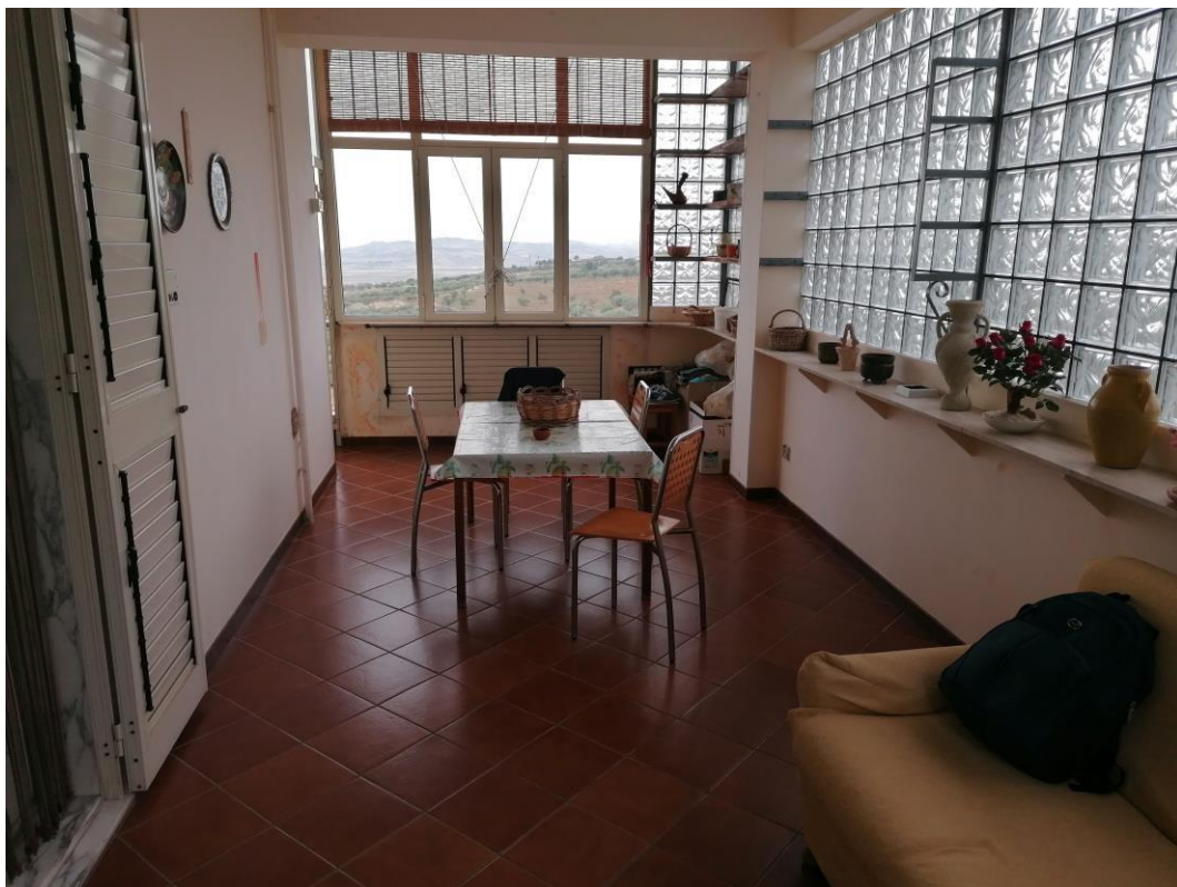
Foto n° 3 – Unità immobiliare al piano S1-S2-S3 del fabbricato sito in Niscemi c.da Spasimo/Pirillo. In Catasto al foglio 55 part.IIa 1371 sub 6; Veranda al piano S1.