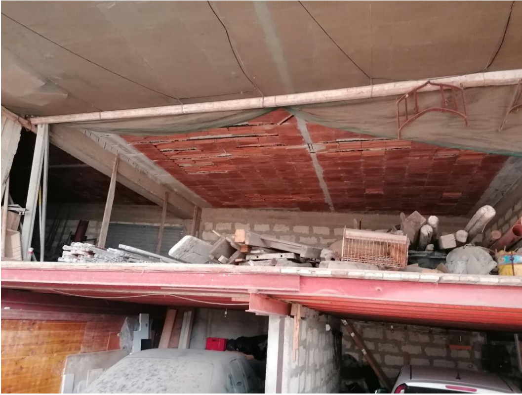
Foto n° 30 – Unità immobiliare al piano S1 del fabbricato sito in Niscemi c.da Spasimo/Pirillo. In Catasto al foglio 55 part.IIIa 1371 sub 5; Vano Garage, soppalco e sfondellamento pignatte.