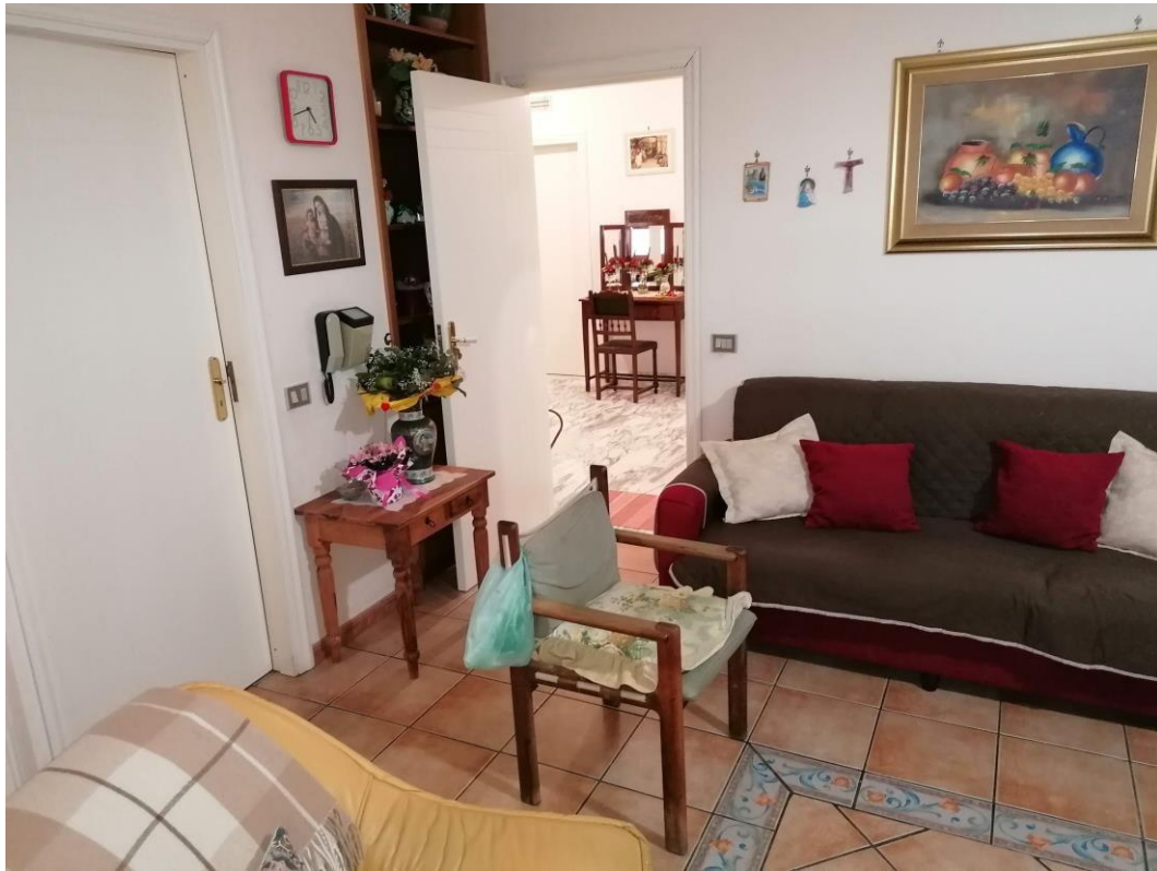
Foto n° 5 – Unità immobiliare al piano S1-S2-S3 del fabbricato sito in Niscemi c.da Spasimo/Pirillo. In Catasto al foglio 55 part.IIa 1371 sub 6; Cucina-soggiorno al piano S1.