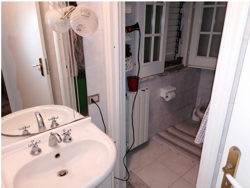
Foto n° 6 – Unità immobiliare al piano S1-S2-S3 del fabbricato sito in Niscemi c.da Spasimo/Pirillo. In Catasto al foglio 55 part.IIa 1371 sub 6; Servizio igienico al piano S1.