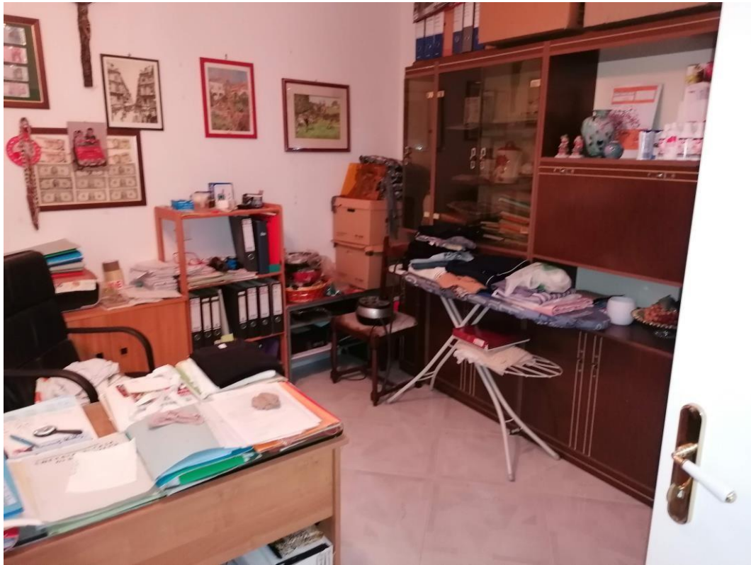
Foto n° 9 – Unità immobiliare al piano S1-S2-S3 del fabbricato sito in Niscemi c.da Spasimo/Pirillo. In Catasto al foglio 55 part.IIa 1371 sub 6; Studio al piano S1.