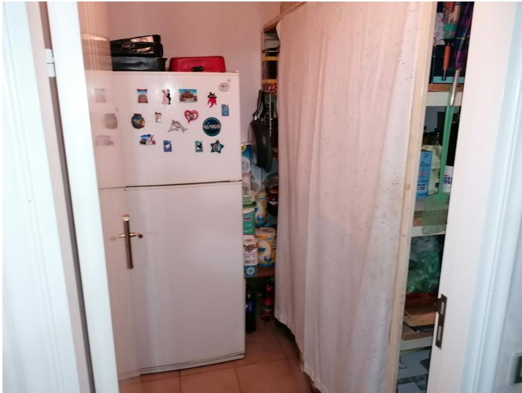
Foto n° 7 – Unità immobiliare al piano S1-S2-S3 del fabbricato sito in Niscemi c.da Spasimo/Pirillo. In Catasto al foglio 55 part.IIa 1371 sub 6; Ripostiglio al piano S1.