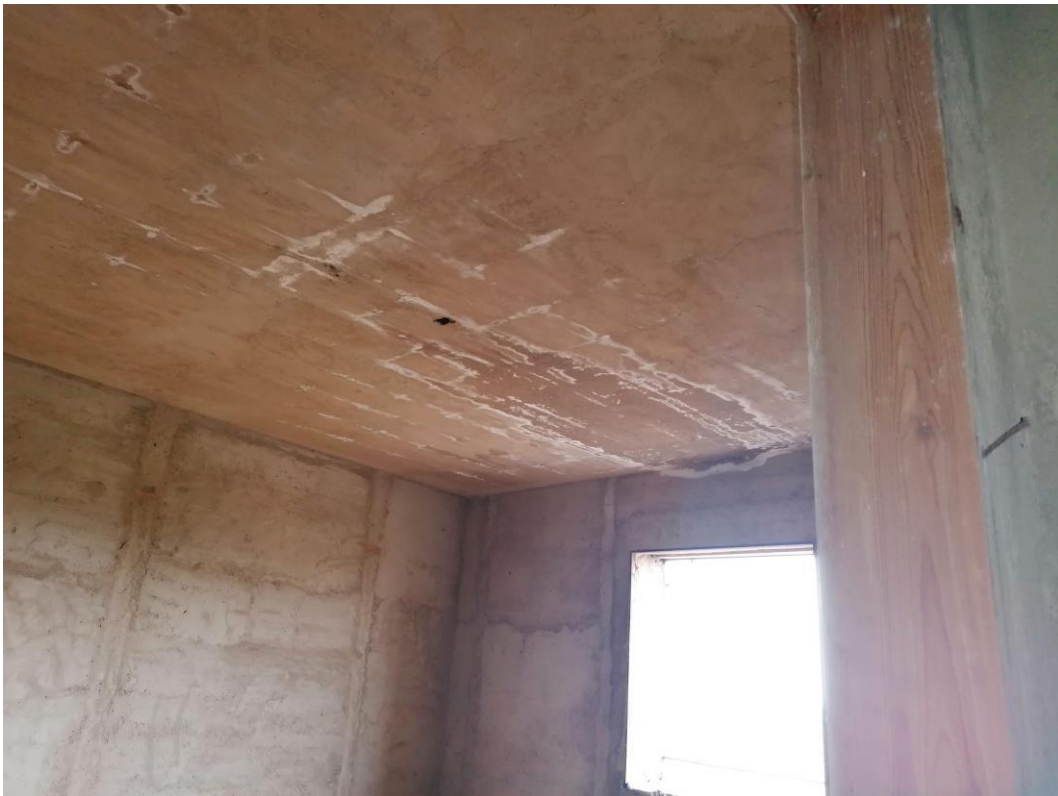
Foto n° 36 – Unità immobiliare al piano secondo del fabbricato sito in Niscemi c.da Spasimo/Pirillo. In Catasto al foglio 55 part.IIa 1371 sub 7; Veduta interna relativa al soffitto.