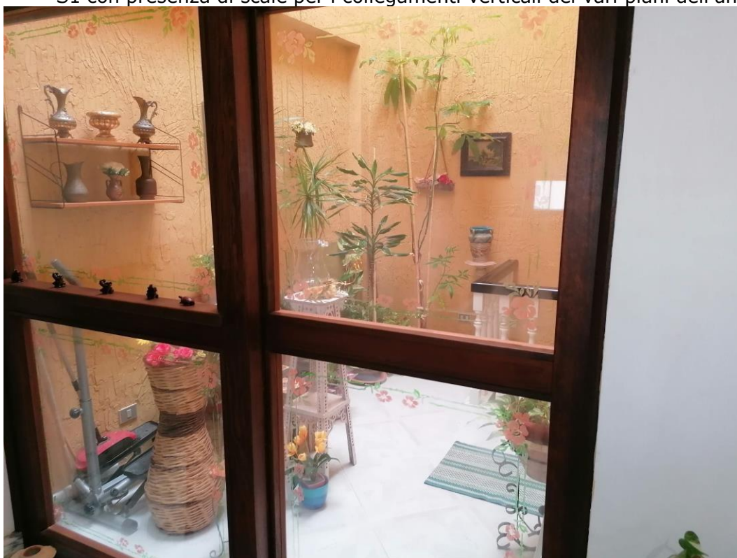
Foto n° 12 - Unità immobiliare al piano S1-S2-S3 del fabbricato sito in Niscemi c.da Spasimo/Pirillo. In Catasto al foglio 55 part.Ila 1371 sub 6; Pozzo luce al piano S1.