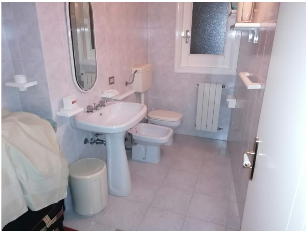
Foto n° 18 – Unità immobiliare al piano S1-S2-S3 del fabbricato sito in Niscemi c.da Spasimo/Pirillo. In Catasto al foglio 55 part.IIa 1371 sub 6; Servizio igienico al piano S2.