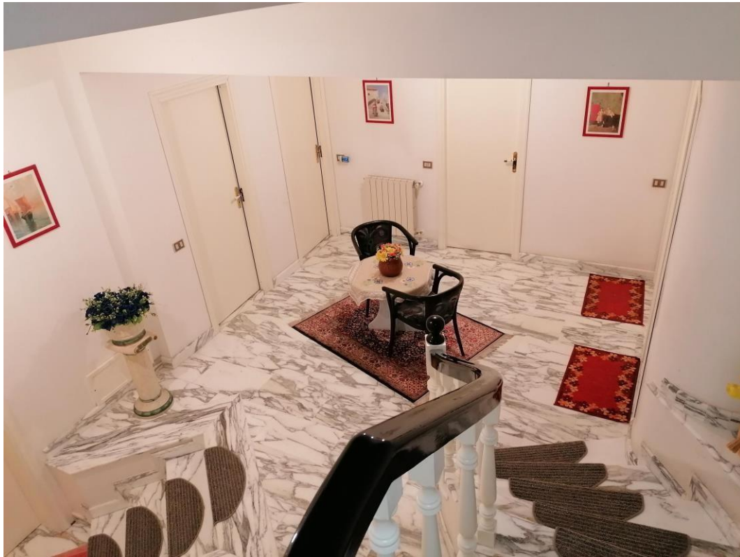
Foto n° 13 – Unità immobiliare al piano S1-S2-S3 del fabbricato sito in Niscemi c.da Spasimo/Pirillo. In Catasto al foglio 55 part.Ila 1371 sub 6; Disimpegno al piano S2.