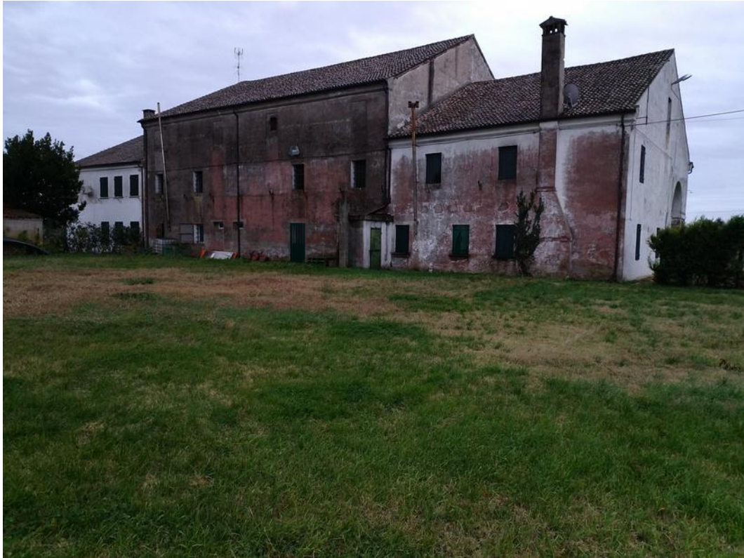
Foto 5 Scorcio dell'edificio.