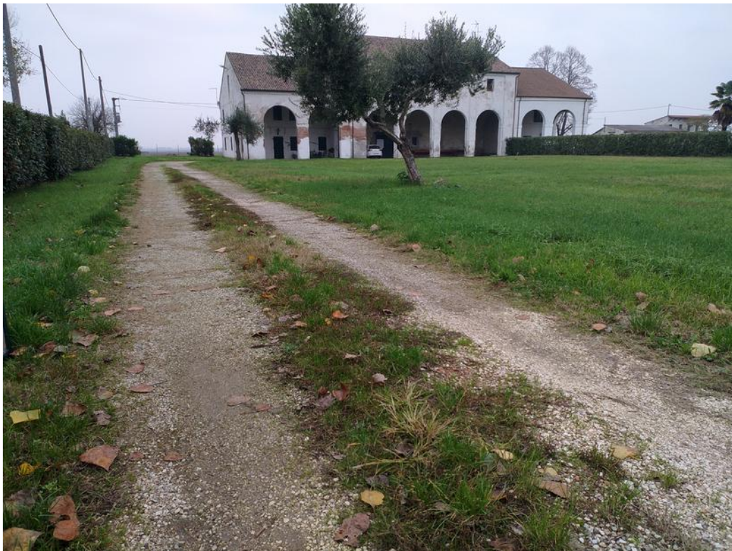
Foto 2 Vista dell'edificio.