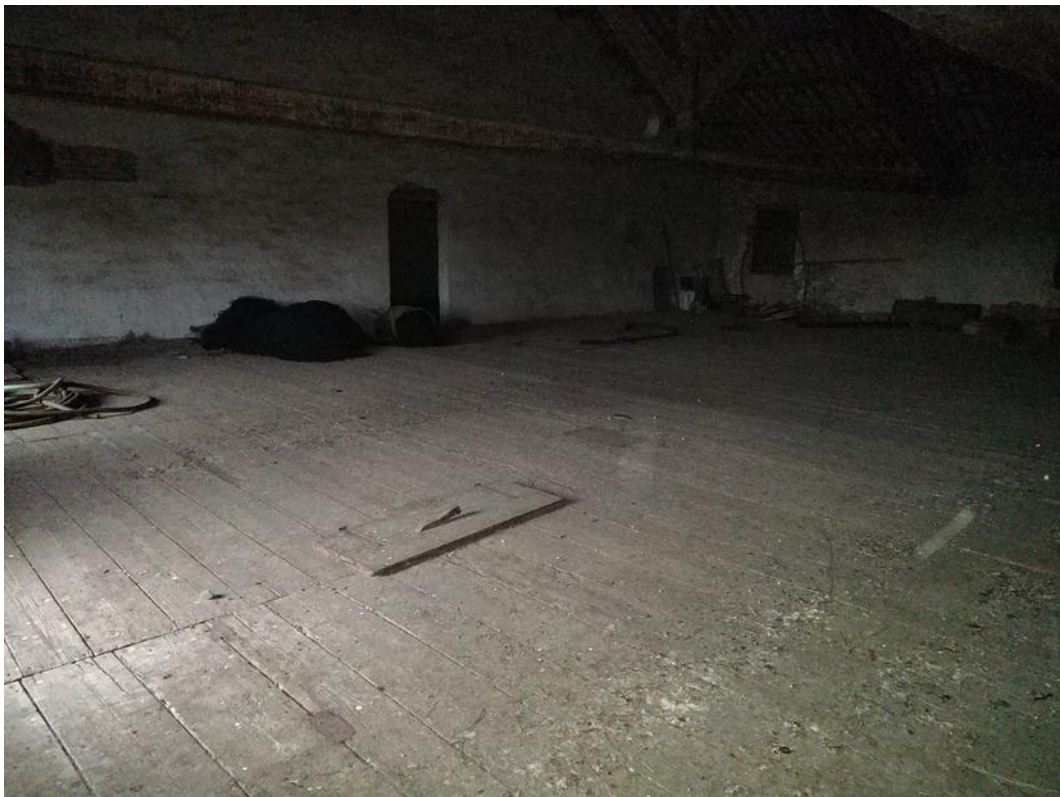
Foto 26 Scorcio del granaio nel sottotetto.