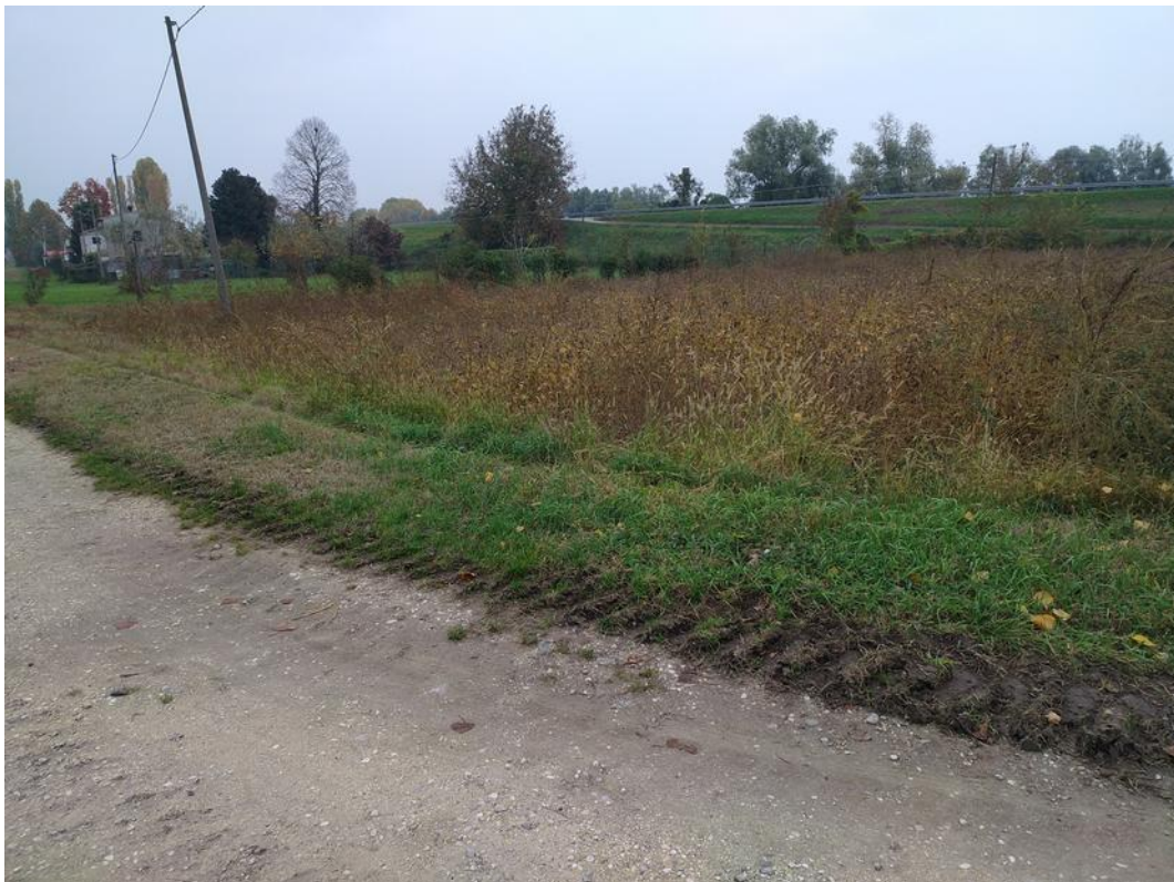
Foto 8 Scorcio del terreno oggetto di esecuzione, verso Sud.