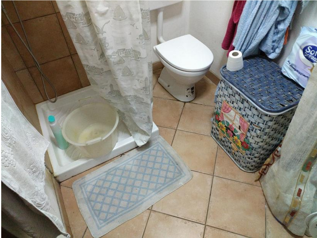
Foto 15 Scorcio del WC ricavato al piano terra.