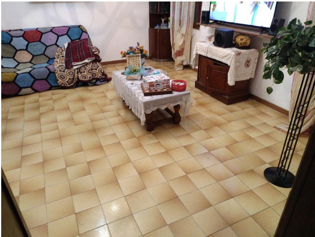
Foto 14 Zona giorno al piano terra.