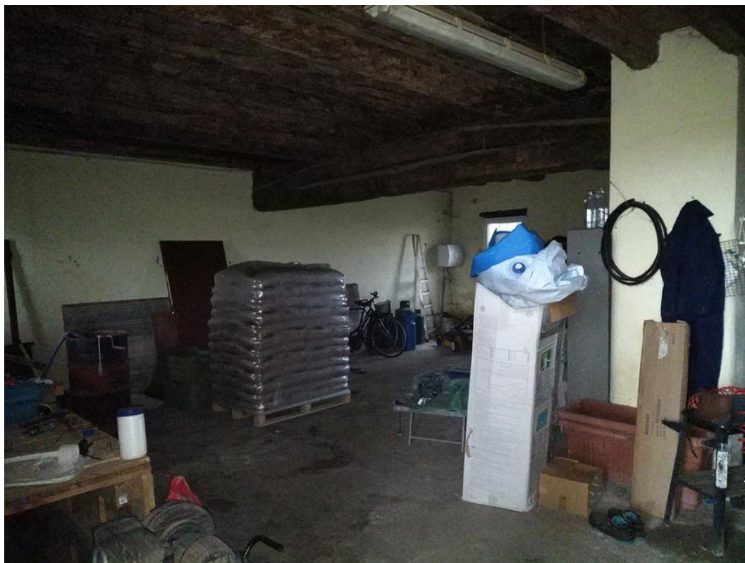
Foto 20 Vista del magazzino a piano terra.