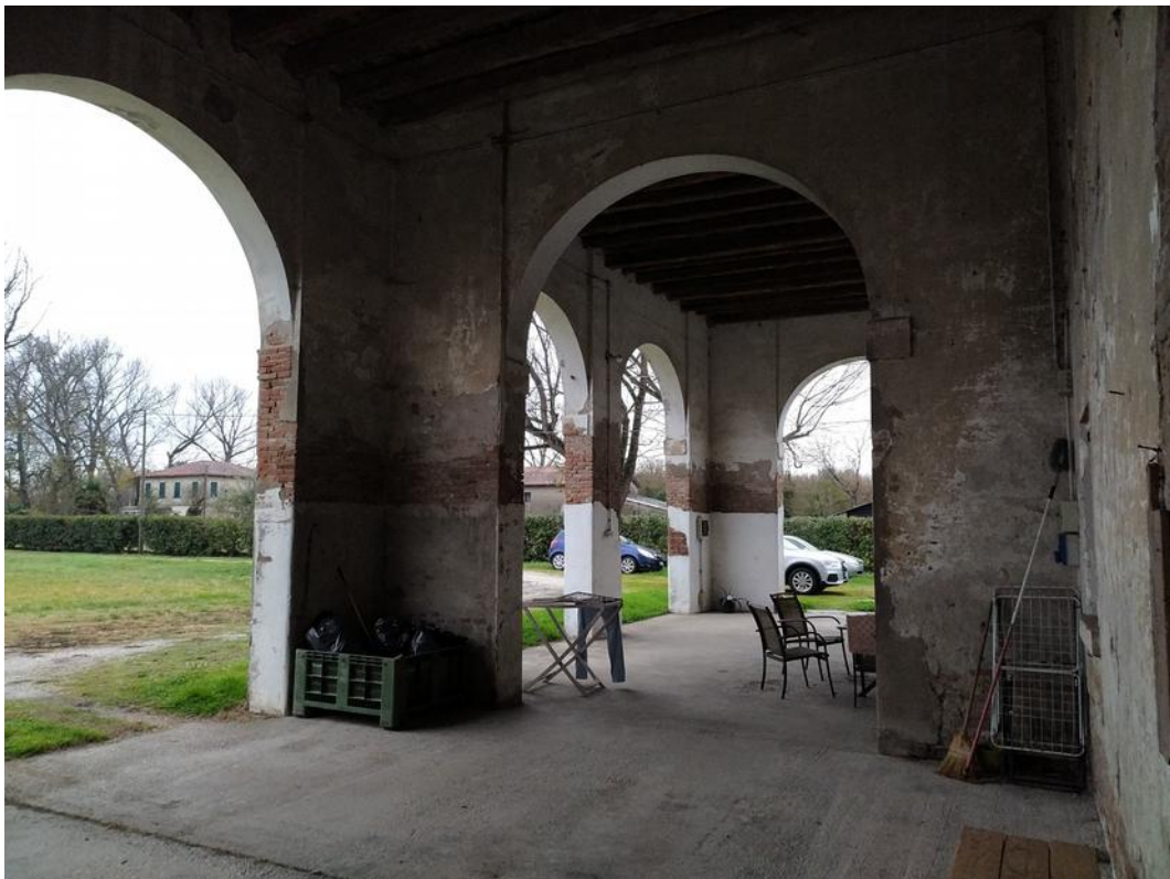
Foto 10 Vista del portico.