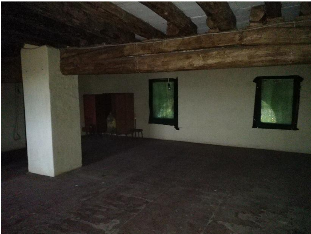
Foto 24 Particolare del magazzino/granaio a P1.