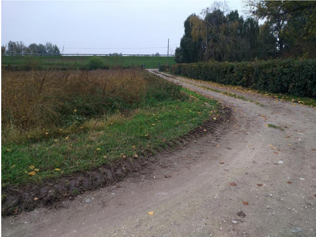
Foto 7 Scorcio del terreno oggetto di esecuzione, verso Sud.