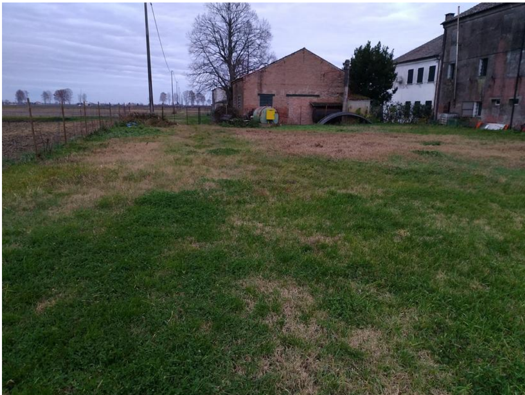
Foto 6 Vista del terreno di pertinenza verso Nord.