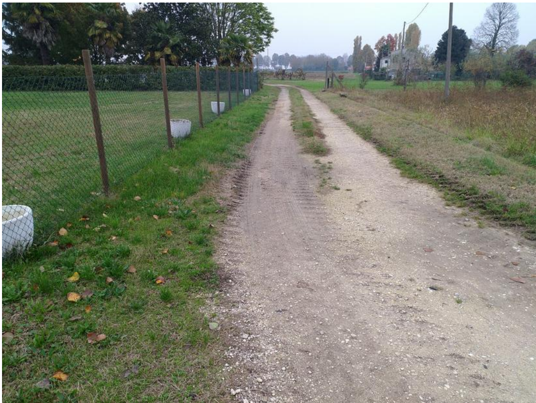
Foto 4 Particolare della servitù di passaggio a favore di terzi.