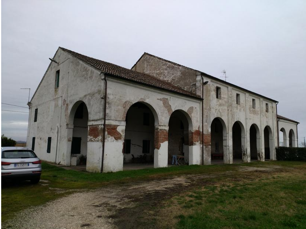
Foto 9 Vista dell'edificio.