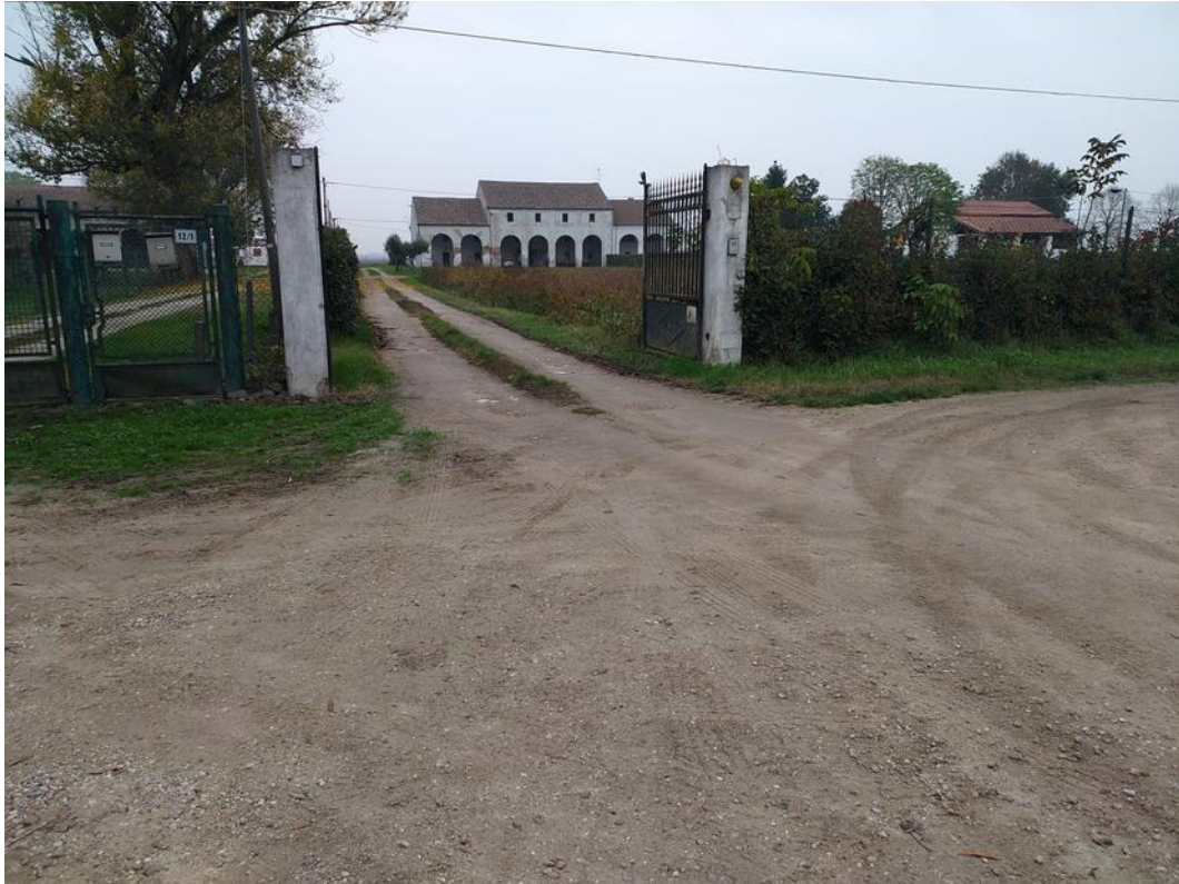
Foto 1 Scorcio dei lotti oggetto di stima.