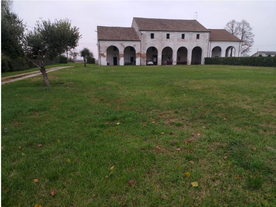
Foto 3 Vista dell'edificio e del terreno di pertinenza.