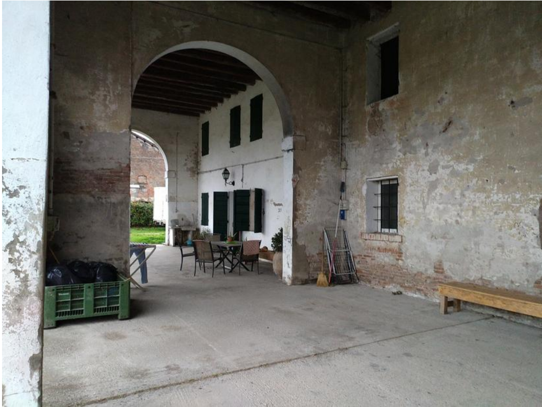
Foto 11 Vista del portico.