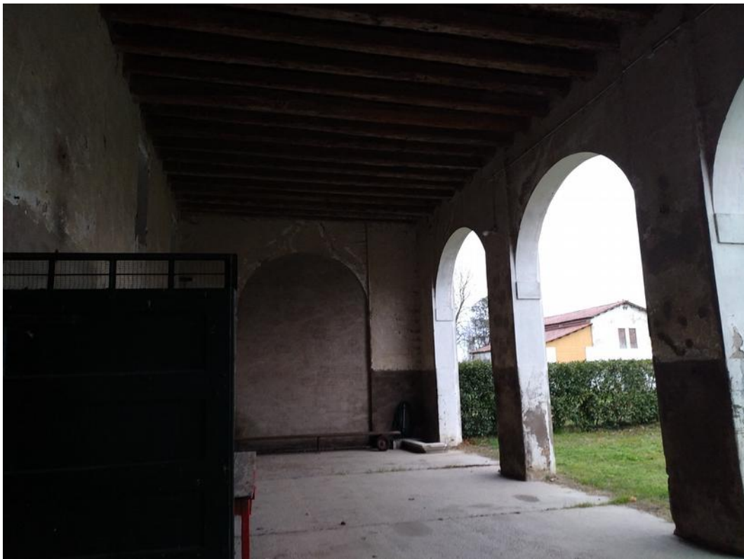
Foto 12 Vista del portico.