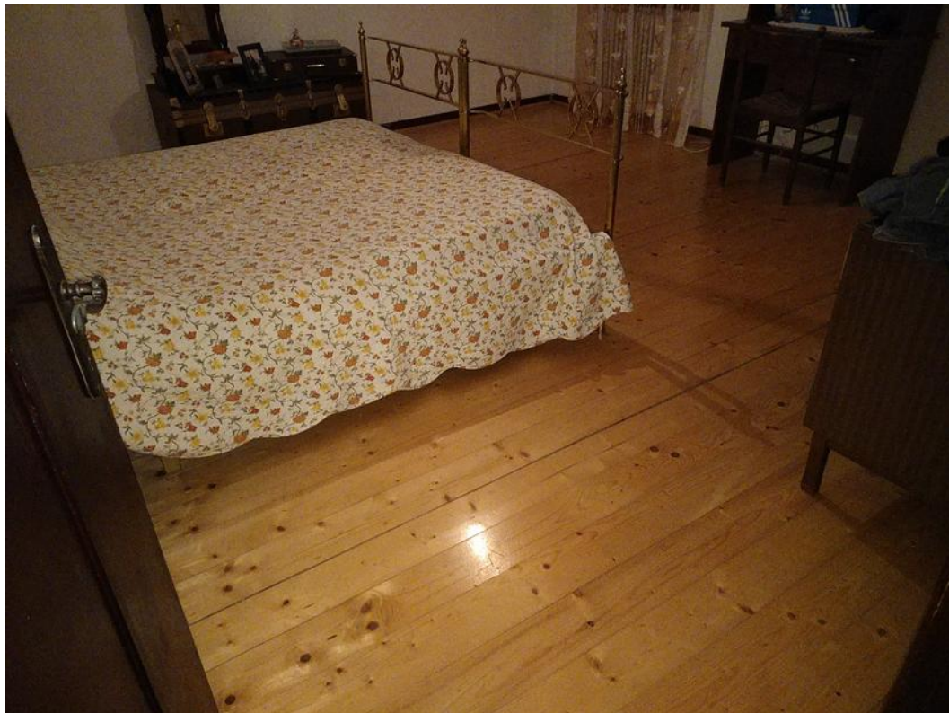
Foto 19 Particolare di una camera.