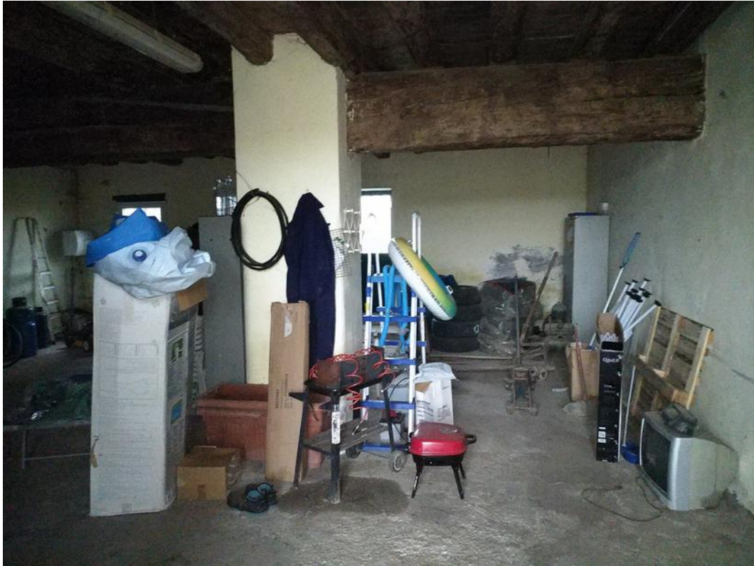
Foto 21 Vista del magazzino a piano terra.