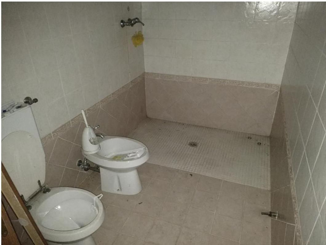
Foto 22 Particolare di un wc ricavato nel magazzino a PT.