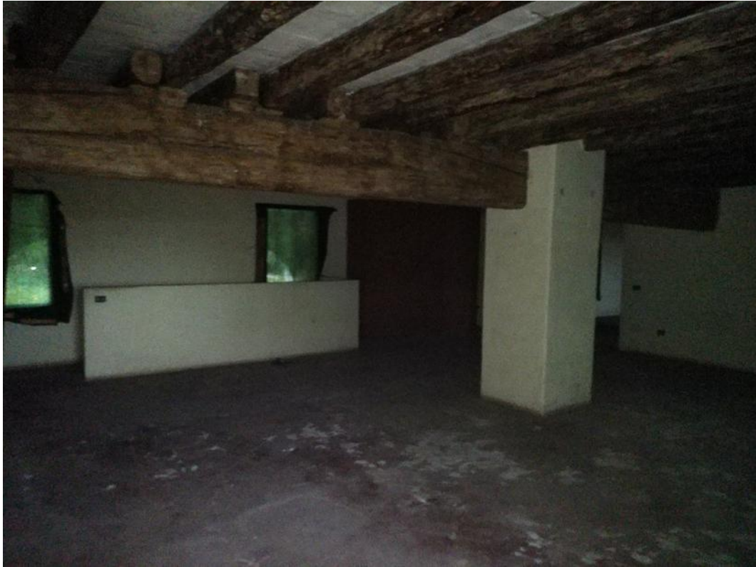
Foto 25 Particolare del magazzino/granaio a P1.