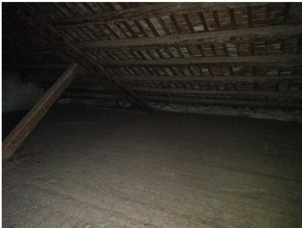
Foto 28 Particolare della struttura di copertura.