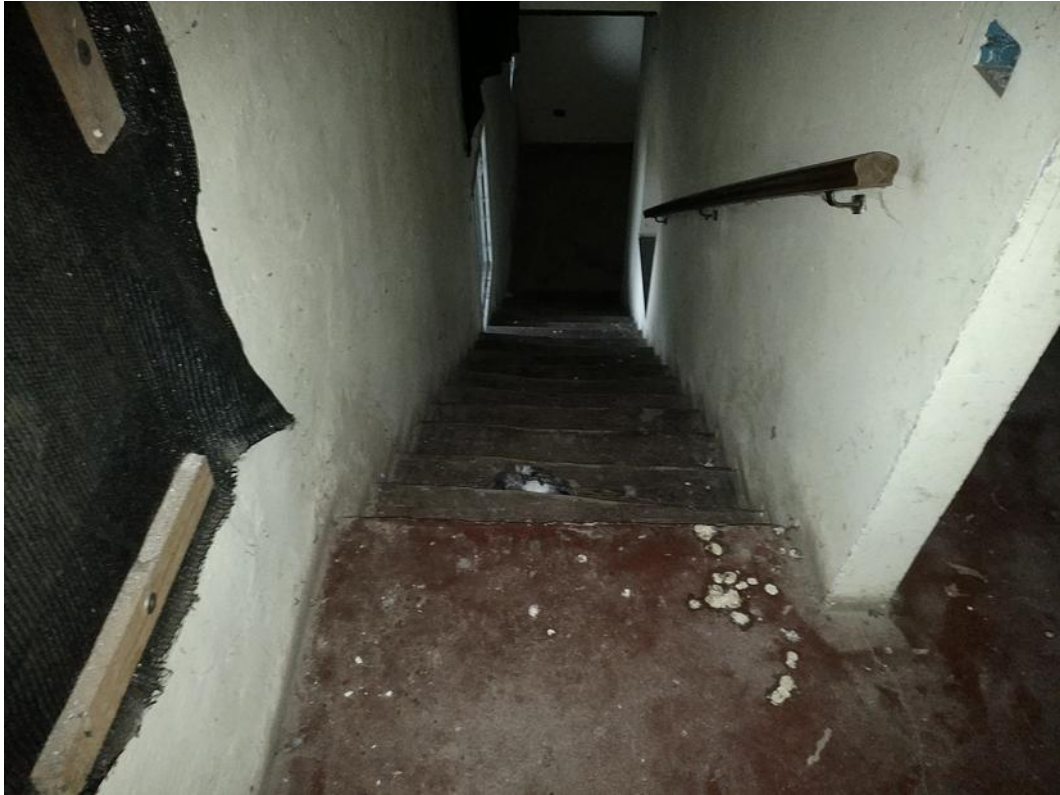
Foto 23 Scorcio della scala di accesso al piano primo.