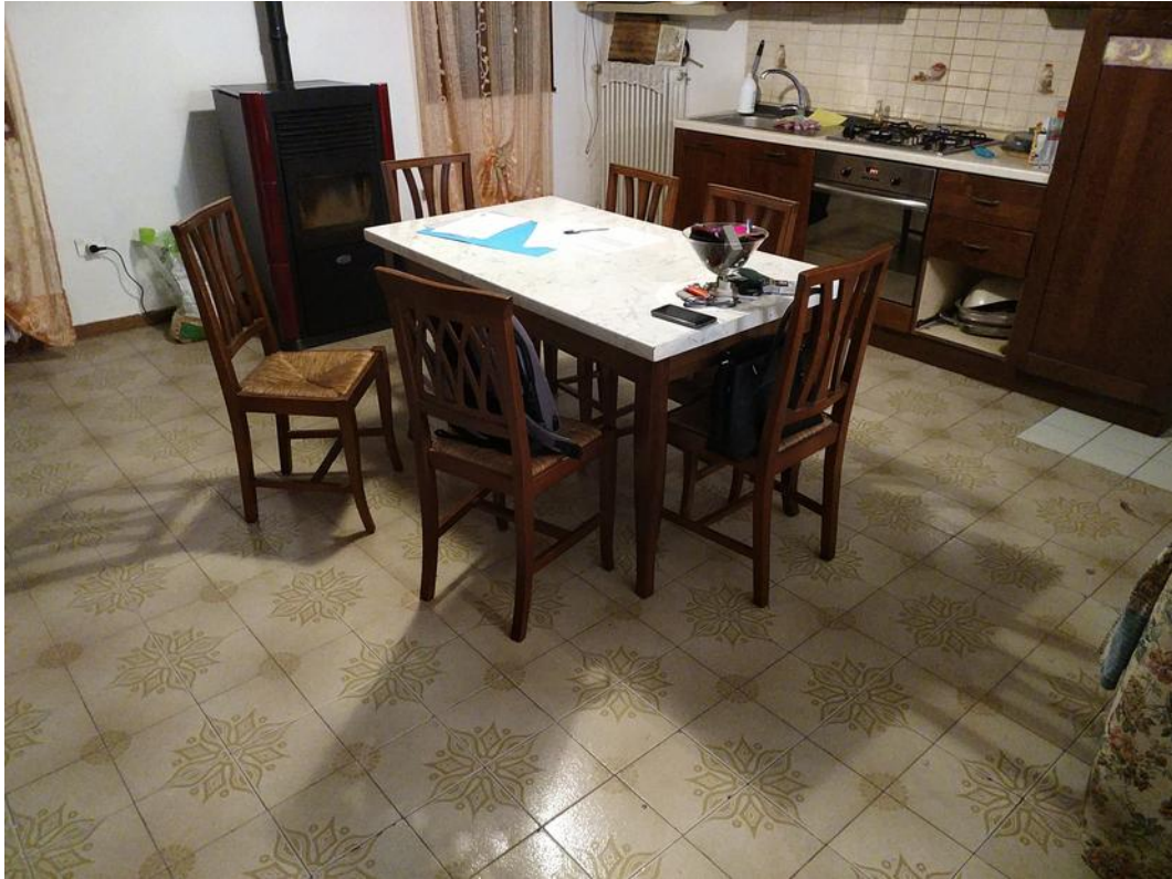
Foto 13 Zona giorno al piano terra.