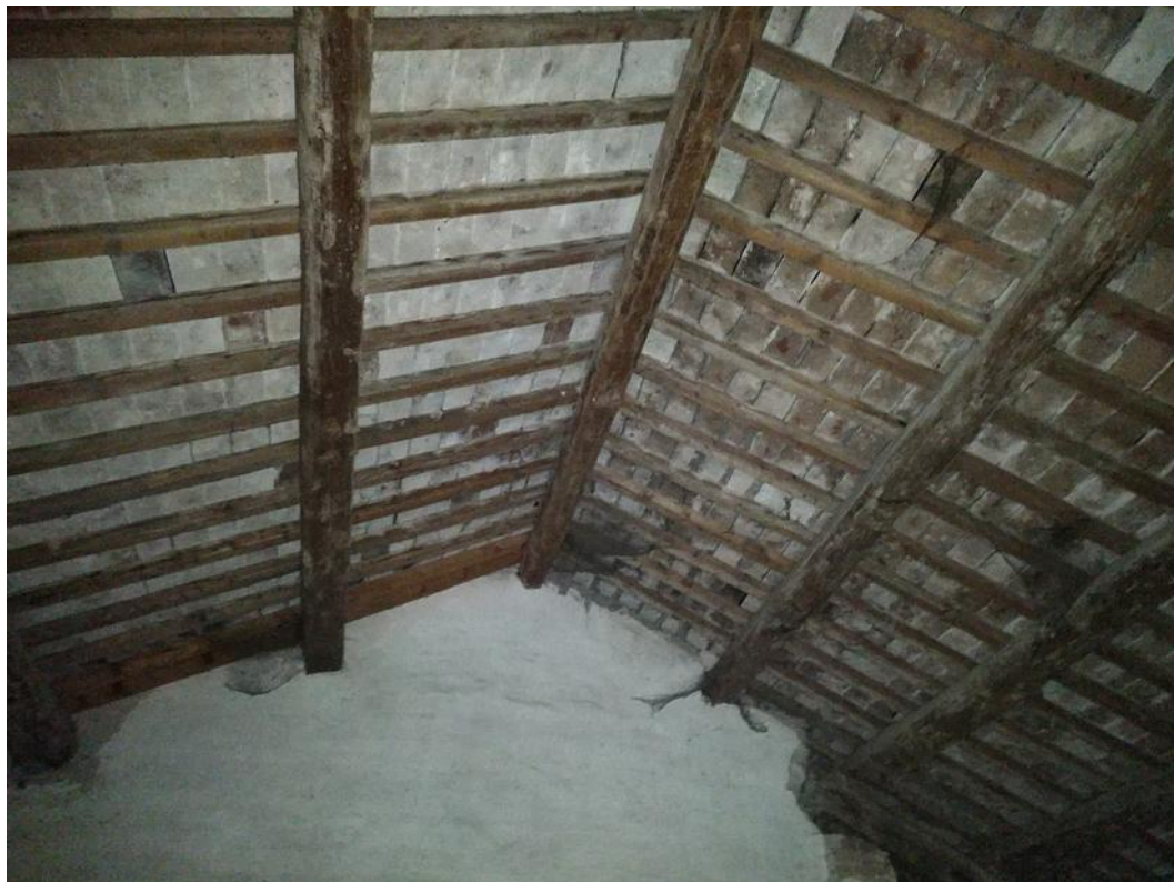
Foto 27 Particolare della struttura di copertura.