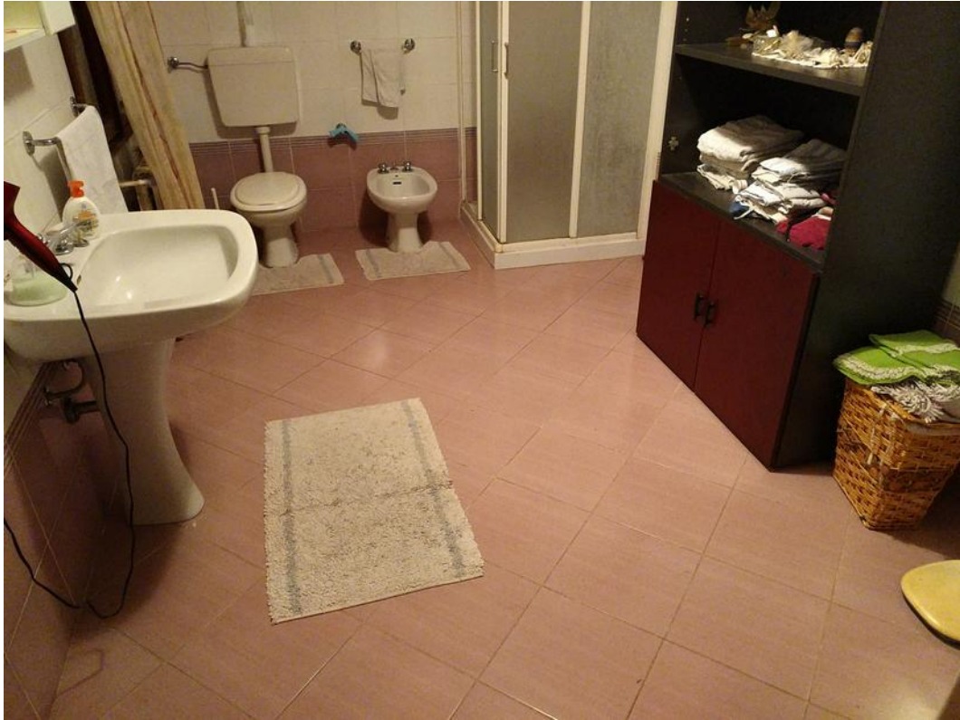
Foto 17 Vista del bagno ricavato al piano primo.