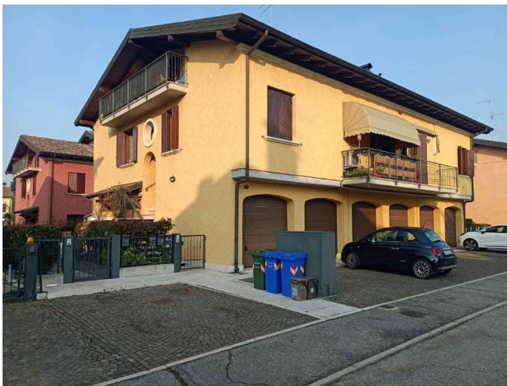
Foto n. 1 – Fronti Sud e Ovest del fabbricato condominiale di cui al mappale 767.