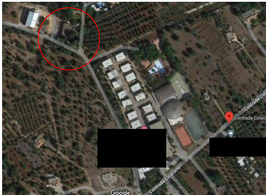
Foto satellitare n.2