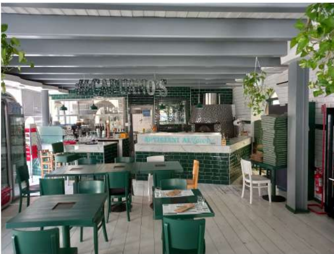
Unità sub 19