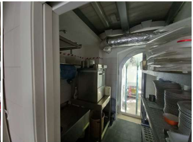
Unità sub 19 (locali cucina)