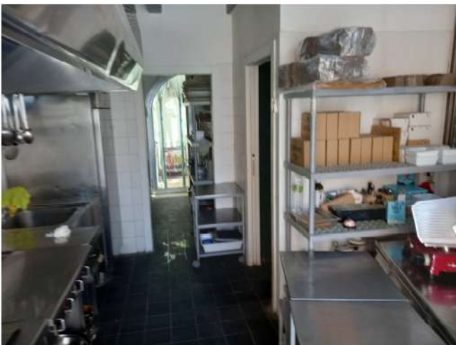
Unità sub 19 (locali cucina)