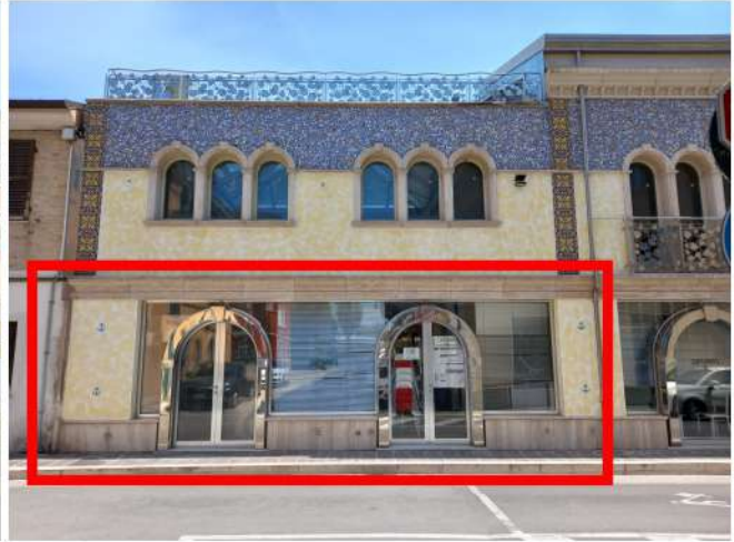
Unità sub 19