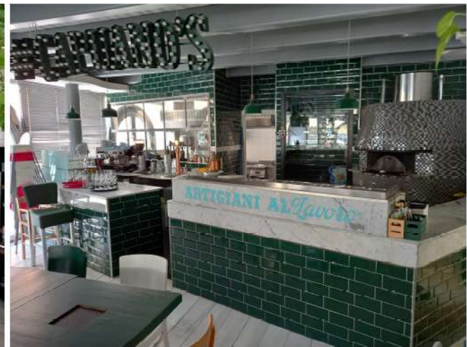
Unità sub 19