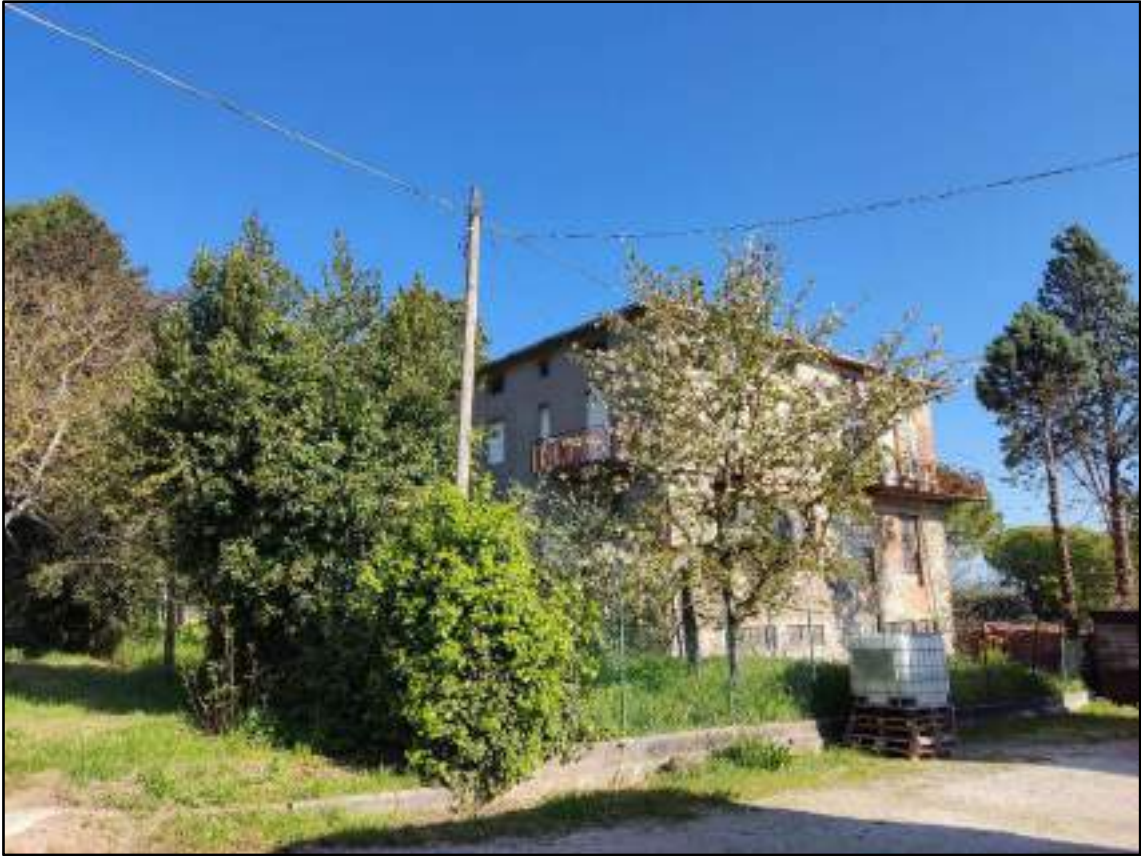
vista prospetto est