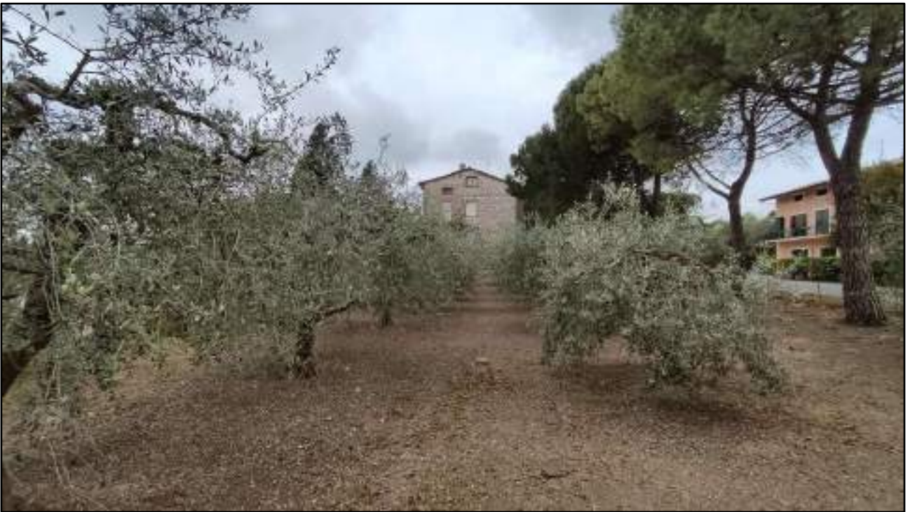
vista terreno corte