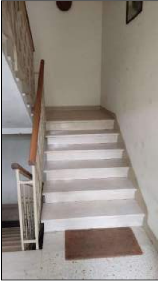
vista vano scala