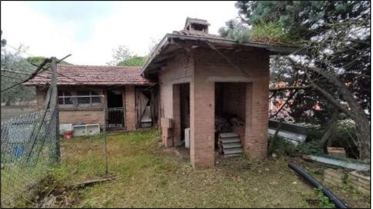
vista accessorio pertinenziale