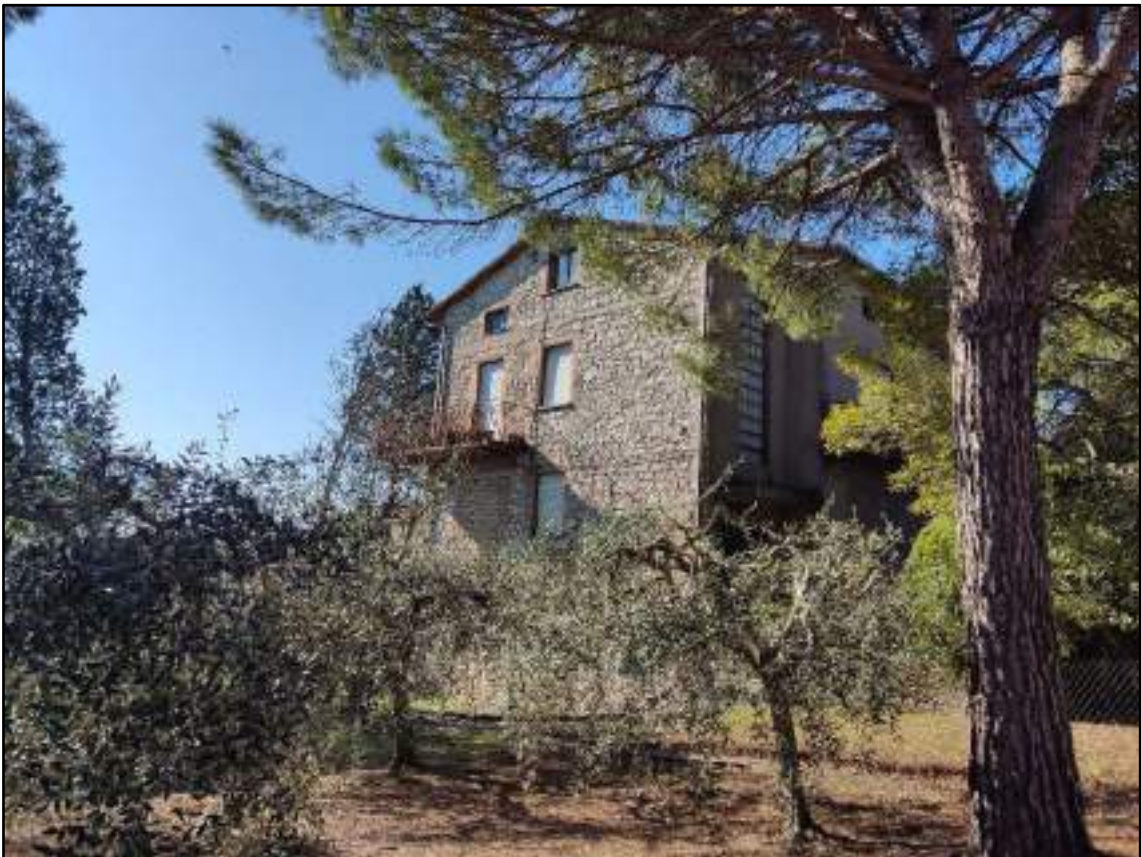
vista prospetto nord