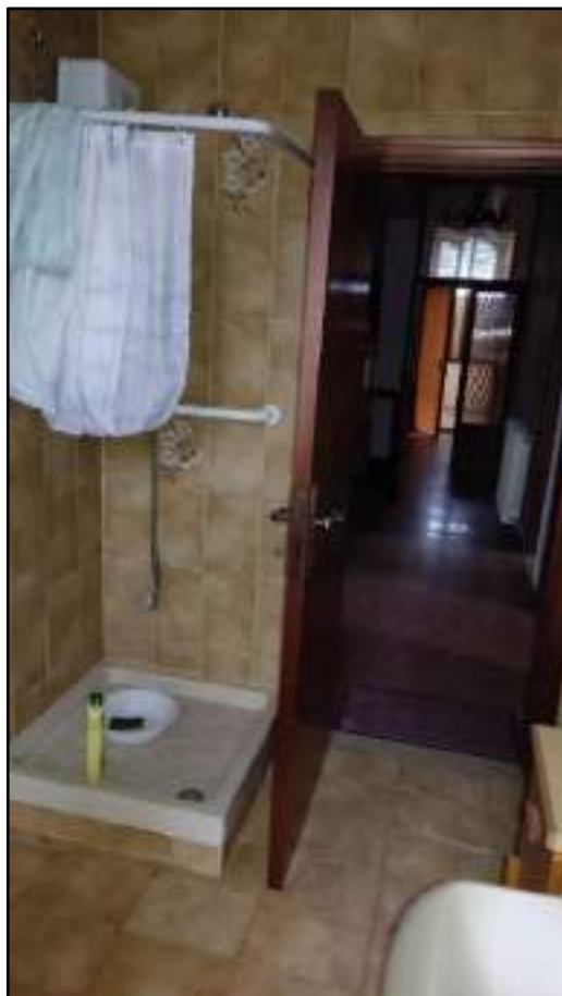
vista interni appartamento piano primo