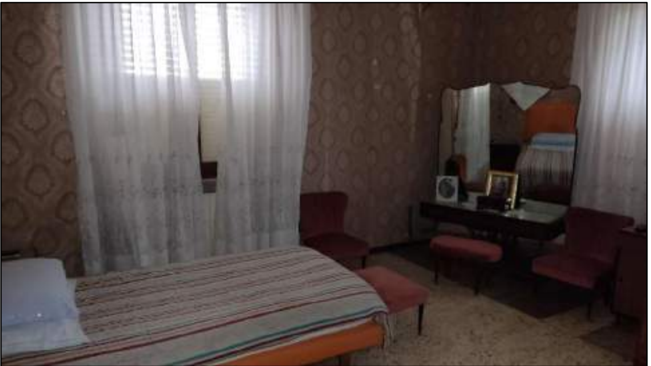
vista interni appartamento piano primo