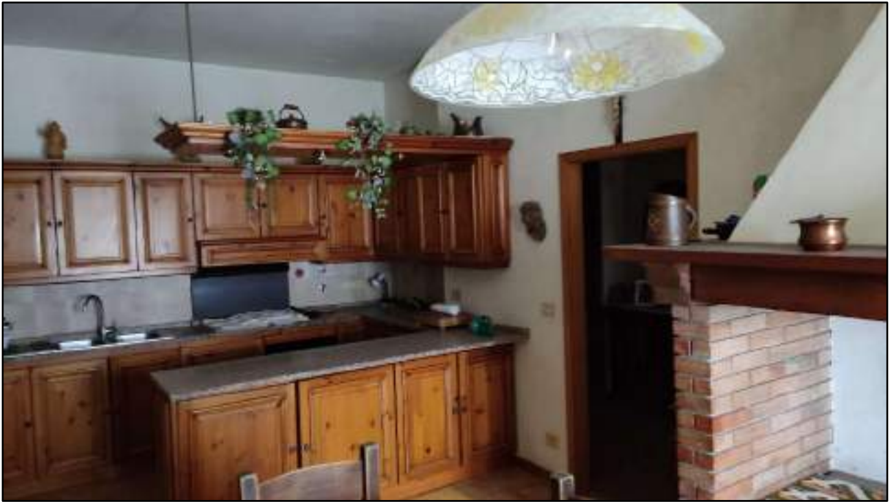
vista interni appartamento piano primo