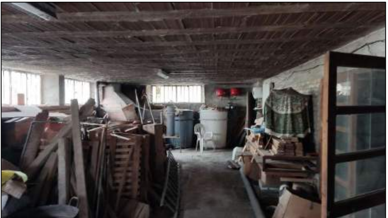
vista interni fondo-cantina piano primo sottostrada