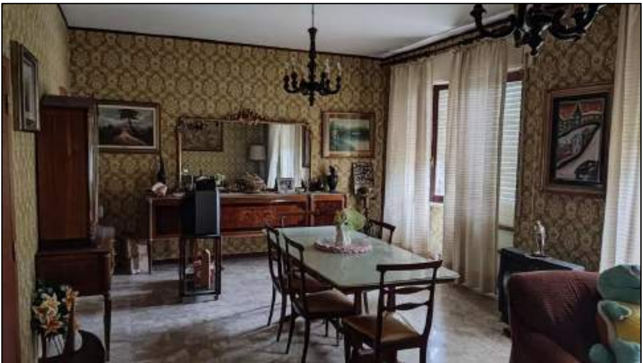
vista interni appartamento piano primo