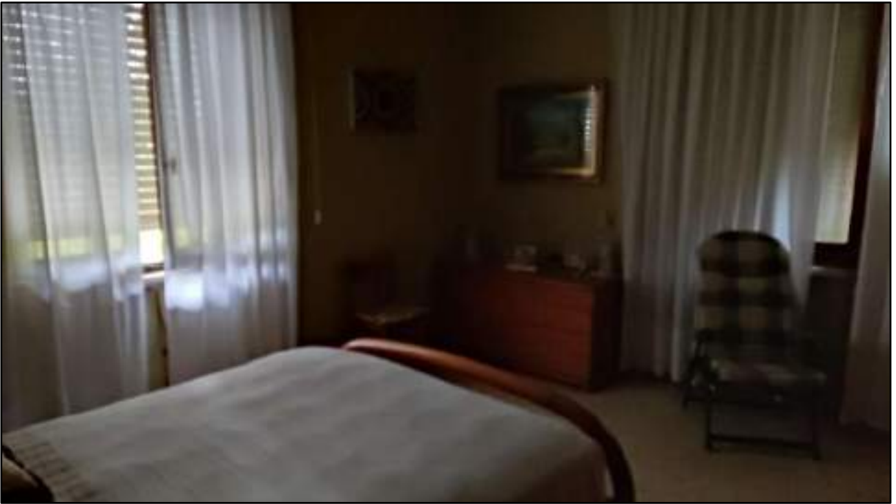
vista interni appartamento piano primo