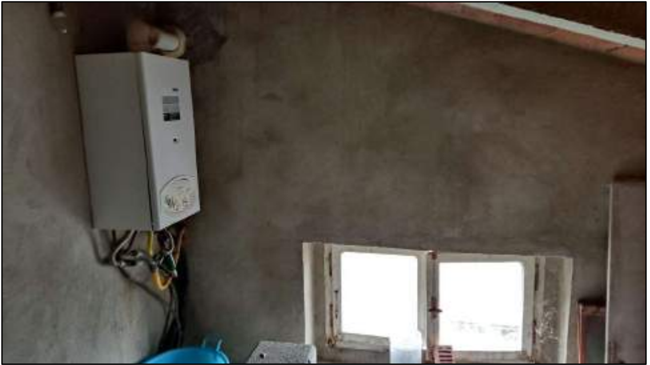
vista interni soffitta piano secondo