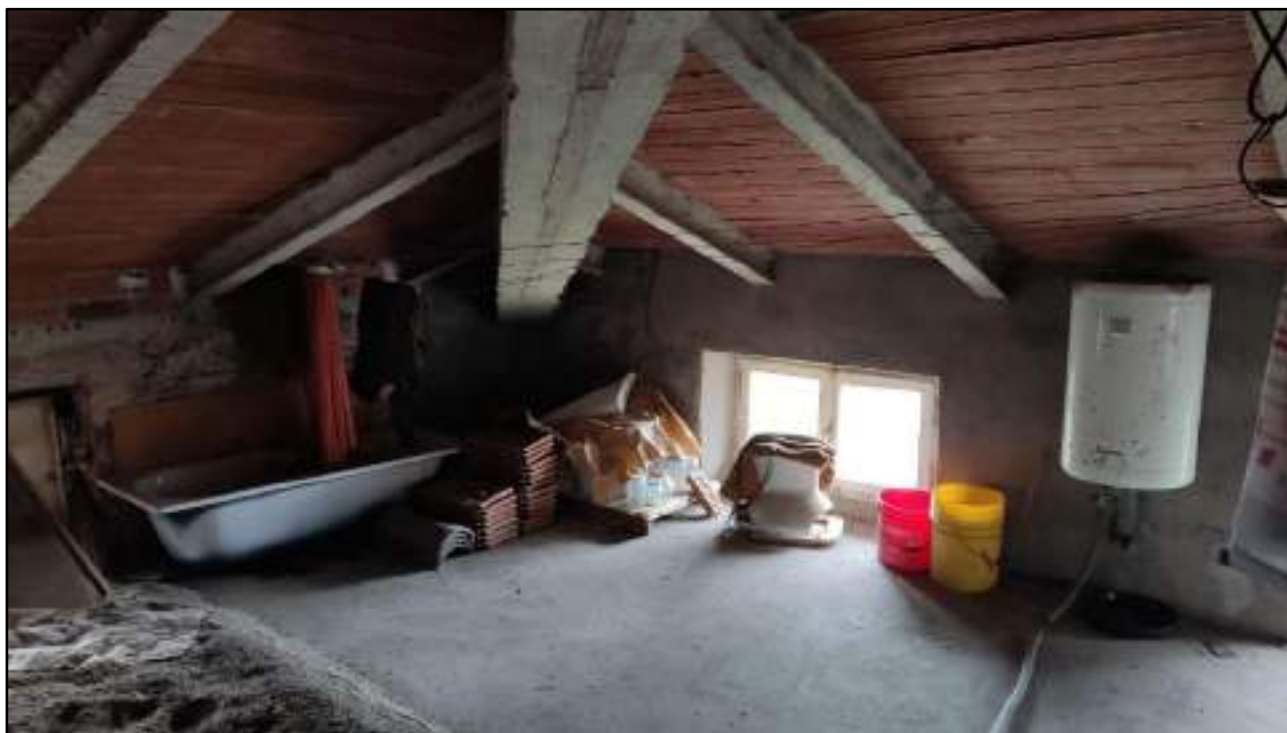
vista interni soffitta piano secondo