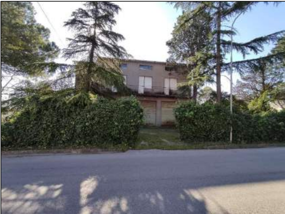
vista accesso da strada Statale Marscianese