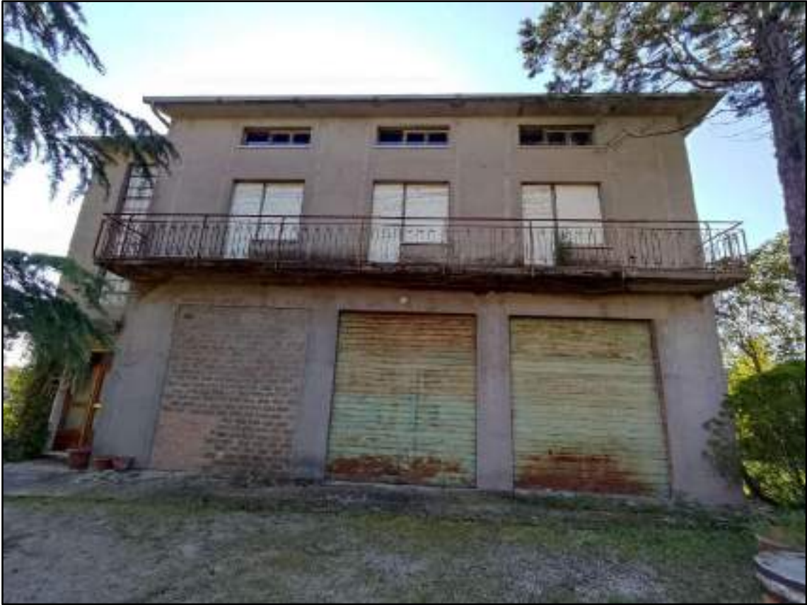
vista prospetto ovest