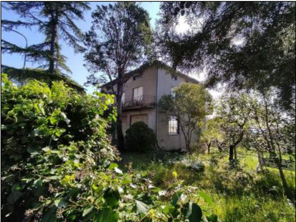
vista prospetto sud