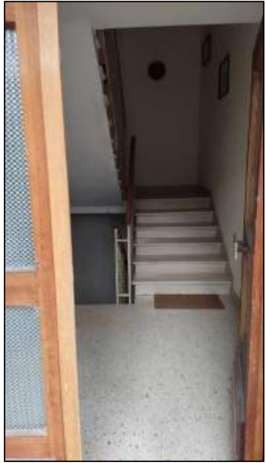
vista portone esterno