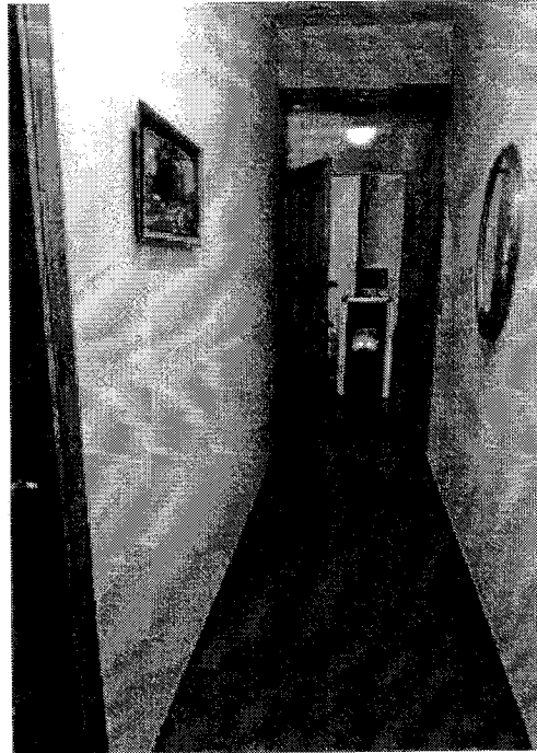
Corridoio zona notte