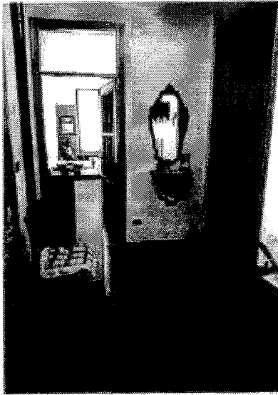
Corridoio d'ingresso zona giorno con vista sulla cucina