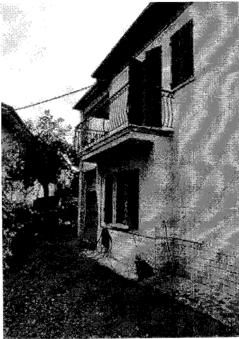
lato sx e scoperto esclusivo del fabbricato