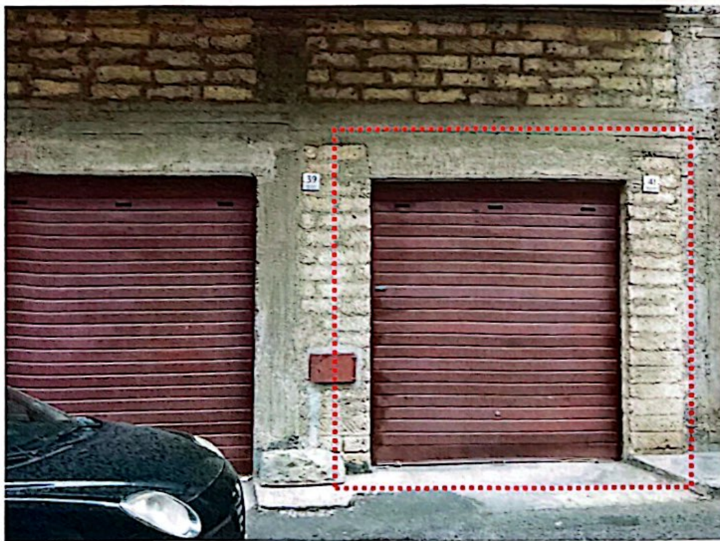
Foto 2: Individuazione dell'autorimessa sita al civico n. 41 della G. Carducci (Lotto 1 di vendita)