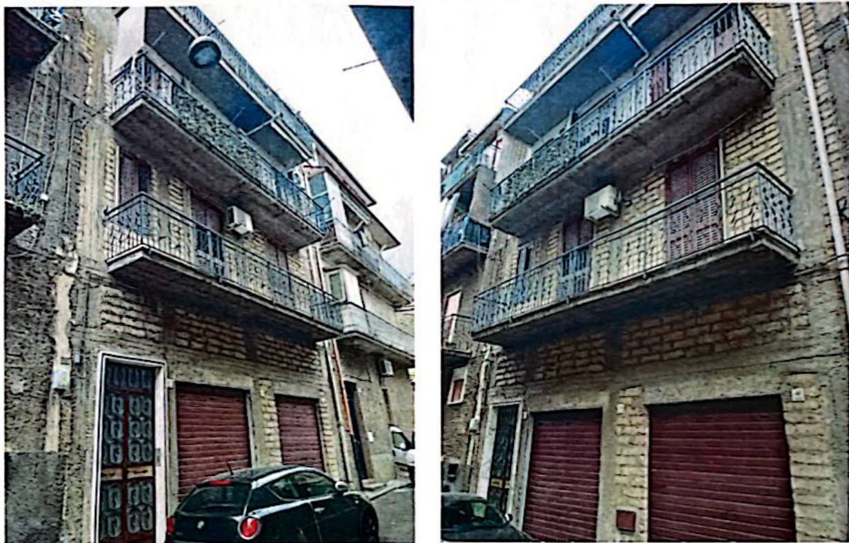
Foto 1: Vista della palazzina su quattro elevazioni sita nella Via G. Carducci n.37-39-41