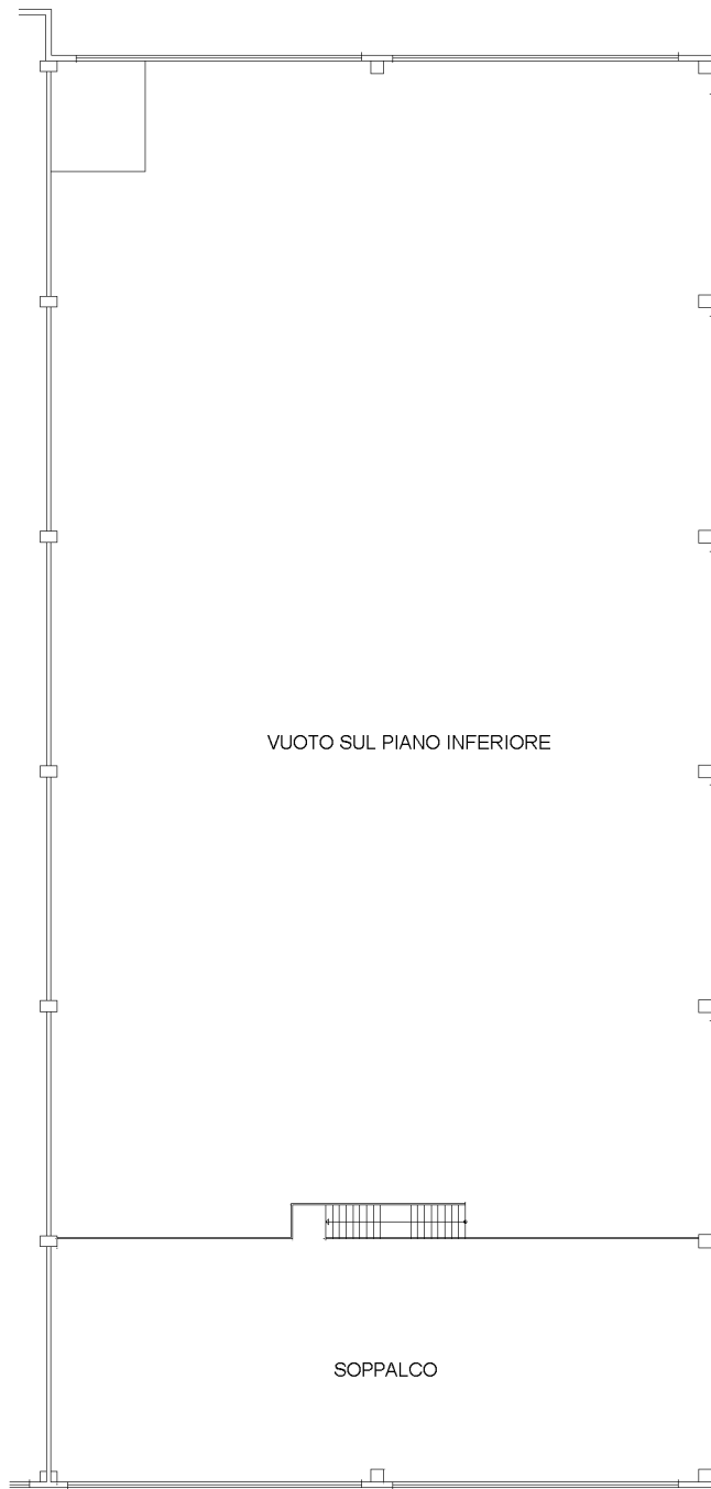
PIANTA PIANO PRIMO H=370