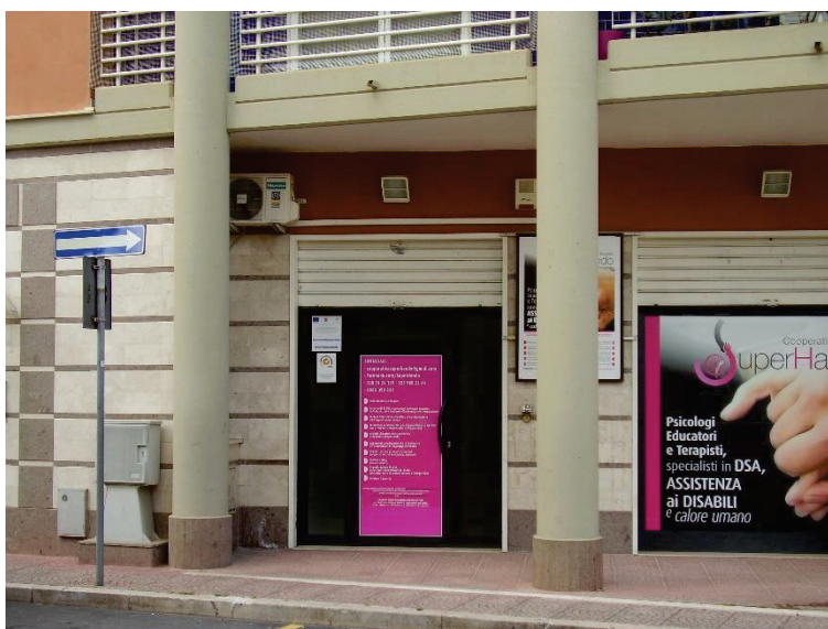
Figura 2 - Ingresso civico n. 27/a (Coop. Sociale SuperHando)