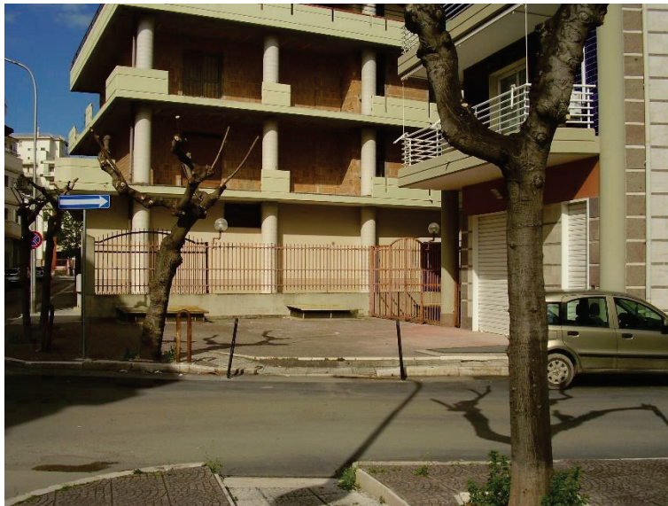
Figura 3 - Corte esclusiva esterna