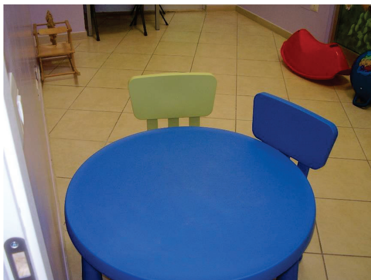
Figura 10 - Aula