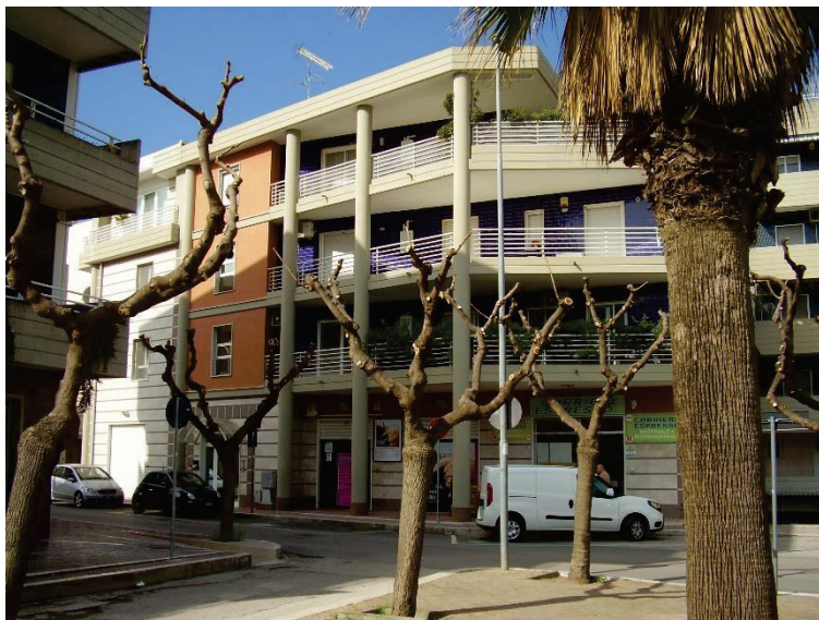
Figura 1 - Edificio condominiale di Via Trento, 27 – Cerignola