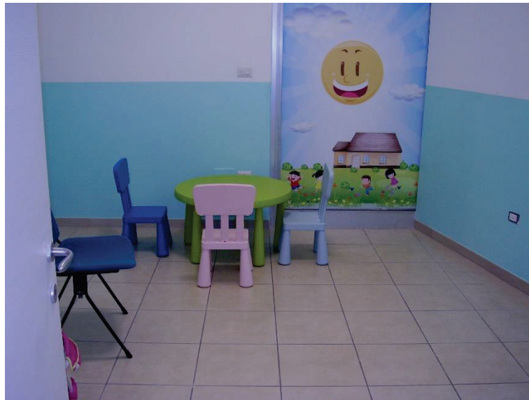
Figura 8 – Aula