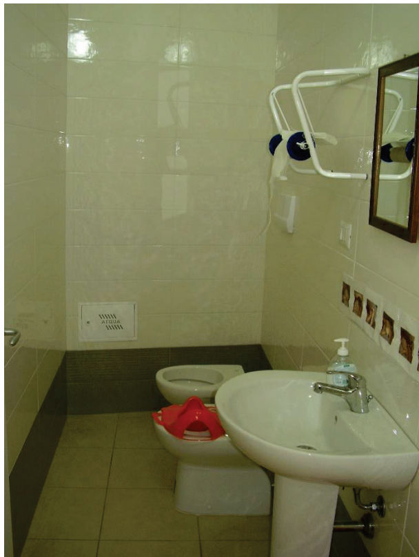
Figura 7 - Servizio igienico