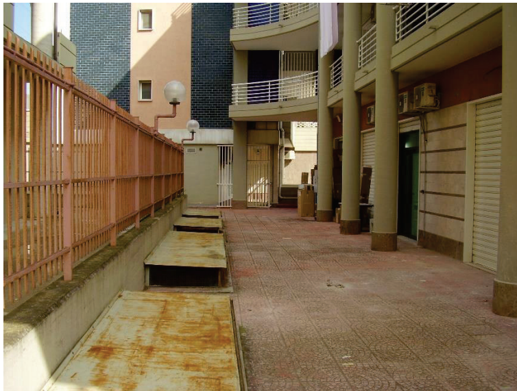
Figura 4 - Cortile interno recintato