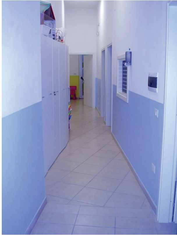
Figura 6 - Disimpegno/corridoio