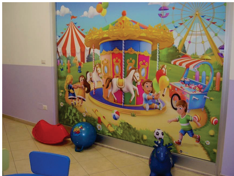
Figura 9 – Aula