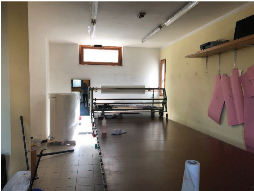
Foto n. 4: Ambiente unico – locale ad uso commerciale (categoria catastale C/1)