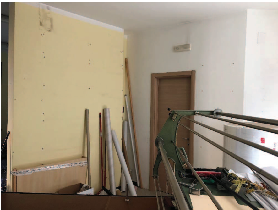
Foto n. 12: Ambiente unico – locale ad uso commerciale (categoria catastale C/1)