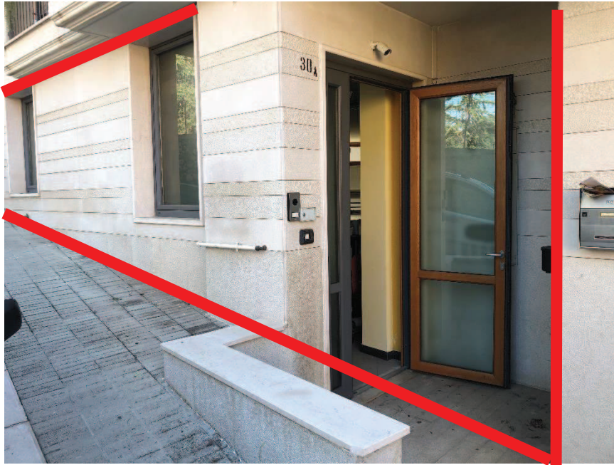
Foto n. 1: Ingresso bene oggetto di stima piano terra – Via Santa Maria di Fatima n. 30 a