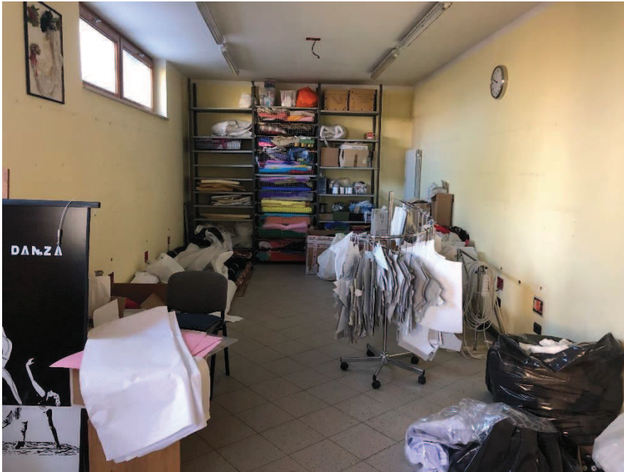
Foto n. 3: Ambiente unico – locale ad uso commerciale (categoria catastale C/1)