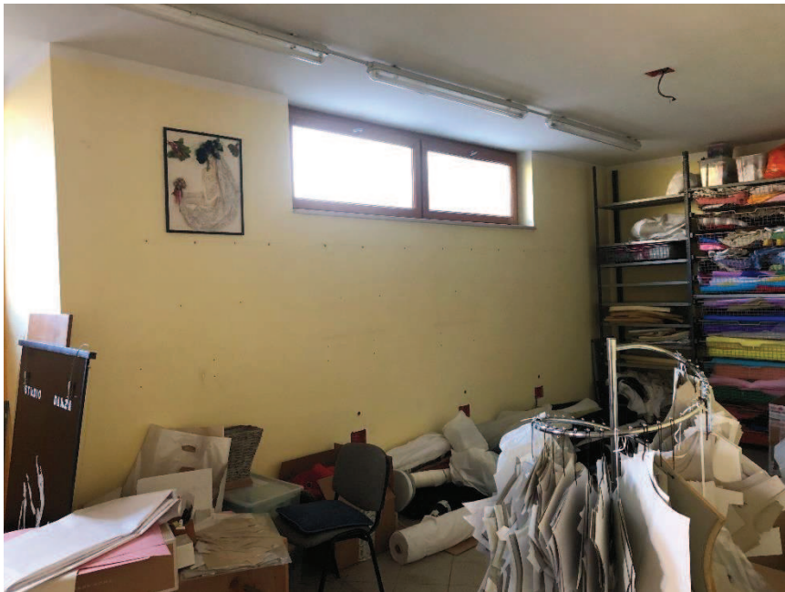
Foto n. 5: Ambiente unico – locale ad uso commerciale (categoria catastale C/1)