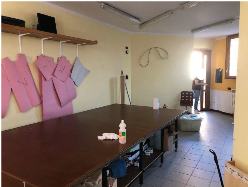
Foto n. 6: Ambiente unico – locale ad uso commerciale (categoria catastale C/1)