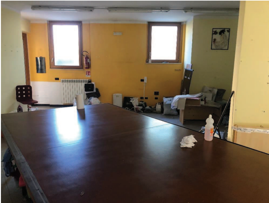
Foto n. 11: Ambiente unico – locale ad uso commerciale (categoria catastale C/1)