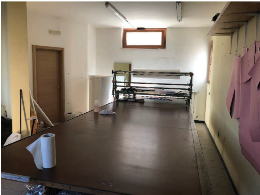
Foto n. 10: Ambiente unico – locale ad uso commerciale (categoria catastale C/1)