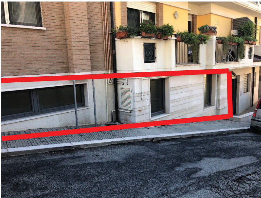
Foto n. 2: Prospetto bene oggetto di stima – via Santa Maria di Fatima