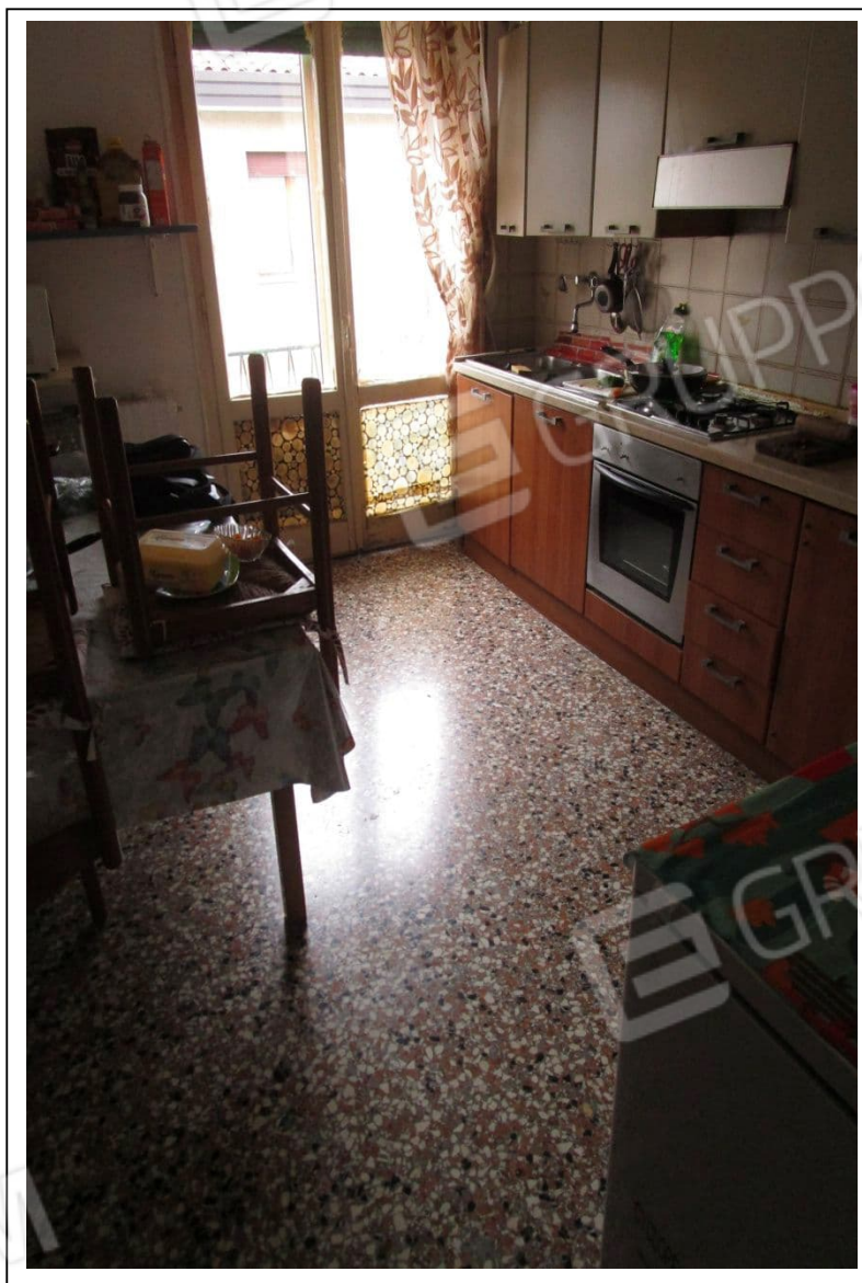
Fotogramma 4/6 – Particolare della cucina.