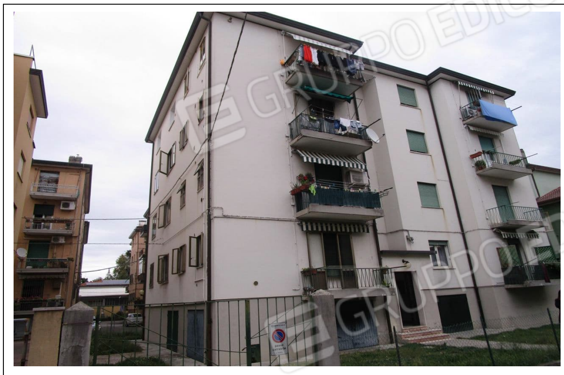
Fotogramma 1/6 – Particolare prospetto del condomini.