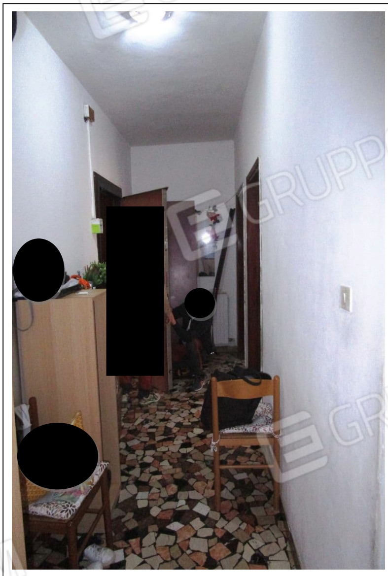
Fotogramma 6/6– Particolare dell'ingresso.