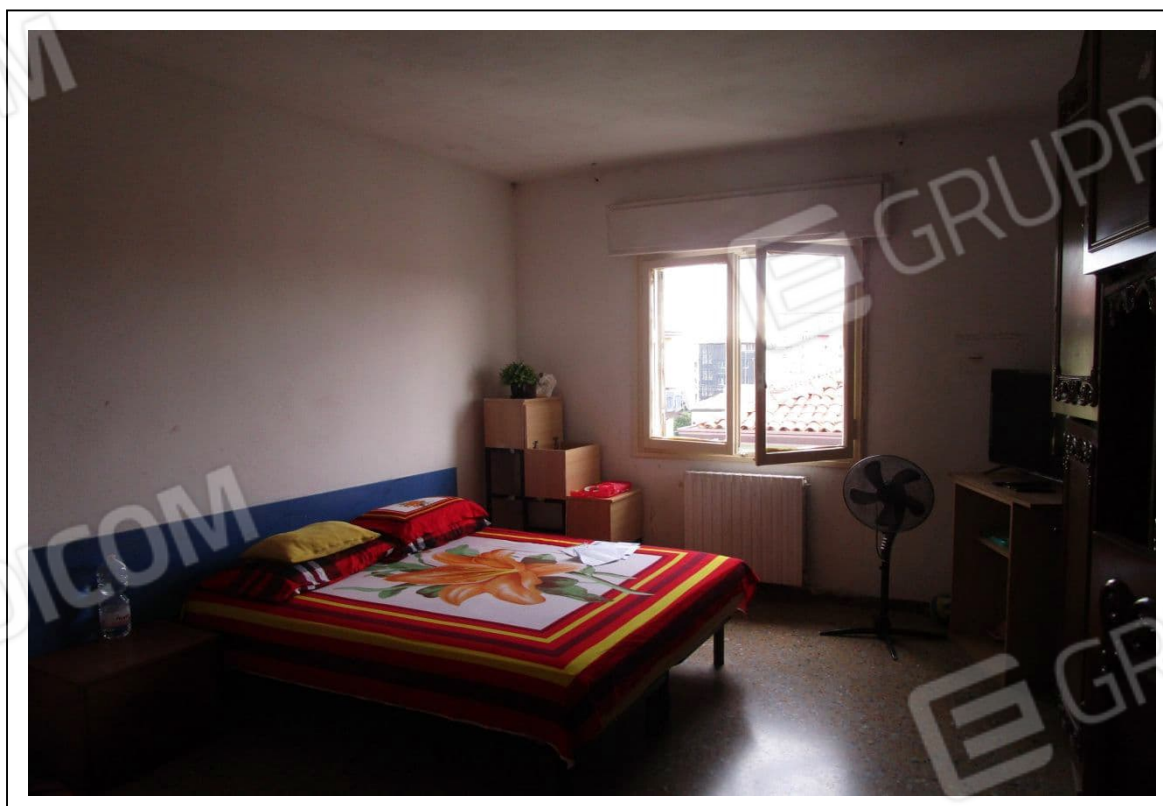
Fotogramma 2/6 – Particolare della camera.