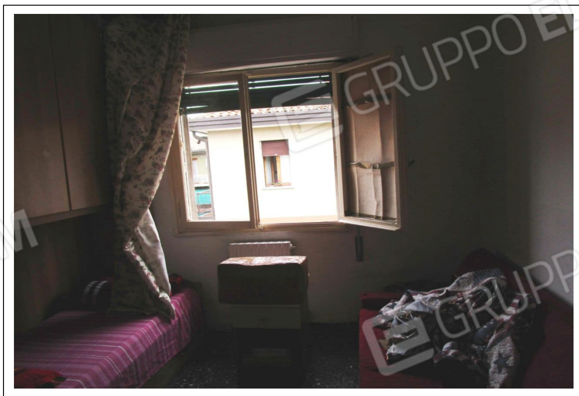
Fotogramma 5/6 – Particolare della camera.