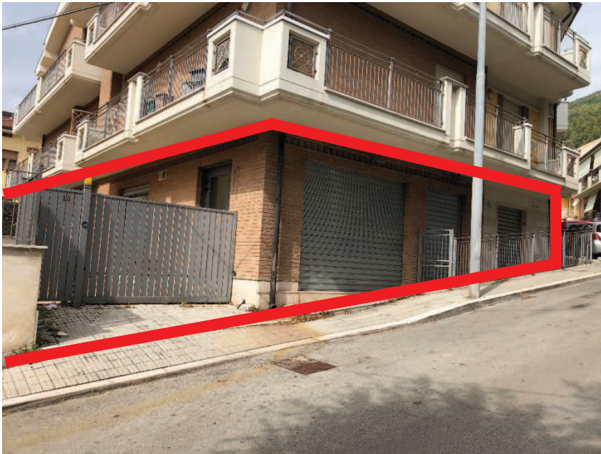
Foto n. 6: Prospetto bene oggetto di stima – piano terra – via San'Agata