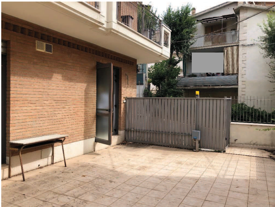
Foto n. 4: Terrazzo di pertinenza (piano terra) con ingresso su via Sant'Agatata n. 15