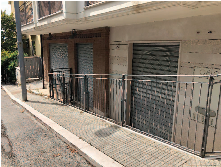
Foto n. 5: Prospetto bene oggetto di stima – piano terra – via San'Agata