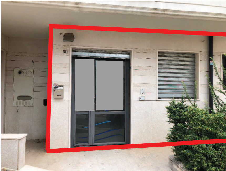
Foto n. 1: Ingresso bene oggetto di stima piano terra – Via Santa Maria di Fatima n. 30