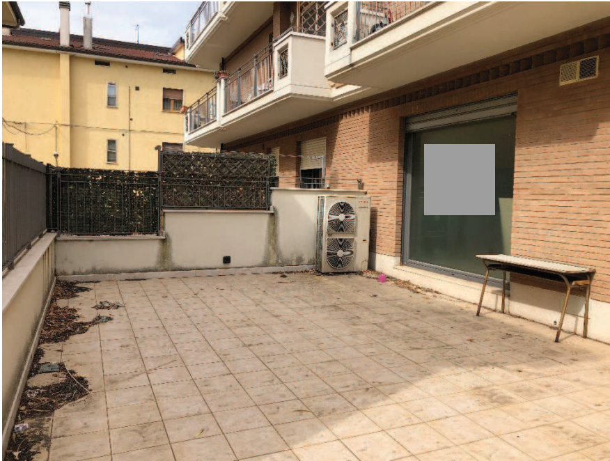
Foto n. 3: Terrazzo di pertinenza (piano terra) con ingresso su via Sant'Agatata n. 15