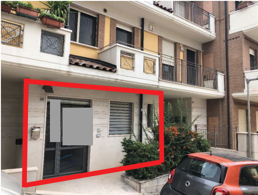
Foto n. 2: Ingresso bene oggetto di stima piano terra – Via Santa Maria di Fatima n. 30