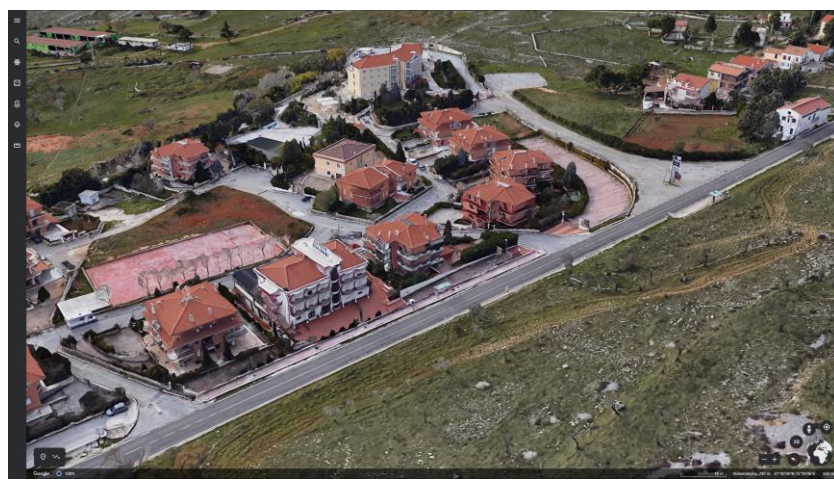
immobili, Via R. Rossellini - 71014 San Marco in Lamis (FG)