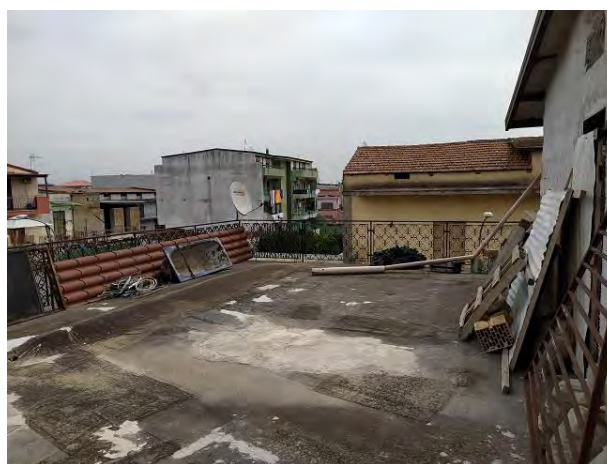
Il terrazzo scoperto

L'unità immobiliare è da adibire a civile abitazione, in conformità al titolo abilitativo edilizio in sanatoria richiesto.