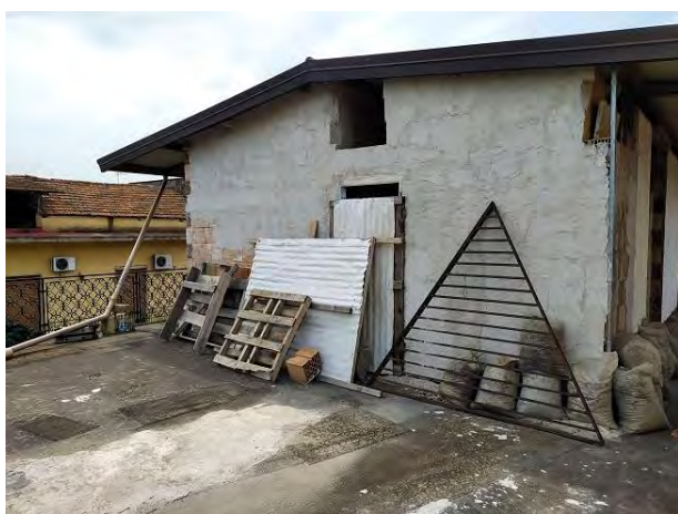
L'immobile visto dal terrazzo

La superficie interna utile complessiva totale è pari a mq. 88,57, con altezza interna variabile da m. 3,65 a m. 3,30 per effetto dell'inclinazione delle falde del tetto.