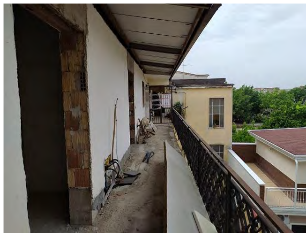
Il ballatoio utilizzato per l'accesso

L'unità immobiliare si trova allo stato rustico, con presenza delle sole murature perimetrali e di tramezzature interne, priva di finiture e impianti: da quanto accertato in sede di sopralluogo, lo scrivente ritiene che la stessa sia stata predisposta per essere suddivisa in due autonomi appartamenti.