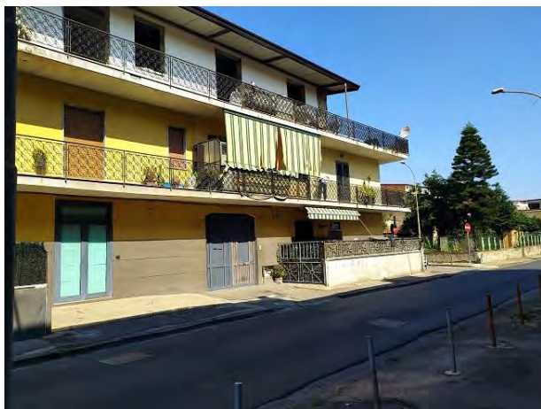
Il fabbricato di cui fa parte l'immobile pignorato

L'immobile si trova al piano secondo del fabbricato, contraddistinto con il numero interno 8, con accesso da ballatoio a sua volta raggiungibile da rampa di scale interna comune del fabbricato.