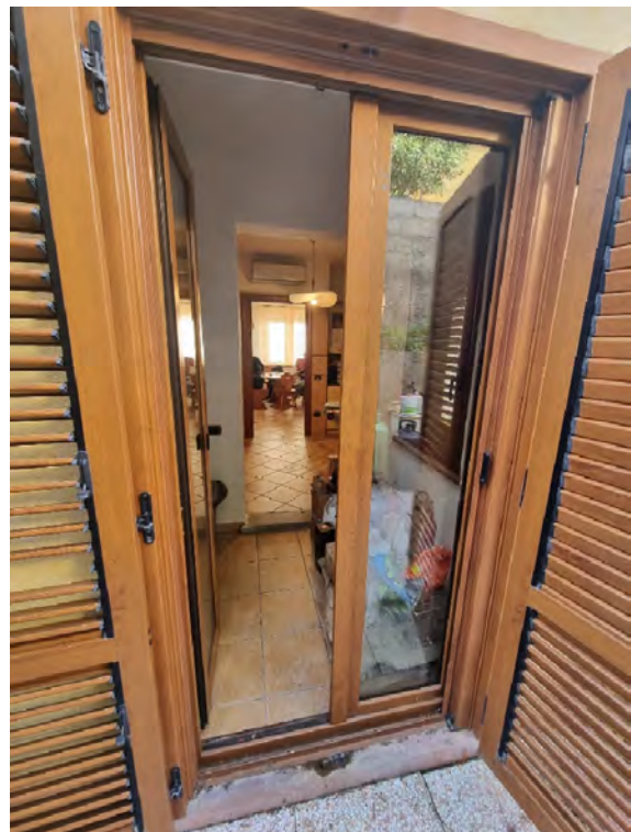
Foto n° 29, 30 e 31 - Particolare aiuola vegetazione e infissi esterni dotati di persiane