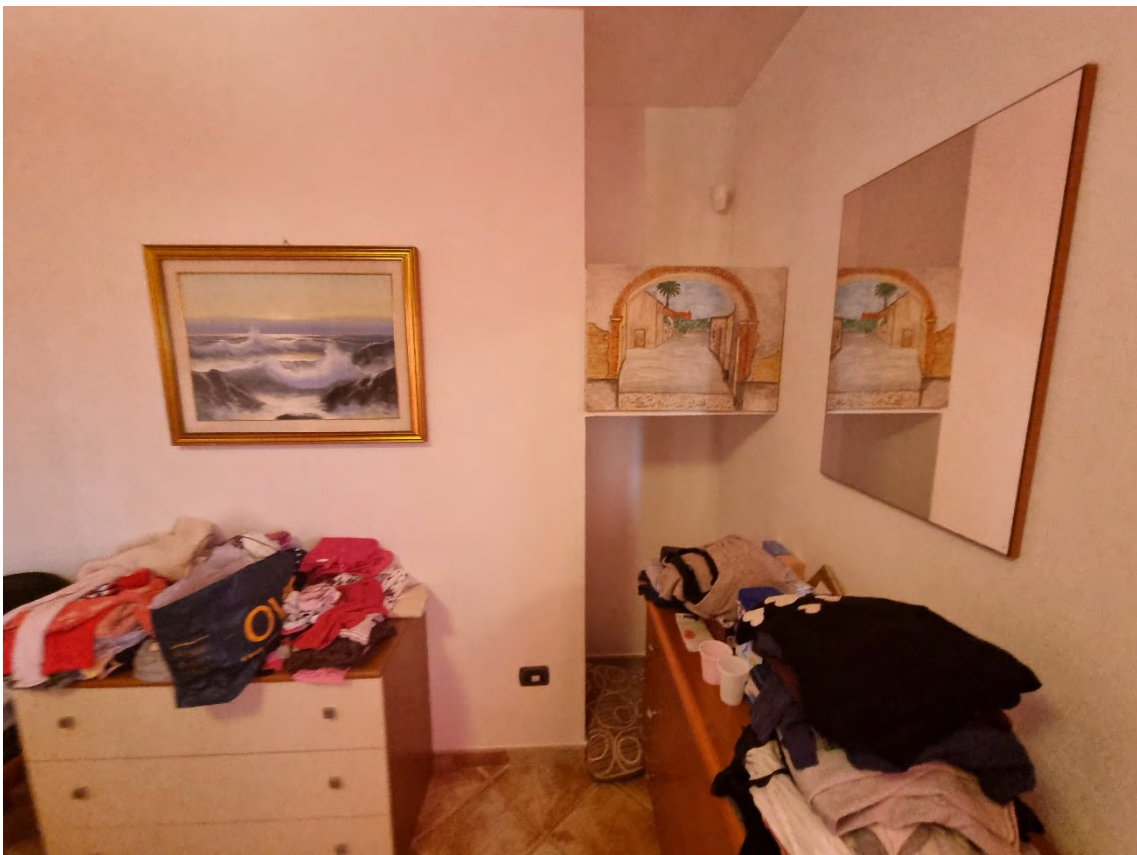
Foto n° 50 e 51 - Viste della camera da letto matrimoniale al piano primo