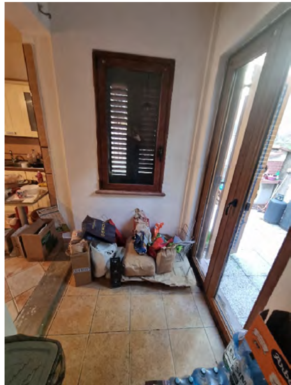
Foto n° 23 e 24 - Altra porzione di cucina dalla quale si accede al cortile sul retro