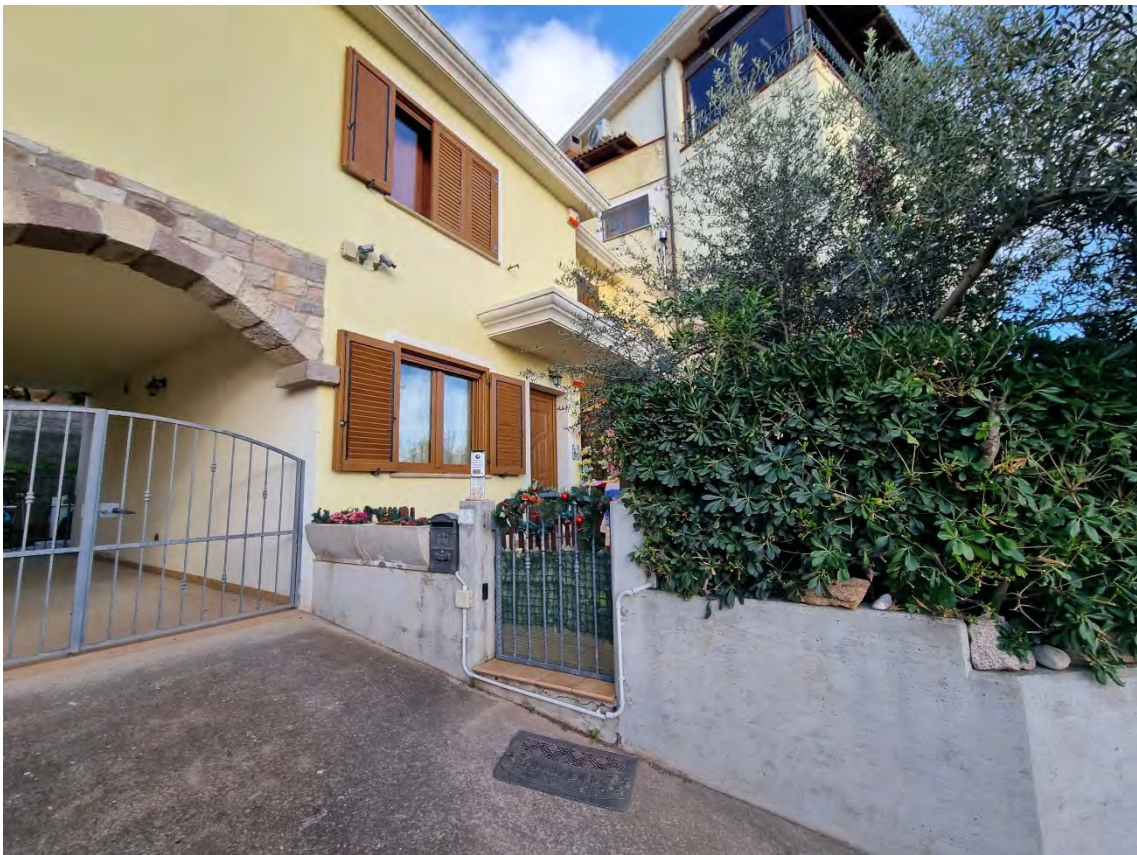
Foto n° 5 e 6 - Viste del prospetto anteriore sulla via Monte Santu Mai