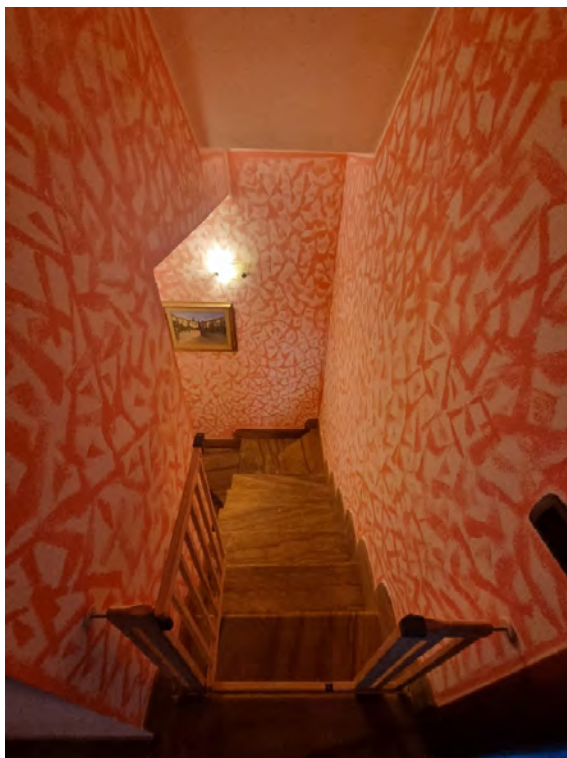
Foto n° 39, 40, 41 e 42 - Viste vano scala interno che collega il piano terra al primo