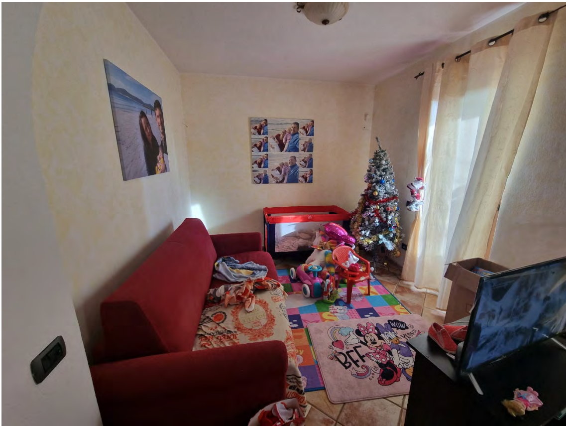
Foto n° 18 e 19 - Viste sulla restante porzione del vano dedicata invece a soggiorno