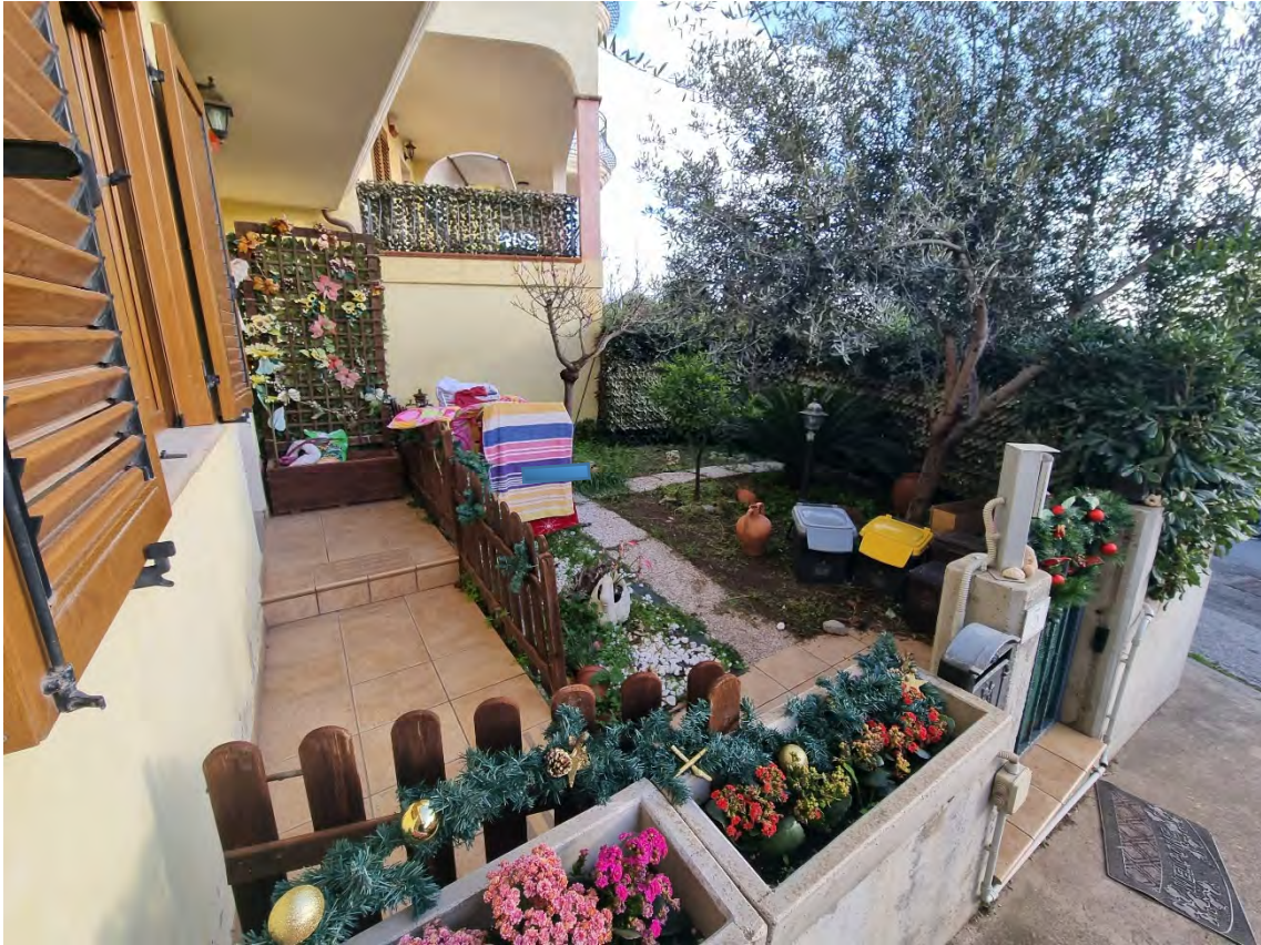
Foto n° 10 - Vista porzione di giardino anteriore che si affaccia sulla via Santu Mai