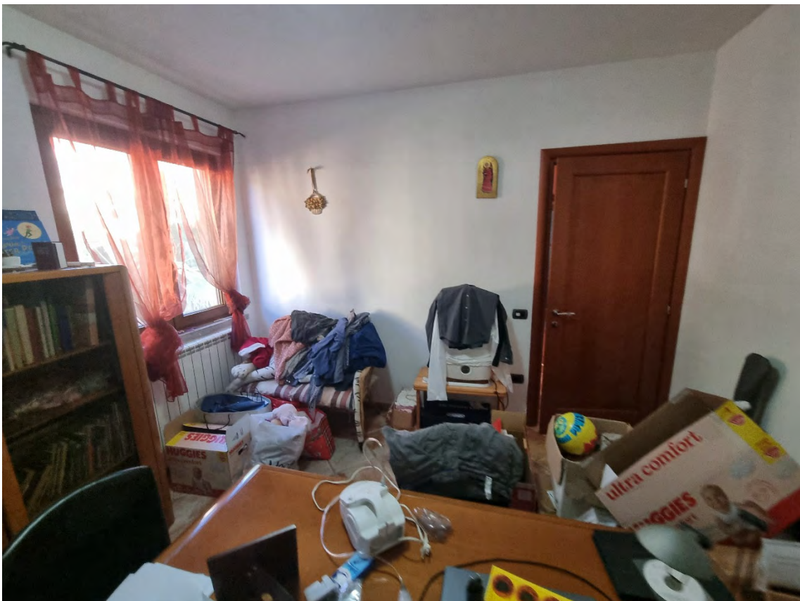
Foto n° 54 e 55 - Viste della terza camera attualmente adibita a studio