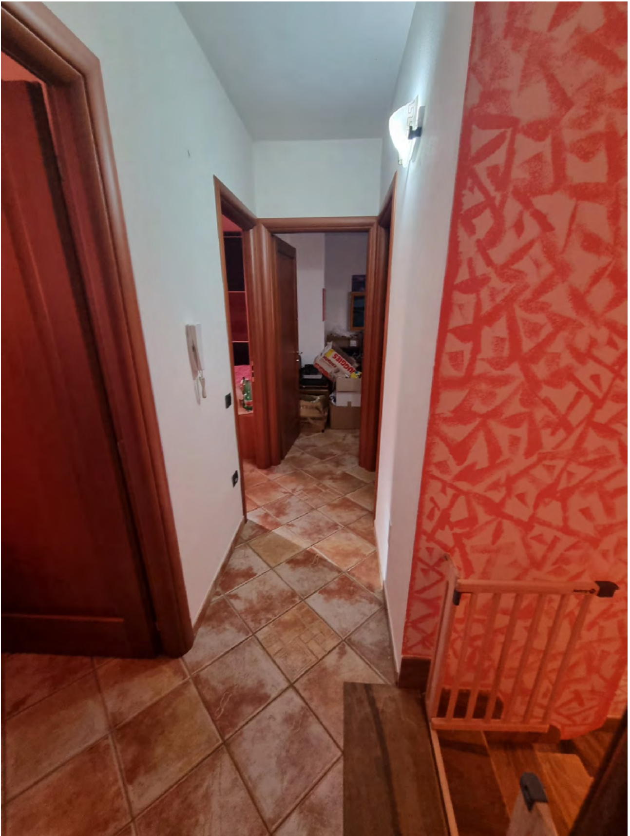
Foto n° 43 - Viste dell'andito al piano primo che smista gli accessi ai vari ambienti