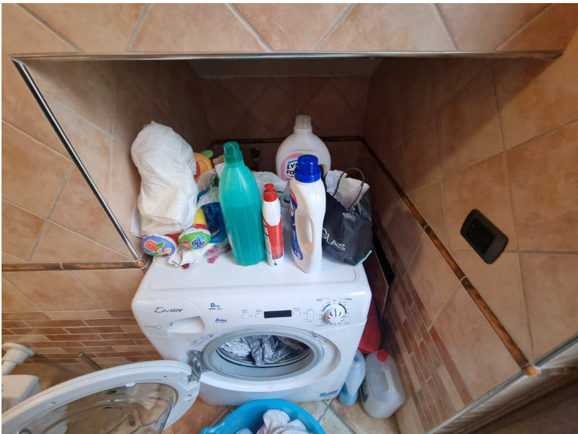
Foto n° 38 - Particolare relativo alla nicchia per lavatrice ricavata nel sotto scala