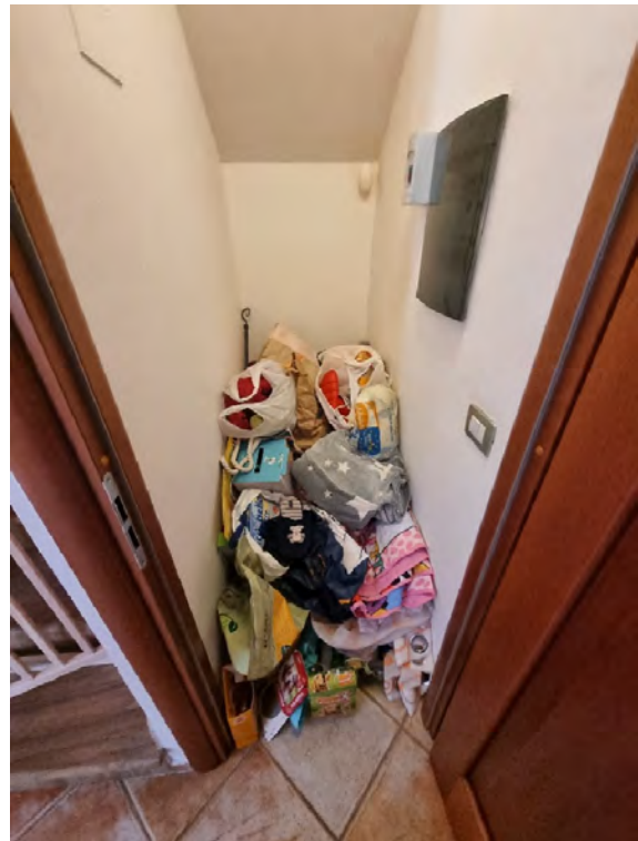
Foto n° 32, 33 e 34 - Particolari relativi al ripostiglio del piano terra nel sotto scala