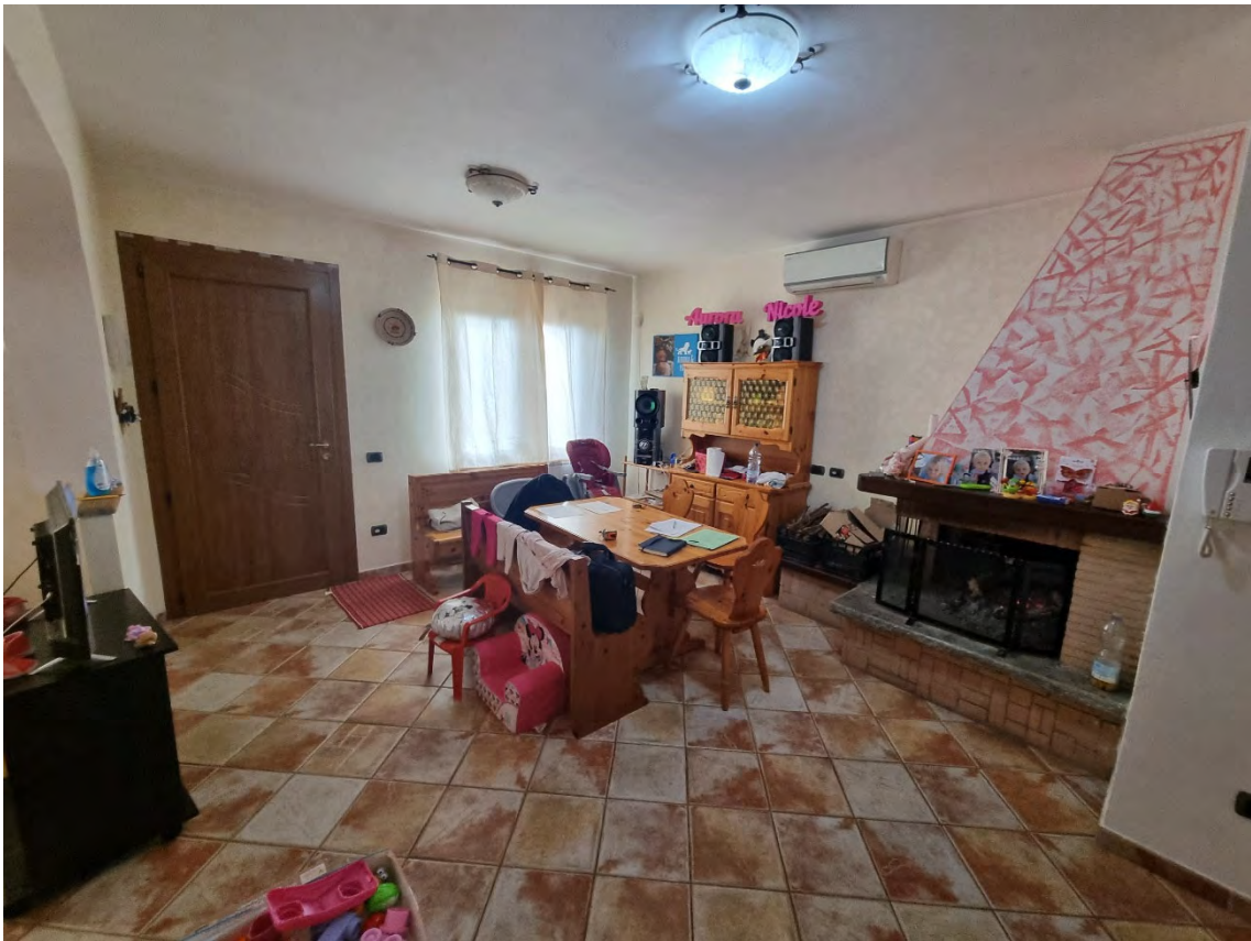
Foto n° 16 e 17 - Viste sulla porzione di vano dedicata al pranzo e dotata di camino