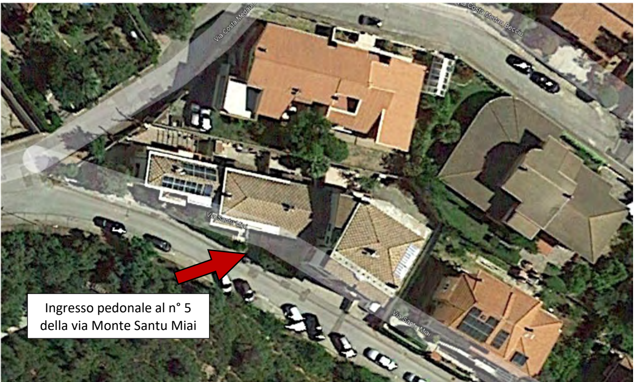
Foto n° 3 e 4 - Immobile avente ingresso pedonale dal n° 5 della via Monte Santu Miai