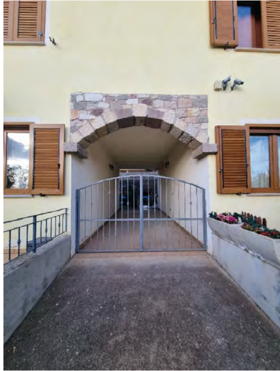
Foto n° 7 e 8 - Particolari cancelli in ferro che consentono l'accesso all'immobile