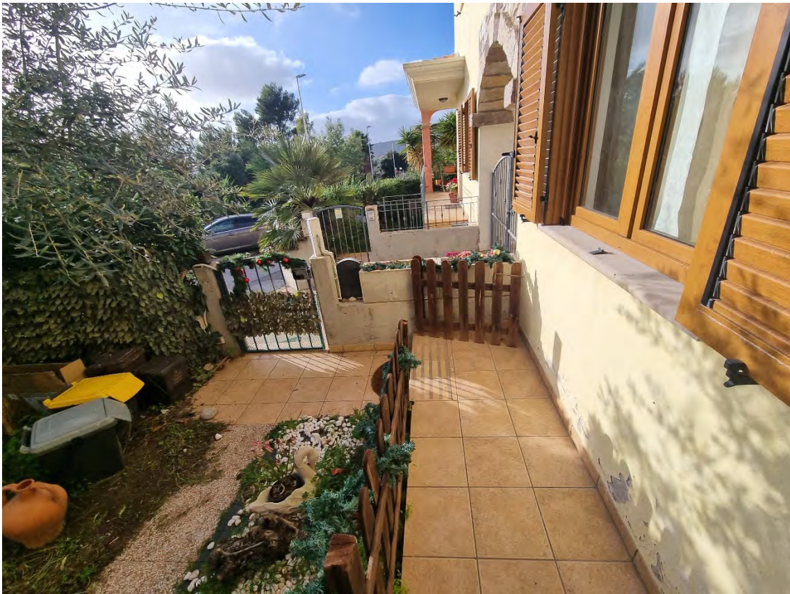
Foto n° 11 - Particolare del vialetto di ingresso che dalla strada conduce all'immobile