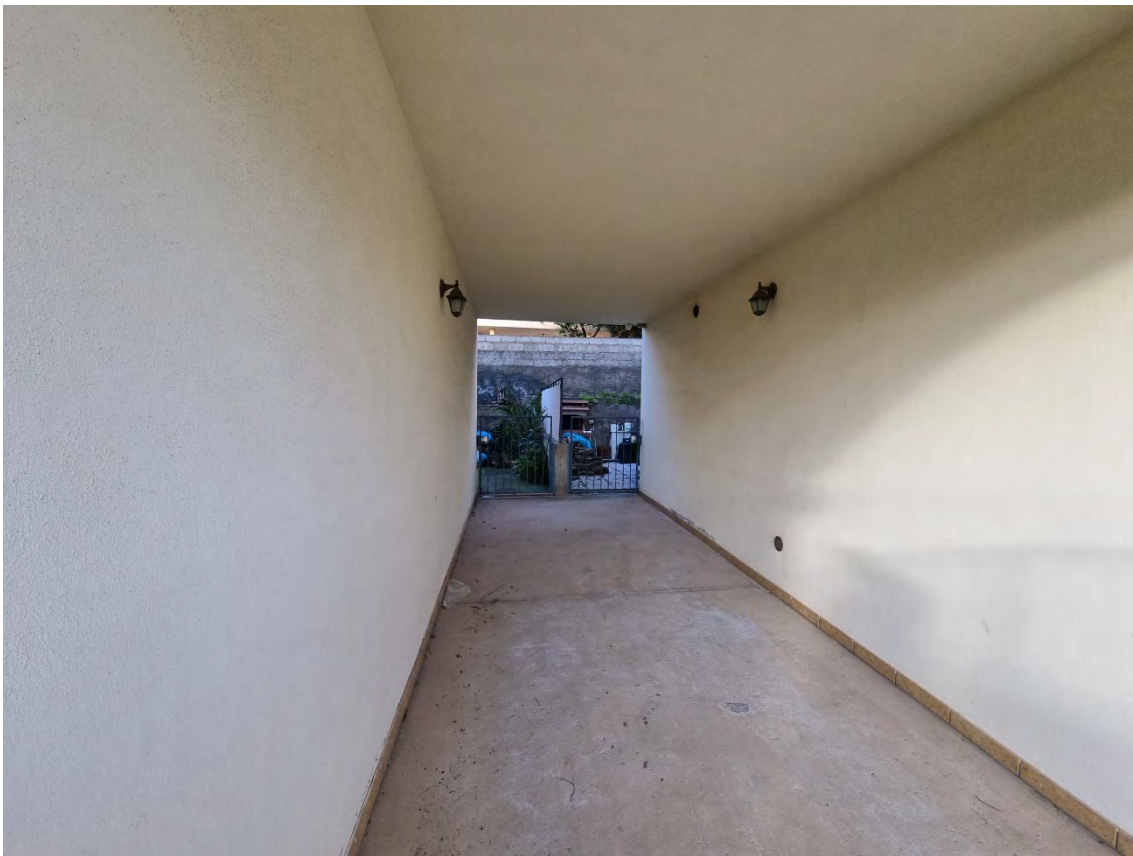
Foto n° 9 - Vista passaggio coperto comune che consente l'accesso al cortile posto sul retro dell'immobile oggetto di stima ed a quello adiacente.