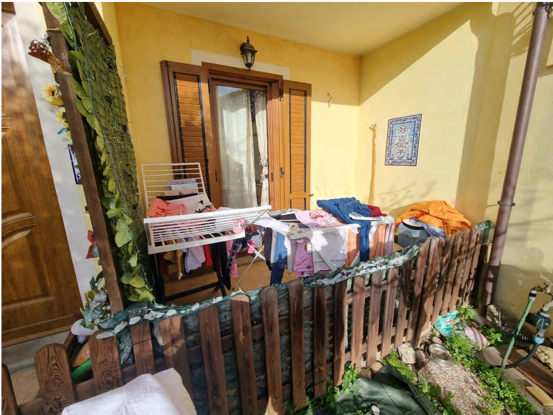
Foto n° 14 e 15 - Particolari della veranda coperta con accesso dal soggiorno-pranzo