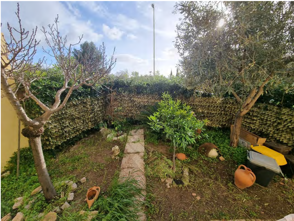
Foto n° 12 e 13 - Altre viste sul giardino anteriore e sulla recinzione