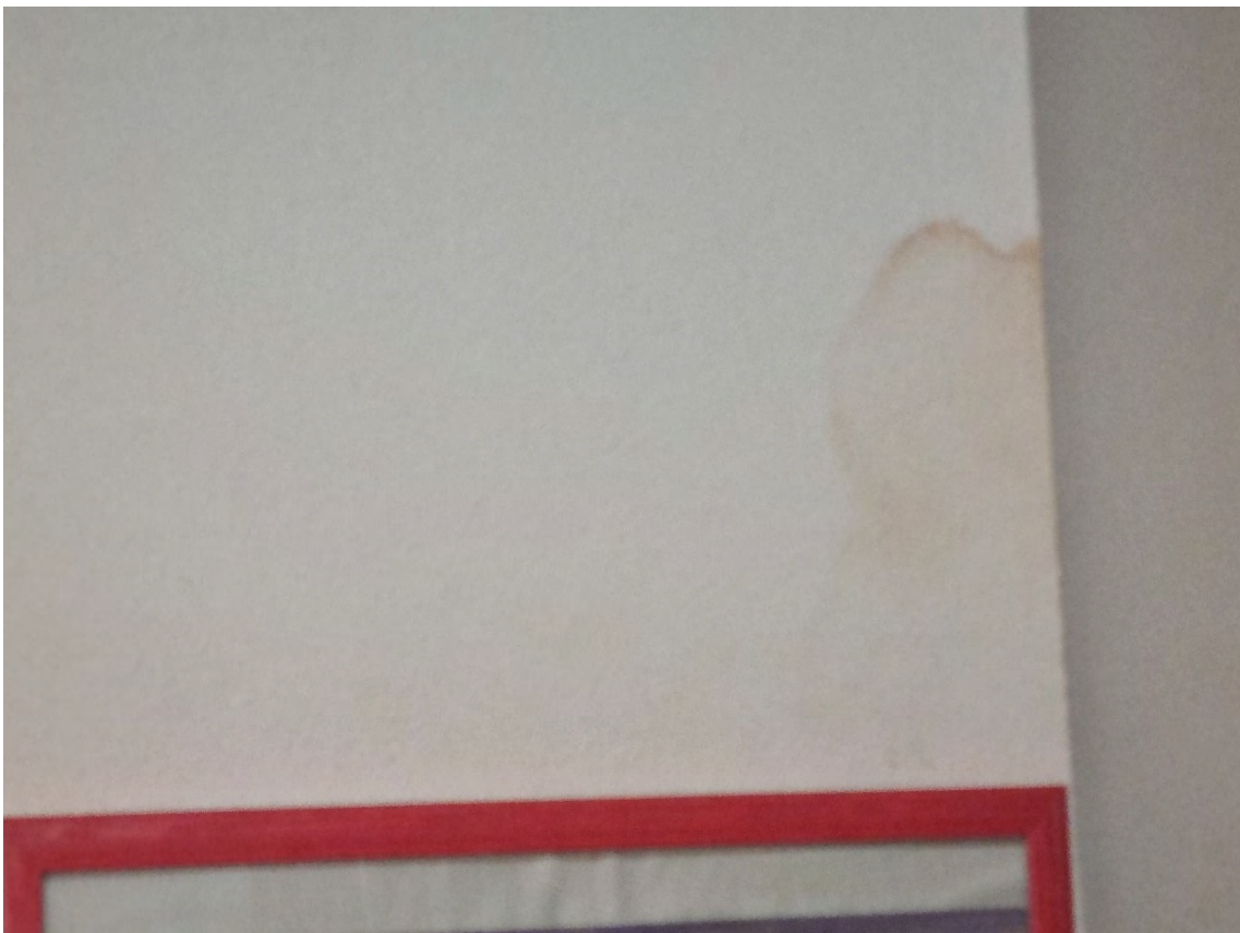
Foto n° 56 e 57 - Particolare della canna fumaria e fenomeni di infiltrazione