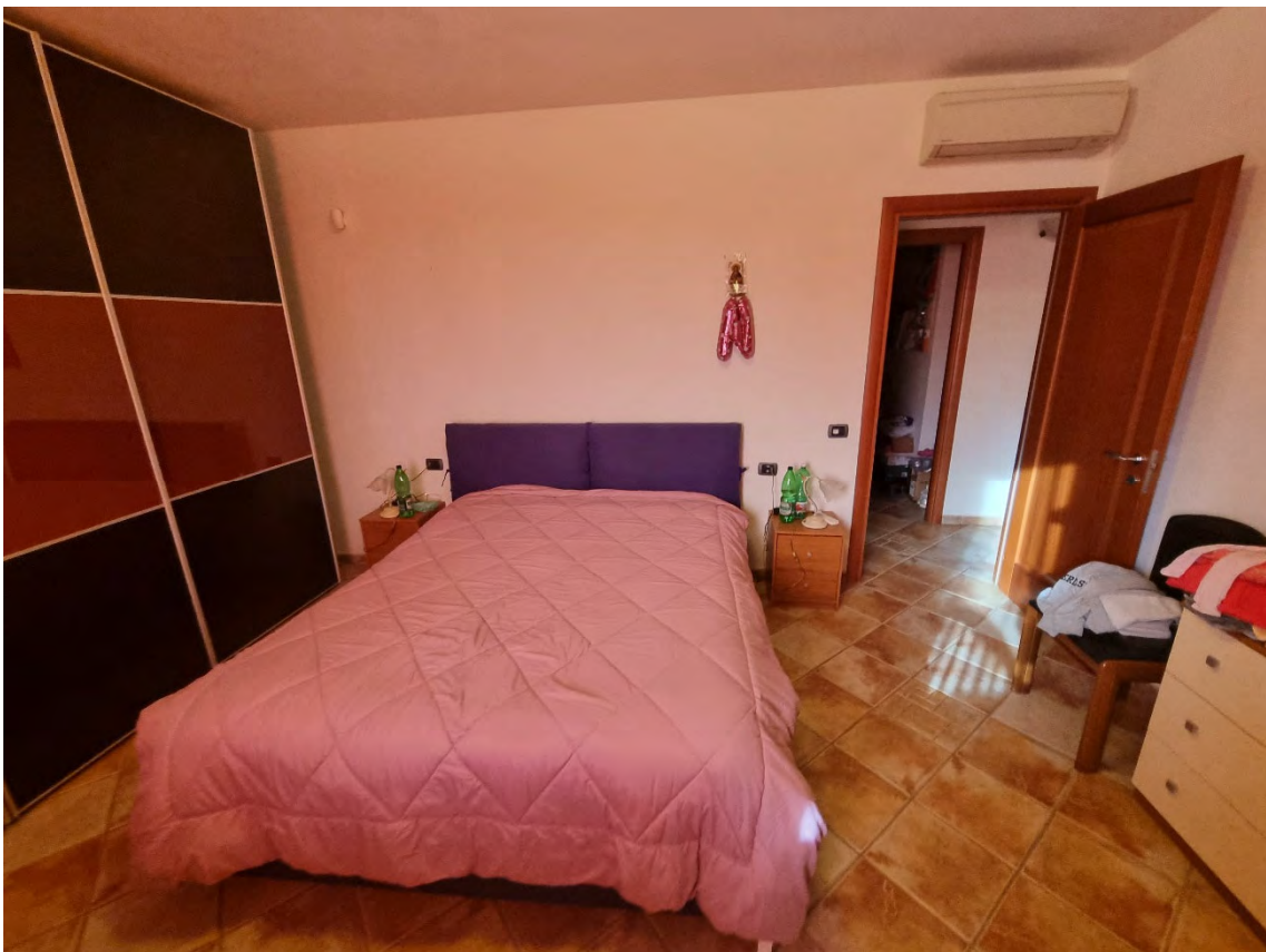
Foto n° 52 e 53 - Viste da altra angolazione della camera da letto matrimoniale