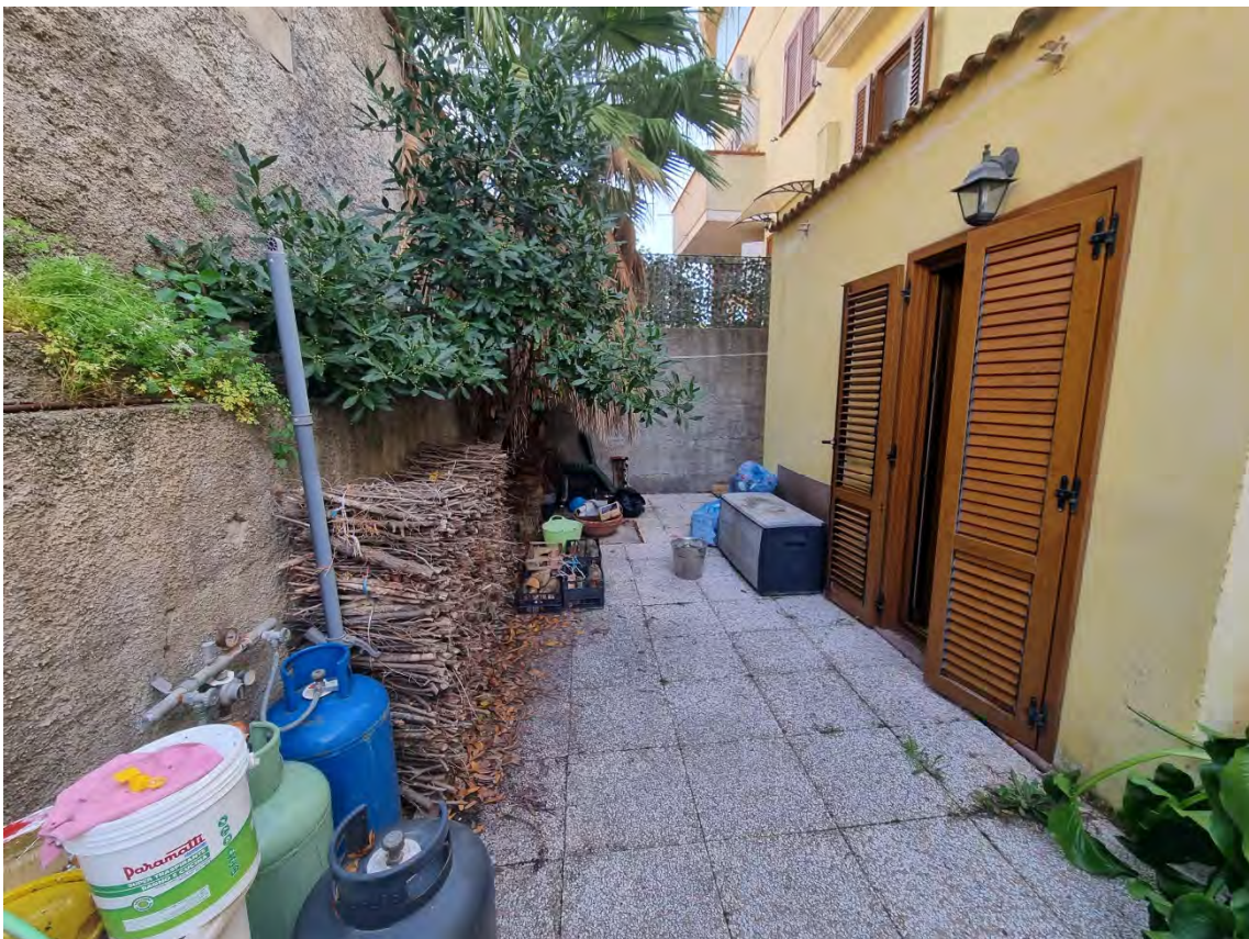
Foto n° 27 e 28 - Viste del cortile retrostante da altre angolazioni