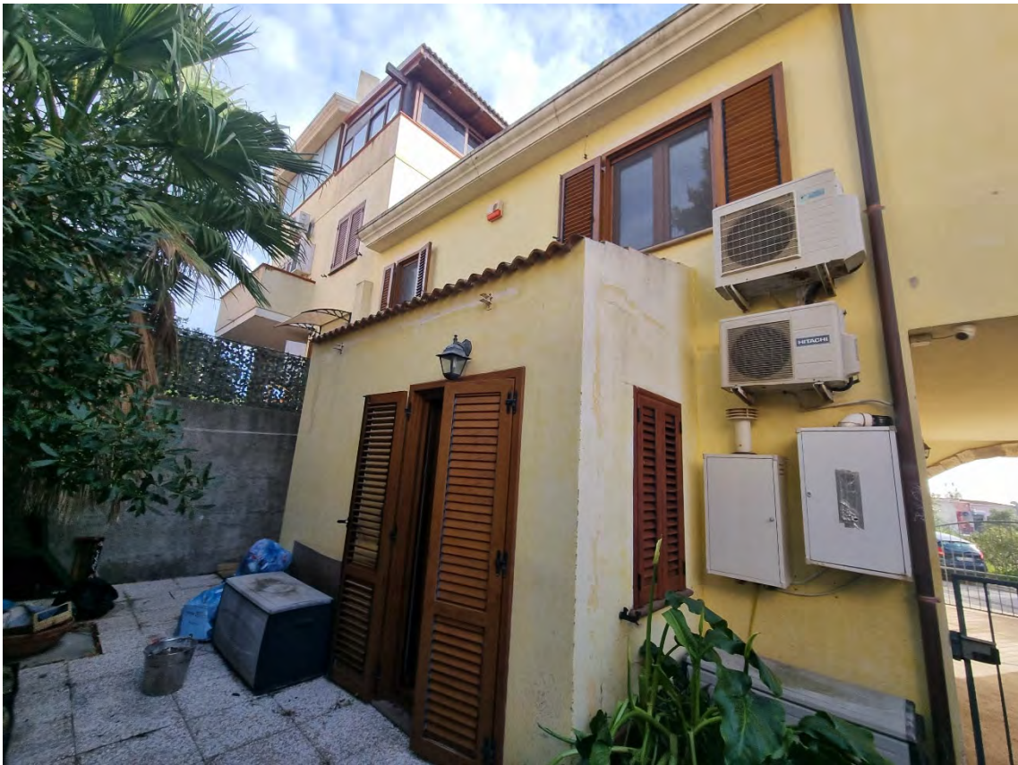
Foto n° 25 e 26 - Viste del cortile retrostante con accesso sia interno che esterno