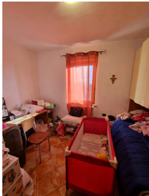
Foto n° 47, 48 e 49 - Vista della camera singola adiacente al bagno