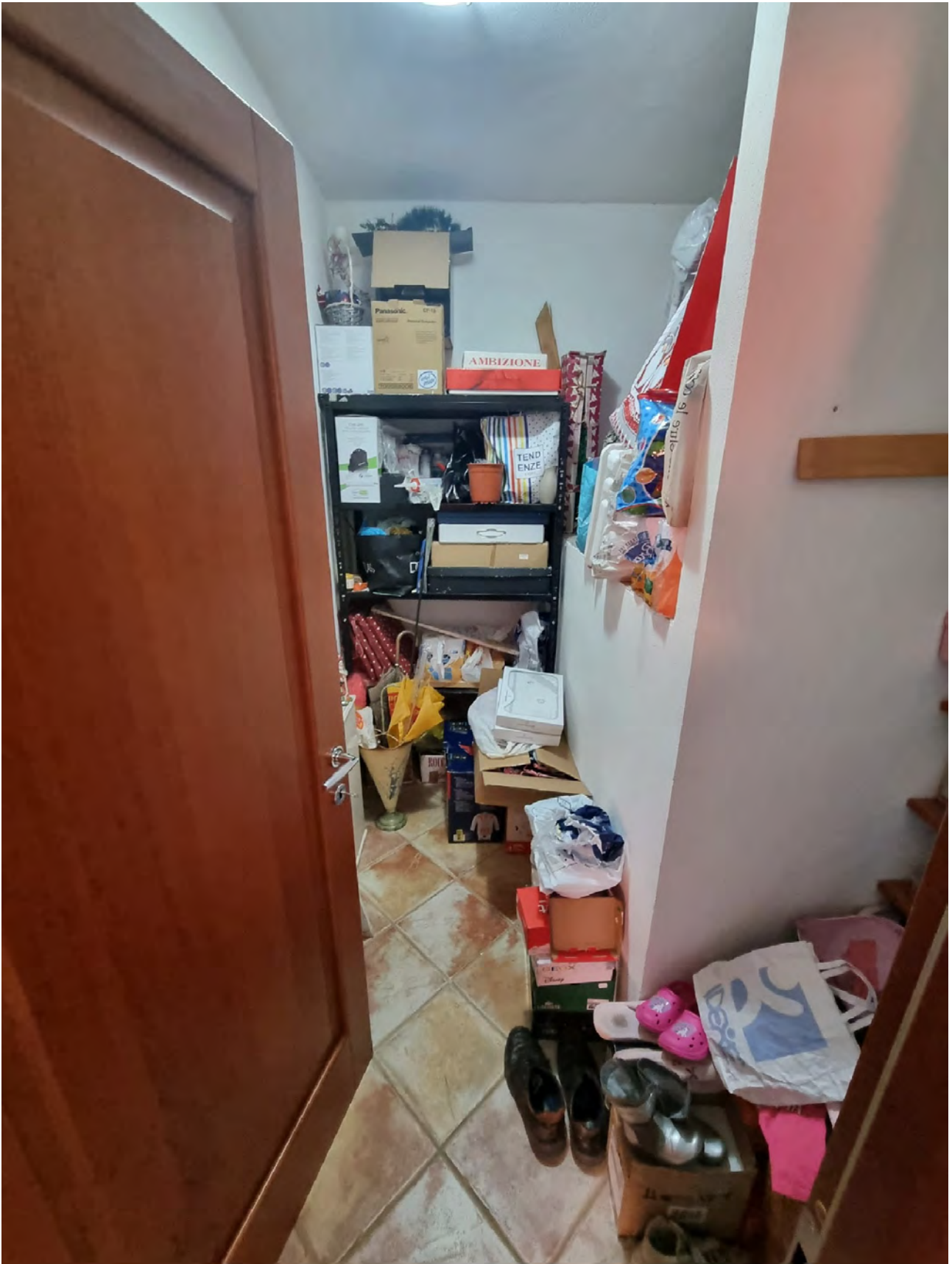
Foto n° 58 - Secondo ripostiglio ricavato al piano primo in adiacenza allo studio ed alla scala