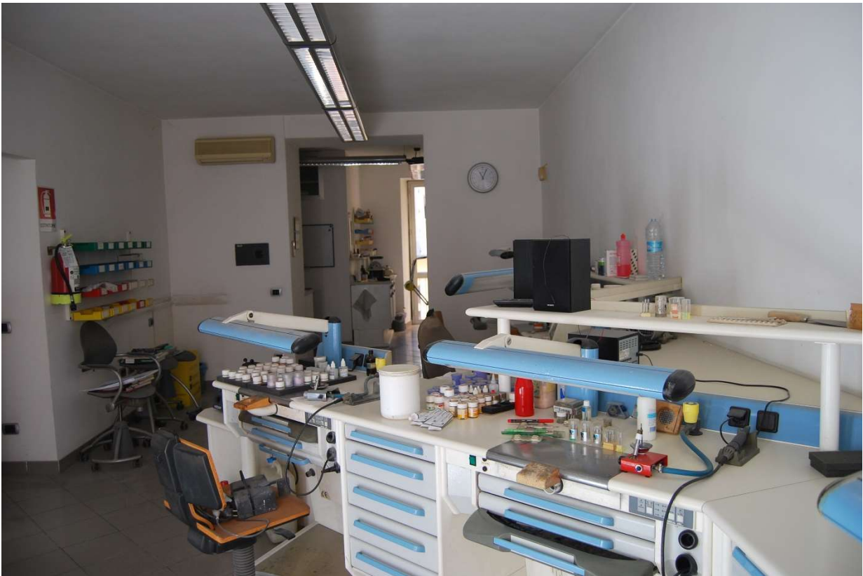
Laboratorio dentistico foto 9-10)