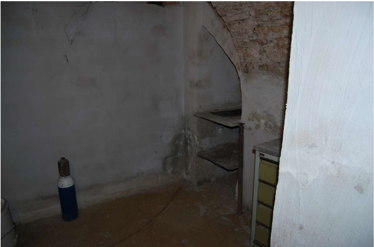
Locale cantina foto 21-22)