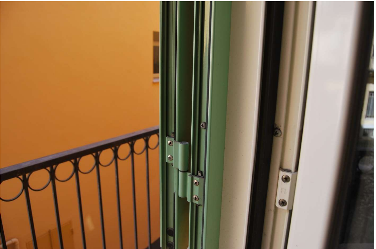
Particolari serramenti esterni foto 17-18)