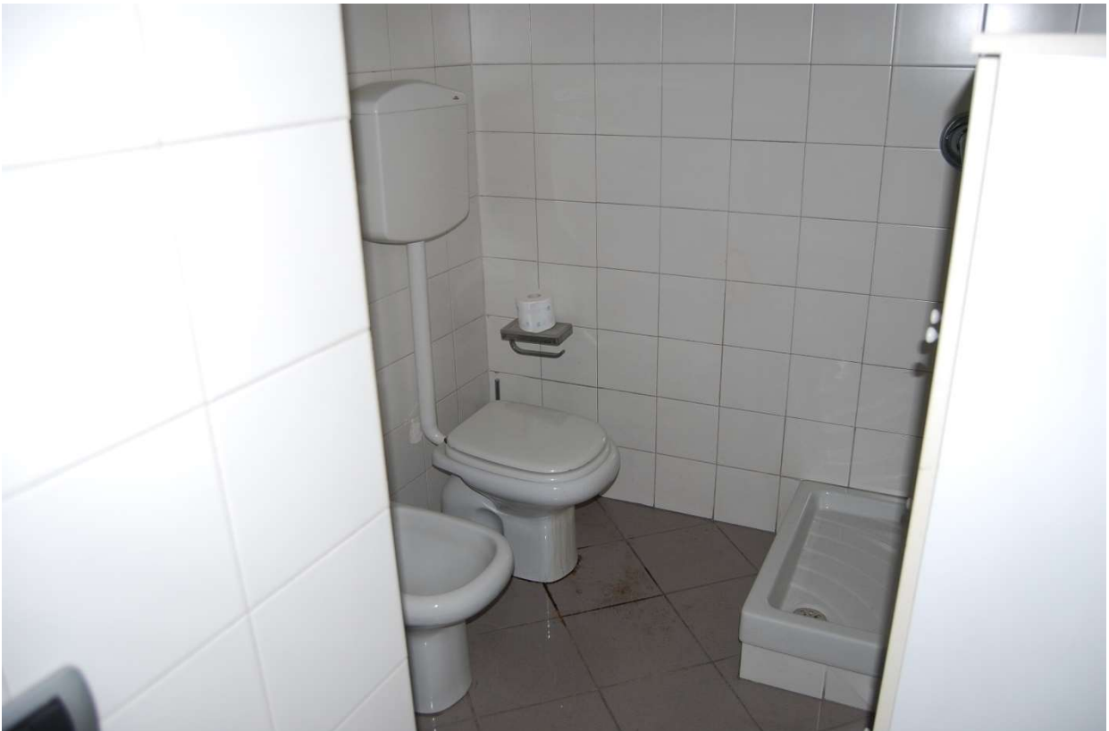
Bagno foto 15-16)