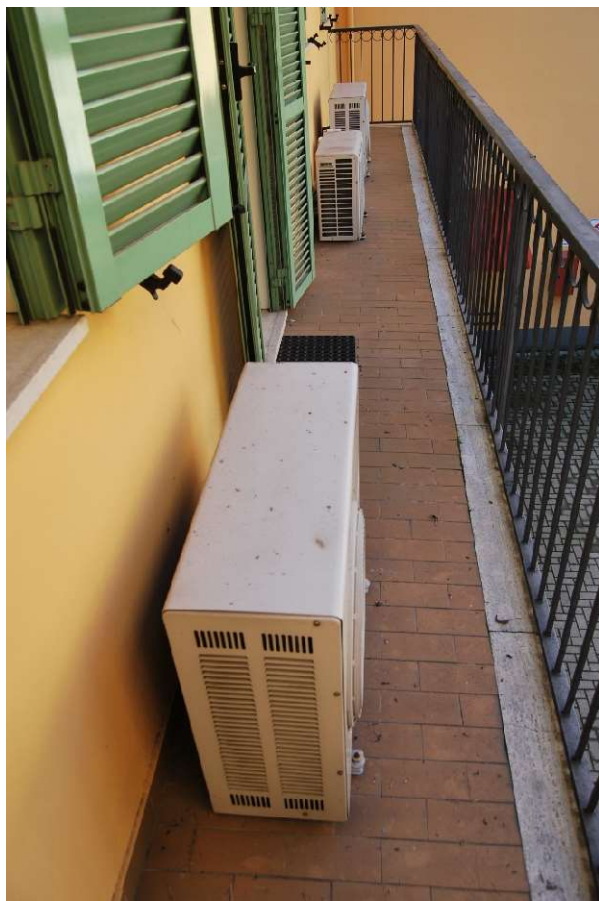
Ingresso pedonale e balcone su cortile interno foto 5-6)