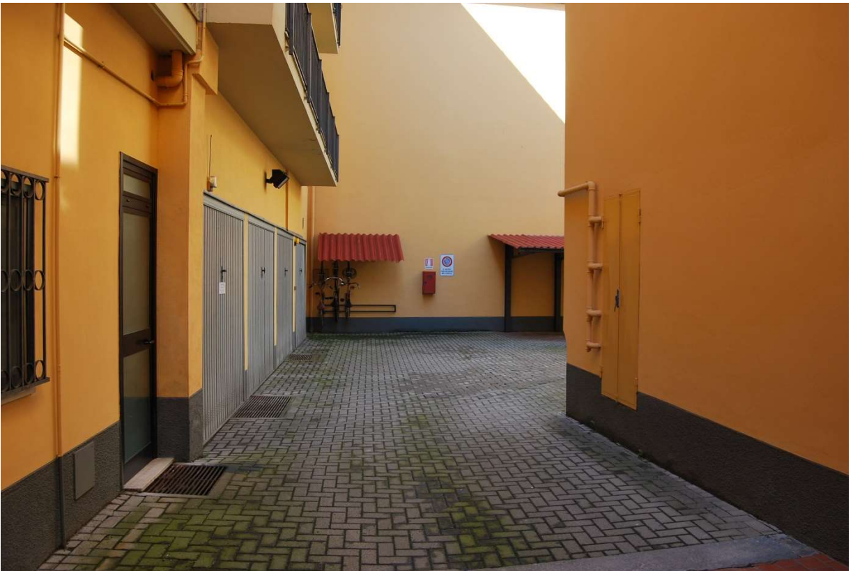
Facciate esterne su cortile interno via Pontida n 46 (AL) foto 7-8)