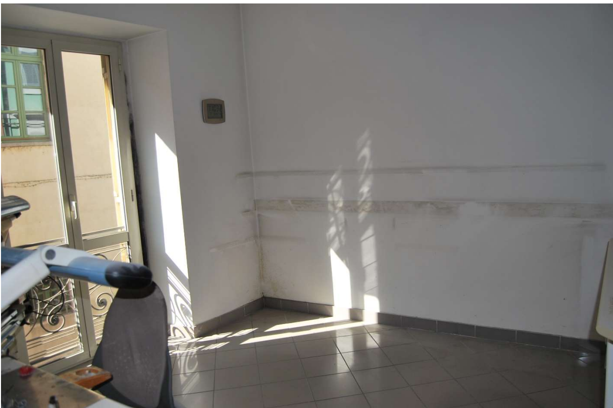
Locali laboratorio foto 11-12)