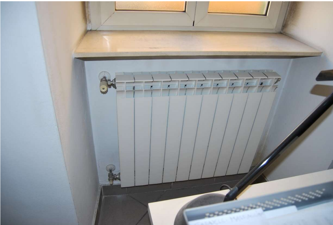
Caldaia-corpi scaldanti foto 19-20)