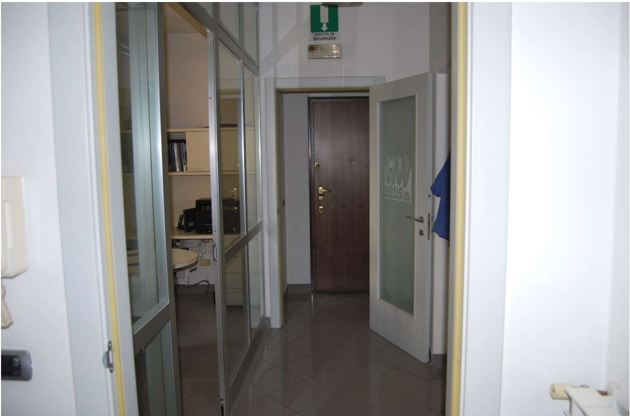
Ufficio e ingresso foto 13-14)