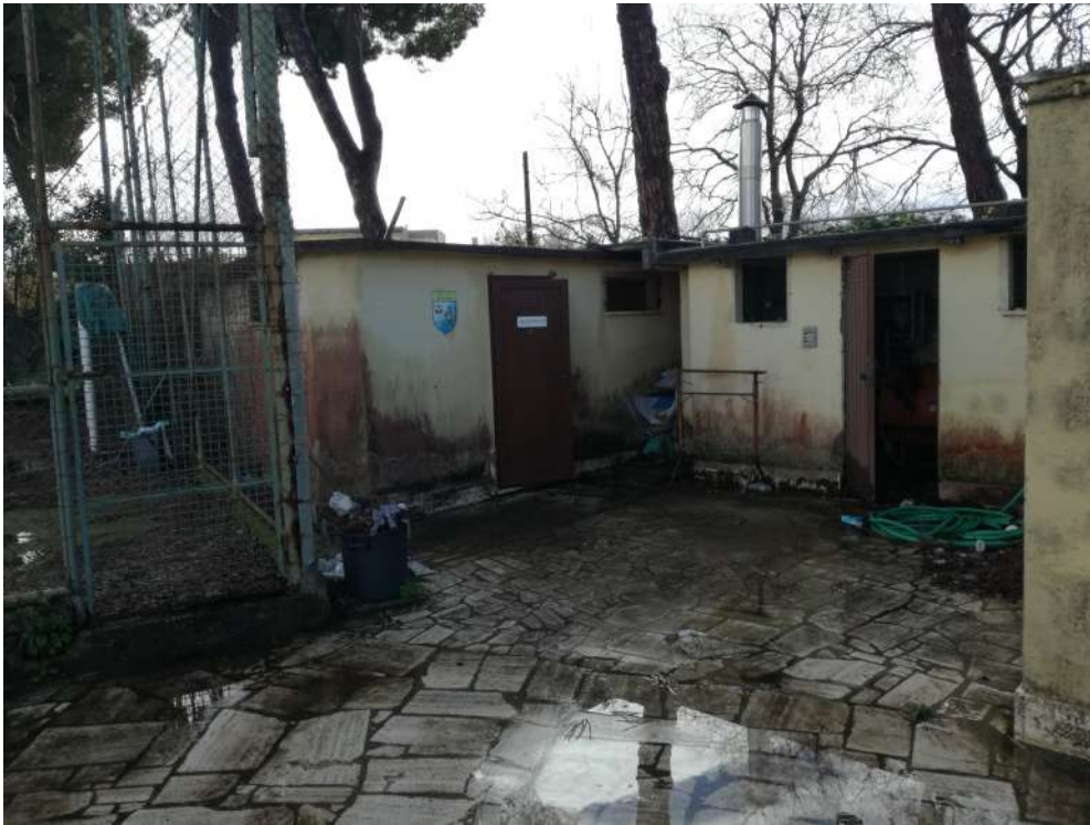
Foto20 (locali tecnici abusivi da demolire)