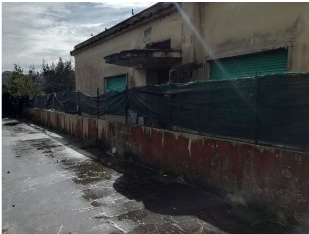
Foto10 (vista esterna ingresso)