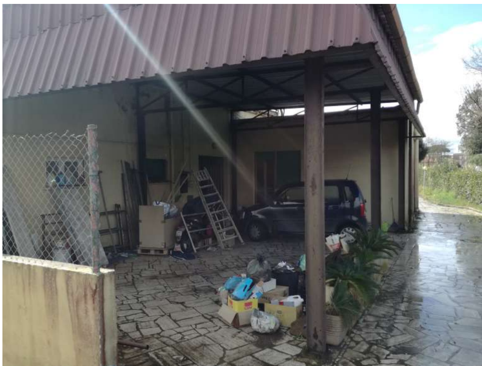
Foto11 (Tettoia da rimuovere)