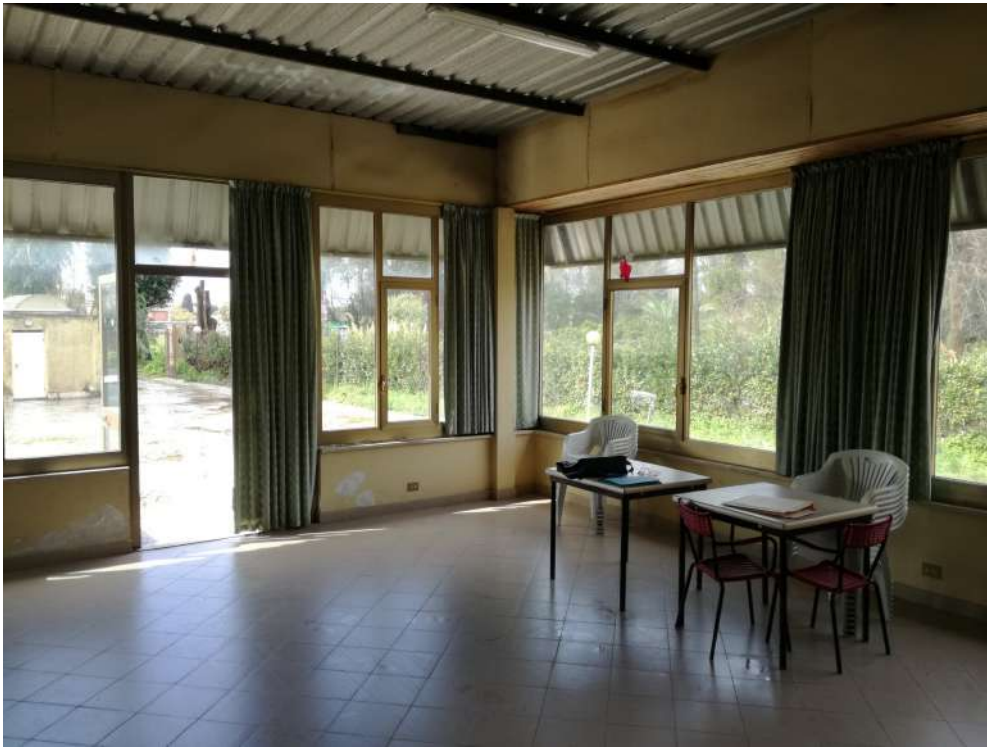
Foto12 (Veranda autorizzazione provvisoria)