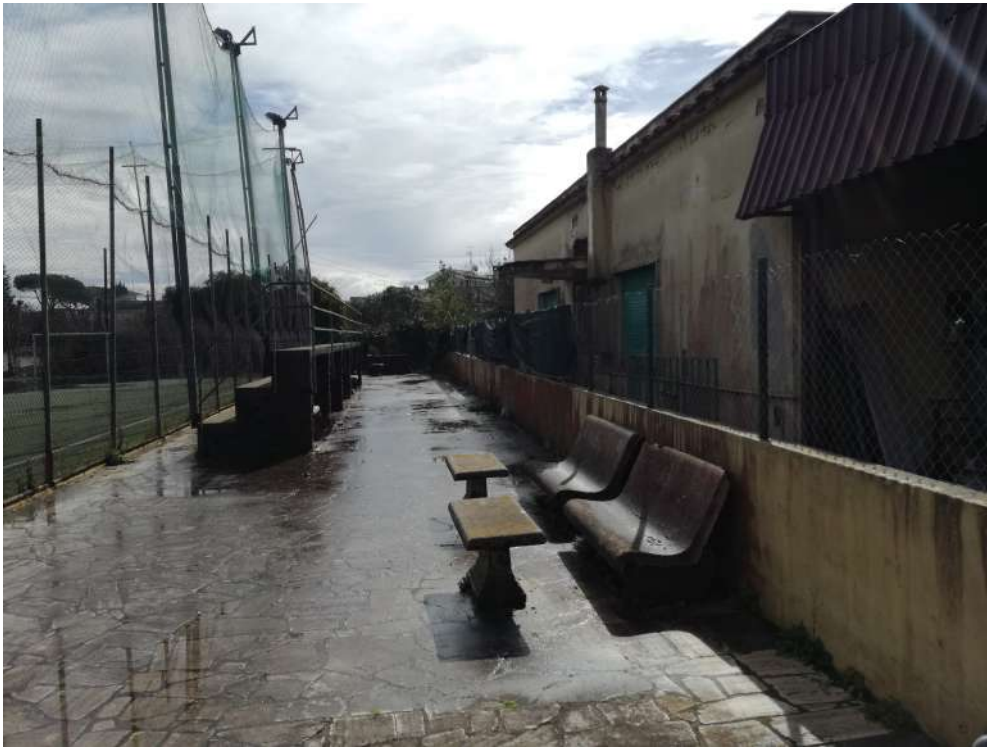
Foto16 (campo di calcetto 1 e fabbricato )