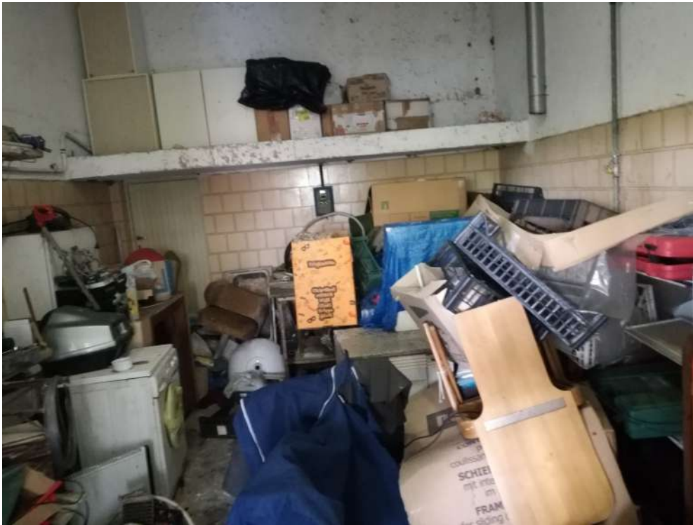
Foto14 (stanza 4 cantina)