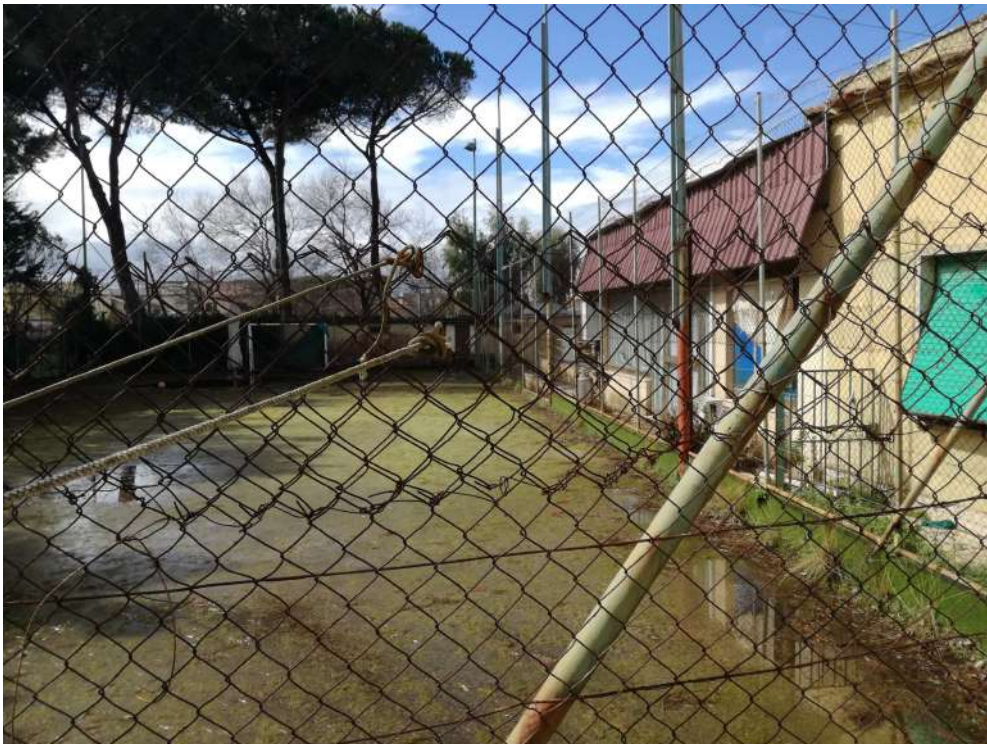
Foto17 (campo di calcetto 2 e fabbricato)