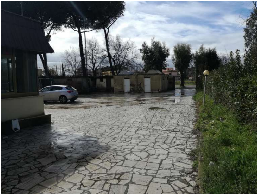
Foto19 (ingresso e piazzale proprietà)