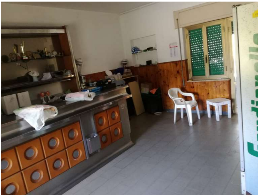
Foto13 (locale cantina sanato)