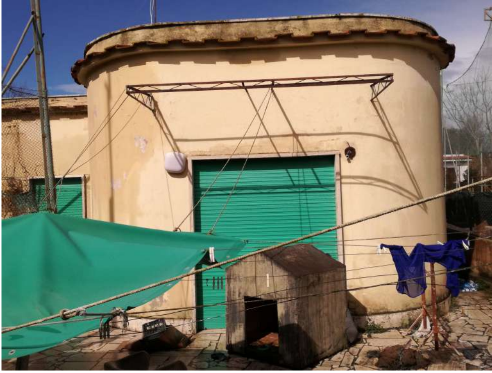
Foto18 (vista esterna villino)