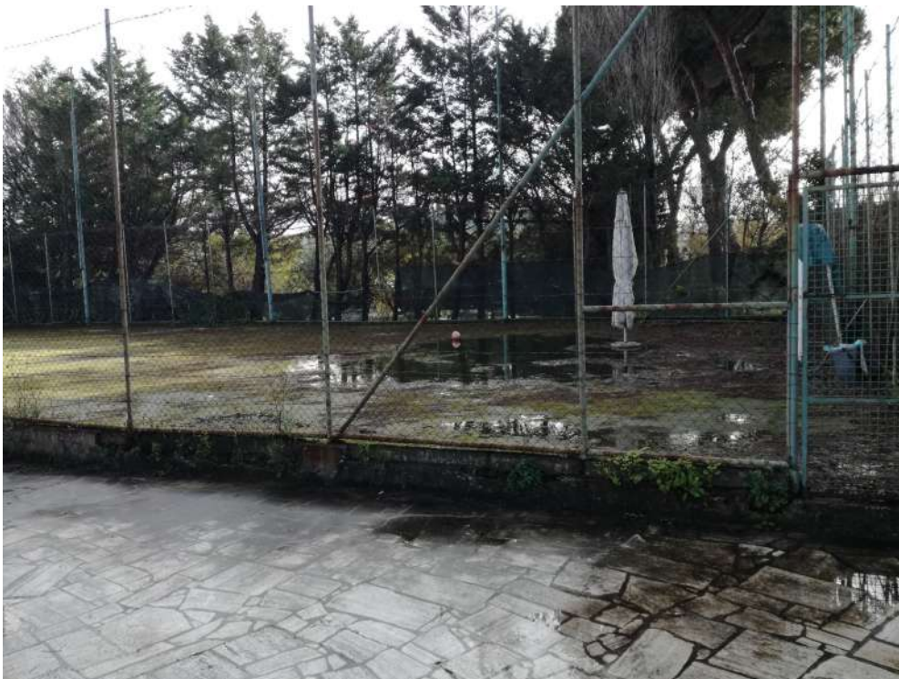
Foto21 (vista campo di calcetto 2)