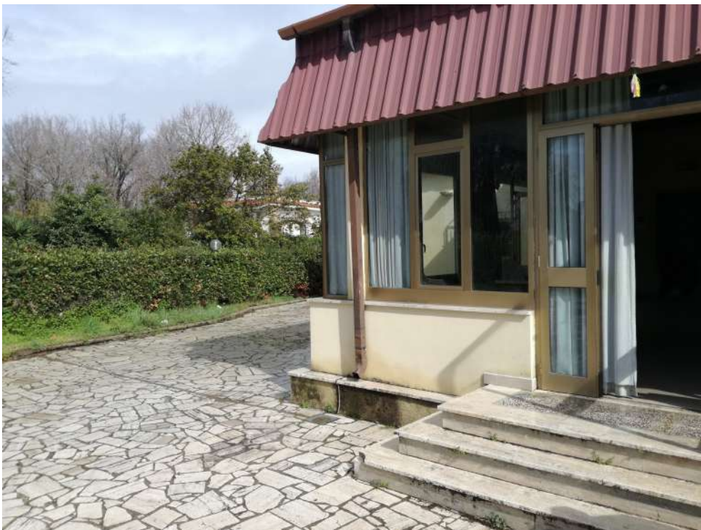
Foto15 (ingresso veranda)