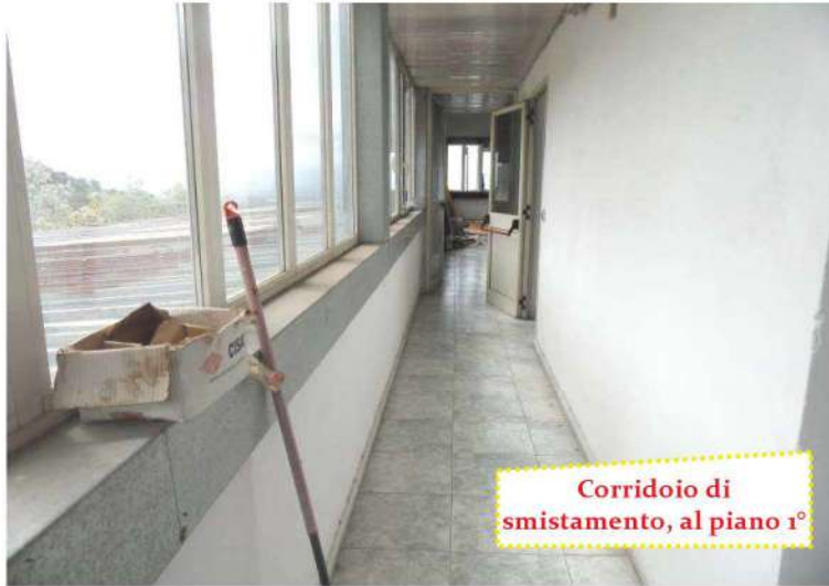
Corridoio di smistamento, al piano 1°

Il deposito di materiale ferroso, che occupa la porzione Nord-