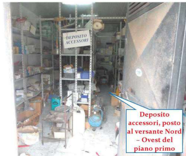
Deposito accessori, posto al versante Nord - Ovest del piano primo

L'accesso al locale è consentito da una serranda avvolgibile metallica di grande dimensione