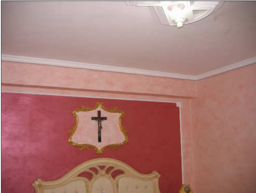
Foto n° 41 – Foto scattata alle pareti della camera da letto al fine di evidenziare l'ottimo stato di rifinitura (spatolato).