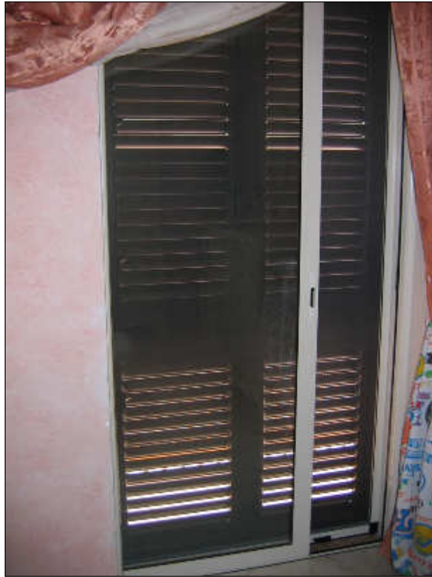
Foto n° 43 – Porta balcone del tipo scorrevole che consente l'accesso al ballatoio esterno. L'infisso è a taglio termico.