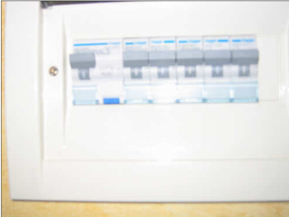
Foto n° 23 – Vista del quadro elettrico posto all'interno dell'appartamento del secondo piano. L'impianto elettrico risulta di recente fattura ed a norma con le vigenti leggi in materia di impianti, essendo dotato di differenziale magnetotermico (salvavita) e di interruttori generali per le prese e le luci.