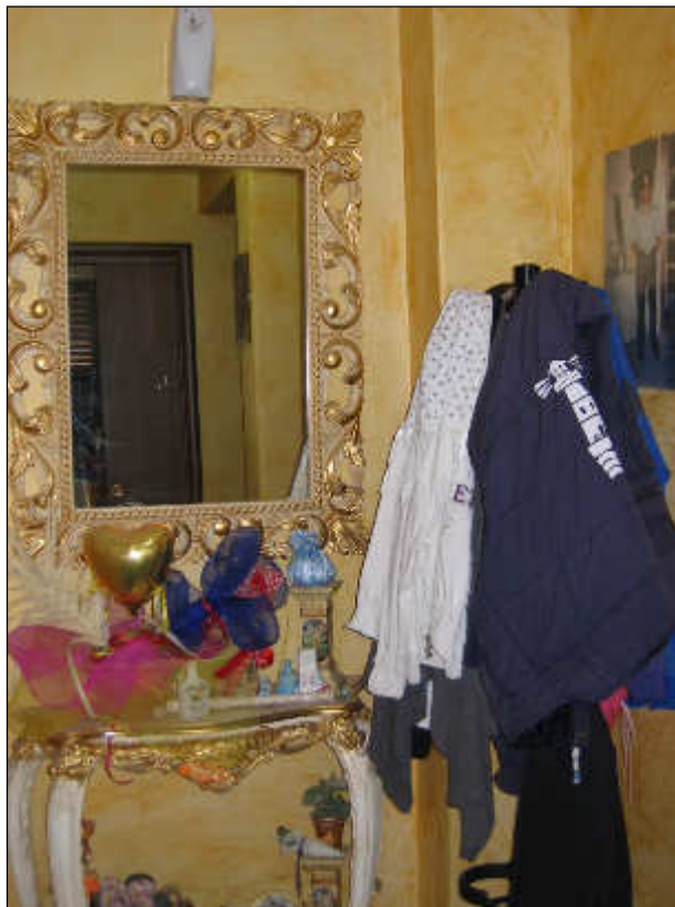
Foto n° 26 – Foto scattata nel corridoio. Ottimo lo stato di finitura delle pareti, essendo tinteggiate e rifinite con lo spatolato.