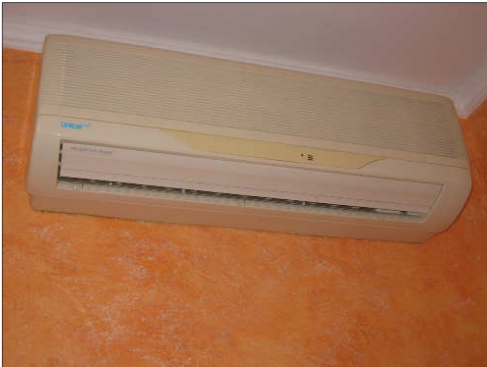
Foto n° 30 – Foto scattata all'unità interna della pompa di calore a servizio dell'appartamento.