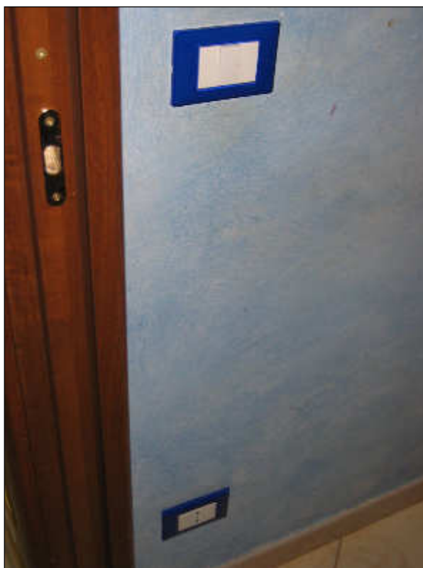
Foto n° 45 – Foto scattata alla parete ed agli interruttori dell’impianto elettrico della cameretta. La stessa risulta ben rifinita.