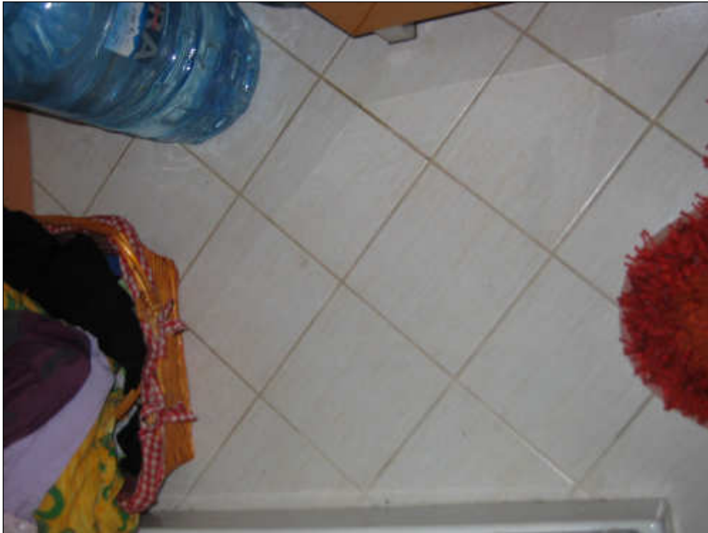
Foto n° 37 – Foto scattata al pavimento in maiolica posto nel bagno.