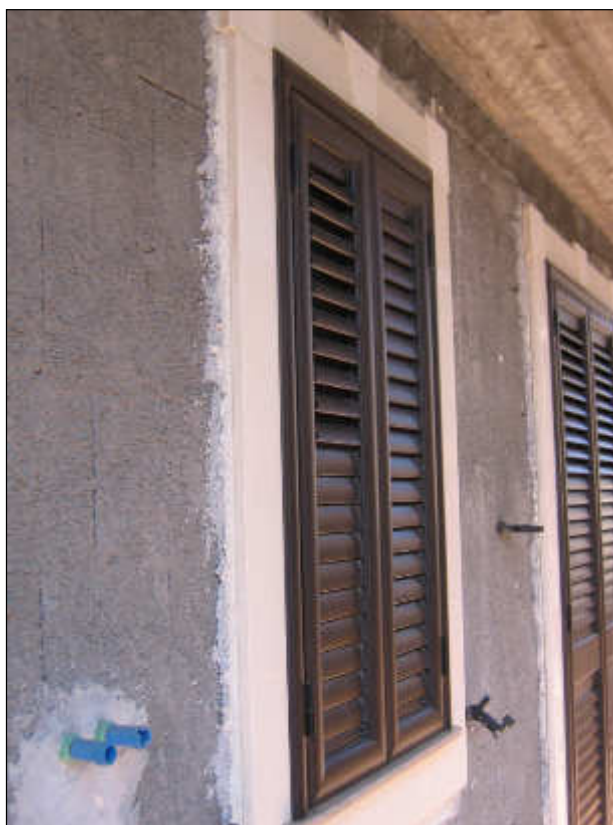
Foto n° 33 – Vista delle pareti e degli infissi alla veneziana. Le pareti sono intonacate ma prive dello strato di finitura.