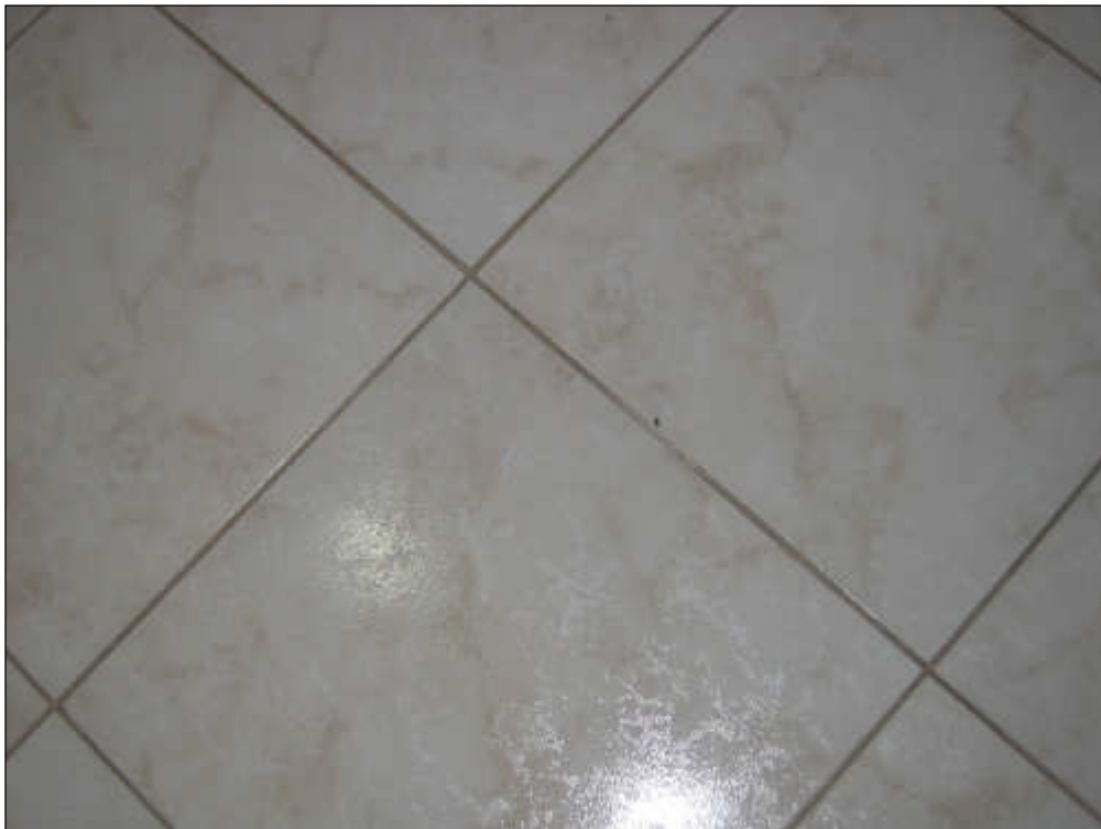
Foto n° 28 – Foto scattata al pavimento in gres porcellanato in buono stato.