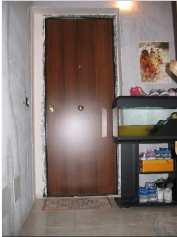
Foto n° 21 – Vista della porta di accesso all'appartamento del secondo piano.