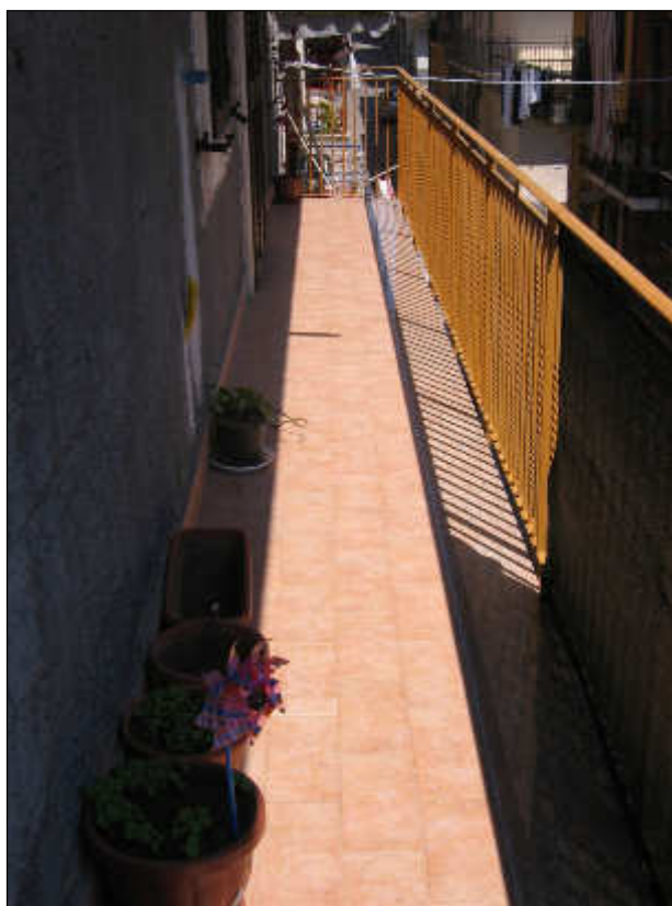
Foto n° 34 – Vista del ballatoio esterno prospiciente la via Dabormida. Lo stesso risulta pavimentato con monocottura e ben rifinito.