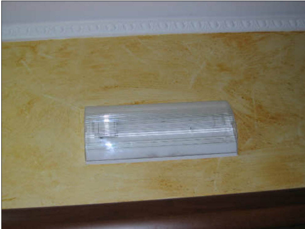
Foto n° 25 – Foto scattata alla luce di emergenza posta nel corridoio.