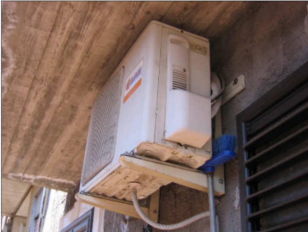
Foto n° 31 – Foto scattata all'unità esterna della pompe di calore a servizio dell'appartamento.