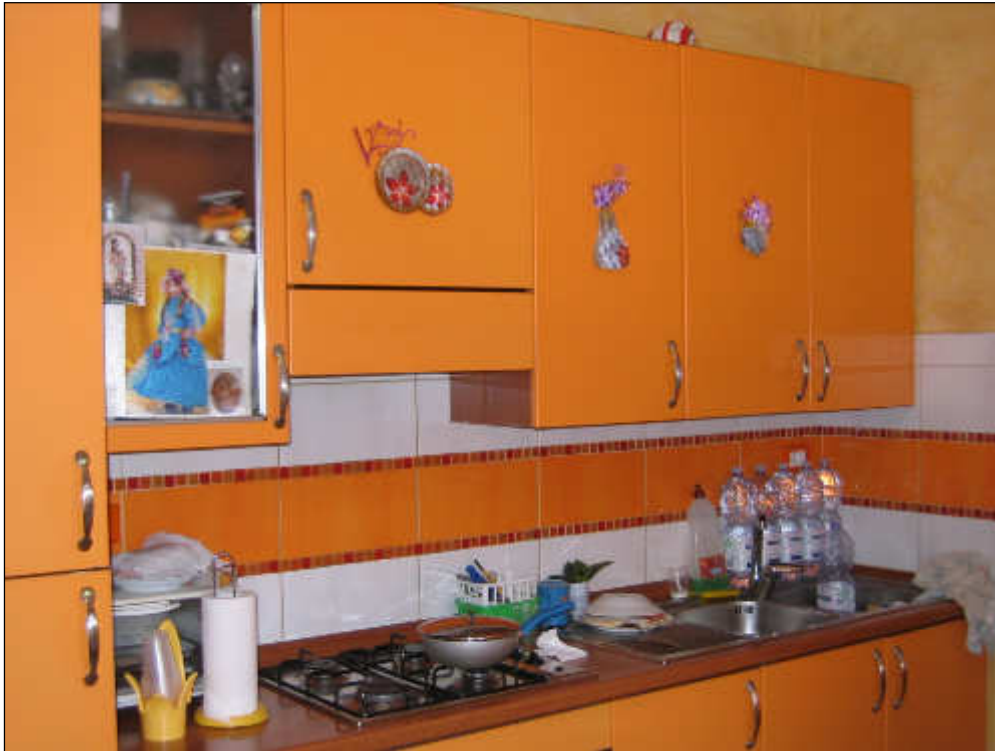
Foto n° 29 – Vista delle pareti della cucina. Le stesse sono tutte rivestite con una fascia in piastrelle in maiolica nella zona interessata dai componenti mentre nella restante parte sono rifinite con tinteggiatura e spatolato.