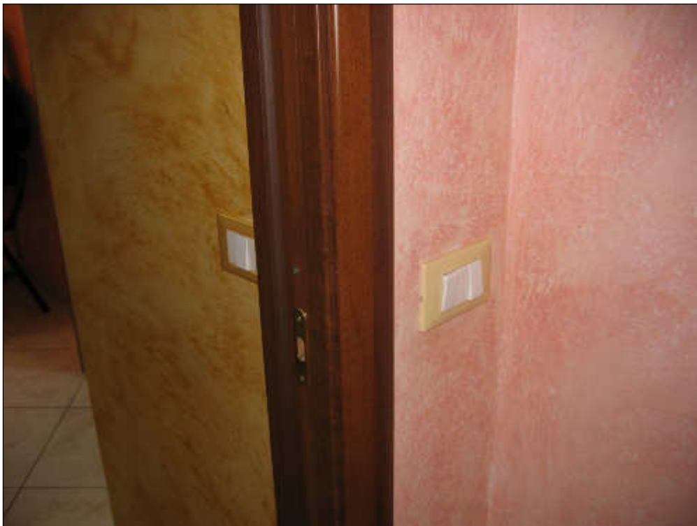
Foto n° 44 – Foto scattata agli interruttori dell'impianto elettrico. Lo stesso risulta a norma con le attuali leggi ed è di recente fattura.