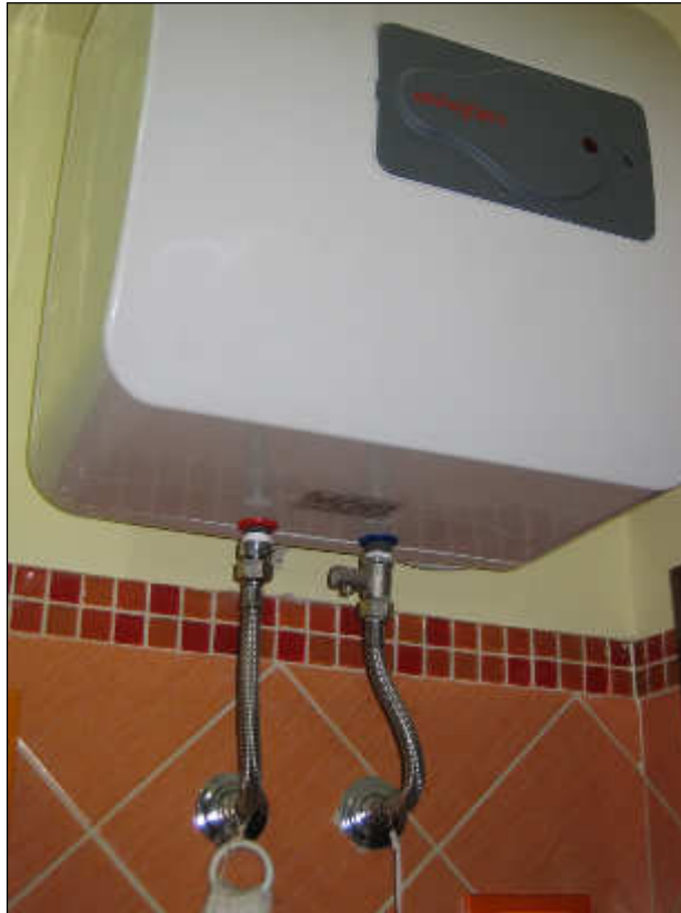
Foto n° 39 – Foto scattata allo scaldacqua da 30 litri posto a servizio del bagno.