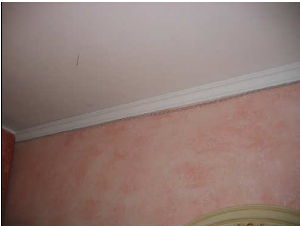
Foto n° 42 – Altra foto scattata ad una delle pareti della camera da letto al fine di evidenziare l'ottimo stato di rifinitura (spatolato).