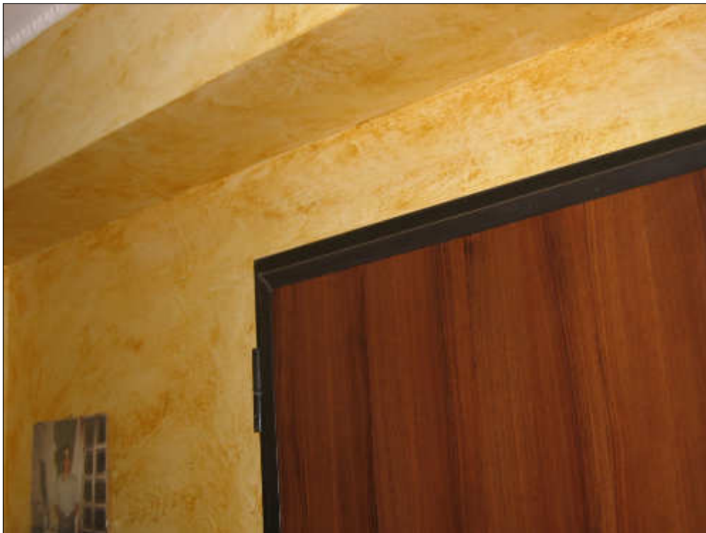
Foto n° 22 – Foto scattata all'interno dell'appartamento. Ottimo lo stato di finitura delle pareti.