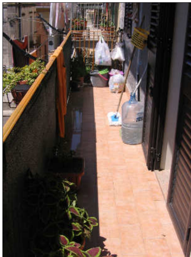
Foto n° 32 – Vista del ballatoio esterno prospiciente la via Toselli. Lo stesso risulta pavimentato con monocottura e ben rifinito.