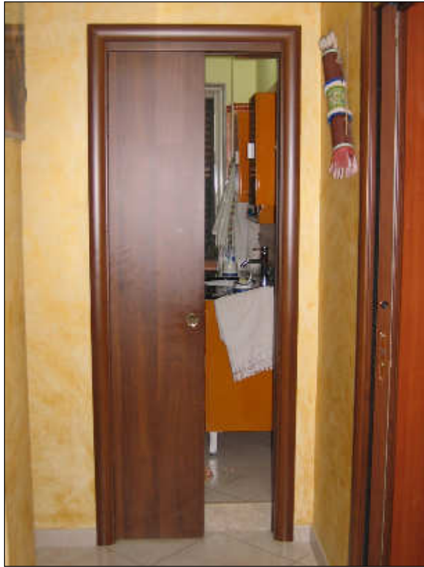
Foto n° 27 – Scala di accesso ai piani superiori tutta rivestita in marmo.