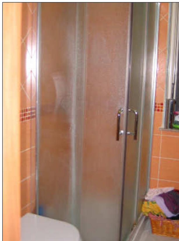
Foto n° 38 – Foto scattata al piatto doccia ed al box. Ottimo lo stato di finitura.