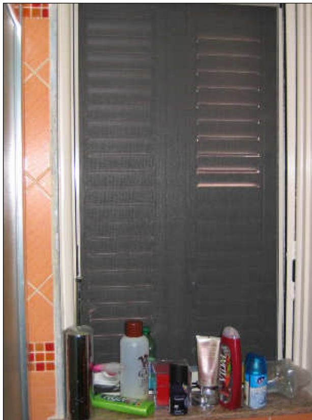
Foto n° 40 – Foto scattata all'infisso interno a taglio termico ed a quello esterno del tipo con apertura alla veneziana