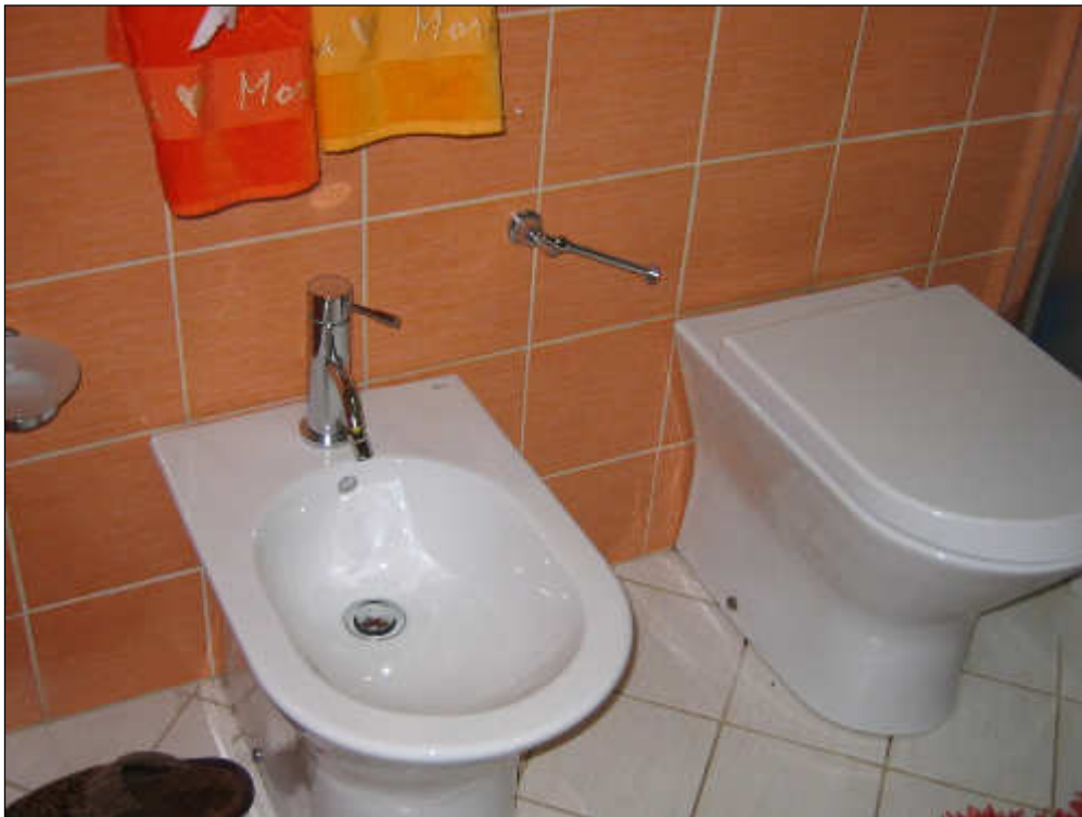
Foto n° 36 – Foto scattata all'interno del bagno. Tutte le pareti sono rivestite con piastrelle in maiolica. Sono presenti sia i pezzi sanitari che le rubinetterie di ottima fattura.