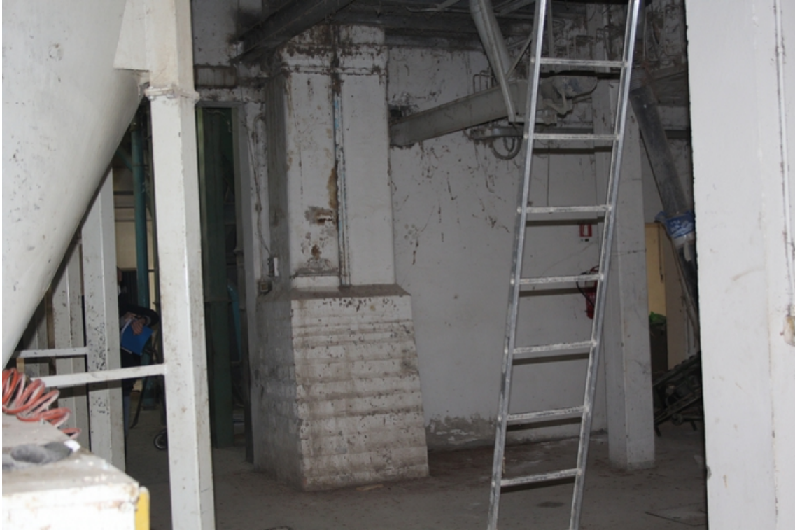
capannone/mangimificio piano seminterrato