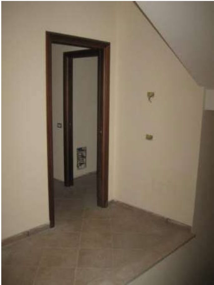
disimpegno di piano