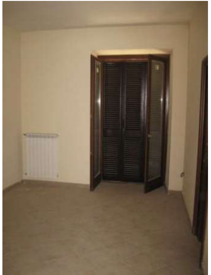
camera n. 1