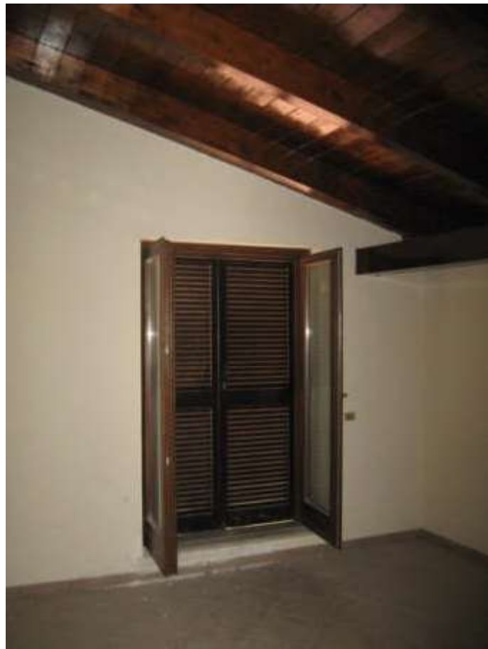
camera n. 2