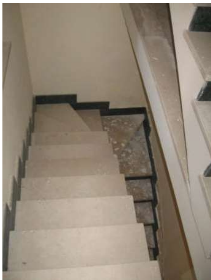
scala di accesso ai piani primo e secondo