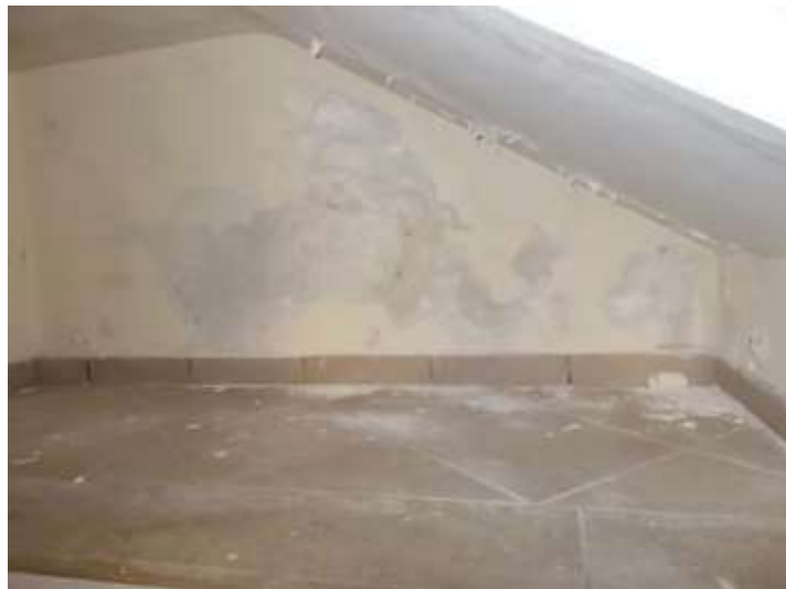
ripostigli invasi da infiltrazioni provenienti dal muro di contenimento ed ascendente