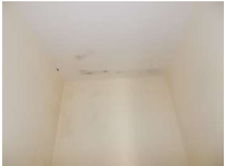
ambiente al primo piano compromesso dalle infiltrazioni provenienti dalla strada