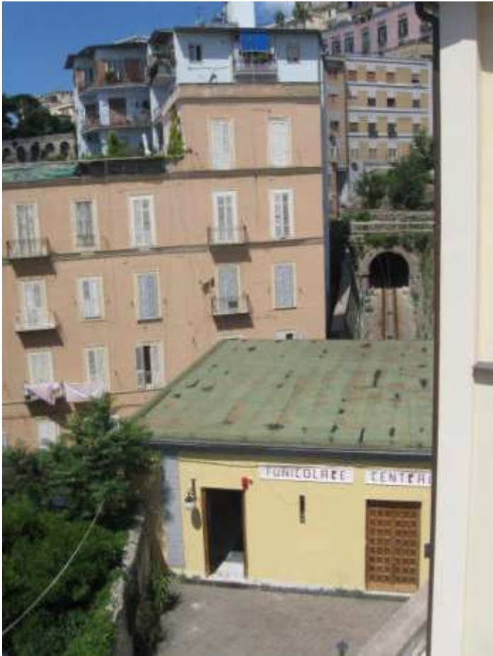
circondario visto dal terrazzo