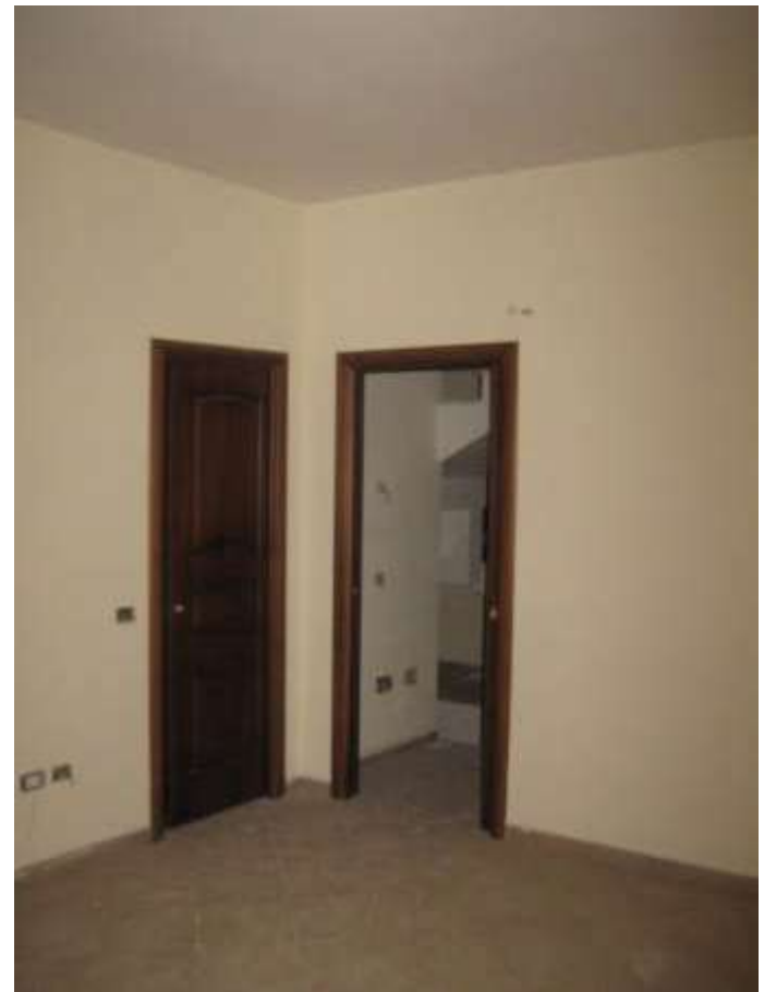
camera n. 1