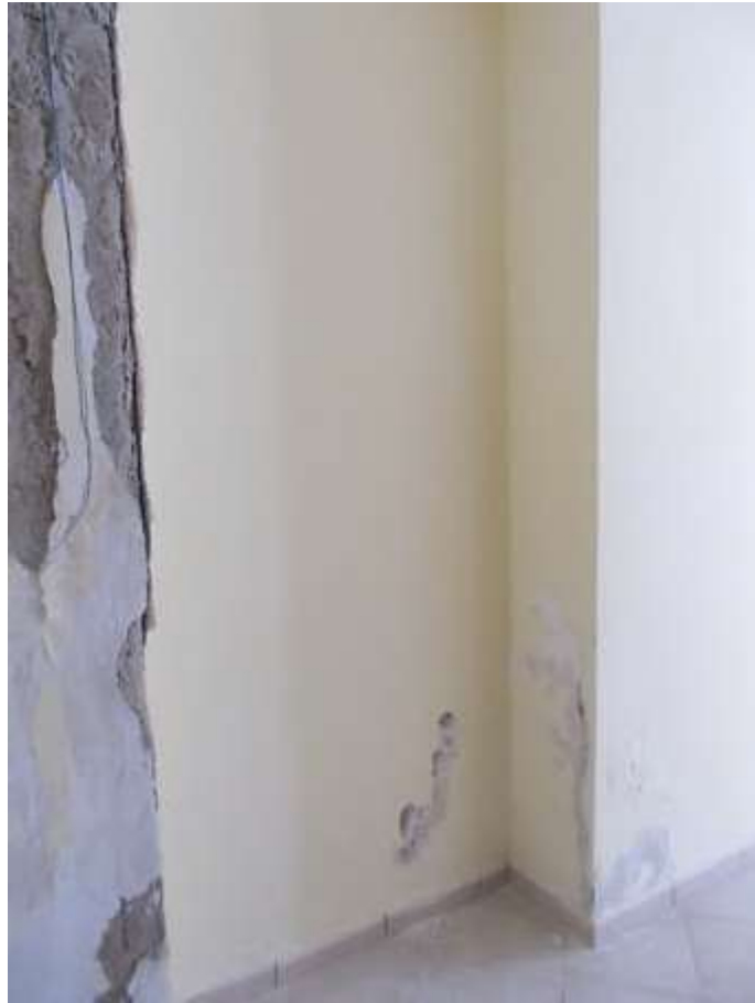
umidità ascendente ed infiltrazioni nel disimpegno al piano terra provenienti dal muro di contenimento della strada