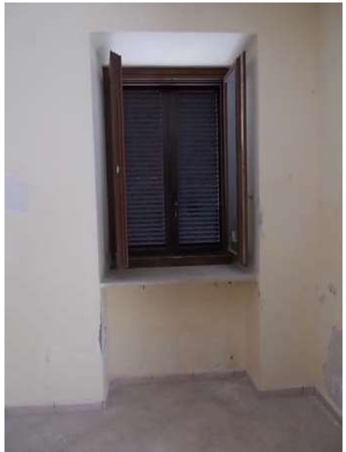
ambiente soggiorno-pranzo umidità ascendente in prossimità della zona ingresso