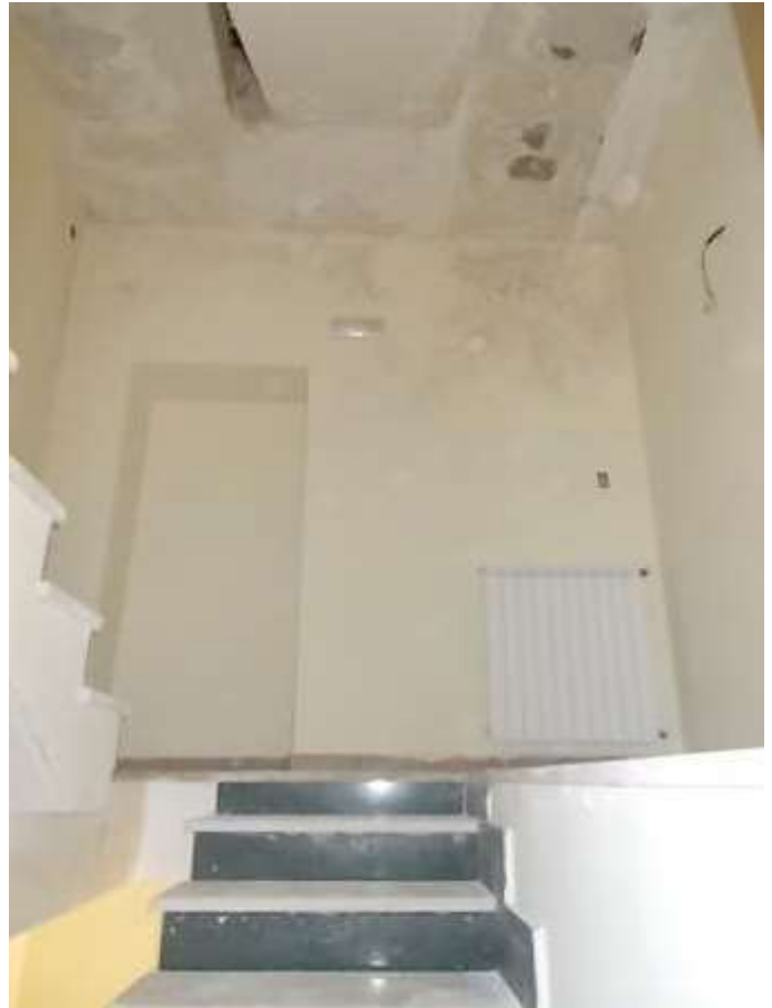
arrivo al primo piano completamente invaso dalle infiltrazioni