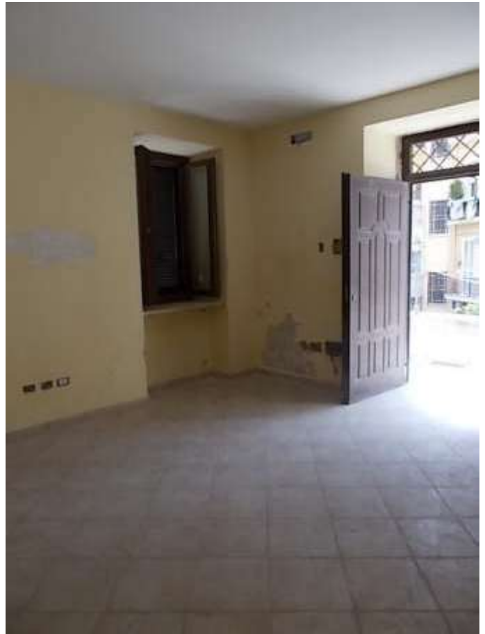
viste esterna ed interna dell'alloggio zona ingresso, si rilevano diffuse chiazze di umidità ascendente