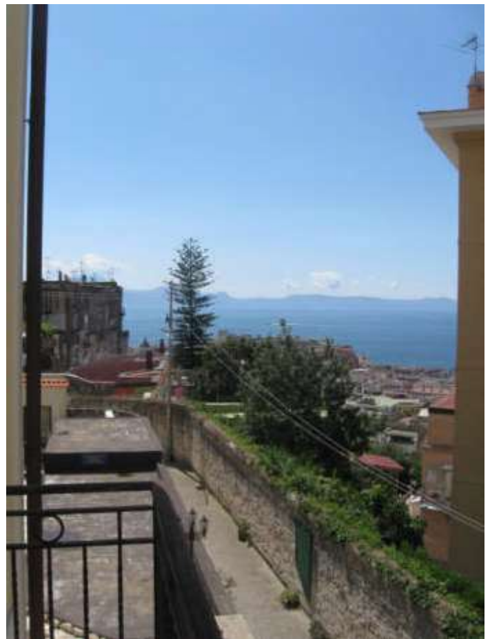
circondario visto dal balcone