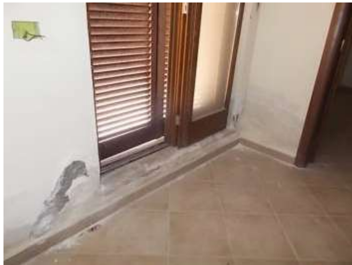
ambienti ultimo piano compromessi dalle infiltrazioni provenienti dai terrazzi e dal muro di contenimento della strada