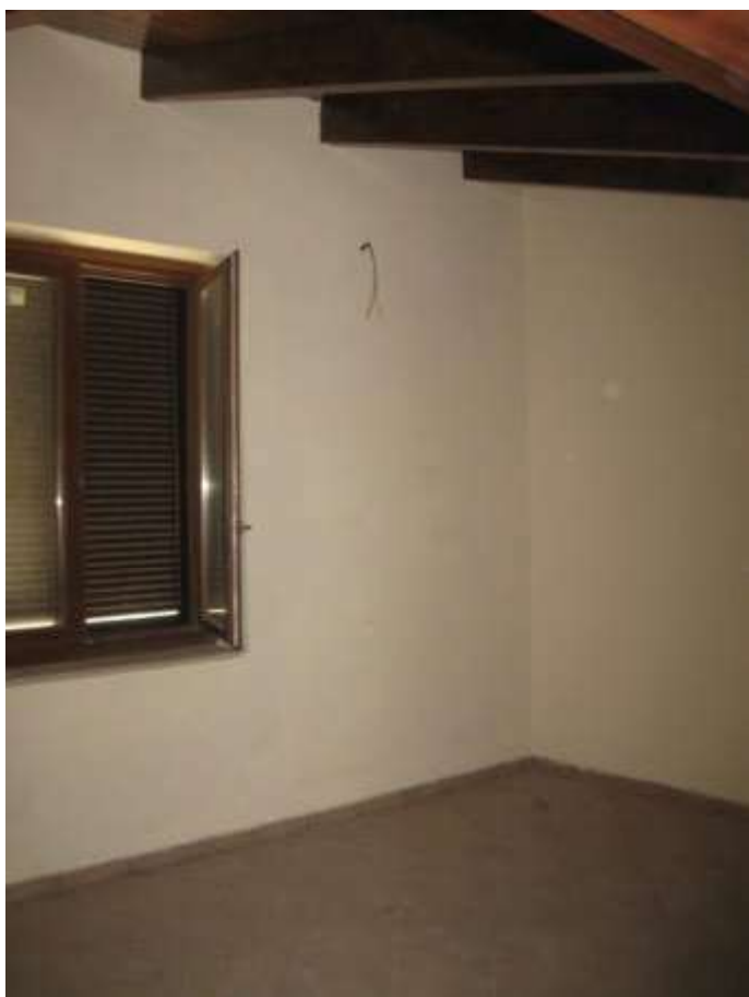
camera n. 2