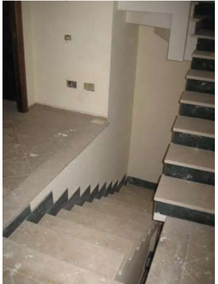
scala di accesso ai piani primo e secondo