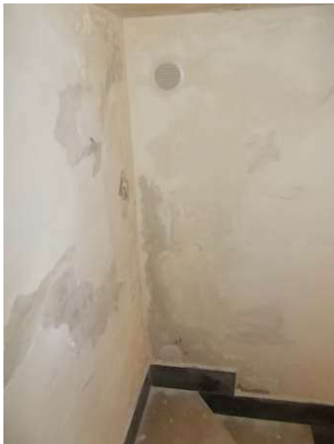
scala resa insalubre dalla diffusa presenza di infiltrazioni provenienti dal muro di contenimento della strada