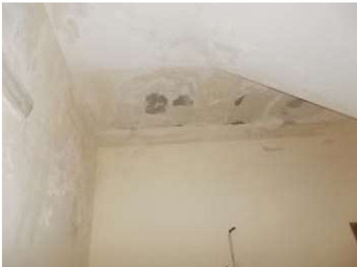
primo piano zona scala compromessa nelle finiture e nelle strutture dalle infiltrazioni