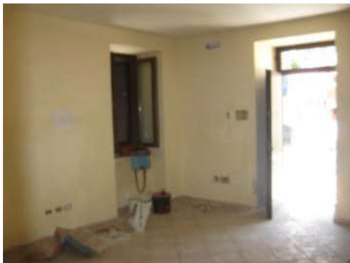
soggiorno - pranzo