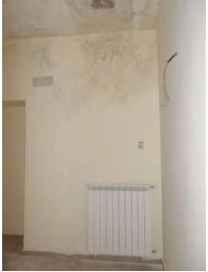
disimpegno d'ingresso al primo piano invaso dalle infiltrazioni