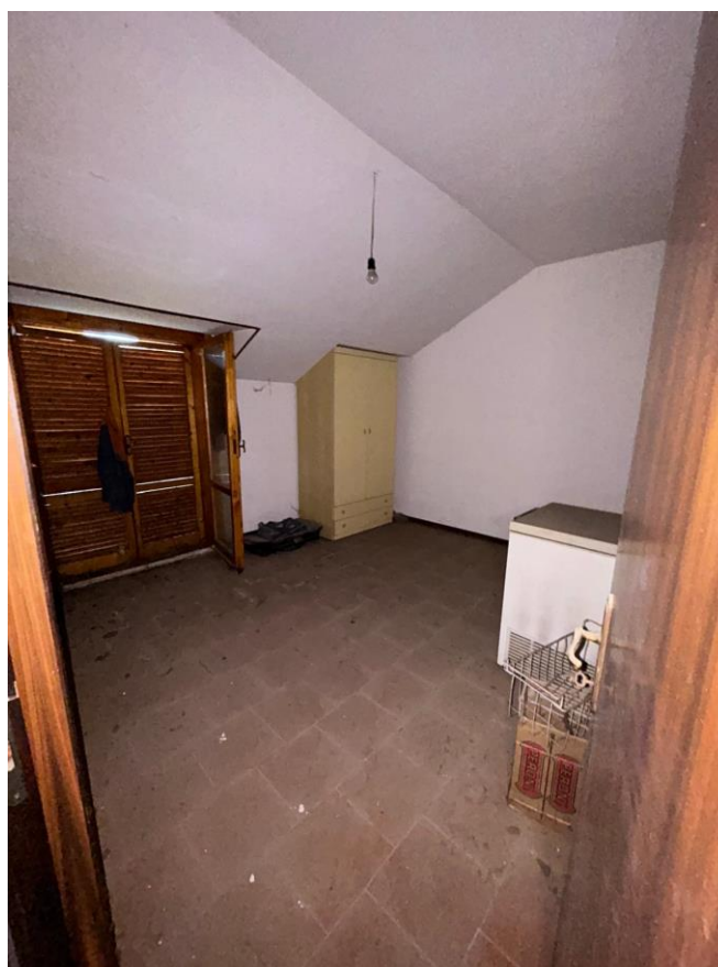
Foto 10 - Camera