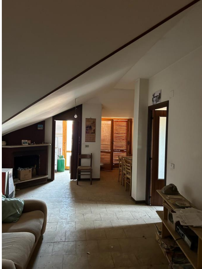
Foto 05 - Soggiorno