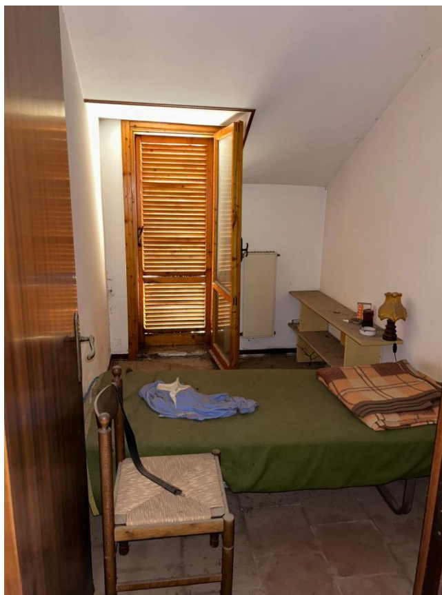
Foto 12 - Ripostiglio