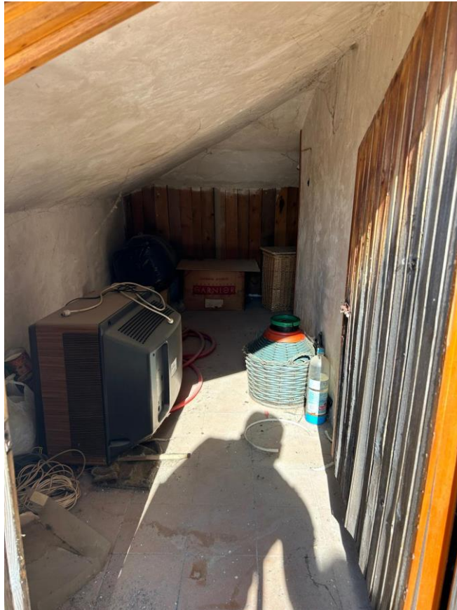
Foto 08 - Ripostiglio sottofalda