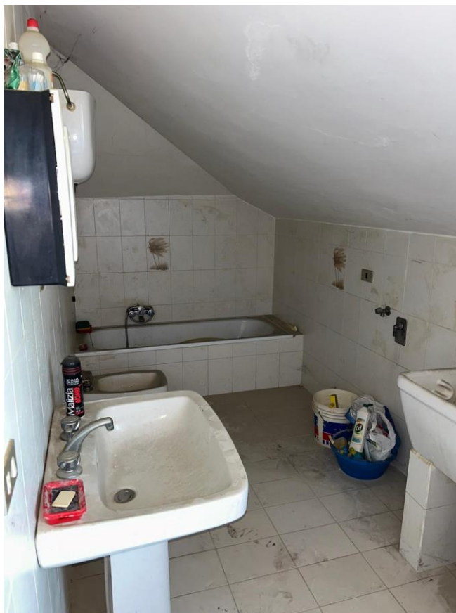
Foto 11 - Bagno