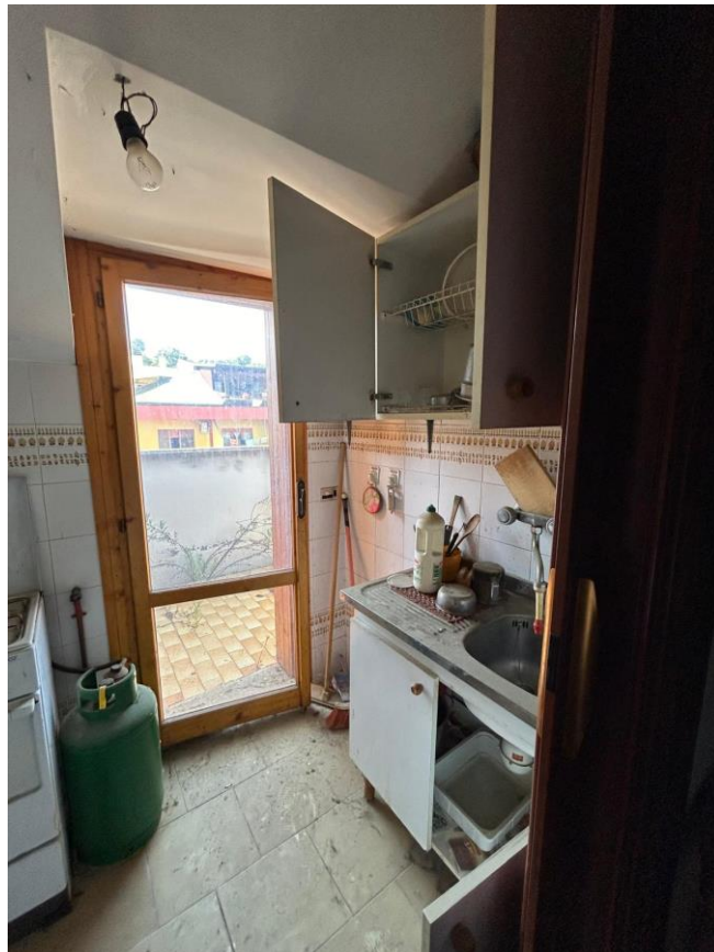
Foto 06 - Cucina