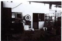
Blocco uffici del capannone