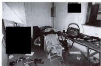
Letto singolo in uno dei due uffici interni al capannone