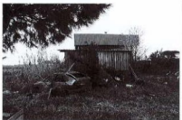
Tettoia esterna vista dal lato nord