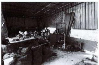
Materiali in deposito sotto la tettoia esterna