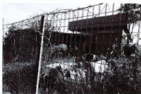
Capannone e tettoia annessa