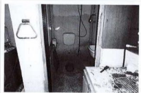
Bagno interno al capannone