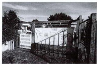
Ingresso alla proprietà