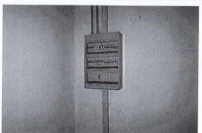
Quadro elettrico interno al capannone