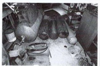
Varie bombole in deposito all'interno del capannone