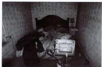
Letto matrimoniale in uno dei due uffici interni al capannone