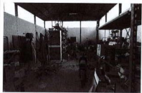
Materiale in deposito all'interno del capannone