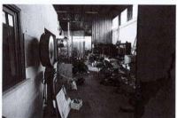
Capannone visto dalla porta di ingresso