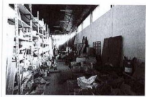
Materiale in deposito all'interno del capannone