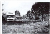
Automezzi nella corte antistante il capannone